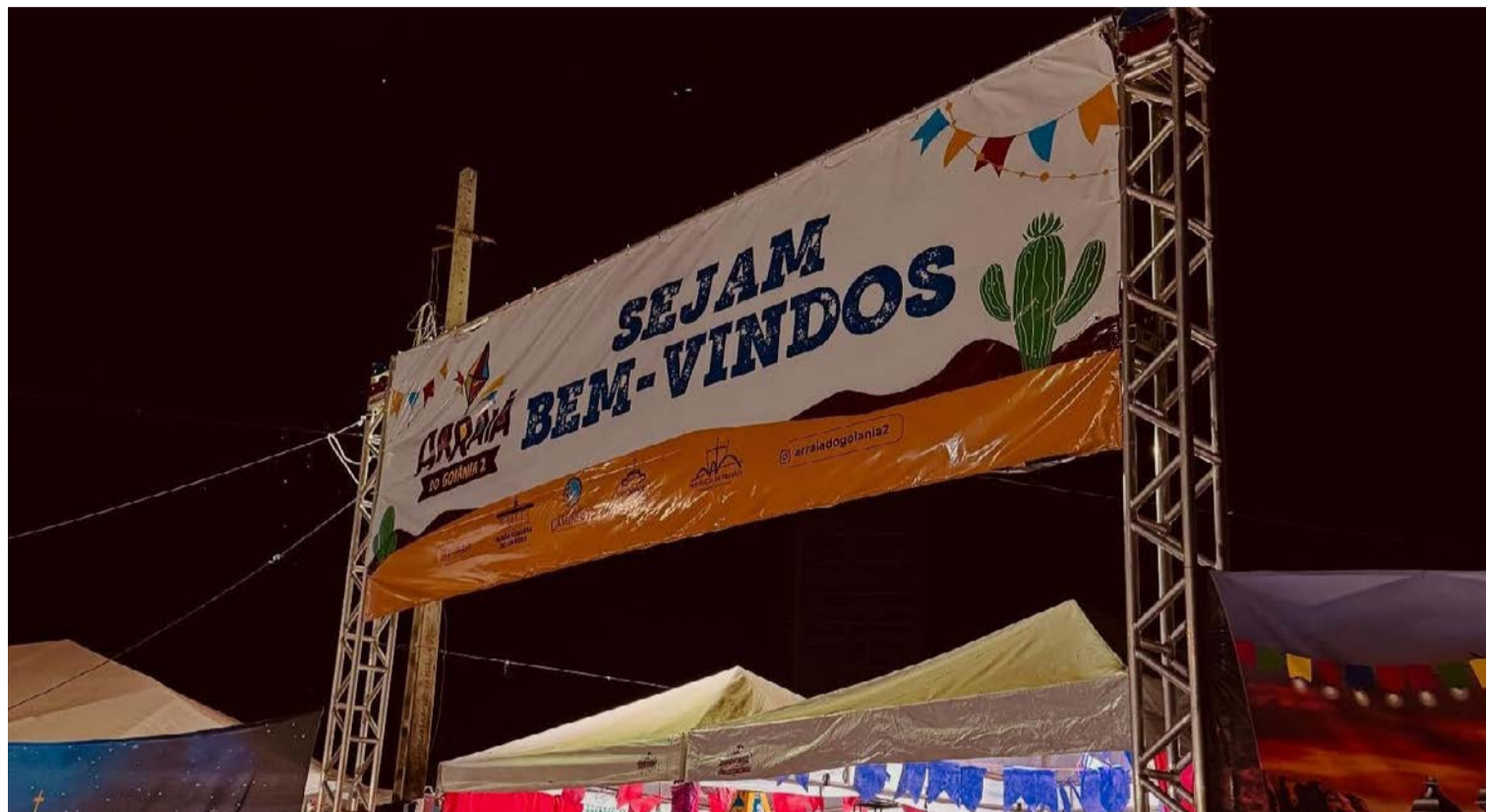
Comemorando São João: culinária é atrativo de festança que vai animar população goianiense durante este mês