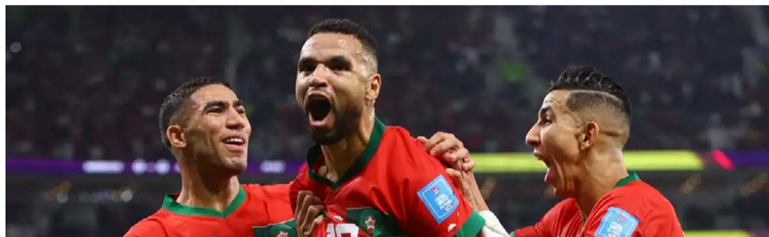
Seleção marroquina foi primeira do continente africano a chegar a uma semifinal de Mundiais