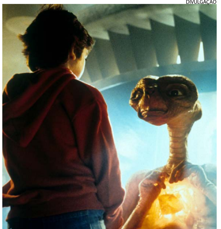
Cena do longa-metragem "E.T. O Extraterrestre", lançado em 1982: clássico

Não esquecer, por fim, que este belo filme rouba seu título, na tradução brasileira, do dia decisivo da Segunda Guerra. Se Spielberg retorna ao fantástico — abdicando da necessidade do megassucesso prévio em favor daquilo que realmente o atormenta e atemoriza —, o seu "Dia D" é também aquele em que se decide o que o homem pretende de si mesmo e, afinal, o destino da espécie, agora e daqui a pouco. (Folhapress)