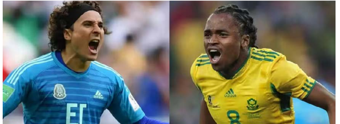
16 anos depois, as equipes voltam a se enfrentar novamente em um jogo de abertura do Mundial

O confronto entre México e África do Sul também resgata uma lembrança marcante do futebol mundial. As seleções repetem o jogo de abertura da Copa de 2010, disputada na África do Sul. Na ocasião, o