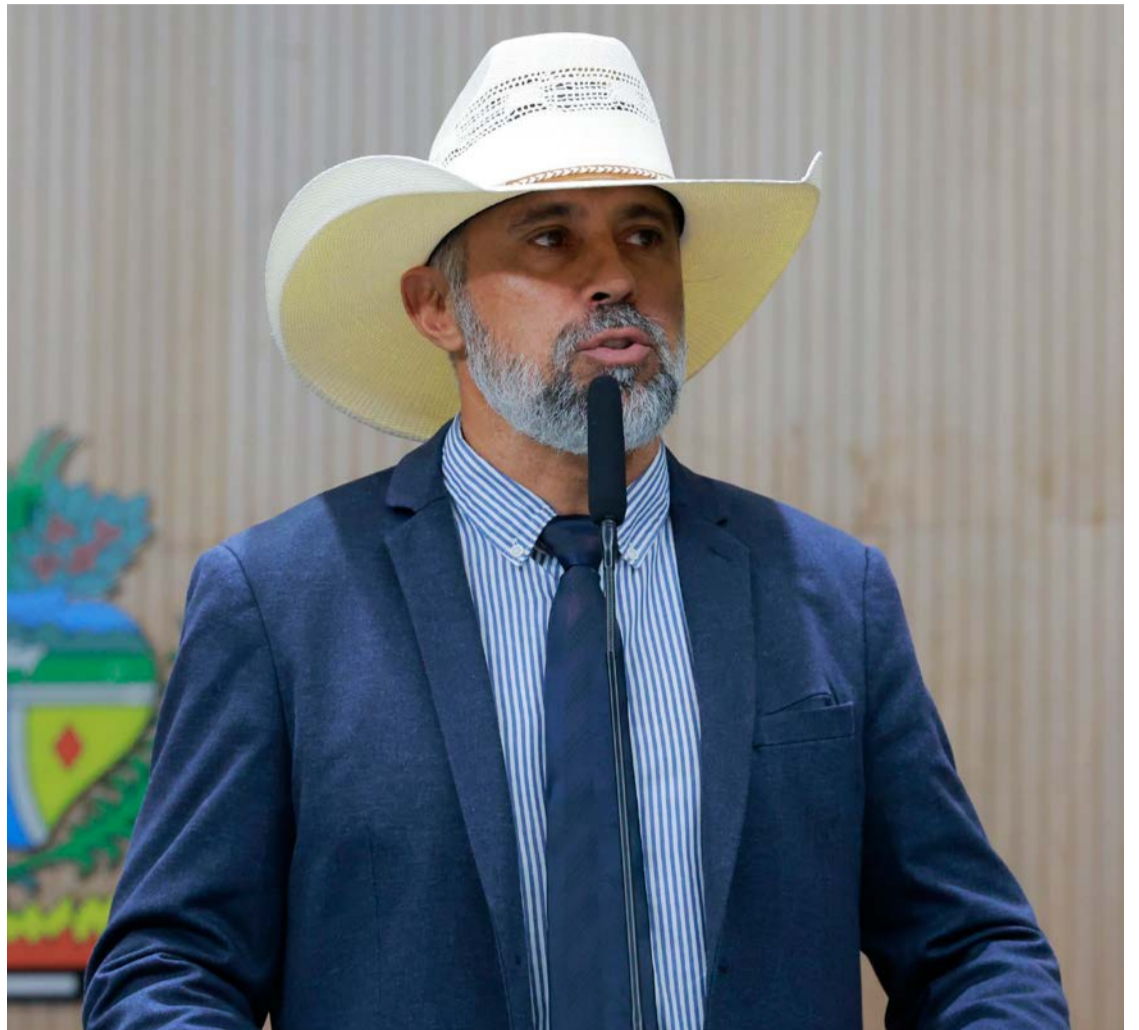
Amauri Ribeiro foi penalizado por agressões contra a deputada Bia de Lima

Com base nessas conclusões, foi aprovada a aplicação da penalidade de suspensão de determinadas prerrogativas regimentais por um mês. Durante esse período, Amauri Ribeiro ficará impedido de exercer algumas atribuições internas da Casa, incluindo o uso da palavra em determinadas situações regimentais e a condução de comissões legislativas. A restrição, contudo, não afeta atividades essenciais do mandato, como a apresentação de projetos, requerimentos e demais