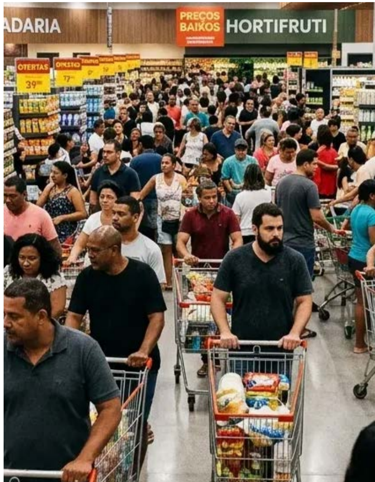
Supermercados permanecem autorizados a operar normalmente aos domingos até nova decisão sobre o caso

Segundo o entendimento da Justiça do Trabalho, a cláusula contestada poderia gerar tratamento desigual entre empresas do mesmo segmento. O texto estabelecia que supermercados vinculados ao Sindicato do Comércio Varejista de Gêneros Alimentícios no Estado de Goiás (Sinovaga-GO) e com contribuições sindicais regularizadas não precisariam firmar um novo acordo para ampliar o horário de funcionamento aos domingos.