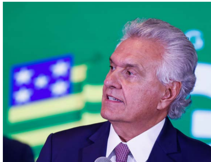
Caiado volta a cobrar esclarecimentos de Flávio sobre Banco Master

Ex-governador defende que cada um responda pelos questionamentos que surgirem na campanha