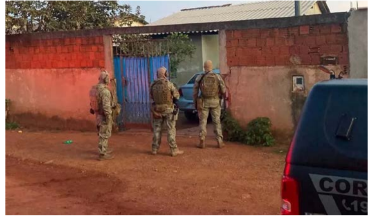
Principal alvo da operação é desarticular uma facção criminosa