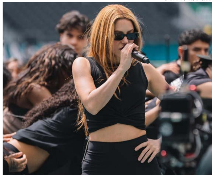
Cantora ensaiou ontem na capital mexicana