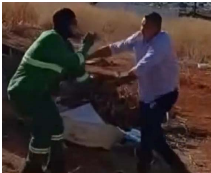
Equipe realizava a coleta de lixo no local quando houve a agressão

Um coletor da limpeza urbana registrou boletim de ocorrência após relatar ter sido agredido