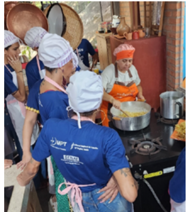
Além de direitos, grupo aprendeu culinária tradicional