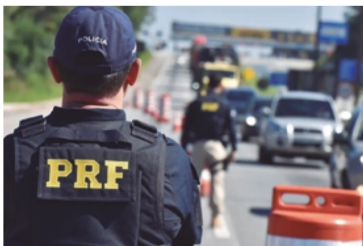
No período acontecem atividades educativas e de fiscalização de trânsito

Entre as ações perigosas no trânsito, a corporação lista a ultrapassagem indevida, condução sob efeito de álcool, não utilização do cinto de segurança, transporte inadequado de crianças, falta de uso do capacete, excesso de velocidade e utilização do telefone celular durante a