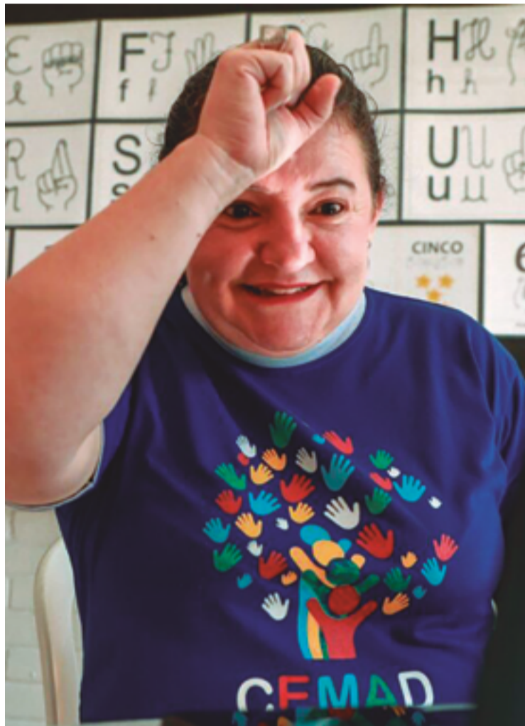
Objetivo é possibilitar àqueles que enfrentam obstáculos desproporcionais, oportunidades de desenvolvimento equivalente às ofertadas aos demais

O vereador afirma que seu projeto de lei cumpre o papel de criar mecanismos para efetivar a "tão almejada igualdade". "Possibilitando, àqueles que enfrentam dificuldades e obstáculos desproporcionais, oportunidades de desenvolvimento equivalente às ofertadas ao restante da população", completa.