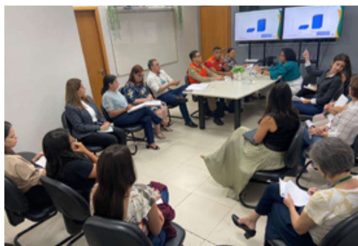
Reuniões da sala de situação ocorrem semanalmente na sede da Superintendência de Vigilância em Saúde

Em relação à assistência, a SES também vai orientar os municípios na organização de espaços estratégicos e alternativos para atendimento, estabelecendo um fluxo bem definido para regular os casos