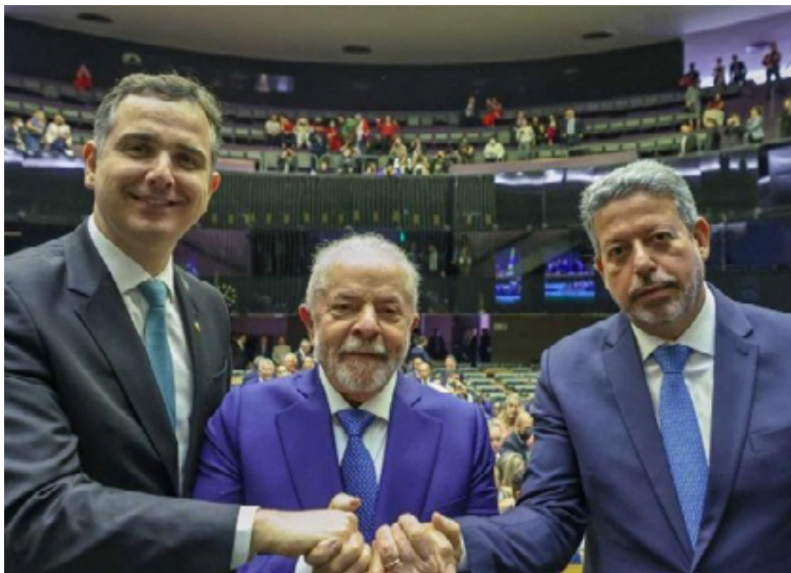
Rodrigo Pacheco, Lula da Silva e Arthur Lira: reforma tributária vai melhorar a economia, gerar empregos

Começamos o ano com a depredação das instituições, numa tentativa contra a democracia. Hoje, estamos mostrando ao País por que é importante a democracia. Porque este Congresso está hoje entregando ao País talvez uma das suas reformas mais estruturantes nos últimos anos, nas últimas