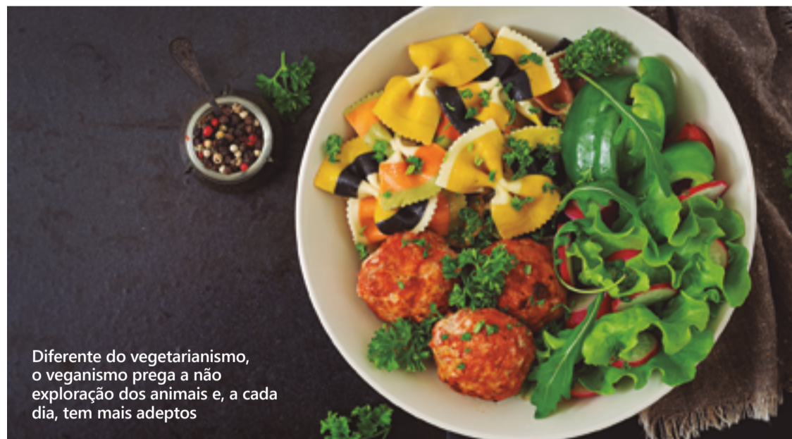
Diferente do vegetarianismo, o veganismo prega a não exploração dos animais e, a cada dia, tem mais adeptos