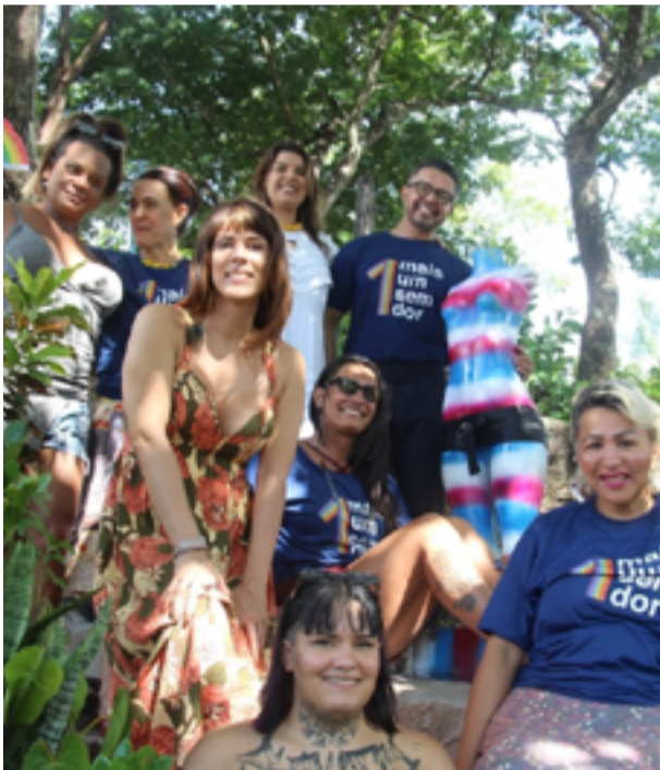
Curso focou na transformação social e mudança de vida