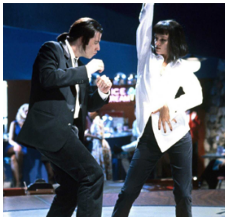
John Travolta e Uma Thurman em “Pulp Fiction”: cena clássica