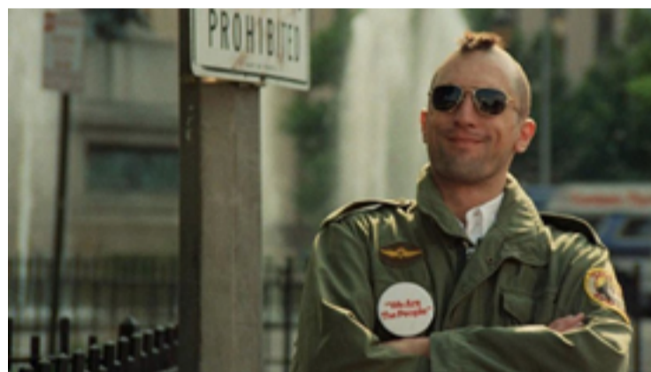
Robert de Niro em “Taxi Driver”, de Martin Scorsese: referência