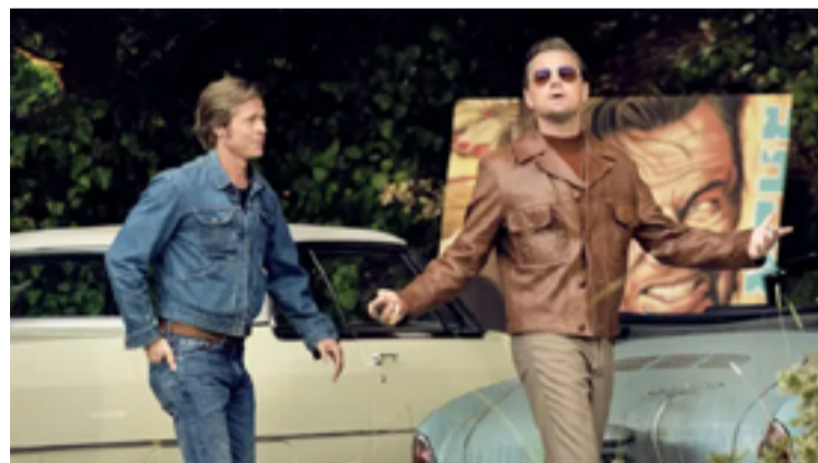
Brad Pitt e Leonardo DiCaprio em “Era uma Vez em Hollywood”