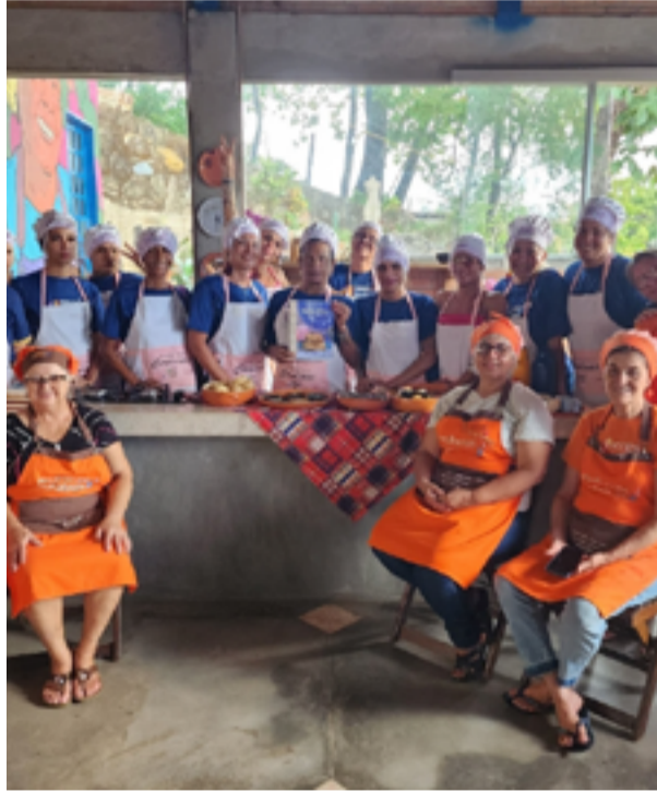
Qualificação realizou homenagens a pioneiras do passado