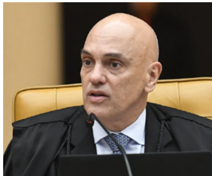
Alexandre de Moraes: beneficiados deixam presídio com uso de tornozeleira

Até agora, o supremo já condenou 30 executores dos atos golpistas do dia 8 de janeiro, que foram acusados pelos crimes mais graves.