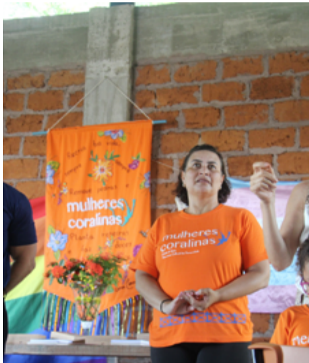
Reparações financeiras pagas por empresas custearam curso