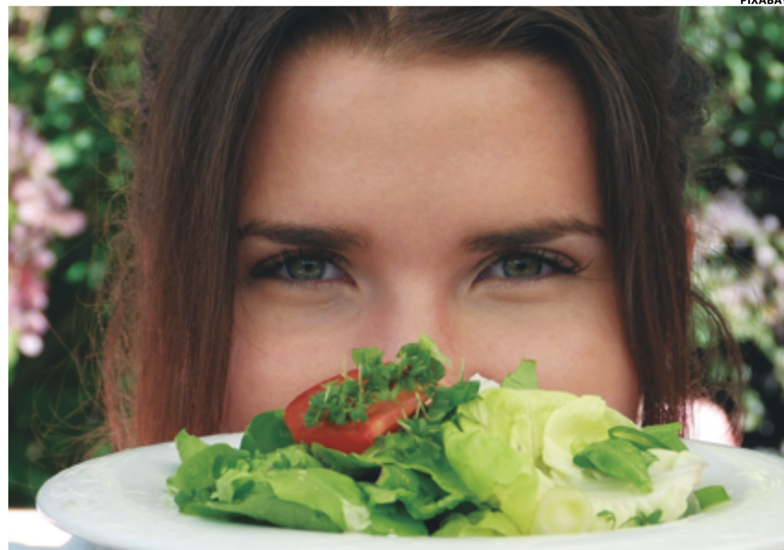
Caso quebre dieta, busque alimentos como integrais, frutas, verduras e legumes, proteínas magras e sementes