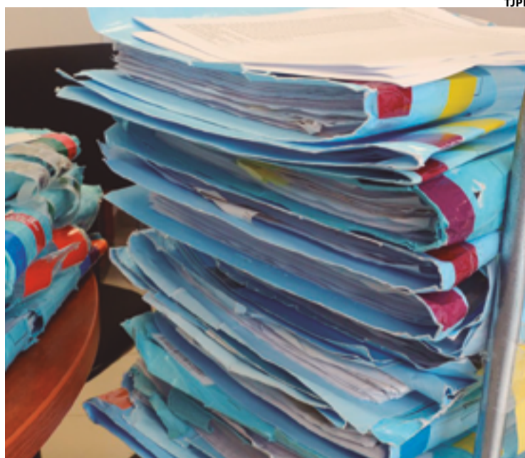
Tramitam no Judiciário anapolino aproximadamente 85 mil processos com este teor, promovidos pelo Município, situação que será minorada

Assim, o resultado será ajuizar uma única ação em desfavor de determinado contribuinte, desde que os débitos somem ao menos R$ 4,3 mil acumuladamente, isso a partir da segurança jurídico-administrativa retratada por estudo conjunto da Se-