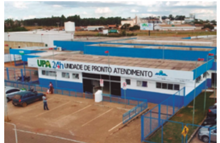
Atendimentos ao público feminino somam mais de 9 mil por mês, conforme dados divulgados pela Secretaria Municipal de Saúde

A alimentação vegana tende a conter um maior teor de fibra dietética, magnésio, ácido fólico, vitamina C, vitamina E, ferro, e fitonutrientes, mas um menor teor de gordura saturada, colesterol, ômega-3, vitamina D, cálcio, zinco, e vitamina B12 — sendo muitas vezes necessária suplementação ou ingestão de alimentos fortificados. Assim, uma dieta à base de plantas bem planejada é tida como apropriada para todas as fases da vida, incluindo infância e gravidez,