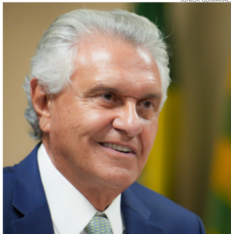
Ronaldo Caiado, governador: maior aprovação entre as mulheres (85%), na faixa etária de 45 a 60 anos (85%) e com ensino superior (84%)

A Real Time Big Data ouviu 1200 eleitores, entre os dias 16 e 18 de dezembro. A margem de erro do levantamento é de 3 pontos percentuais para mais ou para menos, com intervalo de confiança de 95%.