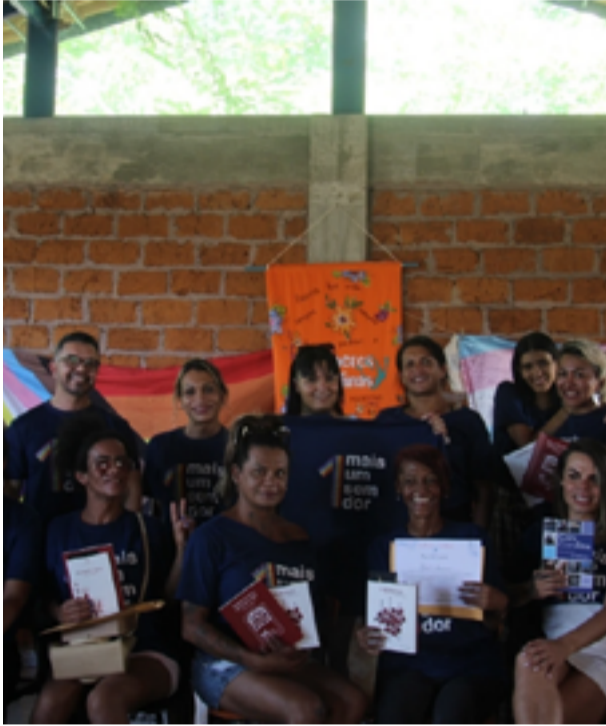
Alunas tiveram aulas teóricas e práticas sobre culinária da Cidade de Goiás

Iniciativa ocorre por meio da Ascoralinas e do "Mais Um Sem Dor". Capacitação teve carga-horária de 30 horas-aula