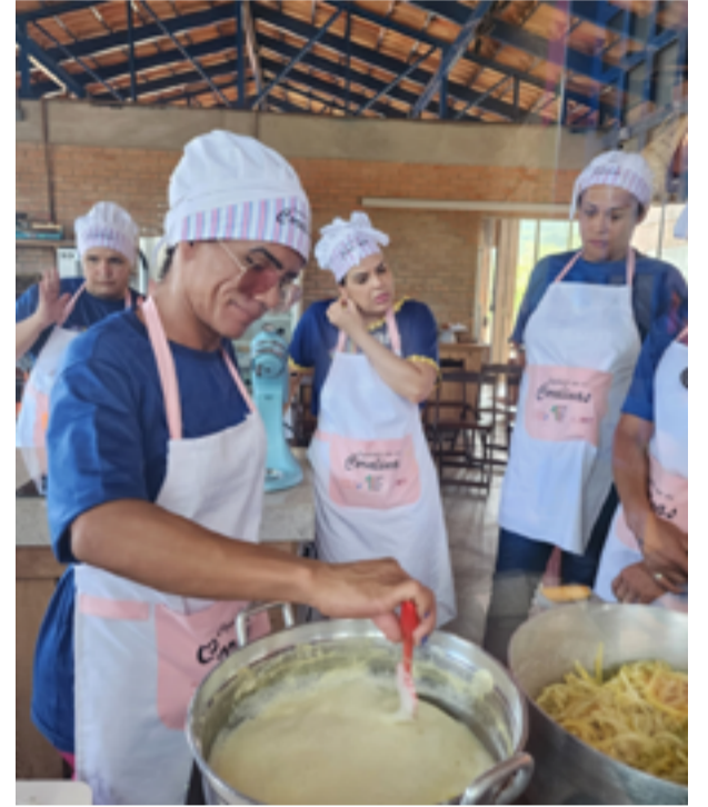
Curso é o primeiro totalmente composto por mulheres trans