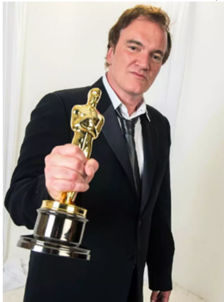
Quentin Tarantino, oscarizado: cinéfilo obsessivo