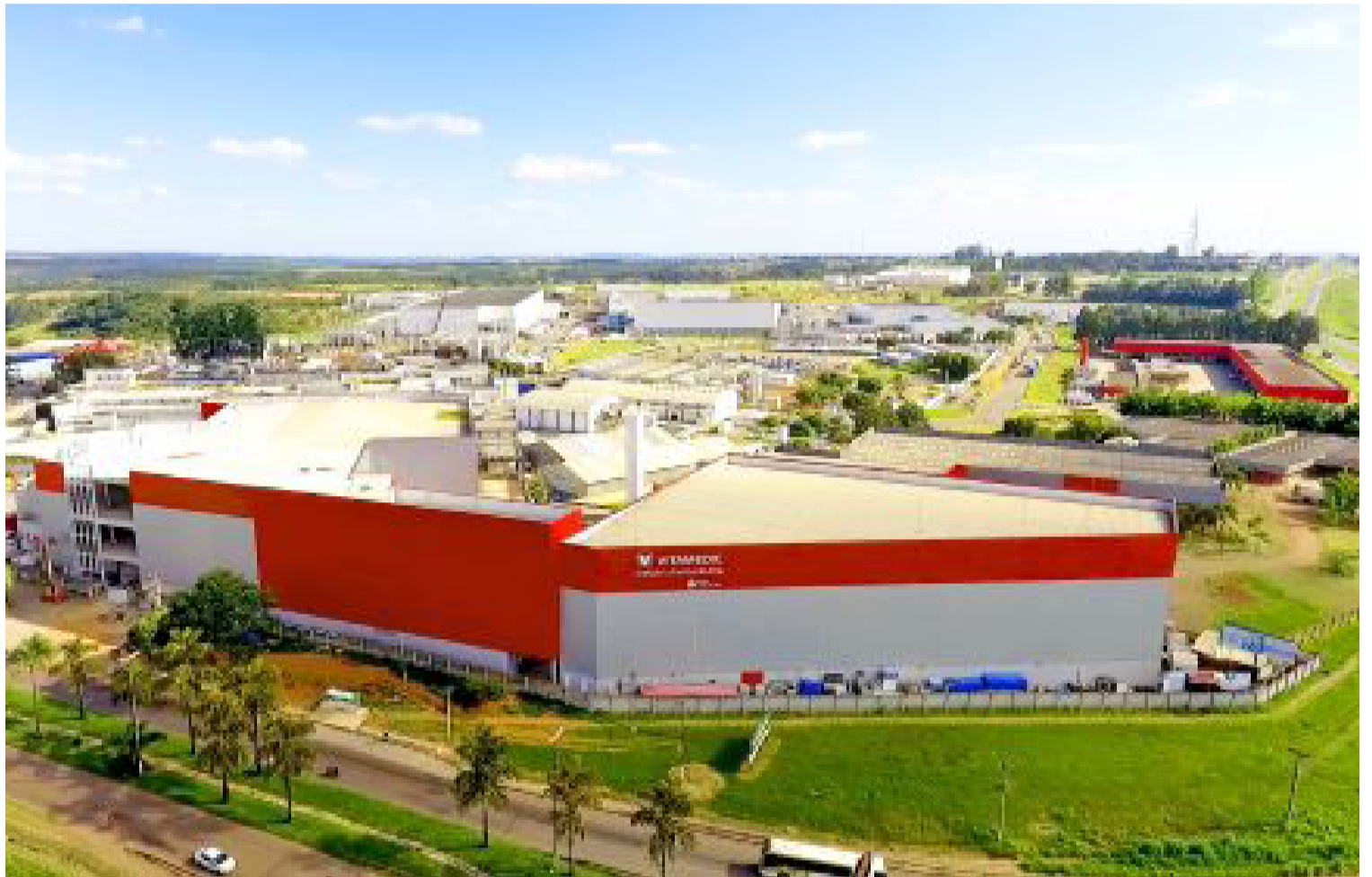
Prédio de uma das indústrias farmacêuticas instaladas no Distrito Agroindustrial de Anápolis

“Como Anápolis é um polo farmacêutico, pode ser que haja um aumento das exportações, ampliando o mercado das empresas do setor, o que pode gerar