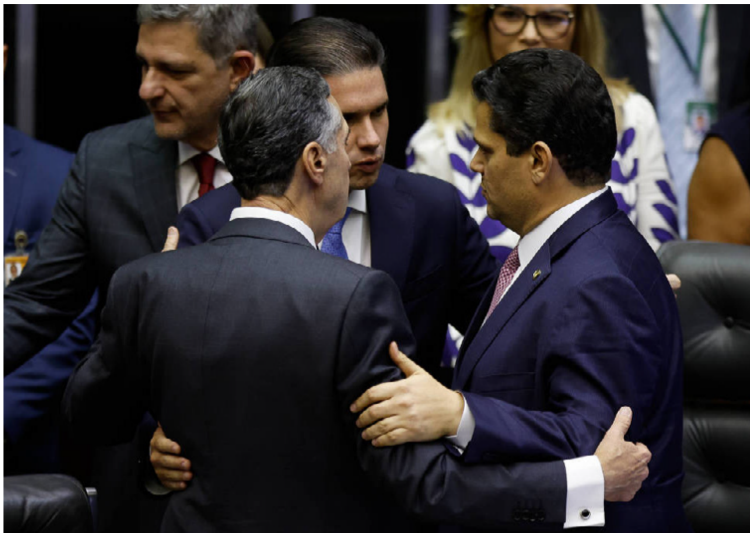
Luis Barroso, Hugo Motta e Davi Alcolumbre: diálogo para evitar crise entre os poderes

Na mensagem enviada pelo Palácio do Planalto ao Congresso, o presidente Lula (PT) também falou em harmonia e que, em 2025, o Executivo planeja reforçar o diálogo institucional com o Legislativo para alinhar planos de ação em prol do desenvolvimento sustentável do país, estratégia que "inclui dire-