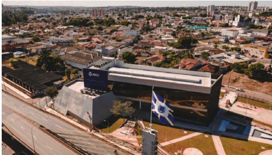
Estrutura de funcionamento da prefeitura deve ser alterada em breve, segundo prefeito

O prefeito ressaltou que a interlocução com a Câmara Municipal será feita sem distinção político-partidária. "Eu fui eleito para administrar para todos. Não para um grupo A ou B, nem para a direita