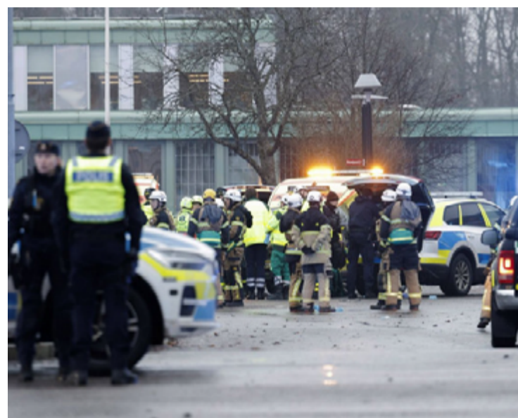
Cidade sueca de Örebro foi palco de um trágico incidente que deixou o país em choque