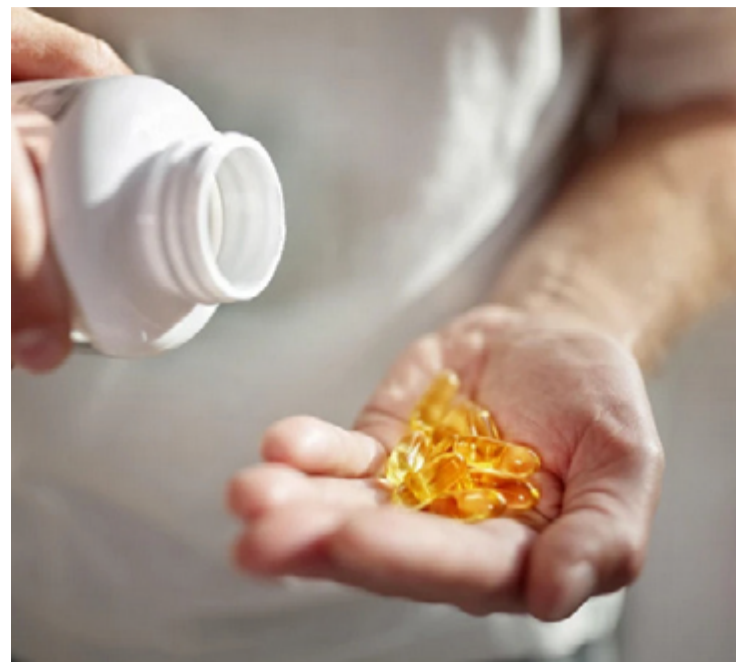
Pesquisa analisou dados de mais de 700 participantes septuagenários ou mais velhos

Além disso, foi estabelecido um regime de exercícios que consistia em sessões de 30 minutos, realizadas três vezes por semana. Esta abordagem multifacetada visava abordar o envelhecimento de maneira holística, combinando suplementação nutricional com atividade física regular.