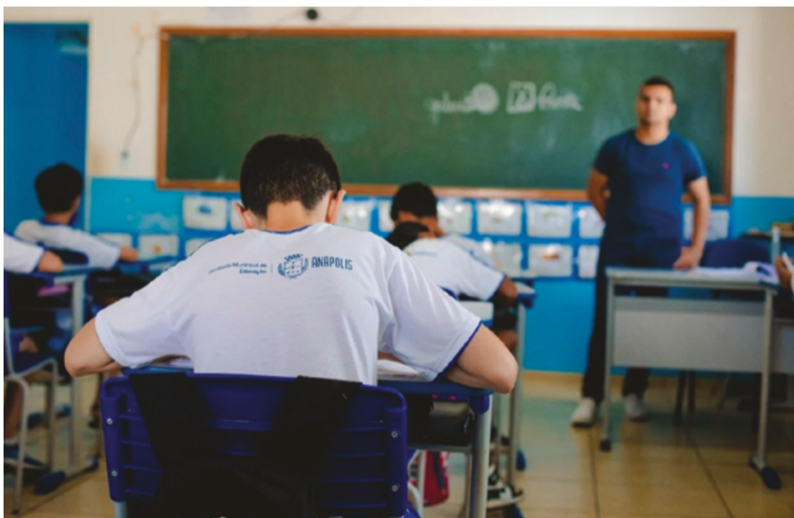
Saúde mental dos professores preocupa a Secretaria Municipal de Educação

A secretária atribui o crescimento dos problemas de saúde mental a fatores como o impacto da pandemia, que trouxe perdas familiares e afastamento das salas de aula, e o uso excessivo de telas, que tem prejudicado a interação social das crianças. “Hoje, a criança não sai para brincar com a outra criança. Ela fica no celular, nas telas. Isso também tem