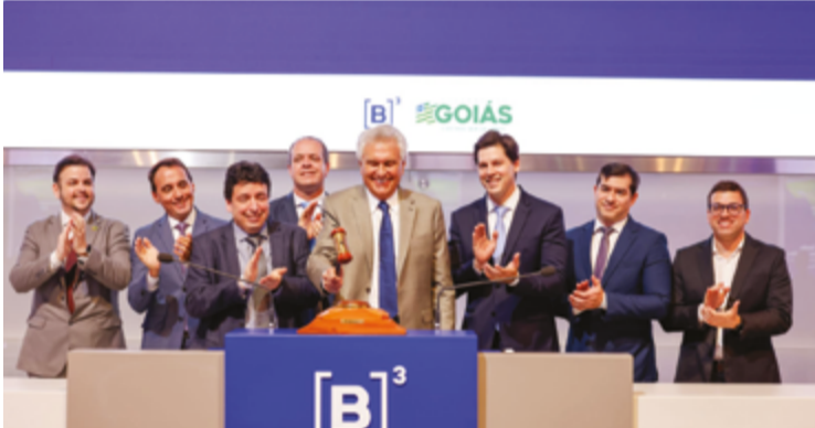
Leilão para concessão do estádio Serra Dourada. Empresa fará administração por 35 anos

Com o objetivo de devolver o Estádio Serra Dourada ao seu lugar de protagonismo no cenário nacional, o governador Ronaldo Caiado e o vice-governador Daniel Vilela participaram, nesta terça-feira (4), na B3, em São Paulo, do leilão para a concessão do Distrito de Esporte e Entretenimento do Complexo Serra Dourada. Com oferta de outorga fixa de R$ 10 milhões, a empresa Construcap foi a vencedora do leilão e, após a assinatura do contrato, terá a concessão do equipamento esportivo por 35 anos.