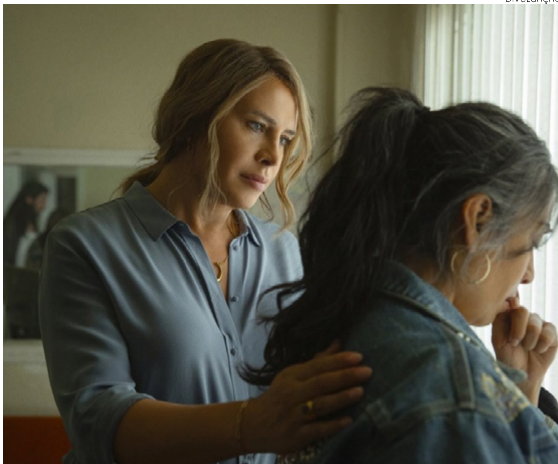
Longa iniciou sua surpreendente trajetória no último Festival de Cannes, no ano passado

Misturando comédia, drama, crime e musical, "Emilia Pérez" não somente explora como a transição de Manitas para Emilia simboliza uma oportunidade de redenção da protagonista pelos seus atos passados, mas também a maneira que a mudança afeta os relacionamentos forjados em sua vida anterior, como, por