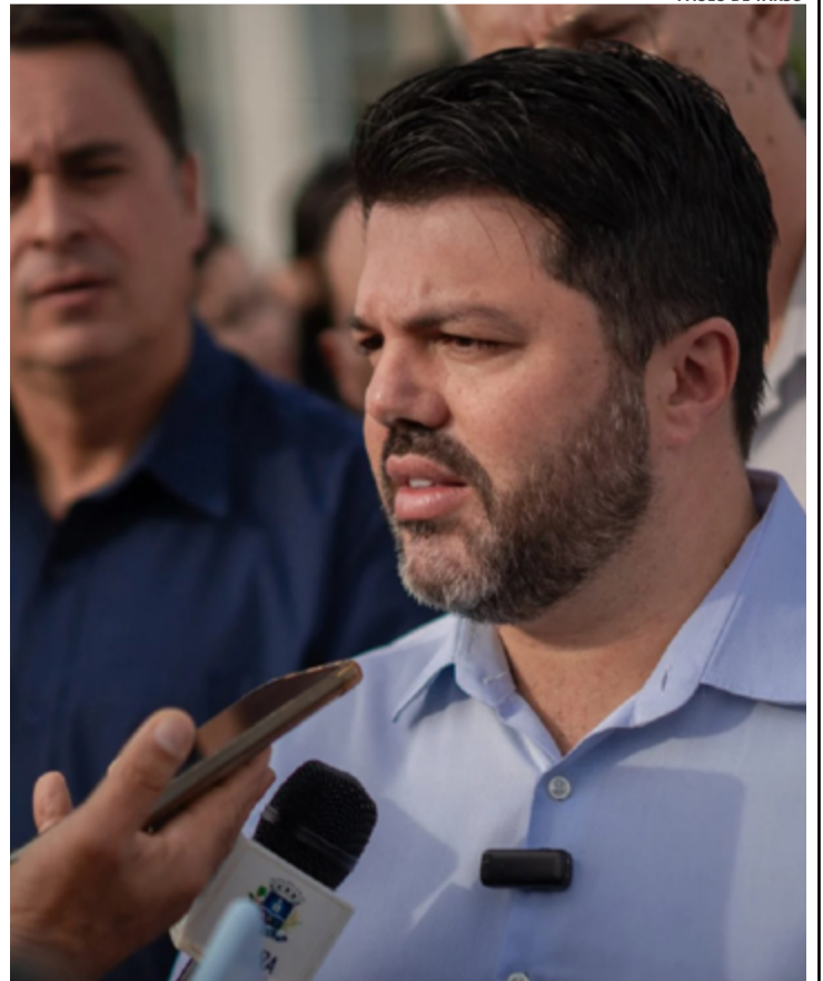
Prefeito Márcio Corrêa em entrevista coletiva durante Operação Cidade Limpa