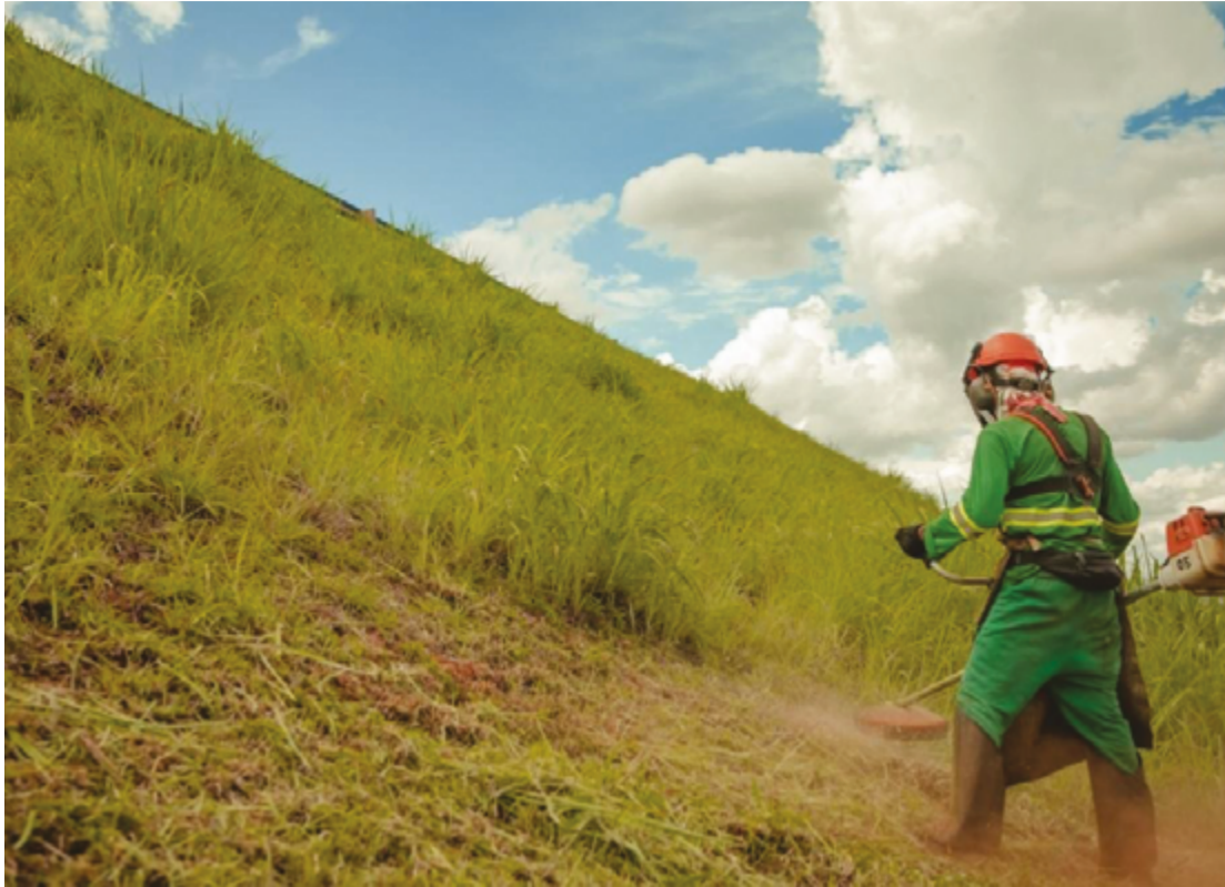
Roçagem de lotes baldios é feita pela prefeitura, que aplica multa a proprietários de terrenos