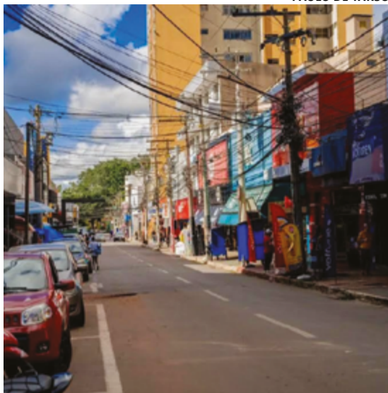
PAULO DE TARSO