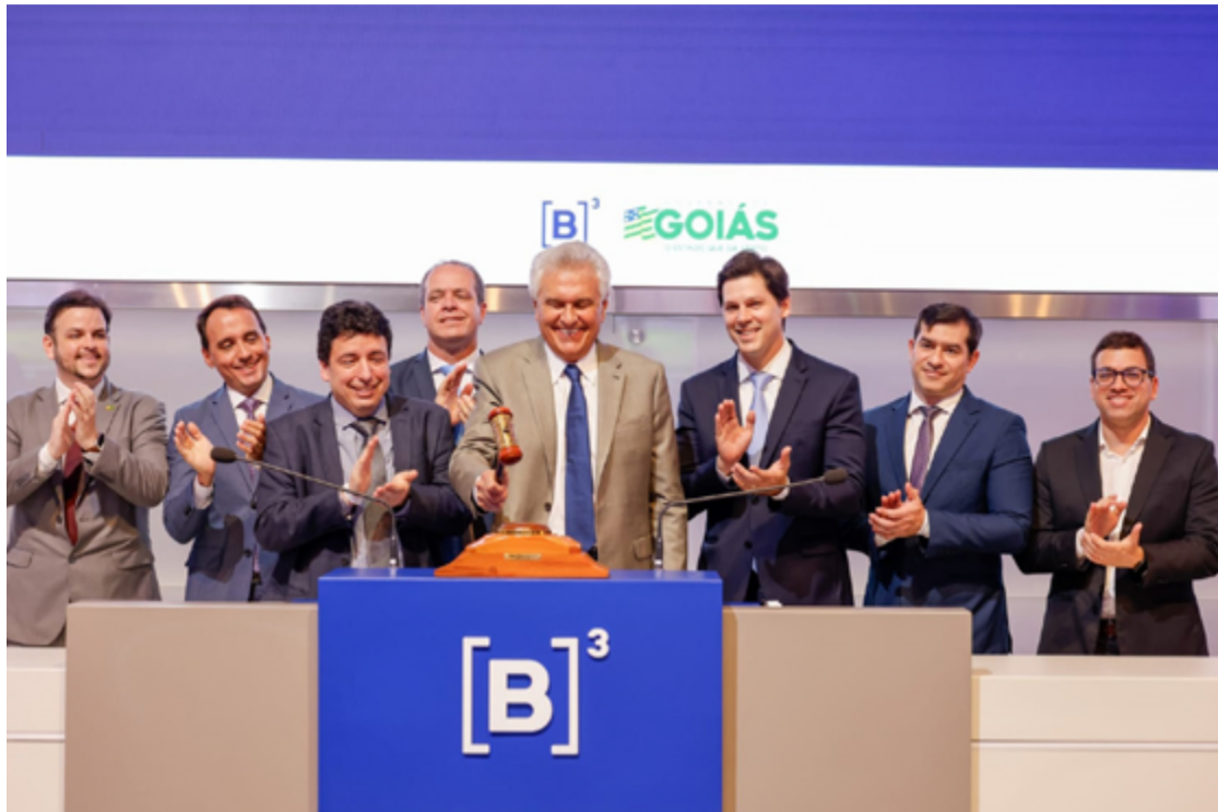
Ronaldo Caiado e Daniel Vilela ressaltam confiança na transformação do espaço em um grande centro de lazer para Goiás

O projeto proposto para a Construcap prevê investimentos obrigatórios mínimos de R$ 215 milhões. Em tempo: outros opcionais poderão ser