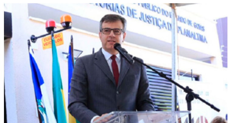
Cyro Terra: segundo mandato do MPOG