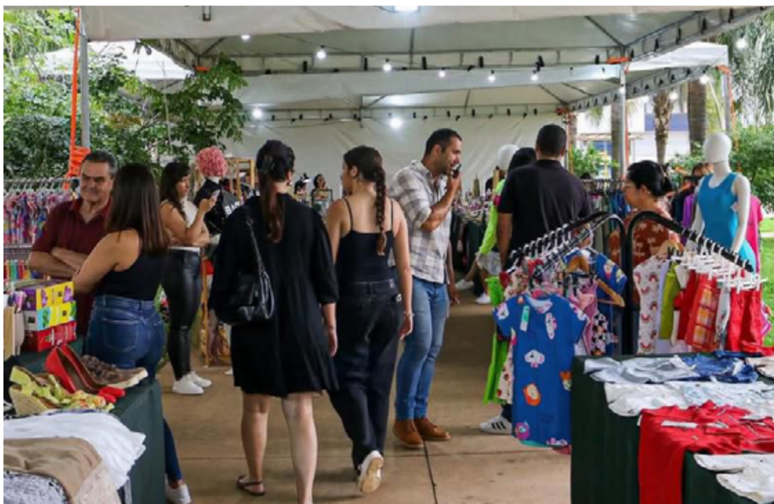
Feira feminina vai ocorrer na Praça Dom Emanuel, no bairro Jundiá, ainda em fevereiro

Para participar, as empreendedoras interessadas devem entrar em contato com