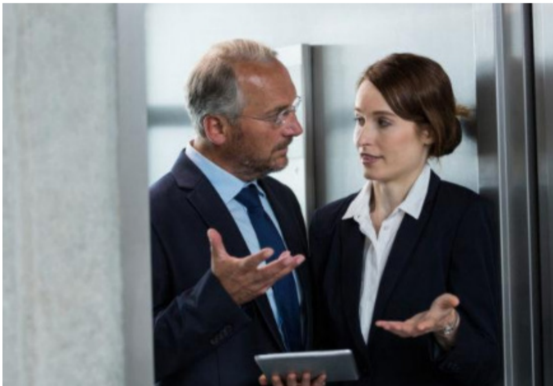
Respeite o espaço alheio: cordialidade é prática essencial para interação positiva

Em ambientes compartilhados, atitudes respeitadas promovem clima de respeito e cooperação, facilitando interações e evitando conflitos