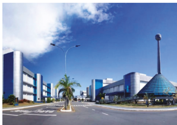
Sede do Laboratório Teuto, em Anápolis, que abriu diversas oportunidades de emprego

Candidatos interessados devem enviar currículos pelo site www.teuto.com.br/trabalhe-conosco ou pelo e-mail selecao@teuto.com.br , identificando a vaga pretendida.