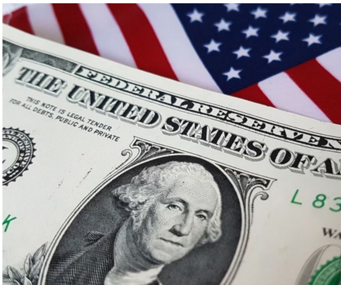
Oscilações refletiram a volatilidade nas relações entre EUA, China e aliados do acordo comercial norte-americano

O ponto mais baixo foi registrado próximo às 14h, quando o dólar tocou R$ 5,757. No encerramento das negociações, a moeda apresentou um recuo de 0,74%, estabilizando-se em R$ 5,773.