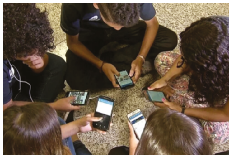
Uso de celulares foi proibido por lei federal e agora tem diretrizes delimitadas pelo Estado

A resolução também estabelece que as escolas criem um Termo de Ciência e Responsabilidade, a ser assinado pelos pais ou responsáveis, para garantir o cumprimento das regras. O descumprimento da norma poderá resultar em sanções disciplinares, aplicadas de forma progressiva, des-