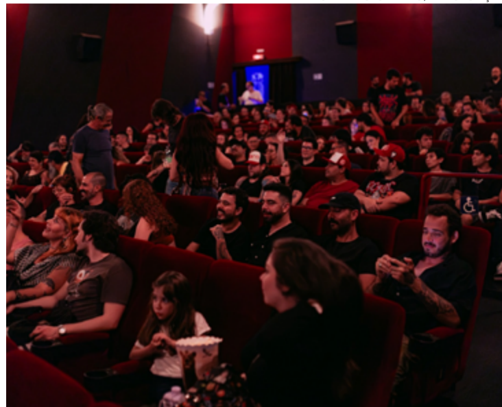
Público lotou cinema durante estreia na sexta-feira, dia 24 de janeiro