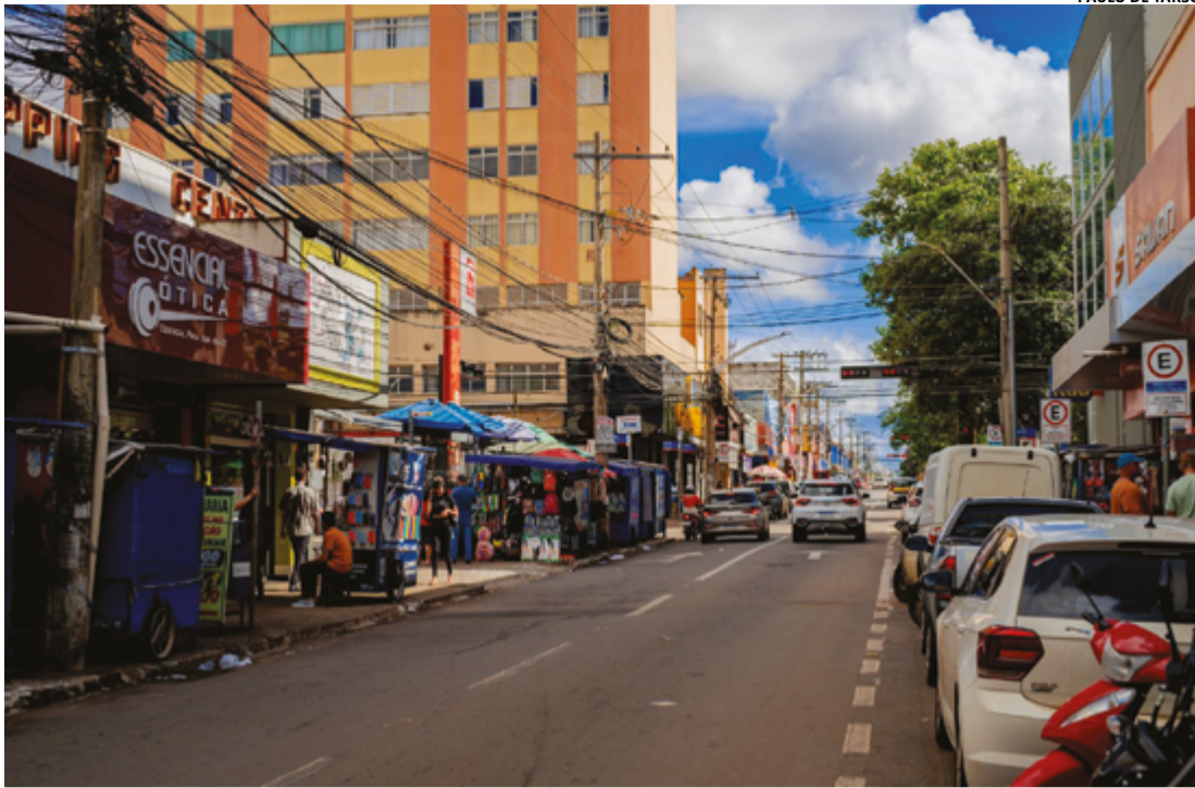
PAULO DE TARSO

Região central de Anápolis terá desenvolvido projeto de revitalização, segundo a Prefeitura