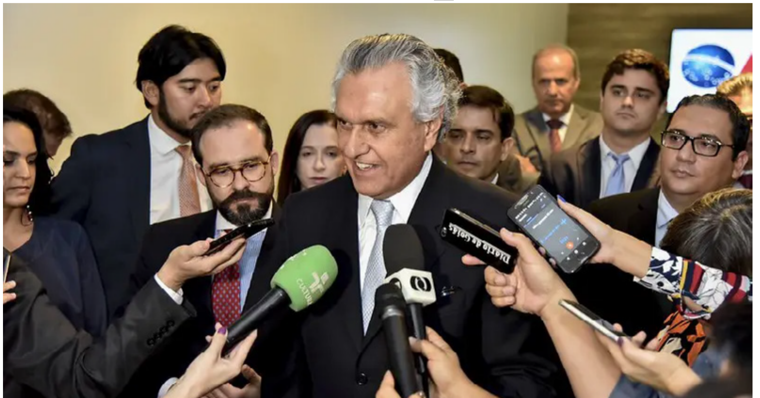
Ronaldo Caiado: popular em Goiás e desconhecido no cenário eleitoral do país

Caiado pretende lançar sua pré-candidatura ao Palácio do Planalto no mês de março deste ano, em evento em Salvador, Bahia. O governador tem cum-