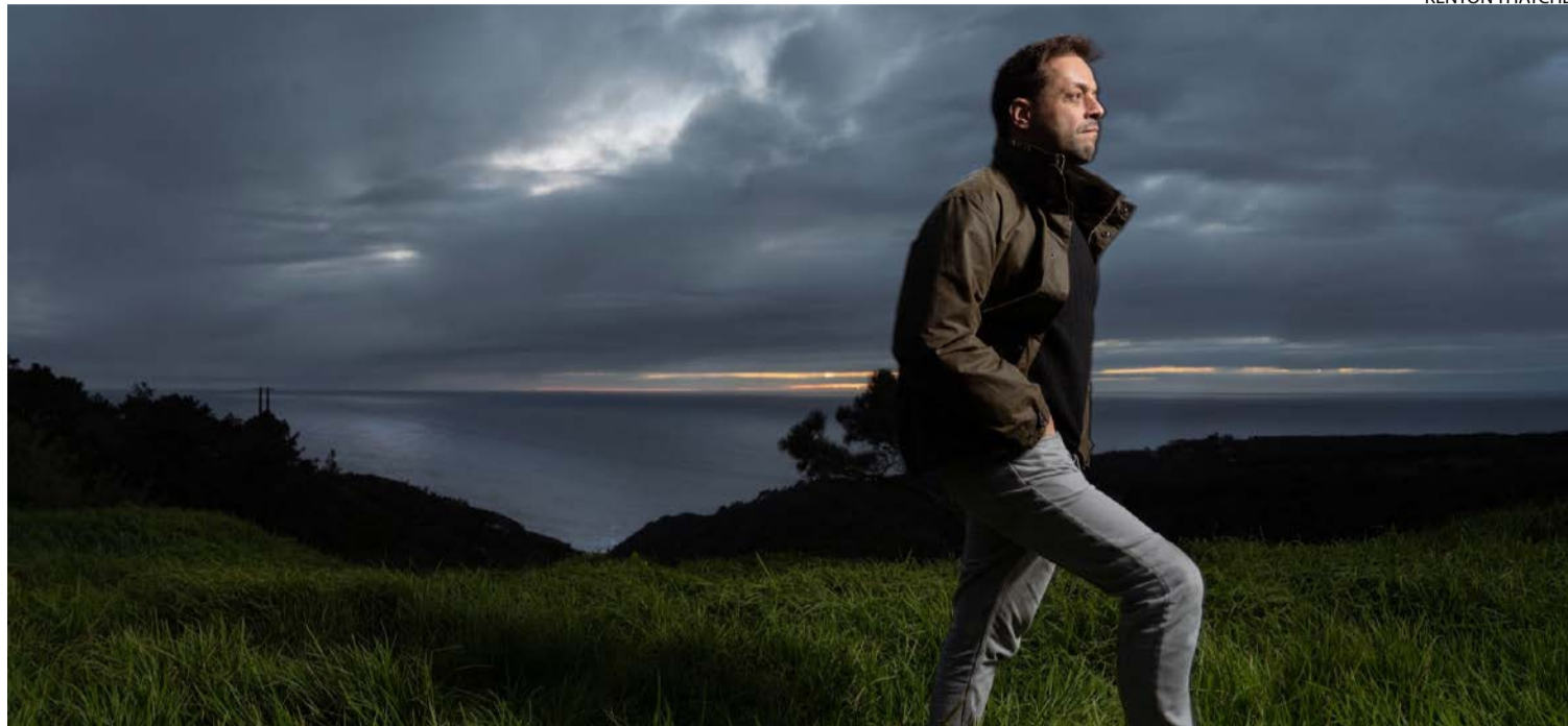
Repertório terá como base o novo álbum, mas também revisita momentos marcantes da carreira do artista português