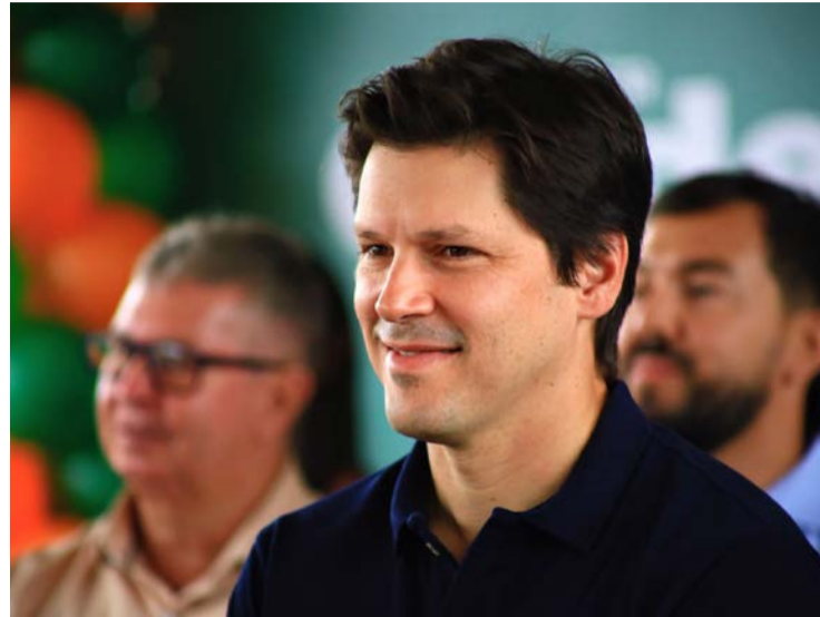
Governador Daniel Vilela articula mutirão de filiações no MDB

Movimentação é vista como estratégica para consolidar o MDB como força mais competitiva