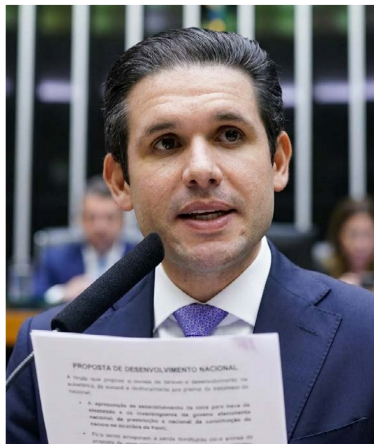
Deputado Hugo Motta coloca Câmara em esforço concentrado

Deputados próximos ao setor produtivo, incluindo a Frente Parlamentar do Empreendedorismo, já defendem que o debate seja postergado para depois do período eleitoral, evitando assim que a votação perca rigor técnico e siga por um caminho eleitoral.