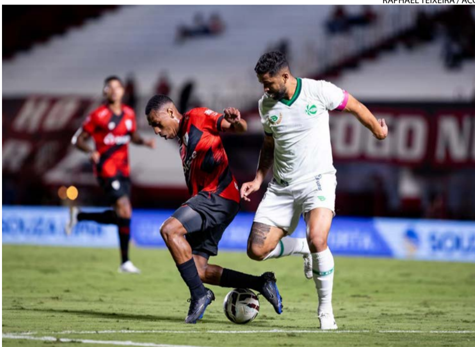
RAPHAEL TEIXEIRA / ACG