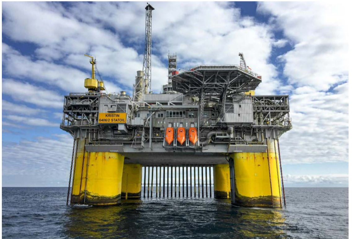
Diversos estados que hoje não recebem royalties, entre eles Mato Grosso, Goiás, Tocantins e Acre podem ser beneficiados

A lei foi aprovada no governo Dilma Rousseff (PT), na esteira de debates sobre a criação de um fundo para investimentos em