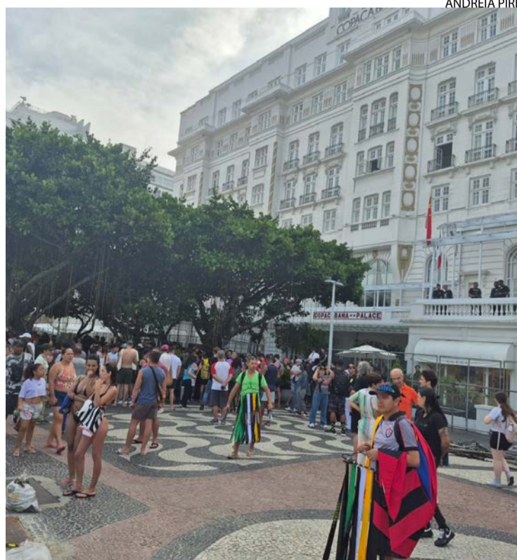
Copacabana Palace: fãs esperam cantora em frente ao badalado hotel

Estou à espera do sinal abrir para transeuntes. Do outro lado da rua, miro a cena, ilustrativa do fenômeno Shakira no Rio: o ambulante, com trinta e poucos anos, vende camisetas da cantora. Faz uma boa grana, pois o movimento está bom por esses dias. Gente de fora, cidade cheia.