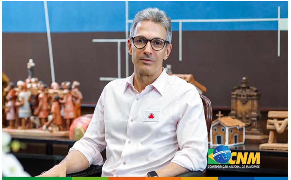
Ex-governador de Minas Gerais Romeu Zema defende que crianças trabalhem

essa hipocrisia", disse. "Milhões de jovens já trabalham hoje, mas na informalidade, sem regra, sem nenhuma proteção. Somos um país que finge que protege os jovens e as crianças. Essa é que é a verdade. E eu não tenho medo de dizer isso não."