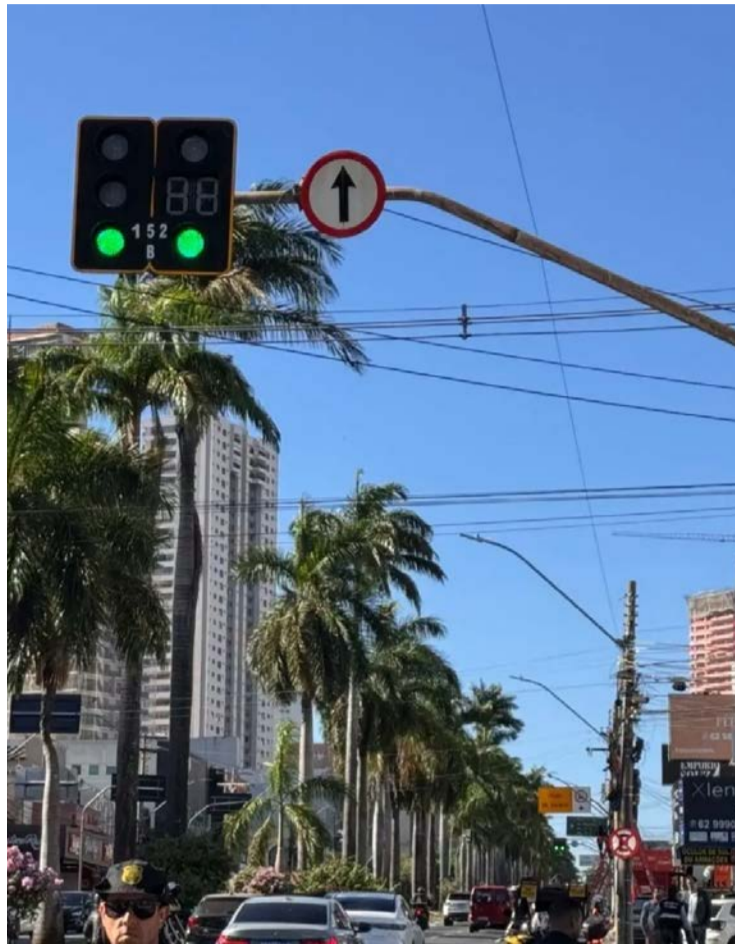
Motoristas relatam menos paradas e maior fluidez, principalmente nos horários de maior movimento

Outros corredores também tiveram alterações. Na Avenida Castelo Branco, além da sincronização dos semáforos, foram feitas mudanças na geometria da via e na sinalização. Já no eixo Jamel Cecílio e 136, o tempo de deslocamento caiu pela metade, segundo dados da Secretaria Municipal de Engenharia de Trânsito (SET), passando de cerca de 25 minutos para 12 a 13 minutos. A Avenida 24 de