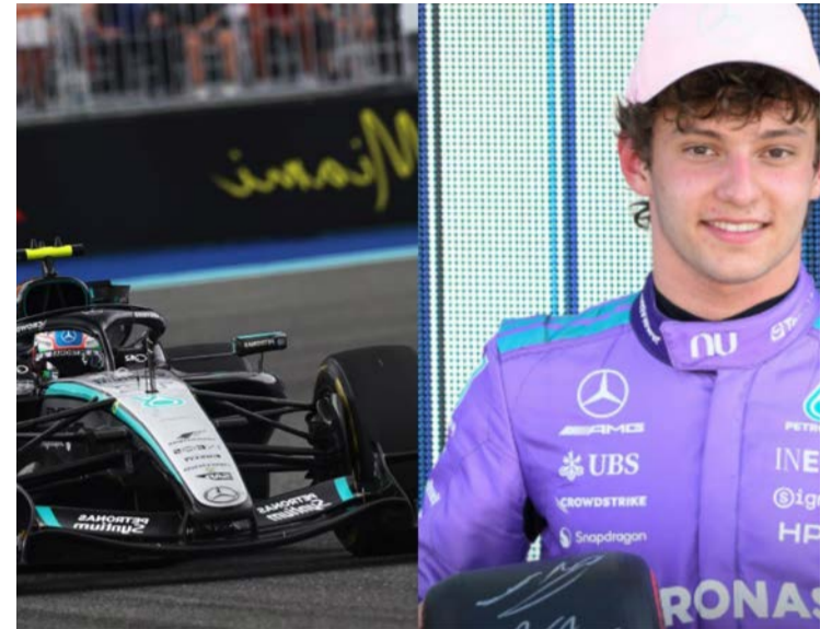
Kimi Antonelli confirmou o favoritismo no GP de Miami 2026