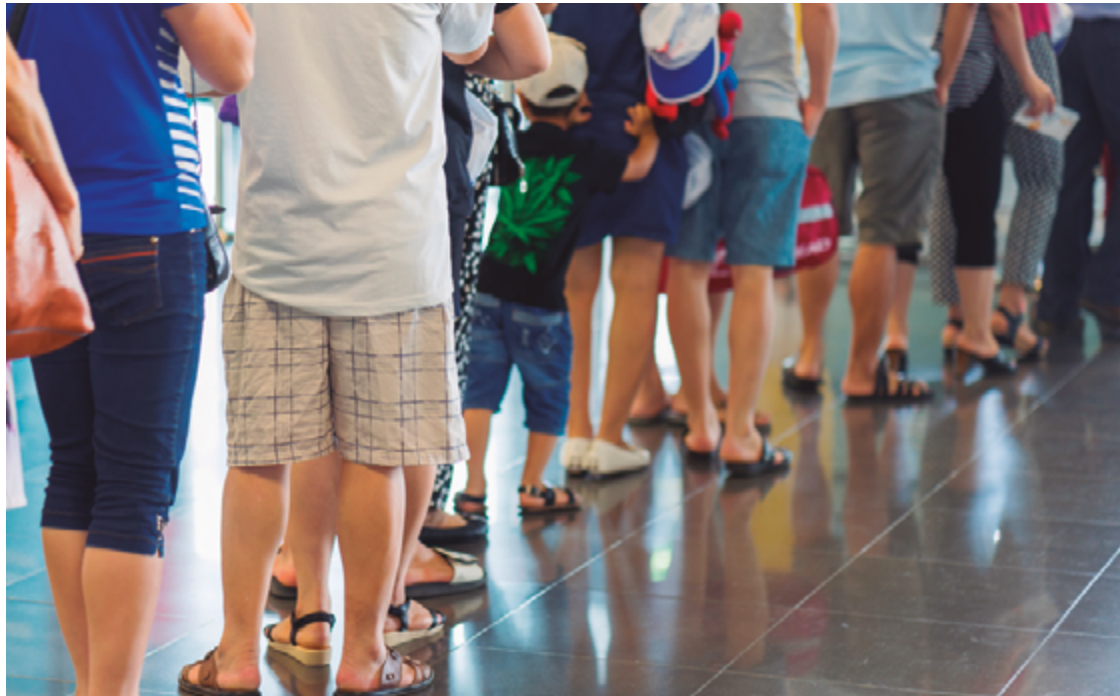
Nova legislação estabelece mais rigor para evitar que clientes fiquem horas nas filas à espera de atendimento

Segundo ele, chegaram ao seu conhecimento relatos de pessoas que ficam mais de uma hora, até mais de duas horas, para resolver uma pendência na agência bancária. Agora, nessa parceria com o Procon Anápolis e com o Ministério Público, afirma o presidente da Câmara, o cliente terá comprovação do horário de chegada e de saída. “Para que o cidadão de bem seja respeitado quando procurar este tipo de atendimento. Será um ganho para a sociedade”, disse. O projeto vai passar pelas comissões e, nas primeiras sessões ordinárias de no-