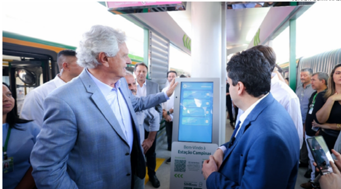
Ronaldo Caiado vistoria Estação Campinas e entrega revitalização de estruturas do Eixo Anhanguera um dia antes do aniversário da Capital

tradas nos locais são: sistema de áudio; duas portarias eletrônicas nas entradas com acessos internos e externos (onde o usuário pode acionar ajuda dos profissionais da RedeMob Consórcio em caso de qualquer dificuldade); monitores de led semelhantes aos dos aeroportos, trazendo entretenimento e informações de utilidade pública; e câmeras capazes de fazer reconhecimento facial.