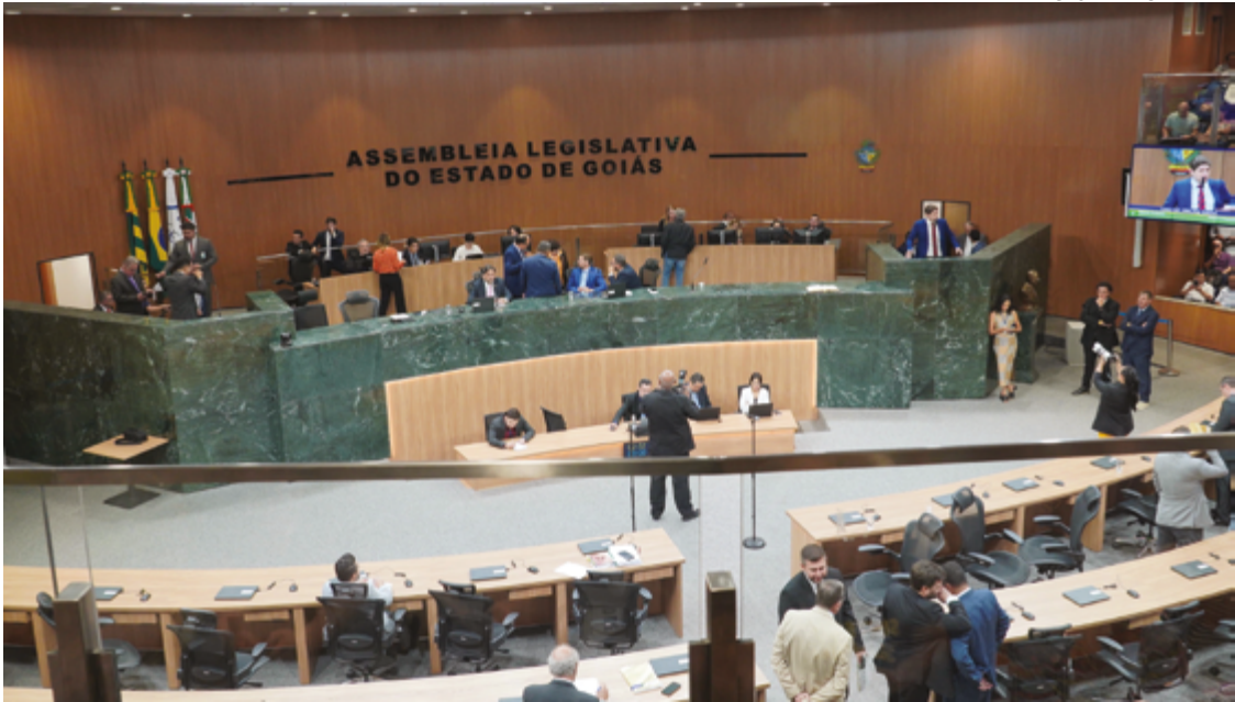
Projeto aprovado pelos deputados altera Plano de Cargos e Vencimentos do Pessoal do Magistério em Goiás

A matéria foi amplamente discutida no Legislativo nas últimas semanas e, na terça-feira, 22, foi aprovada em duas votações na Alego. O projeto segue agora para sanção do governador Ronaldo Caiado. Os professores tomaram as galerias do