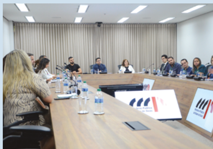
Planejamento foi idealizado pela coordenação da Área de Políticas Públicas e Direitos Humanos do Ministério Público de Goiás

Os trabalhos de formação da rede terão continuidade no próximo mês, quando ocorrerá mais um encontro. Participaram desta primeira reunião representantes da Defensoria Pública e do Tribunal de Justiça, de secretarias estaduais e municipais, além de universidades pública e privada. (Com informações Ascom MPGO)