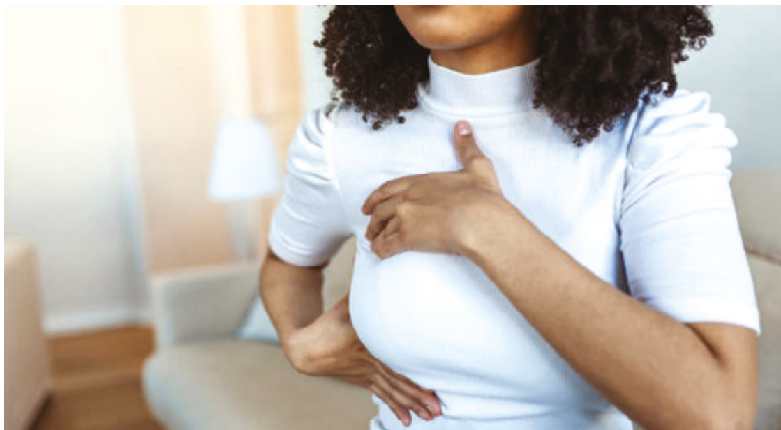
A prevenção, o diagnóstico precoce e o tratamento adequado são etapas que impactam na eficácia dos resultados

Após o diagnóstico do câncer, a paciente muitas vezes foca muito mais no câncer. E hoje temos tratamentos para câncer, que aumentam a sobrevida. A paciente com diagnóstico de câncer de mama, 90% delas, dependendo do tipo diagnóstico e o início do câncer, você tem uma sobrevida muito ampla, por mais de 5 anos, mais de 10 anos. A ciência hoje permite que essas pacientes possam guardar, congelar os óvulos, que se chama criopreservação. Ou congelar os embriões, se a paciente já tem um parceiro definido. Normalmente a gente faz essa criopreservação em duas semanas, no máximo quatro semanas já