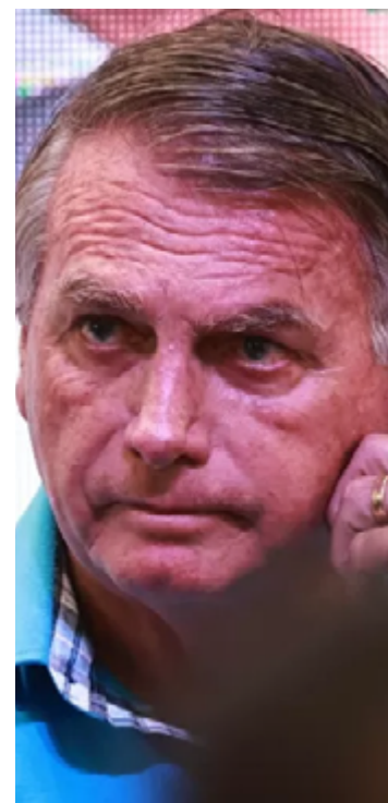
Jair Bolsonaro: no radar a candidatura ao Palácio do Planalto

Em novembro, Bolsonaro e seu candidato a vice, Braga Netto, ainda foram condenados por abuso de poder político, uso indevido dos meios de comunicação e conduta vedada a autoridades nas eleições. A Corte Eleitoral viu irregularidades na conduta dos dois nos eventos do Bicentenário da Independência, em setembro de 2022. Para os ministros, houve uso eleitoral das cerimônias públicas, no Rio e em Brasília.