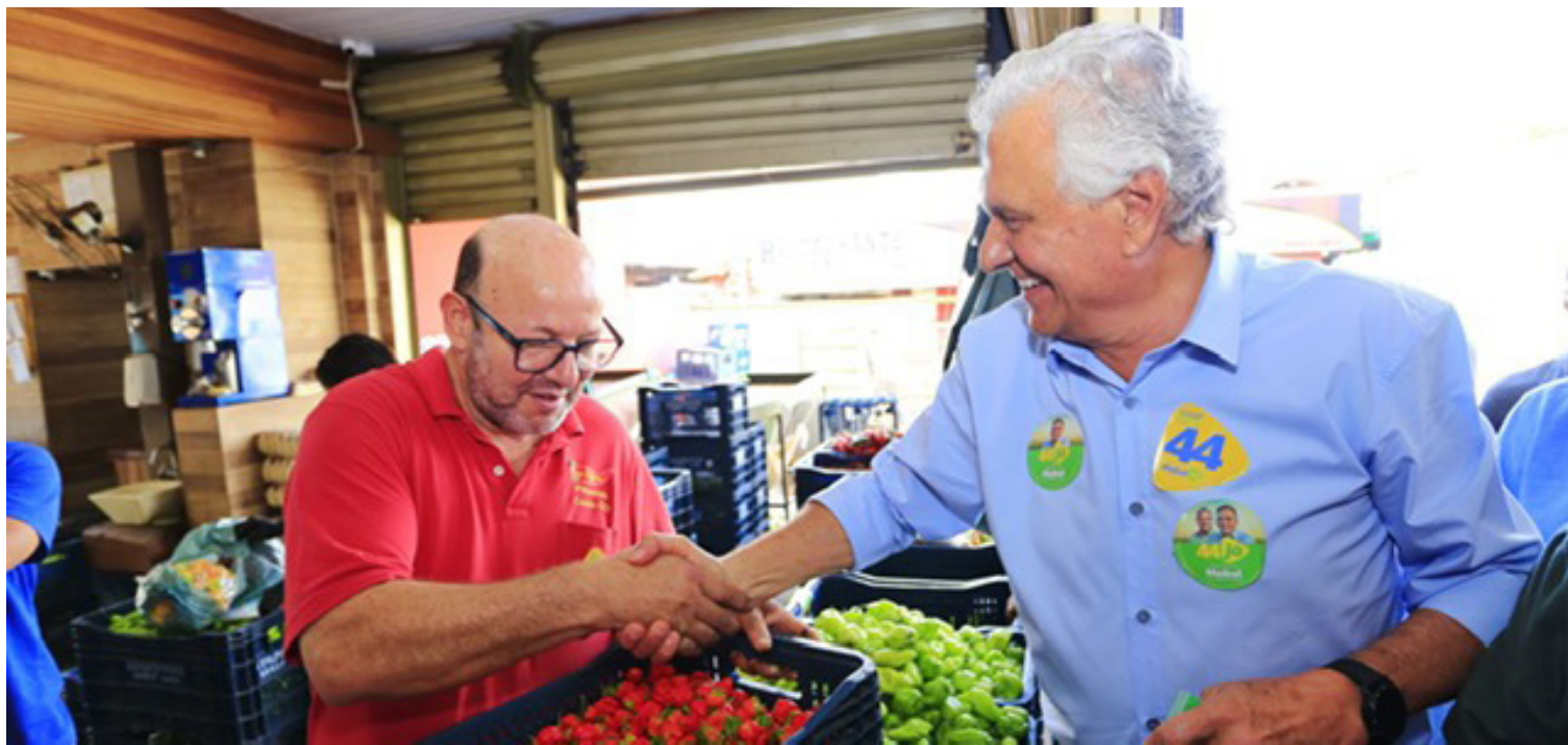
Ronaldo Caiado: mobilização dos eleitores para o segundo turno em Goiânia

O governador lamentou o atual cenário da capital, que enfrenta dificuldades em várias áreas, como coleta de lixo, atendimento em saúde e sobrecarga no sistema de educação. “Para resolver os problemas de Goiânia, precisamos de uma pessoa que tenha coragem”,