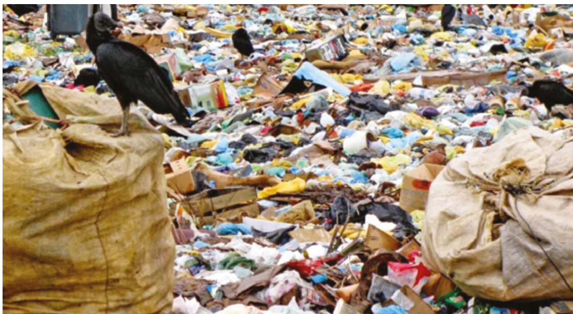
A atividade poluidora teve seu encerramento determinado por meio da Política Nacional de Resíduos Sólidos

O MPGO entende que as disposições legais e normativas ora impugnadas culminaram na prorrogação injustificada da existência dos lixões - atividade poluidora que teve o seu encerramento determinado em caráter mandatório por meio da Política Nacional de Resíduos Sólidos (Lei Federal nº 12.305/2010). E que, assim, a decisão incorreu em proteção deficiente ao direito fun-