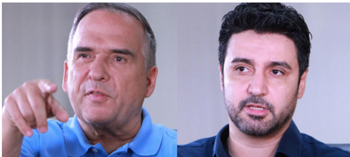
Sandro Mabel (UB) e Fred Rodrigues (PL): disputa pela prefeitura de Goiânia

O Opção Pesquisas entrevistou 1007 eleitores nos dias 19 e 20 de outubro. A margem de erro é de 3,1 pontos percentuais para mais ou para menos. O levantamento foi registrado na Justiça Eleitoral com o protocolo GO-03075/2024. Já o Igape realizou 800 entrevistas no dia 18 de outubro. A margem de erro é de 3,4 pontos per-