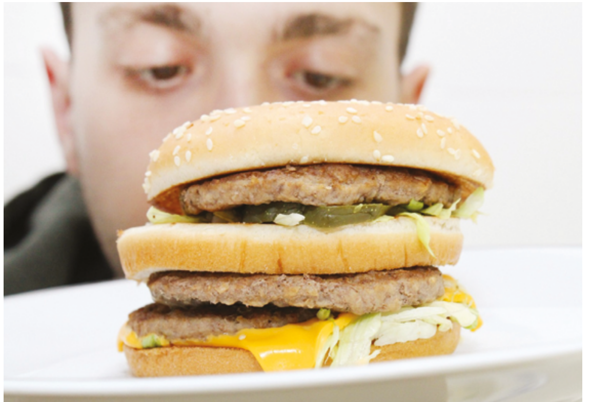
Ultraprocessados são ricos em aditivos químicos que podem interferir na absorção de nutrientes essenciais

A especialista também aconselha que mudanças na dieta sejam feitas de forma gradual e com a orientação de um nutricionista, garantindo que o plano alimentar seja balanceado e ade-