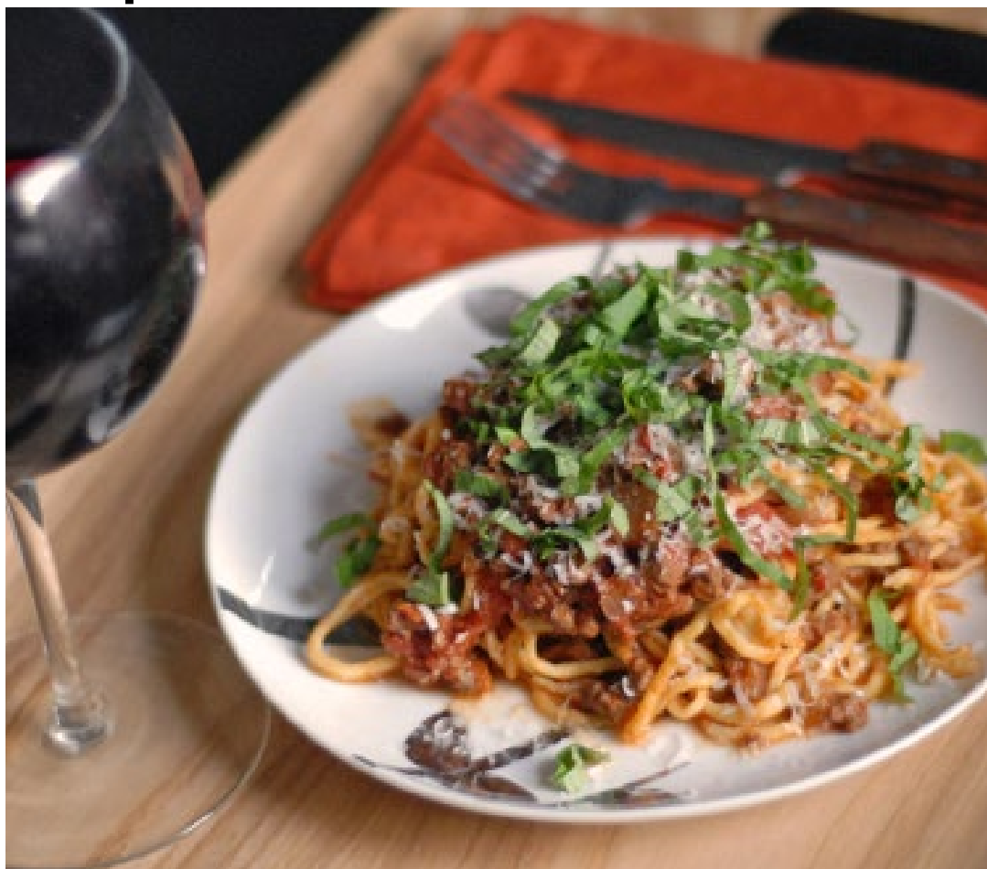
Massa: molho encorpado vai bem com Chianti ou Nero d'Avola

Sentar-se à mesa com um bom vinho tinto é mais do que uma refeição, é um convite a momentos de prazer e conexão. O vinho, com sua complexidade de aromas e sabores, tem o poder de transformar um simples prato em uma experiência memorável. Harmonizar vinhos tintos com a comida certa é uma arte que une tradição, intuição e um toque de ousadia. Nesta edição, convido você a explorar combinações que encantam o paladar e fazem da mesa um verdadeiro espetáculo. Afinal, harmonizar é mais do que combinar — é celebrar. O universo dos vinhos tintos é repleto de nuances, aromas e texturas que convidam a uma viagem sensorial quando combinados com os pratos certos. Na coluna desta semana, trago algumas dicas para que você possa explorar harmonizações que valorizam o vinho e a gastronomia, transformando cada refeição em uma experiência única.