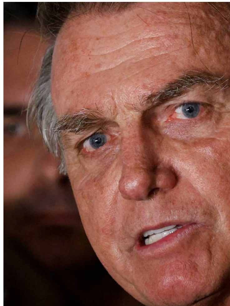
Jair Bolsonaro: acusado pela PF de arquitetar golpe militar no país

Durante seu mandato e após a derrota para Lula em acirrada disputa de segundo turno, o hoje inelegível Bolsonaro acumulou declarações golpistas. Questionou a legitimidade das urnas, ameaçou não entregar a Presidência ao petista após a derrota eleitoral, atacou instituições como o STF e o TSE e estimulou a população a participar de atos golpistas.