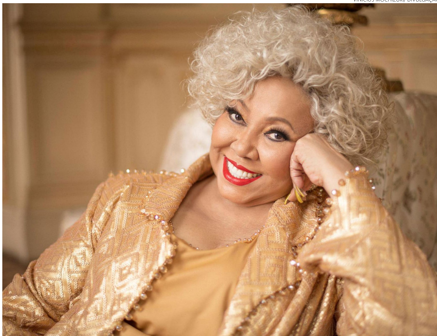
Artista diz que preocupa-se em alertar mulheres negras sobre violência doméstica: décadas de luta antirracista

gosto de exaltar as coisas boas que andam ocorrendo atualmente sem esquecer que ainda temos muito a conquistar. Felizmente, essas novas gerações, diferentemente do passado, quando as mudanças transcorriam de forma mais vagarosa, estão conseguindo avançar muito no combate aos preconceitos e em defesa dos nossos direitos. Estamos avançando; não o suficiente ainda, mas estamos caminhando.