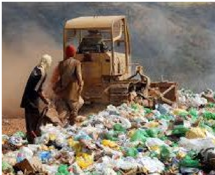
A existência dos lixões é verificada mesmo com metas estabelecidas pela legislação para erradicá-los

Entre os estados, o Amazonas tinha a maior proporção de cidades com lixões: 91,9%. A taxa em Pernambuco, por outro lado, foi de 0,5%, e não houve registros do tipo no Distrito Federal e em Alagoas.