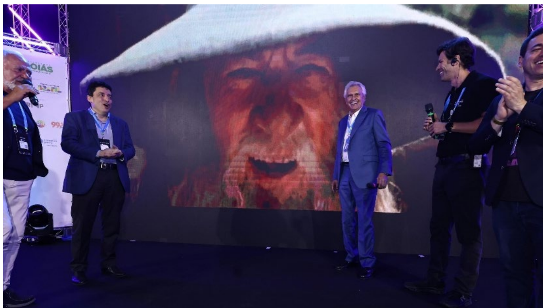
Ronaldo Caiado e Adriano da Rocha Lima na abertura da Campus Party: governador diz que "saberá adequar o estado" para acompanhar a revolução tecnológica

A Campus Party deste ano reúne especialistas, startups e entusiastas de tecnologia de todo o Brasil, com destaque para a programação gratuita e iniciativas como o painel Ethos.IA, realizado pela Secretaria-Geral de Governo (SGG), que explora conexões entre IA e energias limpas.