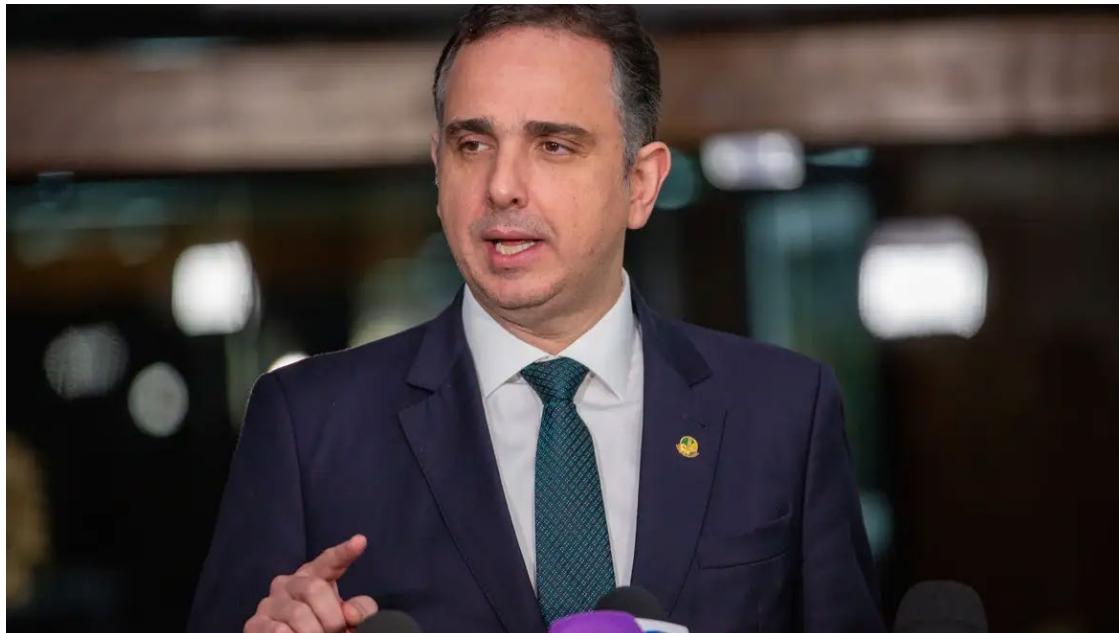
Rodrigo Pacheco (PSD/MG): diálogo

Na quarta (27), os presidentes do Senado e da Câmara, Arthur Lira (PP-AL), informaram ao STF o teor da nova lei e pediram a liberação da verba,