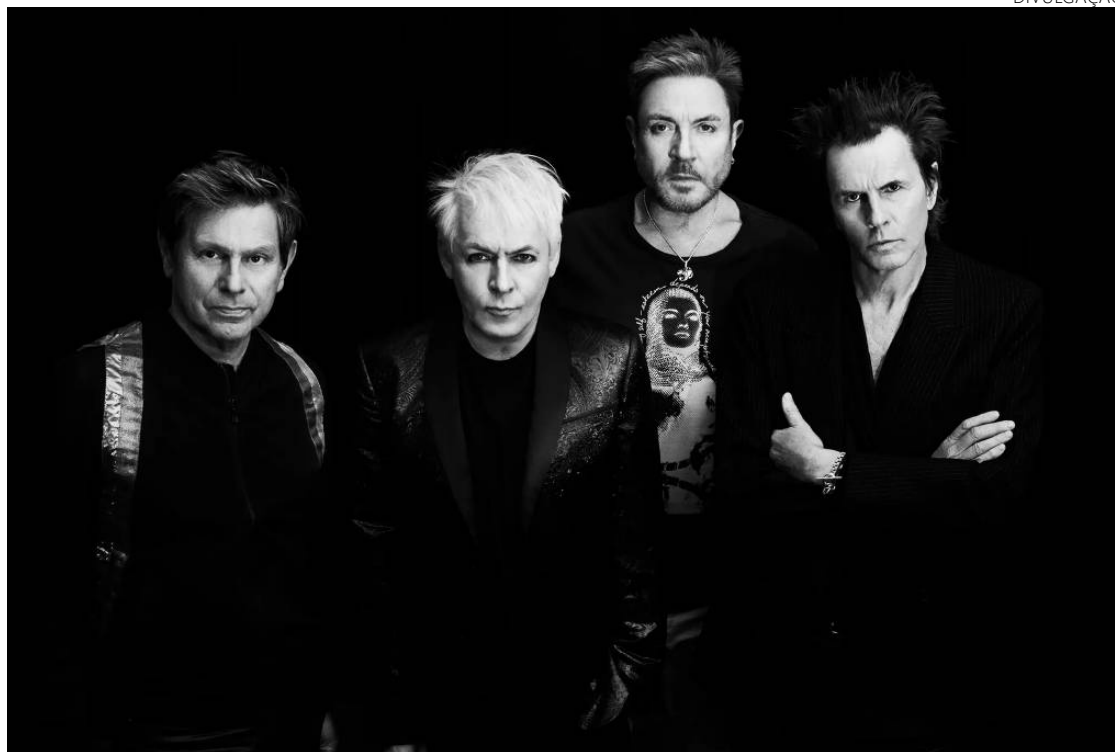
Último trabalho do grupo se destaca pela sonoridade peculiar que celebrava Halloween

"Estávamos sobrevoando a América num pequeno avião durante uma turnê, jogando conversa fora, quando tivemos a ideia de fazer um disco de covers para tocar num show