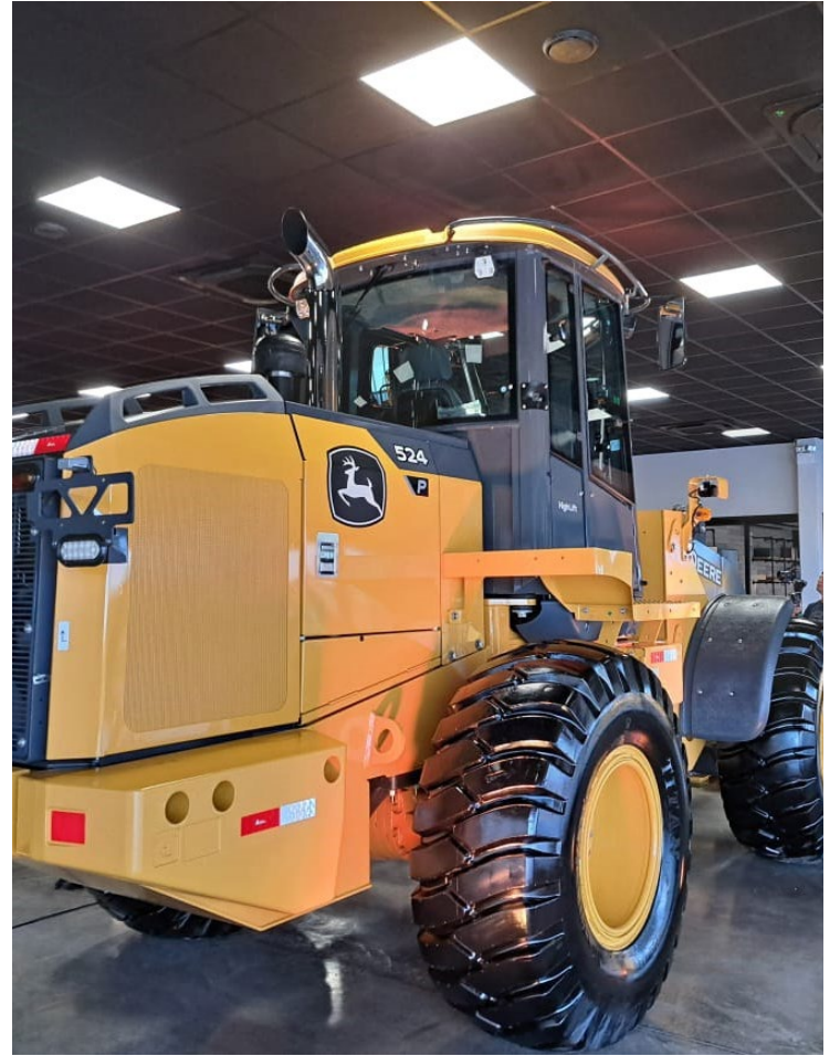
Novas pás-carregadeiras apresentam assento ergonômico e coluna de direção ajustável

Máquinas foram projetadas para atender a aplicações de construção e mineração, podendo também ser utilizadas no setor agrícola