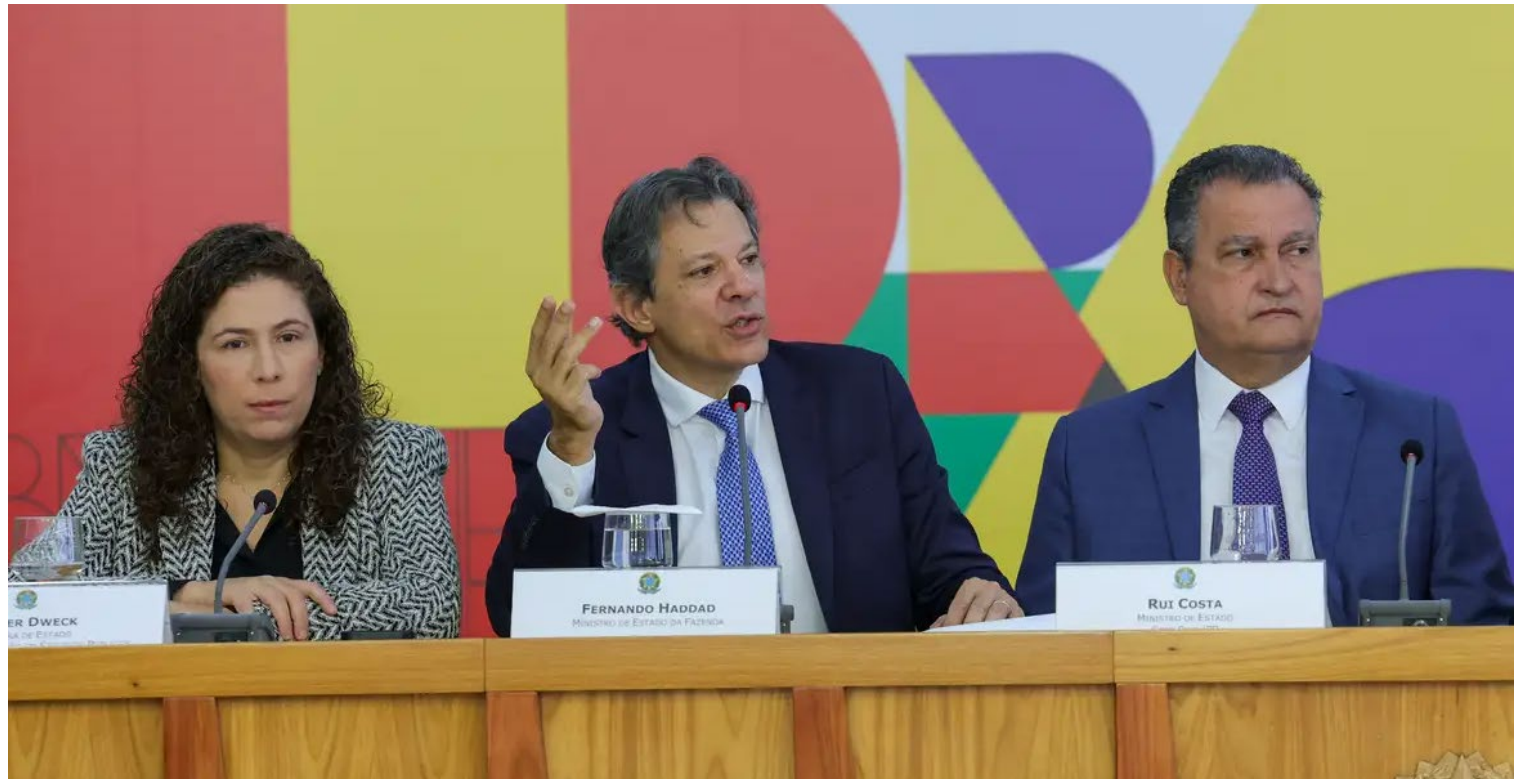
Num horizonte mais longo, a promessa da equipe econômica do governo é poupar R$ 327 bilhões entre 2025 e 2030

Em sua fala de abertura, Haddad disse que as medidas de contenção de gastos não se relacionam diretamente com a reforma da renda, que será enviada agora para discussão no Congresso em 2025, para valer em 2025. A proposta busca isentar de IR (Imposto de Renda) quem ganha até R$ 5.000 e criar um imposto mínimo para quem ganha acima de R$ 50 mil