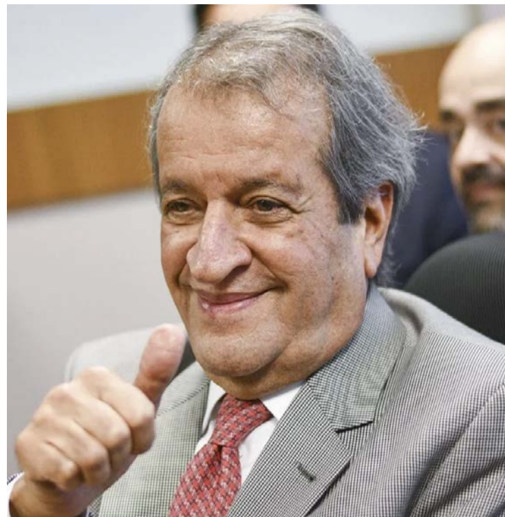
Valdemar teme que atritos podem levar direita à derrota

Declaração ocorre em meio aos atritos envolvendo a ex-primeira-dama Michelle e o senador Flávio