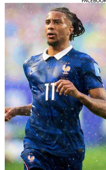
Michael Olise desponta sob comando de Didier Deschamps