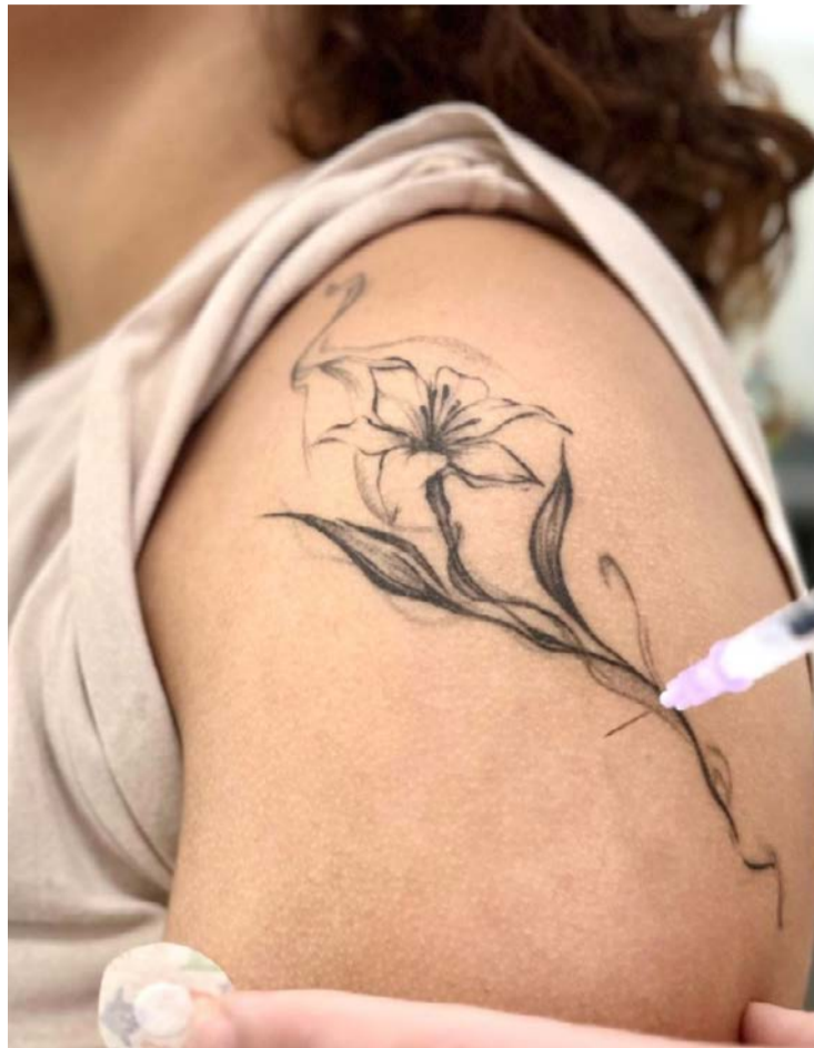
Disponível gratuitamente pelo SUS, vacina contra o HPV protege contra principais subtipos do vírus

Segundo o secretário municipal de Saúde, Luiz Pellizzer, a ampliação do