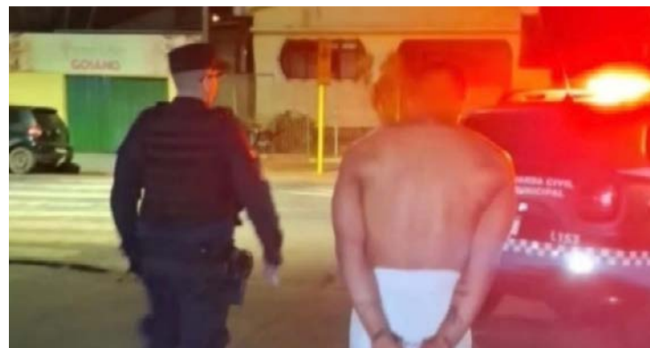
Entre os alvos estão grupos investigados por tráfico interestadual de drogas

Ofensiva tem como foco esquema de fornecimento de insumos para drogas