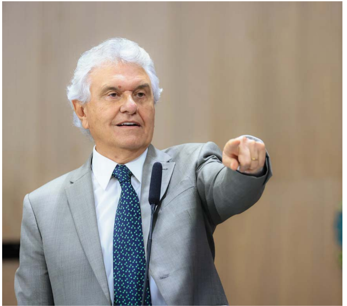
Ronaldo Caiado ataca Flávio Bolsonaro por defender que tarifaço seja aplicado após as eleições

Em sua fala no evento da CNC, Ronaldo Caiado ainda criticou o que seria uma postura ideológica da chancelaria brasileira, o Itamaraty, e disse que