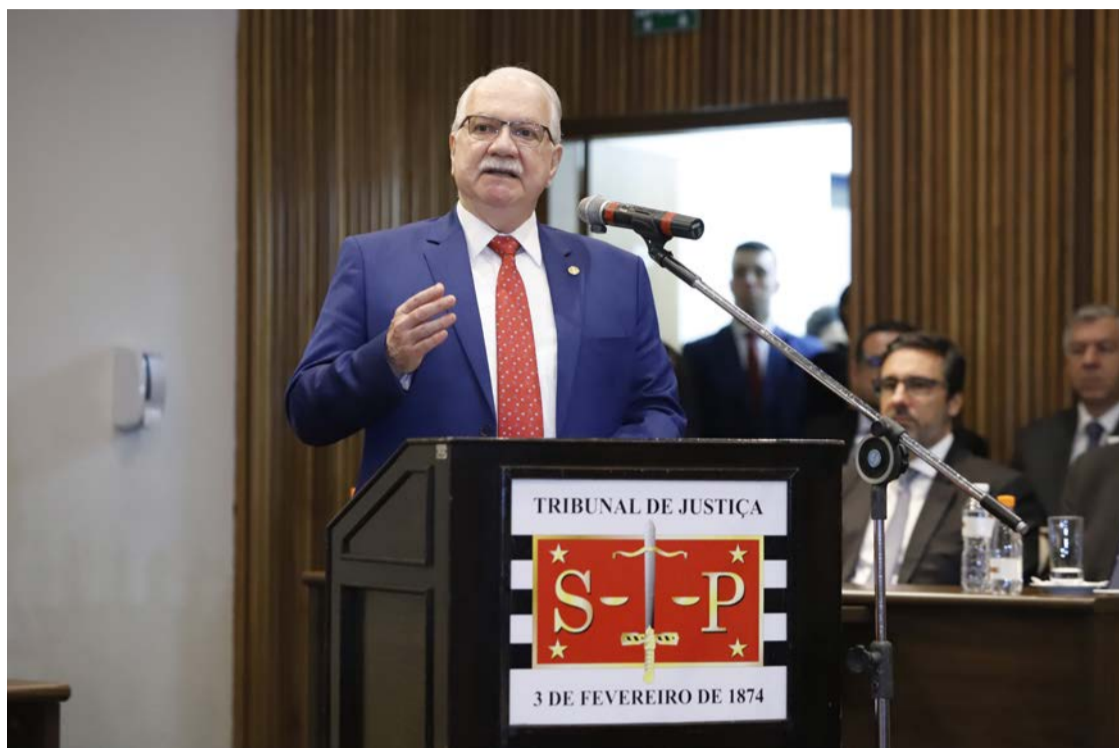
Ministro Edson Fachin diz estar confiante que a soberania do país vai prevalecer

A nova estrutura transforma as atuais 1ª e 2ª Varas de Crimes Tributários, Organização Criminosa e Lavagem de Bens e Valores da Capital em 1ª e 2ª Varas Estaduais de Organizações Criminosas e Lavagem de