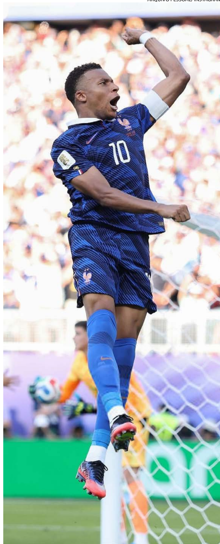
Suspensão no ar: craque recebeu bênção do Rei Pelé

Seria o último tango dele? Aos 35, Messi, maior jogador deste século, ergueu o troféu que lhe faltava. O que mais poderia querer? Pelos campos cataris, andou — sempre discreto, meio desligado, como se não estivesse ali. Deu um drible em todos, pois não deixou a albiceleste.