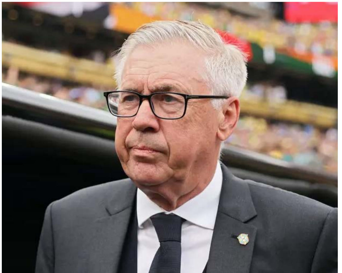
Técnico da Seleção Brasileira, Carlo Ancelotti, está garantido pela CBF até a próxima Copa do Mundo, em 2030

A delegação brasileira retornou ao país menos de 72 horas após a derrota nas oitavas de final. No voo que chegou ao Aeroporto do Galeão, apenas o lateral-direito Danilo estava entre os 26 jogadores convocados.