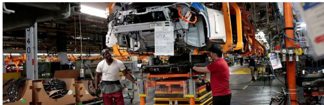
Estimativa representa uma expansão de 11,7% nos emplacamentos de veículos