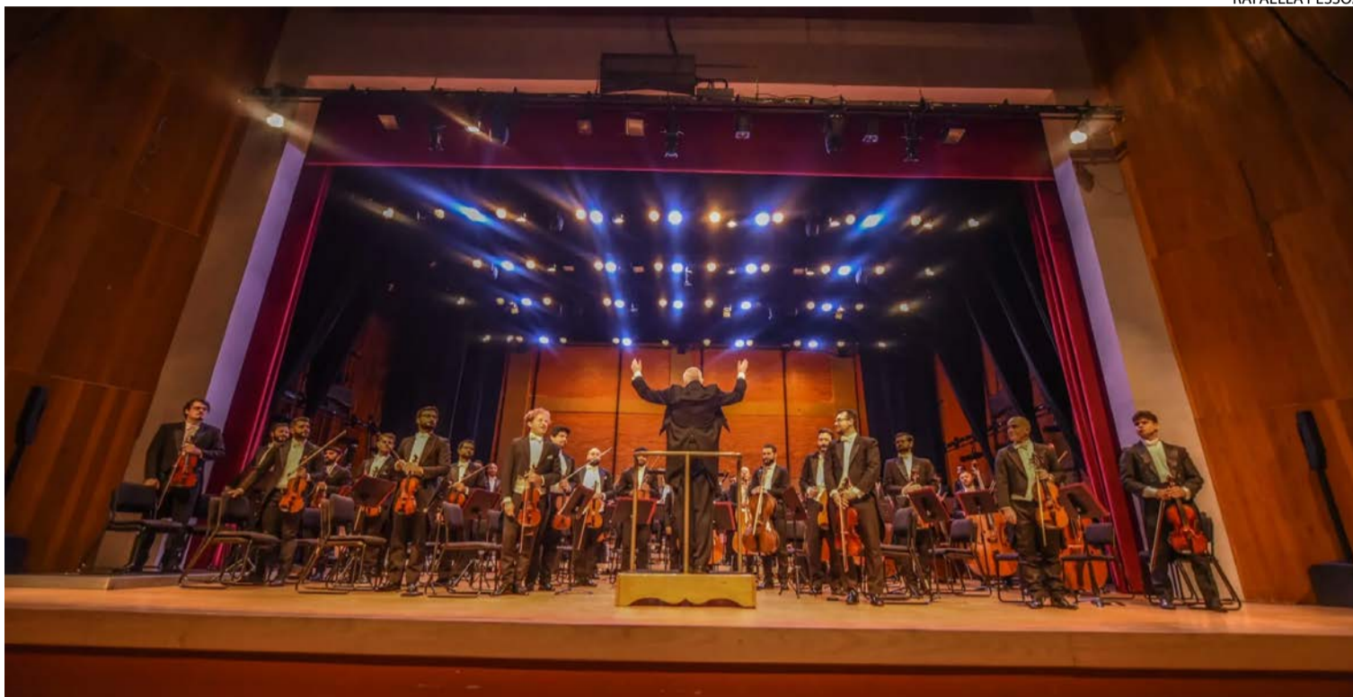
Democratização: concerto reafirma proposta da orquestra de aproximar público de obras sinfônicas fundamentais