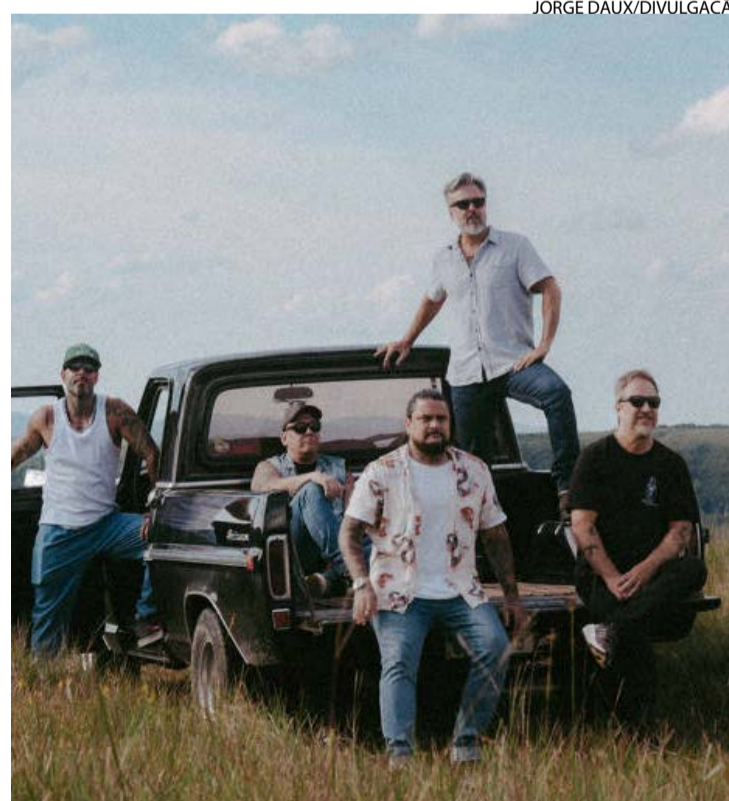
Grupo apresenta letras engenhosas em "Rádio Love Nacional"