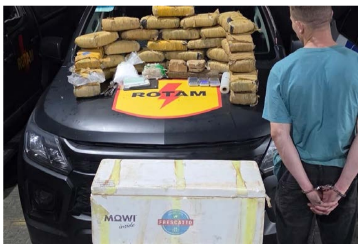
Inteligência artificial auxilia investigação: tecnologia e força policial facilitaram desarticulação da criminalidade

A operação teve início após levantamento do setor de inteligência da Polícia Militar, que identificou um carro branco utilizado para distribuição de entorpecentes. Com base nas informações, a plataforma de inteligência artificial mapeou os trajetos mais frequentes do veículo, permitindo o posicionamento estratégico das viaturas. "Por meio da plataforma, nós mapeamos os locais por onde o veículo suspeito costumava passar.