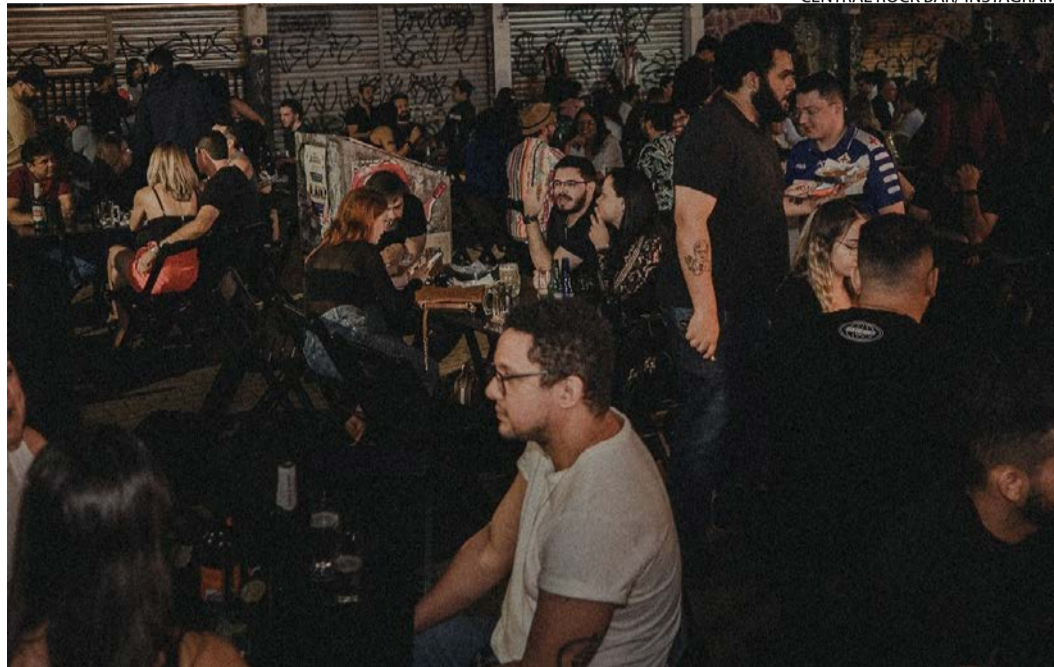
Central Rock Bar: música preenche o ambiente durante a noite urbana

Na última semana, decidi voltar ao Centro de Goiânia com o olhar de quem procura mais do que uma pauta gastronômica. Há lugares na cidade que nos convidam não apenas a experimentar sabores, mas a sentir a própria história. A Rua do Lazer, na tradicional Rua 8, é um desses espaços. Fui atraída pela curiosidade de revisitar um ponto tão emblemático e saí de lá com uma mistura de encantamento e inquietação.