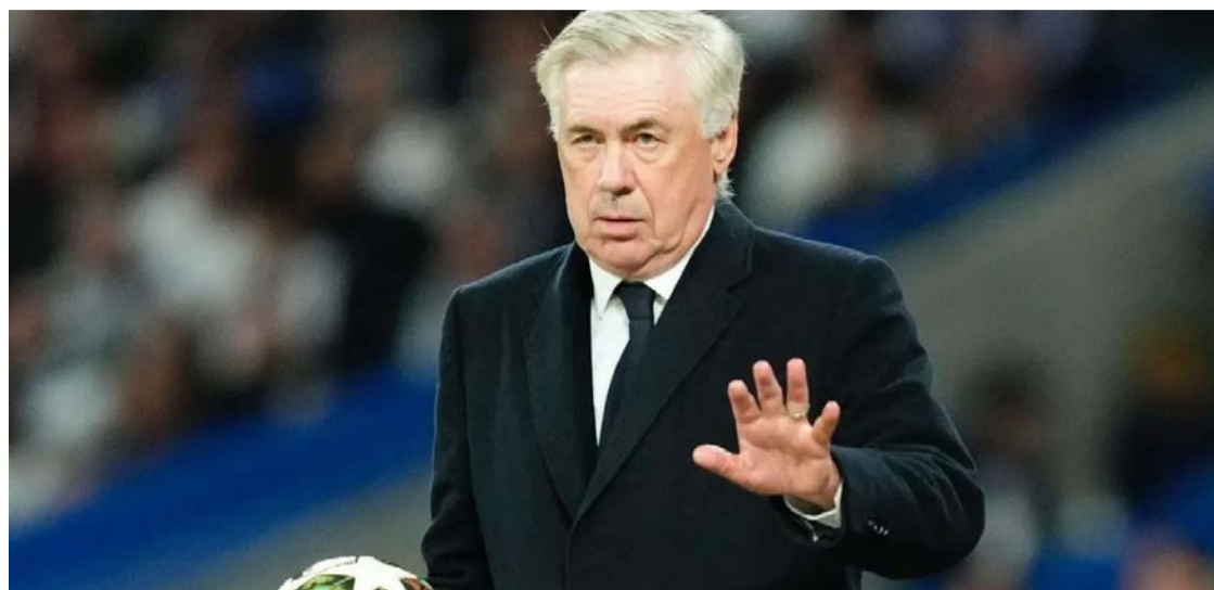
Equipe será comandada por Carlo Ancelotti no torneio que será disputado nos Estados Unidos, Canadá e México

Ainda no recorte entre o público masculino, chama atenção o fato de a França aparecer numericamente à frente do Brasil, com 27% das citações, também em