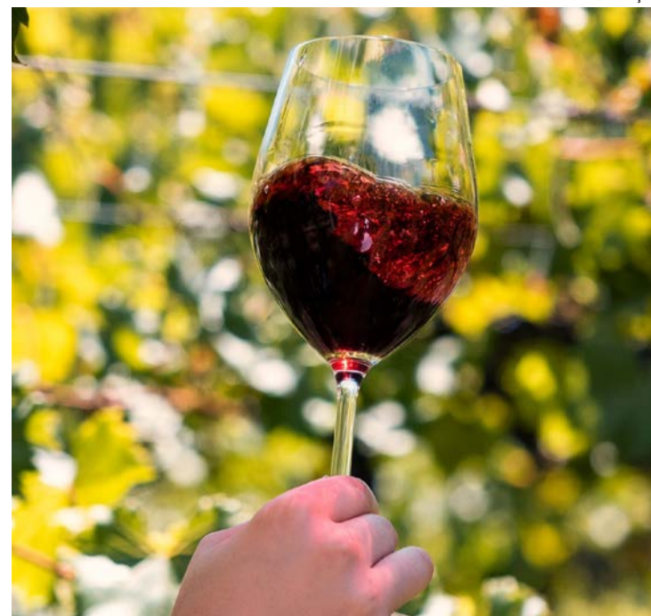
Rótulo apresenta notas de frutas vermelhas