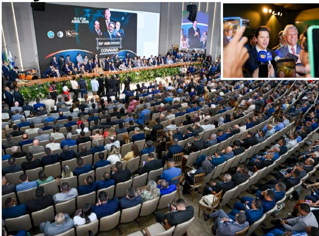
51ª Conemad, em Goiânia, reúne religiosos e autoridades: governador Daniel Vilela e ex-governador Ronaldo Caiado destacam importância da igreja na consolidação moral e espiritual do país