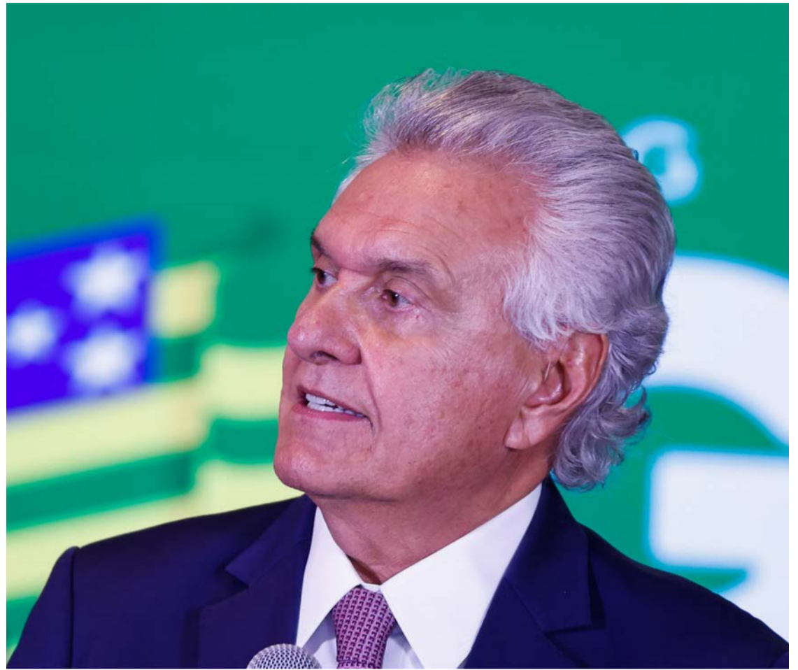
Ex-governador Ronaldo Caiado diz que é possível romper a bolha da polarização

O pré-candidato defendeu que o debate público precisa se concentrar em áreas estratégicas, como educação, saúde, ciência e desenvolvimento econômico. "O Brasil quer discutir ciência, educação, saúde e economia, não ficar preso a debates que não resolvem a vida das pesso-