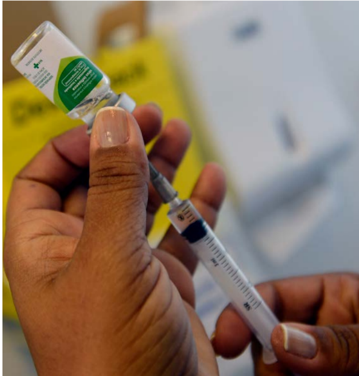
SES ressalta que a vacina disponível segue apresentando eficácia contra casos mais graves

imunização continua sendo a forma mais eficaz de prevenção contra a influenza, inclusive durante períodos de maior circulação do vírus. A vacina contribui para reduzir complicações, internações e mortes associadas à doença.