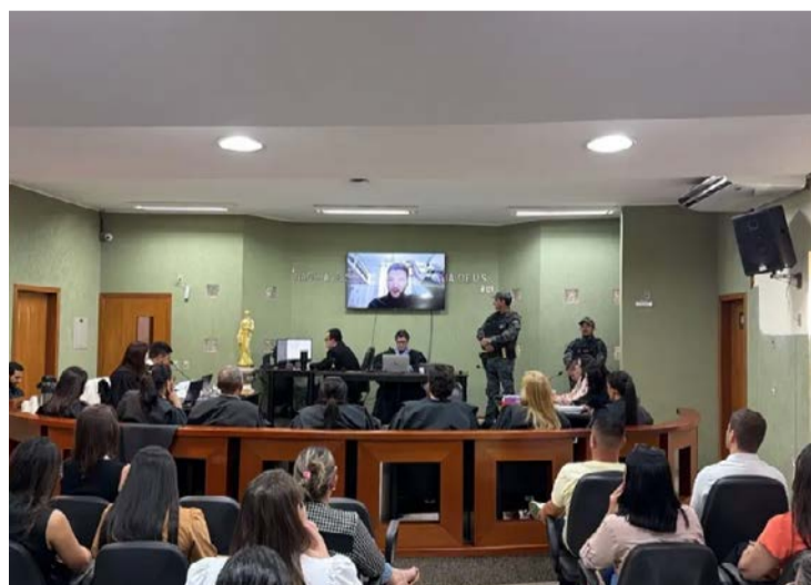
Colisão do caminhão com viatura resultou na morte de quatro policiais

O Ministério Público sustenta que o motorista atuou com imprudência e desrespeitou normas de circulação. A tese se apoia em perícias técnicas que indicam excesso