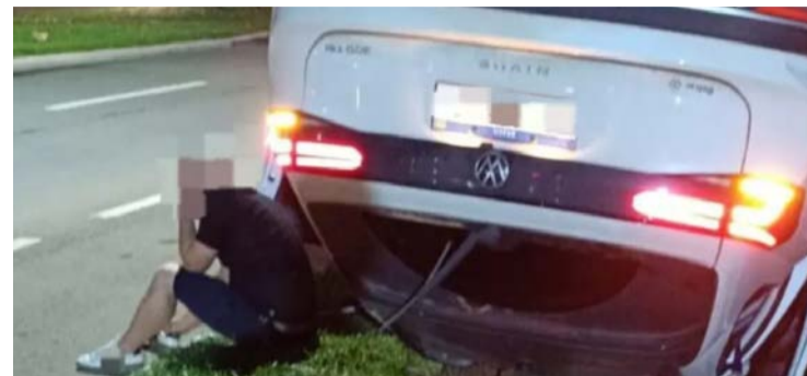
Médico apresentava sinais de embriaguez e recusou o teste do bafômetro

Acidente ocorreu no último sábado e o motorista acabou detido após atropelar motociclista