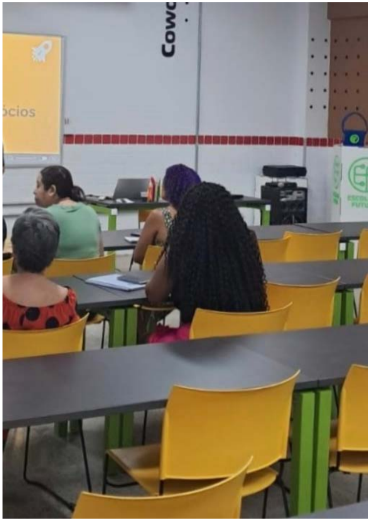
Inscrições são gratuitas e podem ser realizadas até 21 de julho no site oficial

Segundo Mabel, a administração municipal solicitou um novo laudo técnico para avaliar as condições da