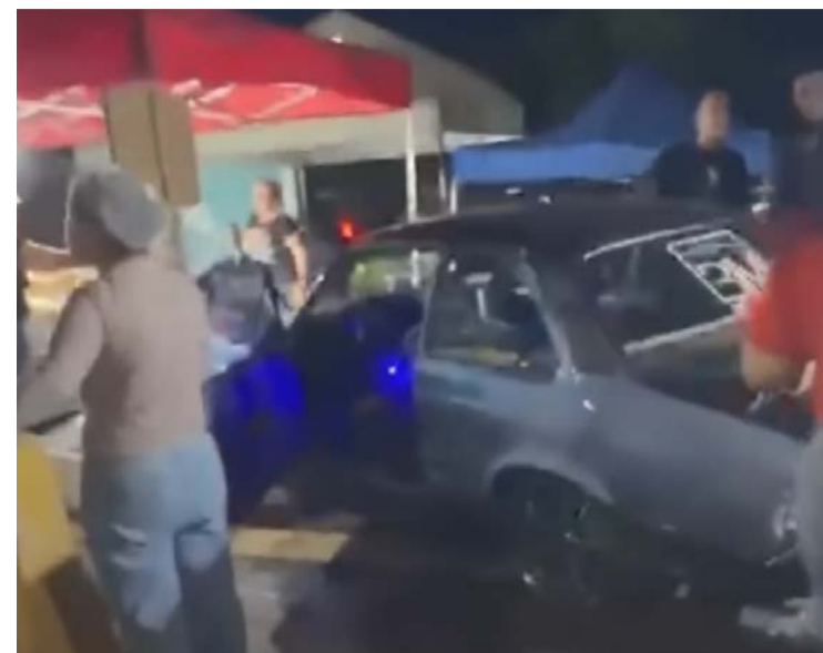
Veículo desgovernado atingiu um romeiro que seguia para Trindade