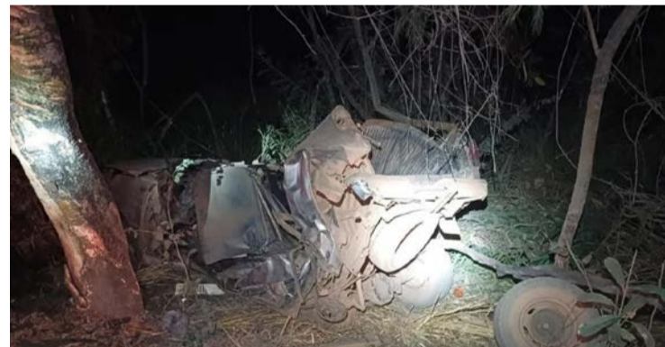
Número de autuações foi superior ao final de semana anterior