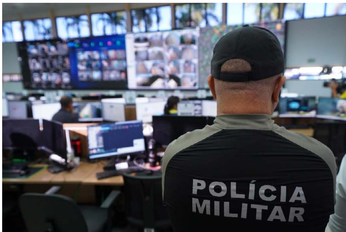
Sistema de reconhecimento facial permitiu localização e a prisão de um foragido: criminoso precisa saber que flagra pode ser instantâneo

O programa IA Contra o Crime, implantado em janeiro de 2026, já contribuiu para o esclarecimento de mais de 1,4 mil ocorrências, envolvendo crimes como homicídios,