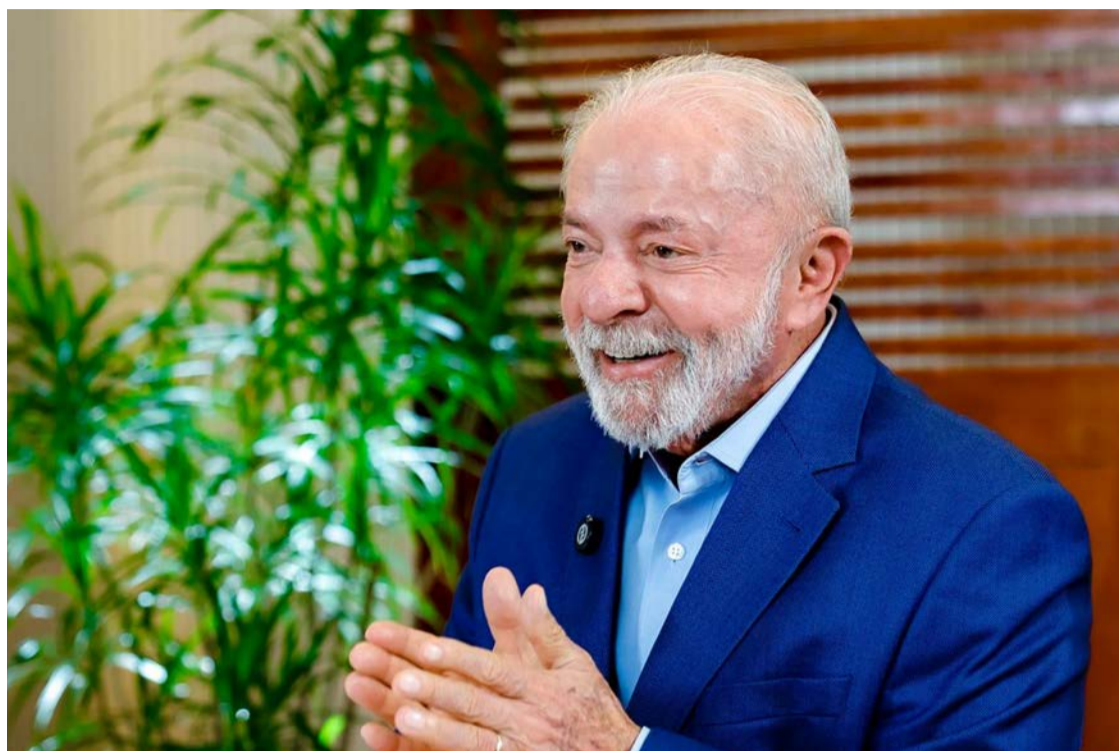
De olho nas eleições, presidente Lula lança nova fase do Desenrola

As operações elegíveis para a nova fase do Desenrola serão as de crédito pessoal não consignado. Para participar, o contrato deverá ter pelo menos quatro parcelas já pagas. Além disso, a dívida deverá estar em dia ou apresentar atraso de, no máximo, 90 dias.