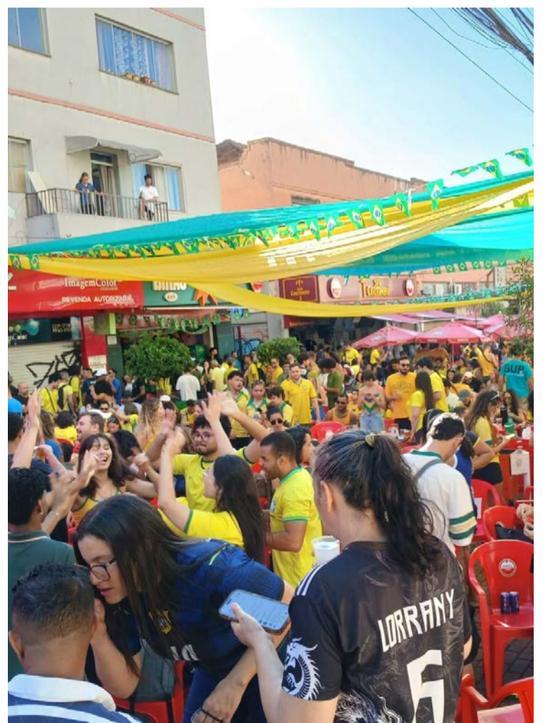
Apesar da partida dramática, o público vibrou com a virada brasileira sobre o time japonês

Foi uma explosão, uma catarse coletiva: cervejas para o céu, abraços em desconhecidos, brindes cúmplices. De repente, a tensão se dissipou em uma bola que ainda esbarrou na trave antes de beijar o véu da noiva. O Brasil, enfim, respirou tranquilo. A festa seguiu.