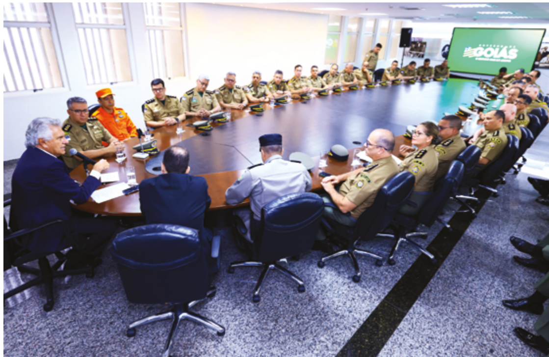
Ronaldo Caiado em reunião com grupo de 35 integrantes da PM pernambucana: troca de informações

“Eu precisava decidir o que seria minha prioridade para governar um estado com