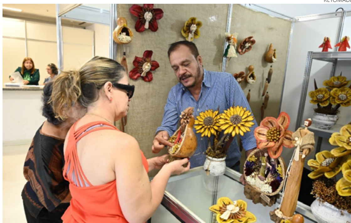
Goiás Feito à Mão leva artesãos e músicos para a Praça Cívica, em Goiânia, de 3 a 5 de dezembro

Durante a programação da feira, o Governo de Goiás e o Sesc Goiás lançarão a Claque Cultural 2025, maior maratona de cultura do país. Com investimento de R$ 21,3 milhões do Governo de Goiás, o festival percorrerá várias cidades goianas levando atrações de artes cênicas, visuais, literatura, música e audiovisual.