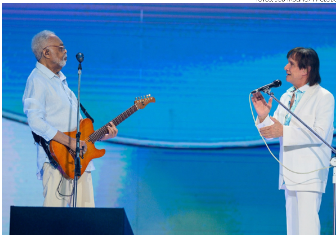
Tropicália e jovem guarda: Gilberto Gil e Roberto Carlos interpretam duas canções em show

Após um especial, no ano passado, com participações