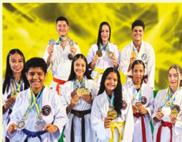
Equipe goiana de Karatê, segundo lugar na classificação geral, com a conquista de seis medalhas de ouro, quatro de prata e três de bronze