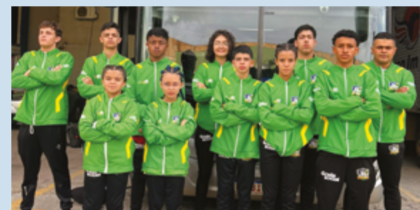
Sete dos dez atletas anapolinos da delegação são integrantes do programa Atleta do Futuro, iniciativa da Prefeitura de Anápolis

O projeto Atleta do Futuro, coordenado pelo professor Jonatas Romeu Muniz, é uma iniciativa realizada em parceria com a Prefeitura de Anápolis que visa identificar, apoiar e formar jovens talentos no esporte. Oferecendo bolsas de incentivo e suporte técnico.