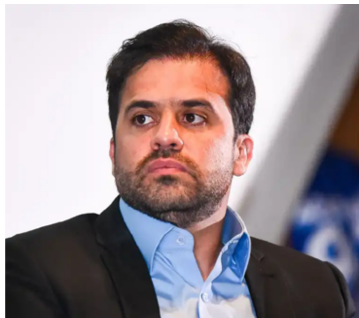
Pablo Marçal: forte presença nas plataformas digitais com milhões de seguidores

Ele já havia tentado concorrer a presidente em 2022, mas desistiu e apoiou Jair Bolsonaro (PL), enquanto seu partido à época, o Pros, aliou-se a Lula (PT). Ainda viu sua candidatura a deputado federal ser indeferida no mesmo ano.