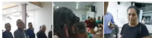
Sites revelam bastidores das igrejas e atitudes e práticas suspeitas da cúpula

Publicado em 29/11/2024, às 15:09 por Redação