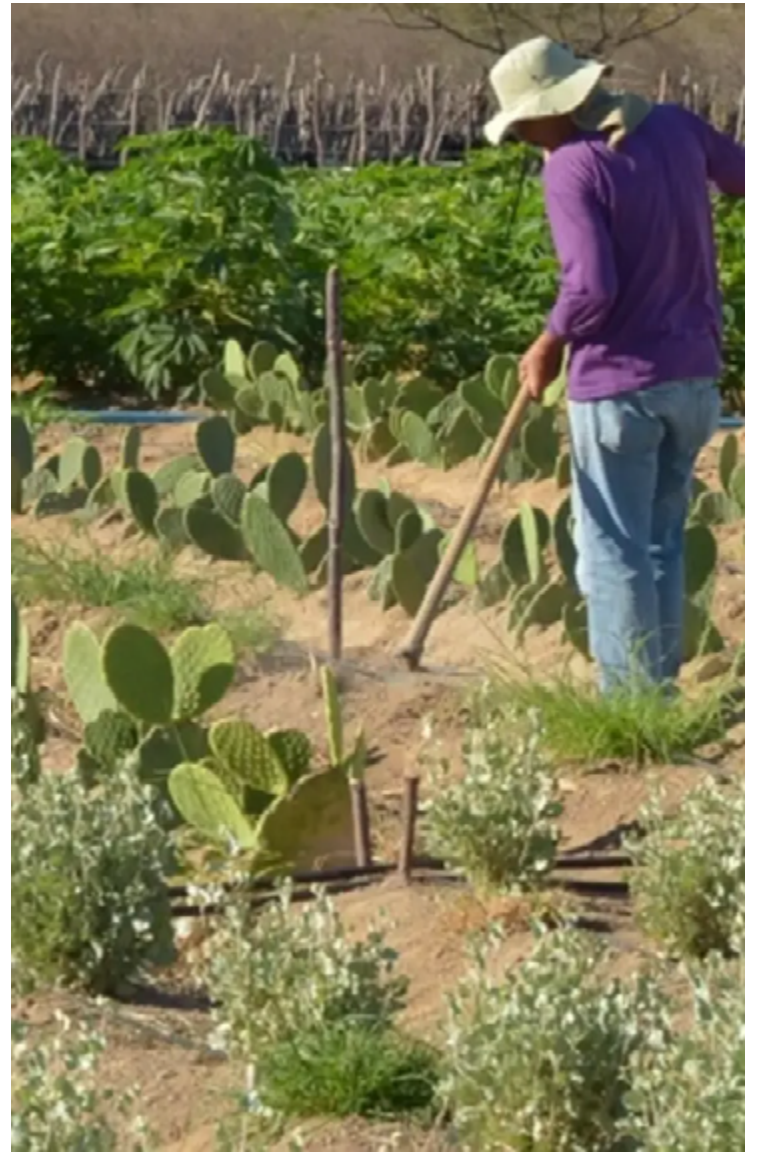
Produtores de pequeno e médio porte também estão sujeitos a uma grande variedade de fraudes e golpes

"Sempre que receber um boleto, o produtor deve verificar