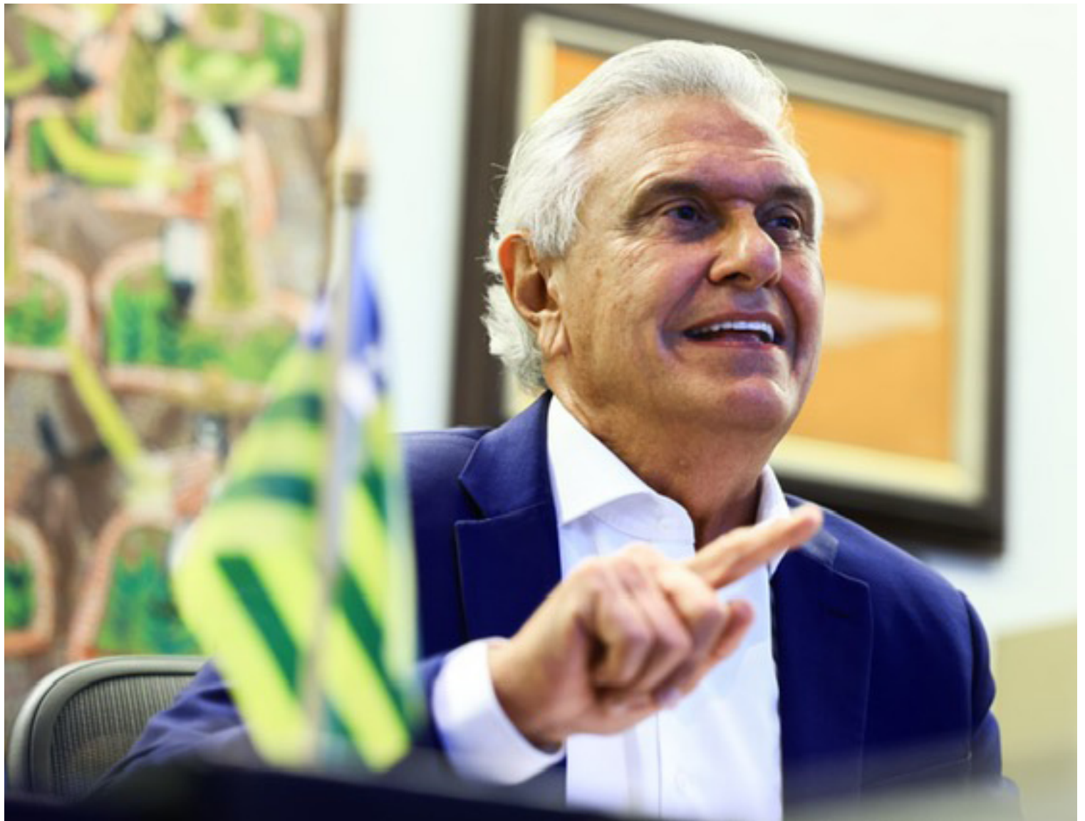
Ronaldo Caiado: gestão eficiente em Goiás projeta nome para a disputa presidencial

pré-candidatura está marcado para fevereiro do próximo ano, pela necessidade de ganhar tempo devido ao tamanho do eleitorado goiano, que representa apenas cinco milhões de eleitores, conforme justificou: “Não tenho o luxo, como Tarcísio de Freitas (Republicanos) de poder esperar até 2026 para me decidir.” Caiado também vê 2026 como uma oportunidade estratégica, apostando na queda de popularidade do presidente Lula (PT) e na possível desintegração da aliança de alguns integrantes do União Brasil com o governo petista.