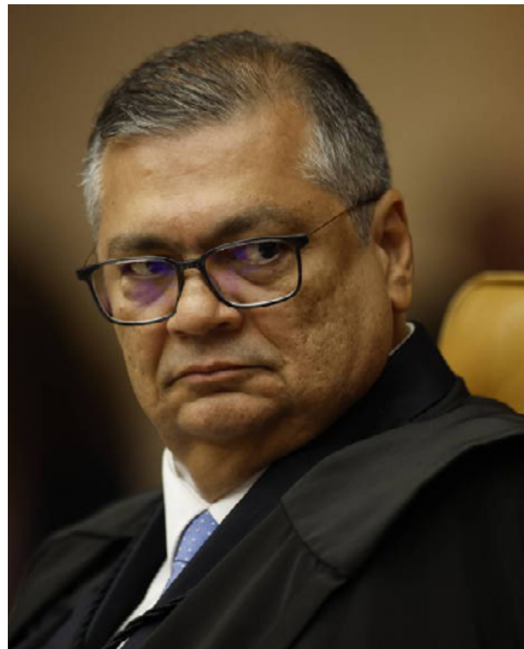
Flávio Dino: fim das emendas do "orçamento secreto" do Congresso Nacional

nheiro, o Congresso aprovou projeto de lei —sancionado sem vetos pelo presidente Lula (PT)— que muda parte das regras de distribuição a partir do