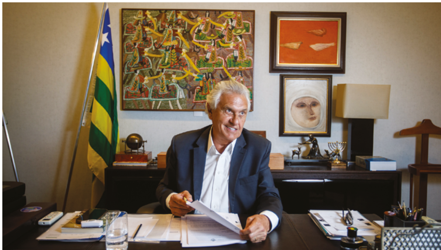
Ronaldo Caiado se diz certo de que a eleição deste ano prova o poder da direita como catalisadora dos anseios da maioria da população e “que dela não há dono”

A análise do jornalista aponta para uma possível candidatura a Presidente, em condições mais favoráveis que a enfrentada por Ronaldo Caiado quando disputou a eleição de 1989, tendo como adversários outros 21 pretendentes, entre eles Luiz Inácio Lula da Silva (PT), Afif Domingos (PL), Aureliano Chaves (PFL), Leonel Brizola (PDT), Mário Covas (PSDB), Paulo Maluf (PDS), Ulysses Guimarães (PMDB) e Fernando Collor de Mello (PRN), eleito presiden-