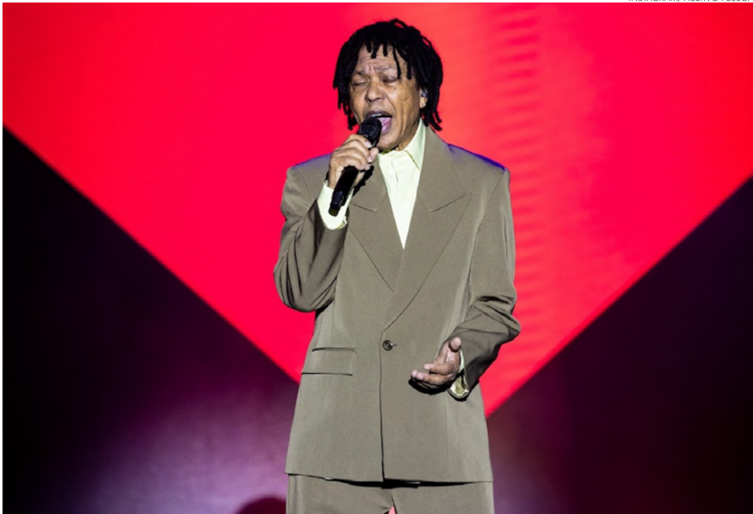
Djavan se apresentou em Goiânia no Centro de Convenções da PUC, em junho: público ovacionou cantor e compositor

Pesquisa ouviu 2.494 pessoas de 16 a 65 anos, divididas entre todas as regiões do Brasil. Dados revelam que 97% dos entrevistados disseram ter realizado alguma atividade cultural neste ano. Música é a preferida