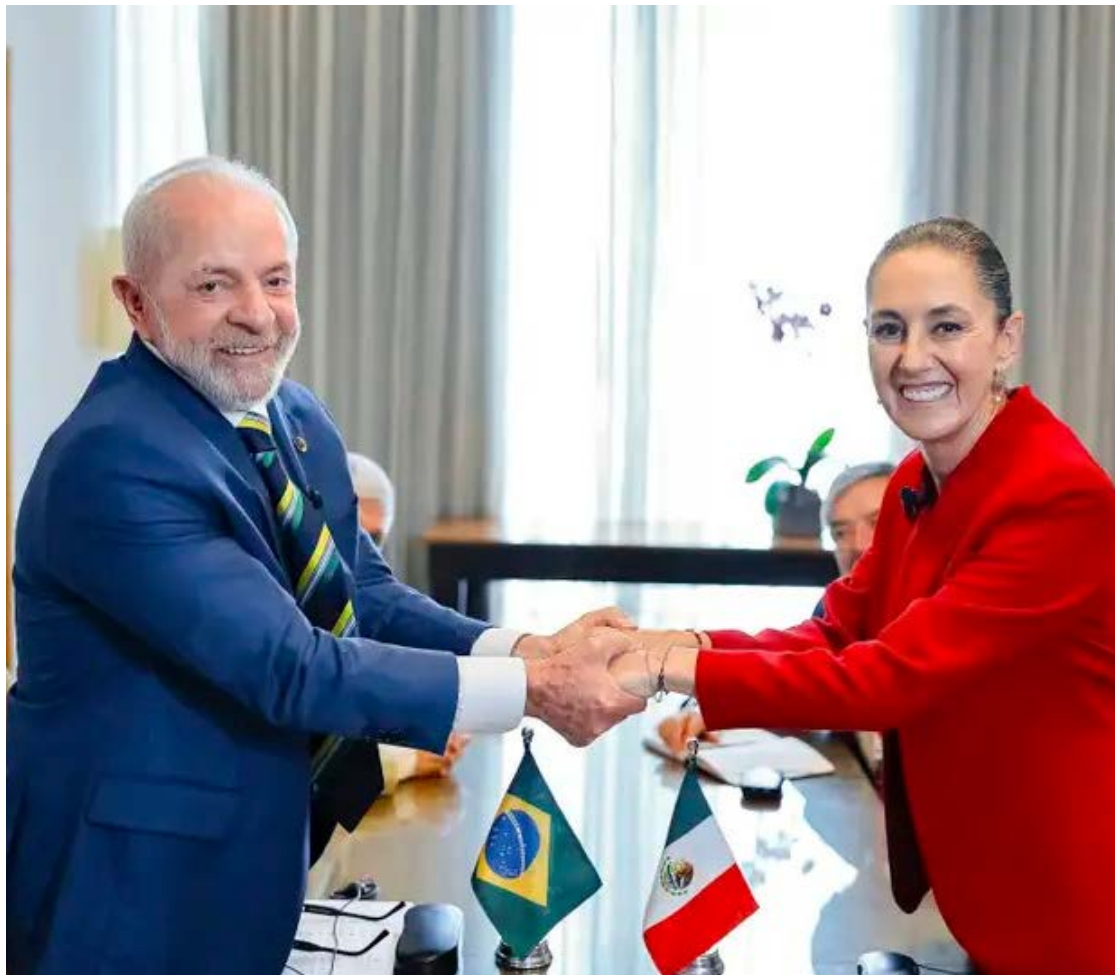
Presidente Lula durante encontro bilateral com presidenta do México Claudia Sheinbaum, em evento em Honduras

O deputado é da ala governista do União Brasil,