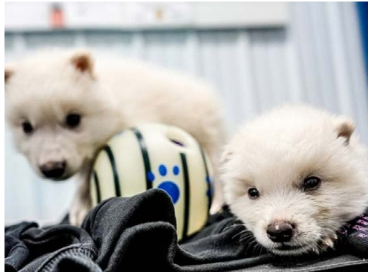
Lobo terrível vive bizarra polêmica: famoso predador pré-histórico pode ter sido recriado

Até agora nenhum cientista antagonista teve acesso aos dados da pesquisa