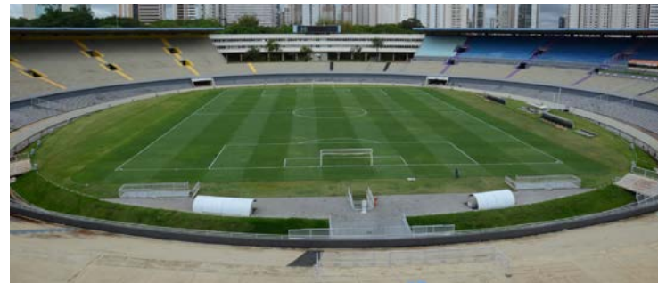
Serra Dourada volta a ter 'vida' e será em breve revitalizado: antes era ponto de atividades clandestinas

Outro projeto de destaque é a Escola do Esporte, que unirá ensino em tempo integral com formação esportiva. Inspirada nas Escolas Militares e na Escola do Futuro, a iniciativa oferecerá estrutura aos atletas.