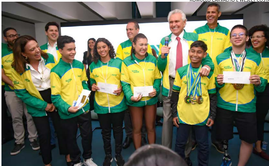
Ronaldo Caiado e Gracinha anunciam aumentos no Pró-Atleta: Goiás terá bolsa internacional de R$ 2 mil mensais

Este ano, atletas de 60 municípios e 55 modalidades foram contemplados. Os repasses de janeiro a março já foram efetuados. O investimento previsto para 2025 é de R$ 3 milhões, com um total acu-