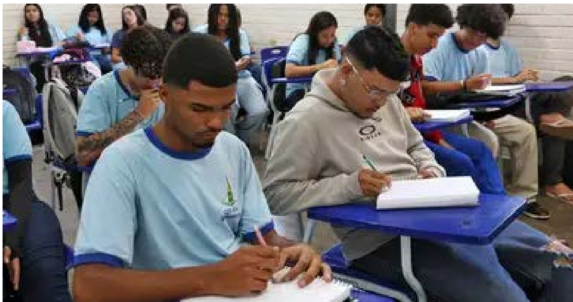
País retrocede no atendimento daqueles que não conseguiram estudar na idade adequada

Mesmo tendo uma população de mais de 9,3 milhões de analfabetos com mais de 15 anos, o Brasil teve um encolhimento da EJA