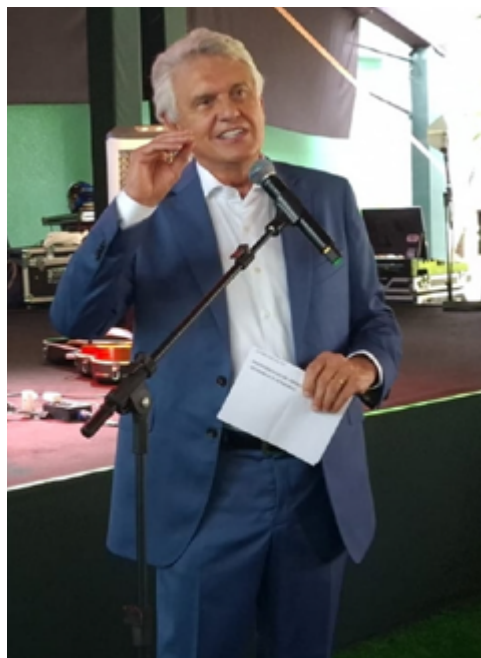
Ronaldo Caiado durante confraternização: "Sou governador aberto ao diálogo, que valoriza sugestões"

Além de imprensa e sua missão, Caiado falou muito sobre goianidade. "Nunca deixei de