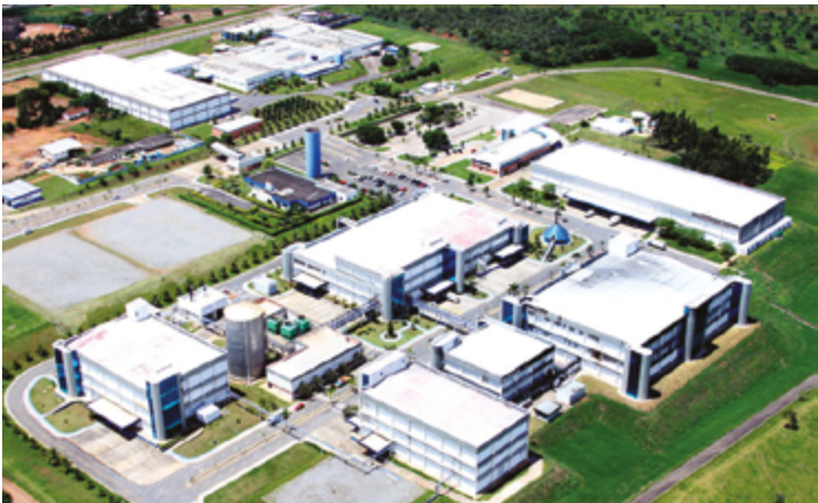
Teuto, em Anápolis: medicamentos biossimilares são desenvolvidos após vencimento de patentes dos biológicos originais e demandam tecnologias avançadas para garantir sua eficácia e segurança

Por sua vez, o Pegneucity é um biossimilar de pegfilgrastima, e seu uso tem como objetivo reduzir o risco de infecções graves em pacientes submeti-