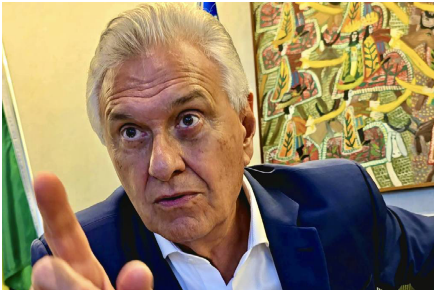
Ronaldo Caiado: protagonismo do governador de Goiás desperta reação do bolsonarismo

No mesmo evento, comentou sobre o indiciamento de Bolsonaro pela Polícia Federal, afirmando que "a vida continua", e criticou a falta de