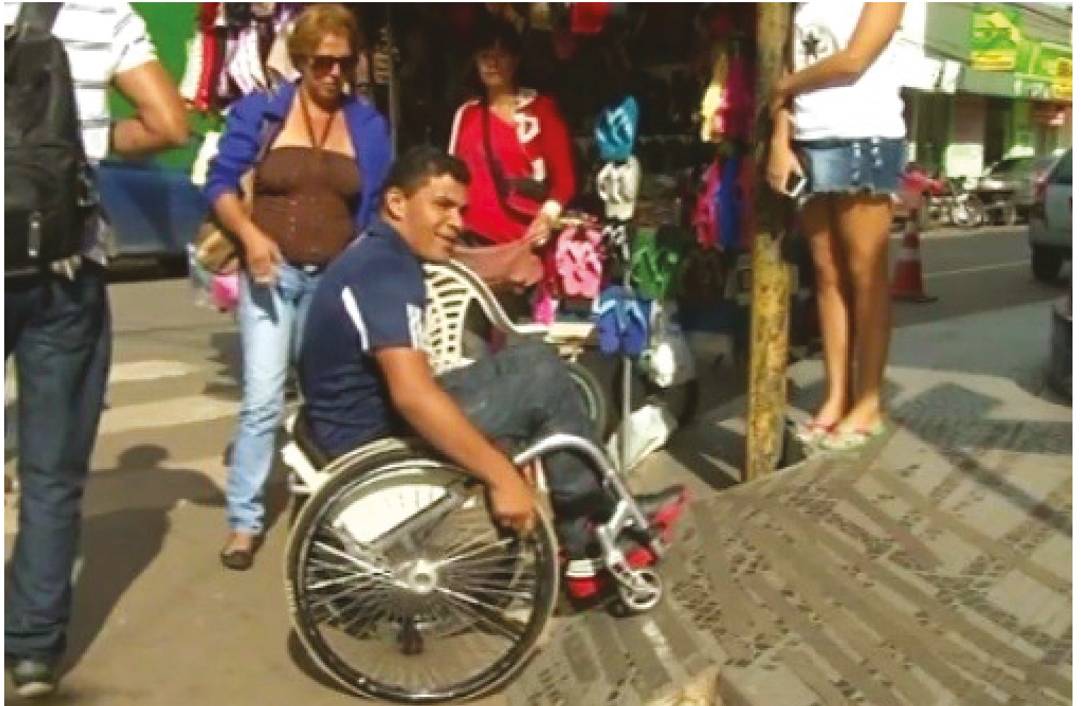
Há, aproximadamente, 1 bilhão de pessoas com deficiência no mundo; no Brasil, cerca de 24% da população apresenta algum tipo de privação

Como se não bastasse esse cenário de desequilíbrio, os preconceitos e estereótipos persistem, limitando oportunidades e excluindo pessoas com deficiência da sociedade.