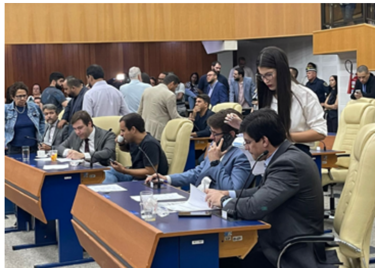
Vereadores aprovam a chamada Taxa do Lixo