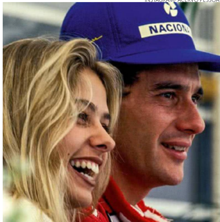
Apresentadora recebeu elogios dos fãs nas redes sociais