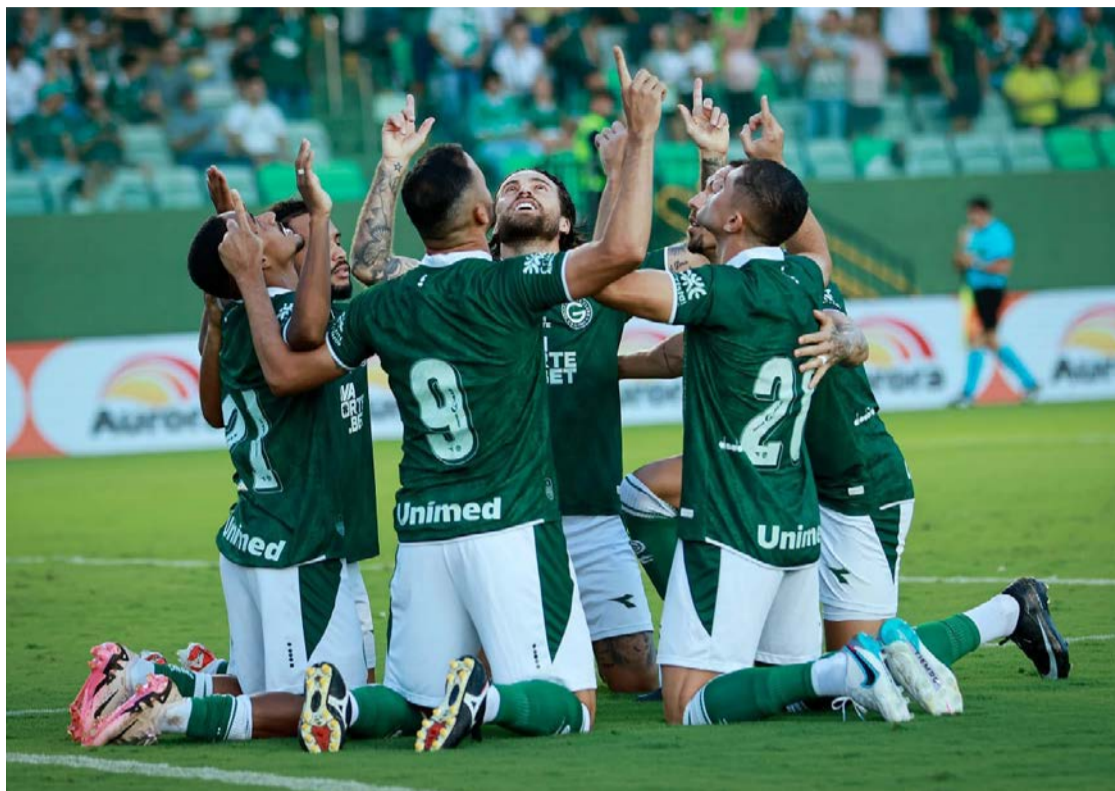
Goiás, campeão goiano invicto, segue sem perder na Copa do Brasil e na Série B