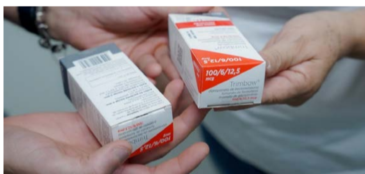
Paciente atendida pelo Cemac JB apresenta medicação da terapia tripla inalatória

A DPOC é uma condição que compromete o funcionamento dos pulmões e provoca sintomas como falta de ar, cansaço frequente e crises respiratórias. A doença está associada principalmente à bronquite crônica e ao enfisema pulmonar e pode levar a internações recorrentes quando não tratada de forma adequada. Nesse contexto, a ampliação do acesso ao tratamento representa um avanço na assistência a pacientes com doenças respiratórias crônicas.