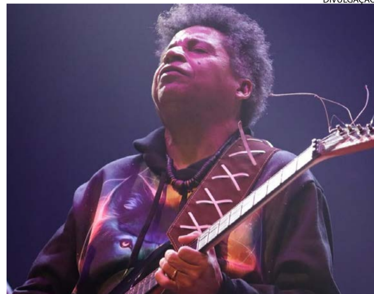
Guitarrista Emídio Queiroz é atração do evento