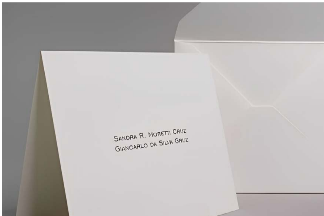
Cartão social: pequeno no tamanho, mas imenso no significado

Em um mundo acelerado, onde tudo se resolve em segundos, o cartão manuscrito resgata o tempo do cuidado com gesto simples e duradouro