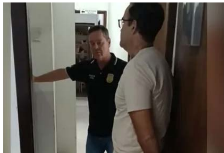
Médico dizia ser médium durante os atendimentos realizados

Profissional é investigado por crimes sexuais contra mais de 30 mulheres no RS