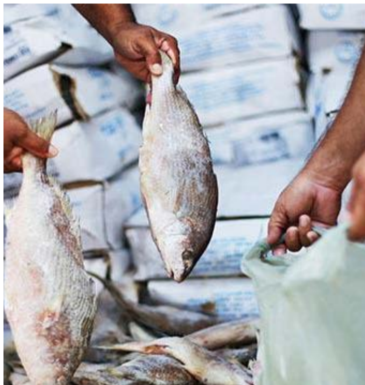
A tradição católica de se abster de carne vermelha na Quarta-feira de Cinzas e na Sexta-feira Santa serve como preparação para a Páscoa

A reportagem do DM Online conversou com a