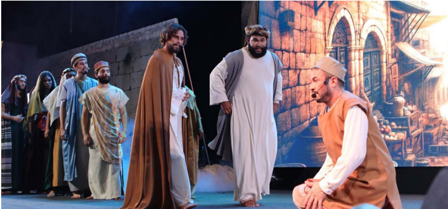
Peça será encenada neste sábado (4/4) no Auditório do Instituto Esperança, em Aparecida de Goiânia