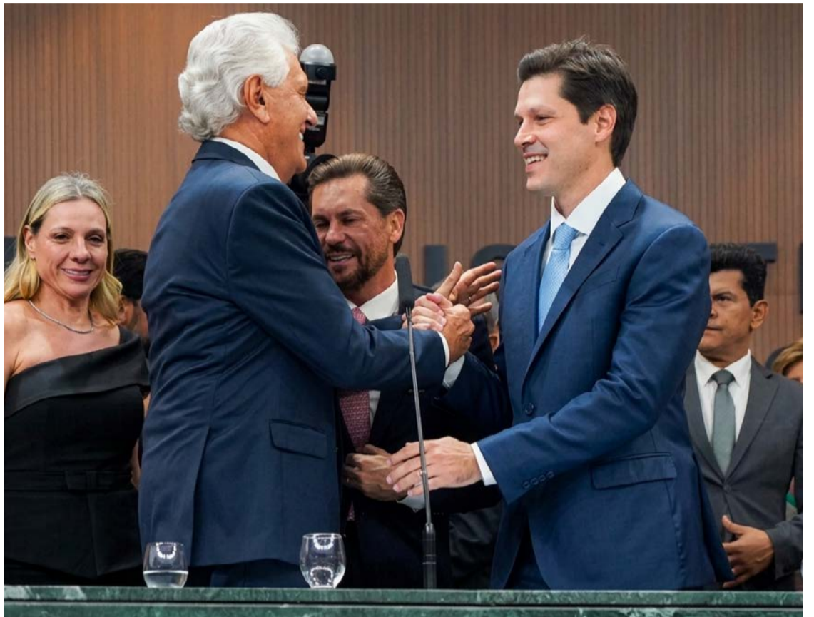
Governador Daniel Vilela durante ato de posse na Assembleia Legislativa de Goiás

A segurança pública também ocupou espaço central no discurso. Daniel destacou a mudança no cenário da criminalida-