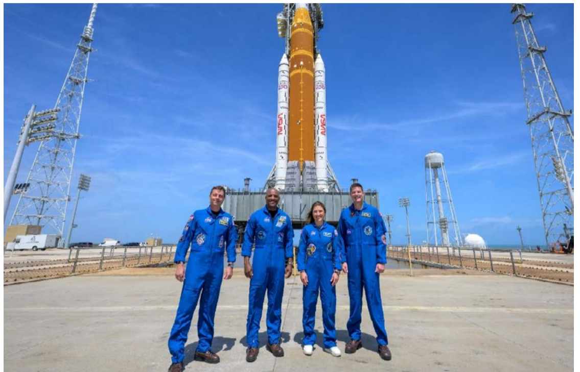
Equipes da Nasa finalizam preparativos para o lançamento da missão Artemis II

A Artemis II será a primeira missão tripulada do programa Artemis e tem como principal objetivo levar quatro astronautas em uma viagem ao redor da Lua, sem pouso. Durante cerca de dez dias, a cápsula Orion testará, em condições reais, sistemas fundamentais como suporte de vida, comunicação e navegação em espaço profundo — elementos essenciais para futuras missões que preten-