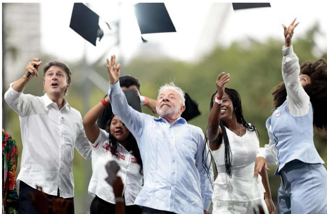
Lula participa de solenidade de celebrações do ProUni e da Lei de Cotas, no Anhembi

Lula criticou especificamente a invasão da Venezuela, afirmando ser um