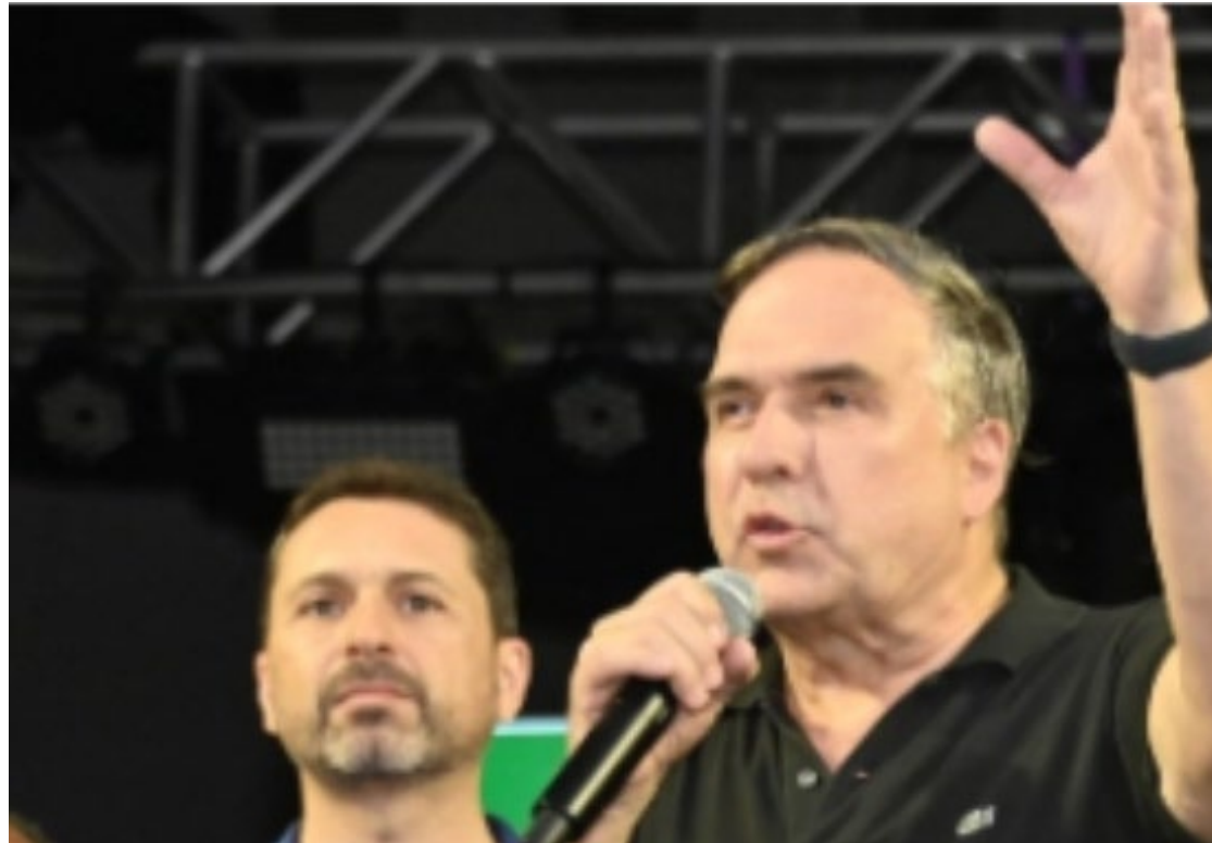
Governo e Prefeituras de Goiânia e Aparecida anunciam medidas contra dengue: gestores começam ações

O mutirão, que se estenderá ao longo da semana, contará com equipes de agentes comunitários de saúde realizando visitas domiciliares para orientar a população sobre medidas de