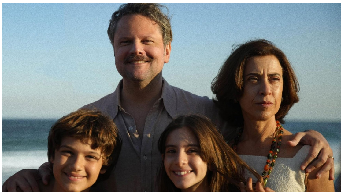
Memória viva: longa-metragem retrata violência que destruiu família na ditadura

ela não ficou entre as indicadas ao SAG Awards, o prêmio do Sindicato dos Atores, que costuma ser um termômetro — bastante fidedigno, aliás — para a festa máxima do cinema mundial. O mesmo aconteceu lá atrás com Montenegro, em 1999.