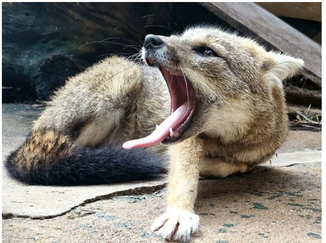
Juca forma casal com Mel: raposas do Cerrado chegaram ao zoológico em novembro

A introdução do casal foi planejada para coincidir com a semana de volta às aulas, quando o movimento de visitantes no parque é menor, variando entre 500 e 1.000 pessoas por dia.