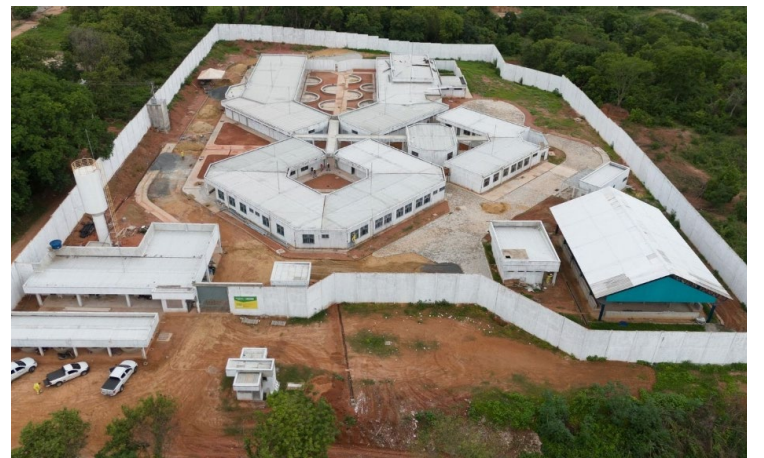
Obra em Porangatu: aulas de informática e biblioteca para recuperação de jovens

Cada unidade contará com 52 alojamentos individuais, equipados com banheiros exclusivos, além de refeitório, lavanderia, recepção, áreas administrativas e estacionamento. Os internos também terão acesso a salas de aula, laboratório de informática, biblioteca, espaços para atendimentos médicos e uma quadra poliesportiva coberta com vestiários.