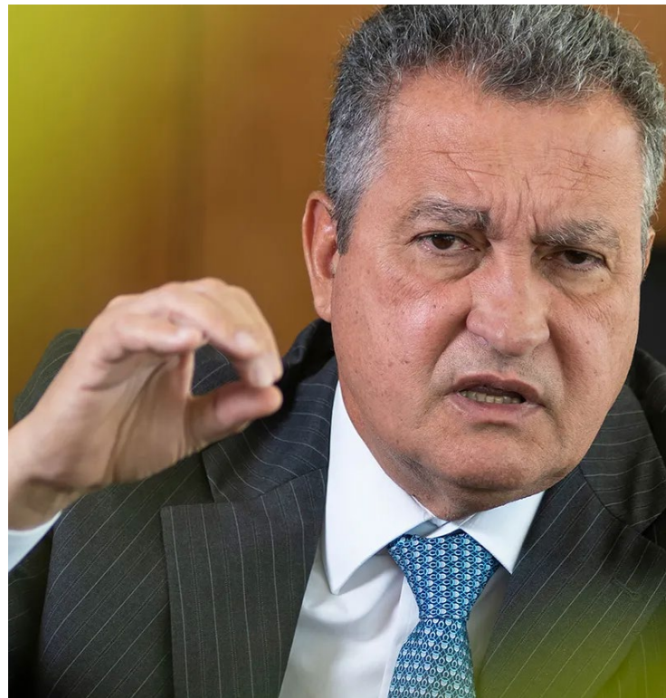
Rui Costa: oposição no Congresso “é despreparada, vazia”

O presidente se irritou com a condução da crise. Tanto ele quanto a Casa Civil afirma que não tinham conhecimento da medida até a repercussão nas redes sociais.