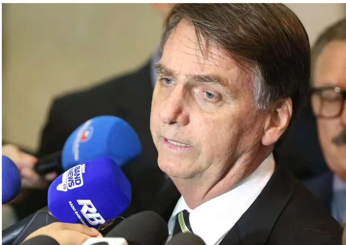
Jair Bolsonaro: eleições não serão democráticas se ele ficar não participar

Ao falar sobre a investigação da Polícia Federal que culminou em seu indiciamento por suspeita de golpe de Estado em 2022, o ex-presidente comparou uma suposta perseguição dos democratas aos republicanos nos Estados Unidos, com, no Brasil, a dinâmica entre o seu partido e o PT, afirmando