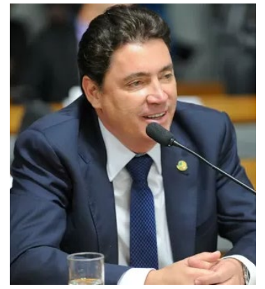
Senador Wilder Morais