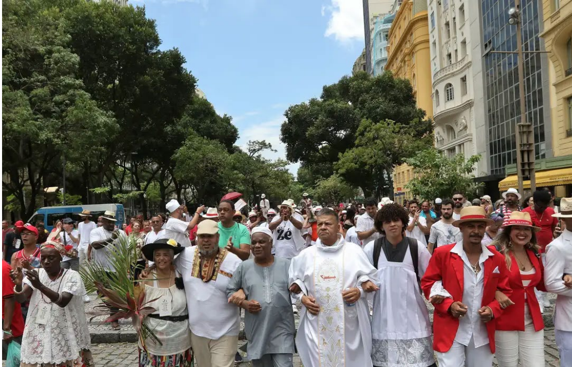
Dados representam uma alta de 66,8% em relação às denúncias anuais

Em 2024 foram registradas em todo o país 2.472 denúncias de casos de intolerância religiosa pelo Disque Direitos Humanos (Disque 100), do Ministério dos Direitos Humanos e da Cidadania (MDHC)