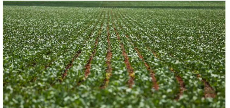
Soja, com 20 milhões de toneladas, sobressai aos demais cultivos

Produção deve alcançar 34 milhões de toneladas. Entre os fatores que colaboraram para o bom desempenho, está o volume de chuva estável