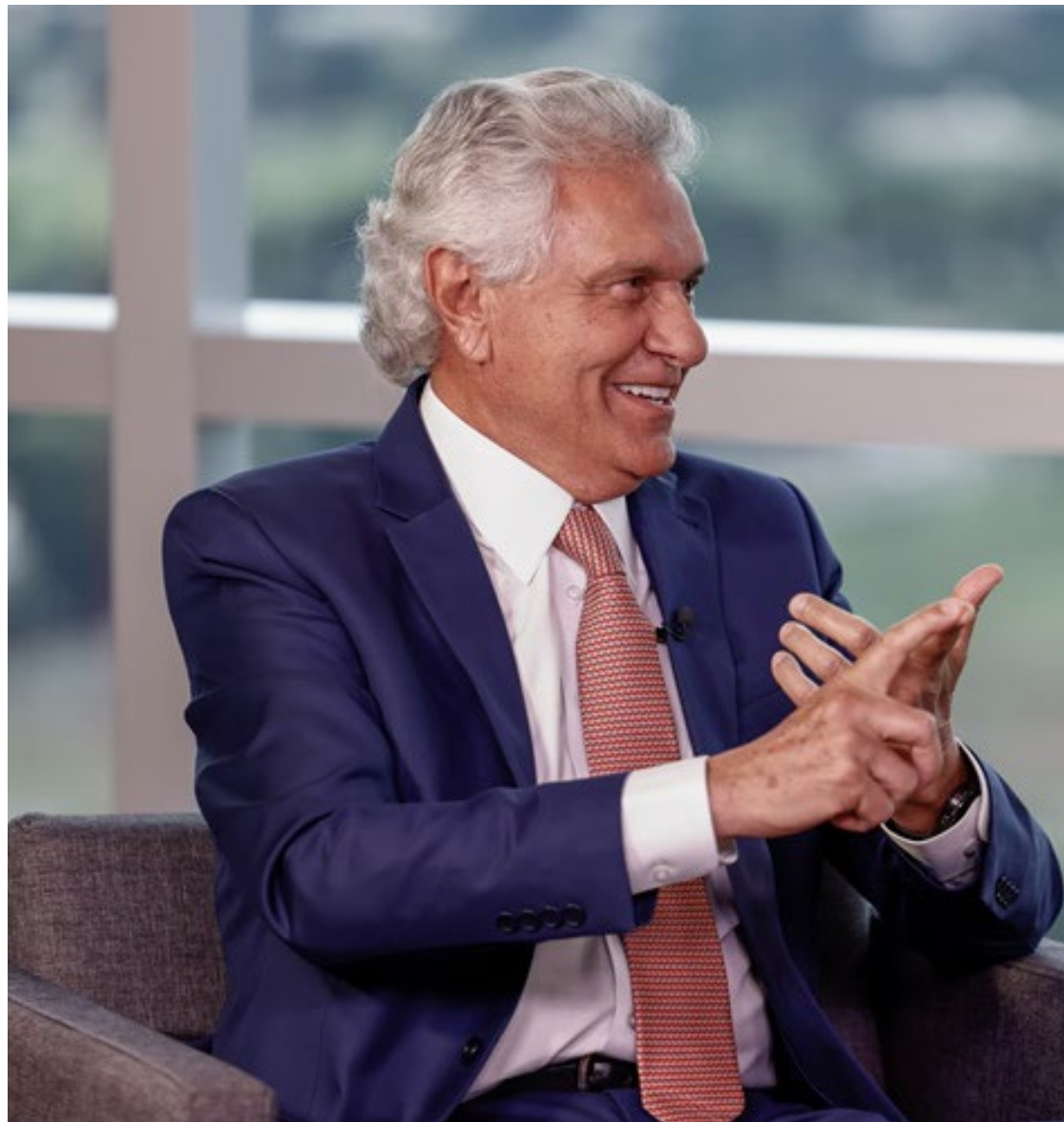
Ronaldo Caiado: busca de amplo apoio de todos os segmentos da sociedade brasileira

Os partidos do centro saíram vitoriosos nas eleições de