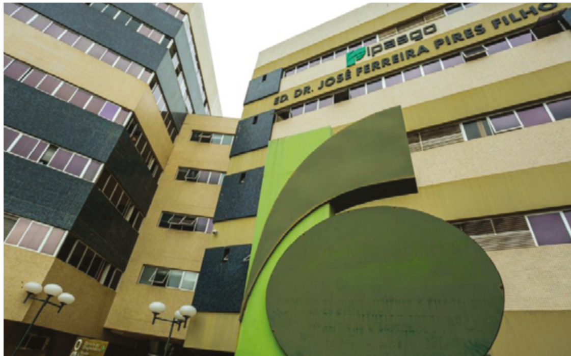
Programa de Atenção Farmacêutica, implantado com objetivo de melhorar o acesso aos tratamentos

O novo serviço atenderá tanto beneficiários que residem na capital, onde a entrega será realizada em até cinco dias úteis, quanto aqueles que vivem no interior, cujo prazo para recebimento é de até sete dias úteis. Além da tranquilidade de receber o medicamento no prazo certo, sem qualquer custo adicional