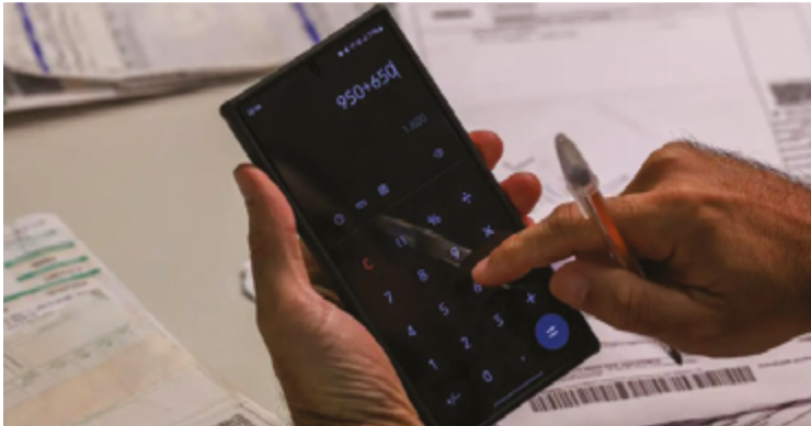
Impacto das apostas on-line começa a se refletir nos indicadores econômicos

Inadimplência cresce 2,47% e FCDL destaca reflexos das apostas nas finanças das famílias goianas