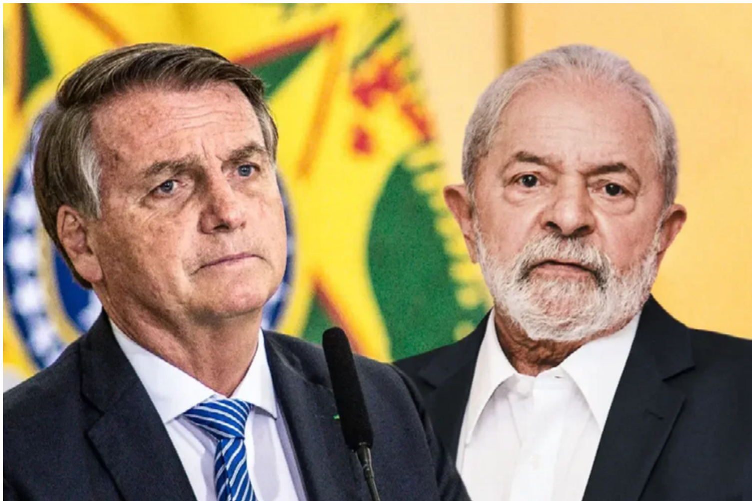
O embate entre Jair Bolsonaro e Lula da Silva no segundo turno das eleições municipais

Com a derrota do atual prefeito, Edmilson Rodrigues (PSOL), que terminou em terceiro lugar no primeiro turno em Belém, Lula apoia a candidatura do deputado estadual