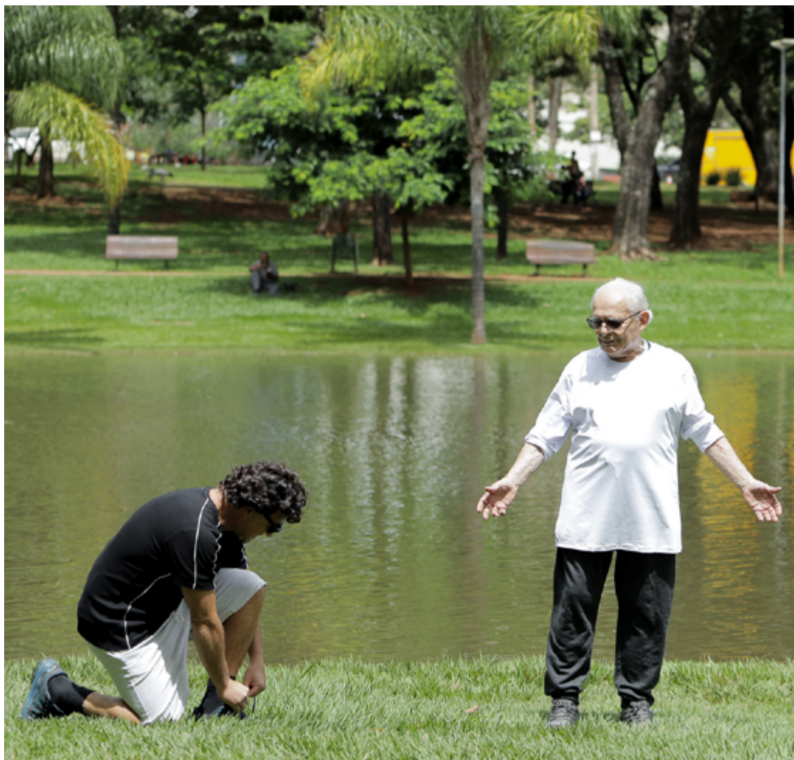
Atores levaram química para a telona em obra que emociona espectador