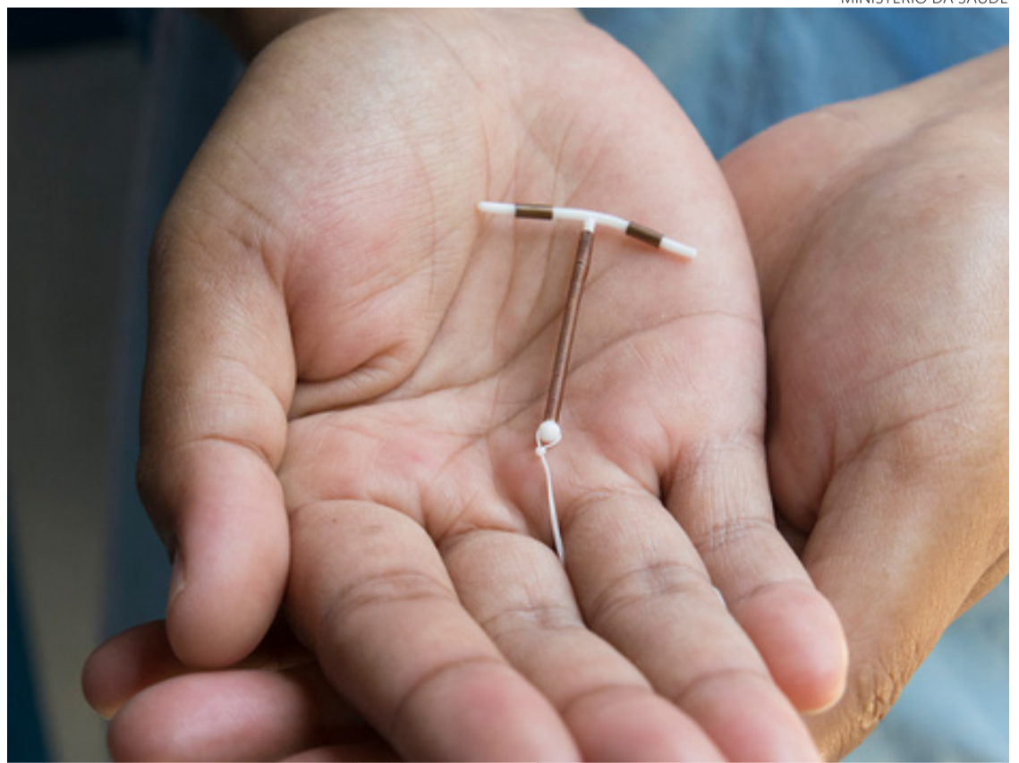
Risco de desenvolver doença é 1,4 vez maior do que quem não usa contraceptivo

A pesquisa considera aspectos como escolaridade, número de filhos, idade e condições médicas da mulher. Por outro lado, não leva em conta alguns fatores que podem influenciar no surgimento do tumor, como peso, consumo de álcool, tabagismo e prática de atividade física.