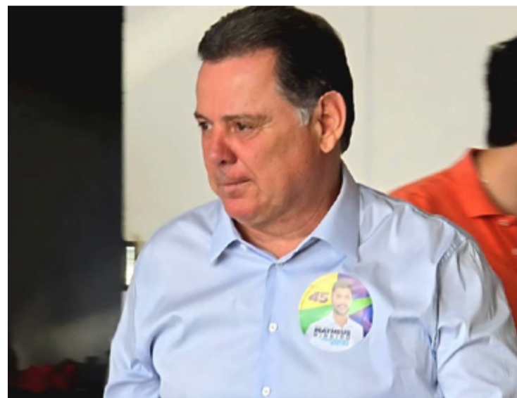
Marconi Perillo: fora do segundo turno em Goiás