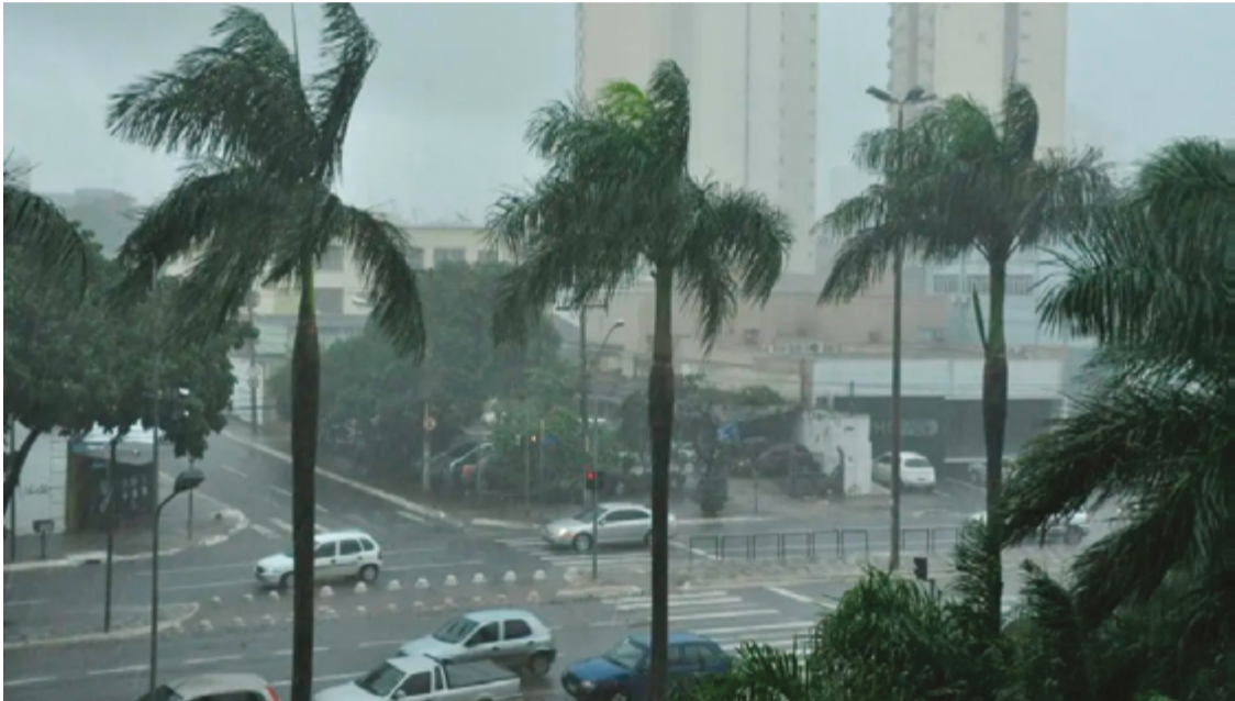
Centro de Informações Meteorológicas e Hidrológicas de Goiás, diz Equatorial, prevê chuvas de até 60mm

A companhia lembra o impacto que as tempestades, acompanhadas de descargas atmosféricas provocam sobre a infraestrutura elétrica. Os raios podem causar interrupções no