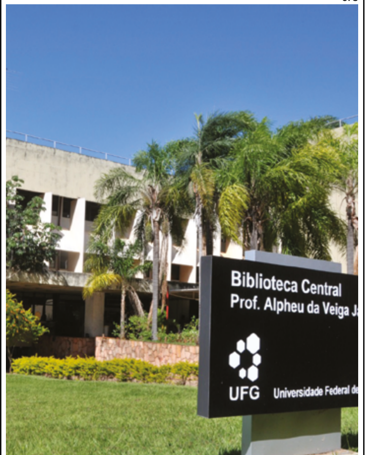
Objetivo é criar tecnologias de ponta que beneficiem a sociedade em áreas prioritárias como saúde, educação e segurança, entre outras