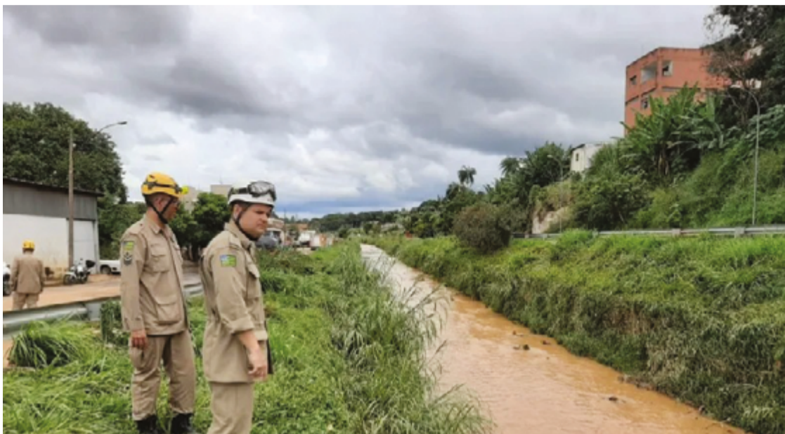
Estratégia de ação da defesa civil é: época de seca, ações preventivas; época de chuva, ações de resposta

É quando não está chovendo que a gente tem a prevenção como sendo o nosso foco. Ou seja, a gente vai para dentro de escola para fazer palestras, de levar conhecimento para as crianças, que isso aí com certeza elas conseguem levar para dentro de casa também, sobre como elas podem se preparar para o período de anormalidade. Ou seja, esse período que vem com chuvas fortes, tempestades. E depois que começa esse período, aí a gente já entra no