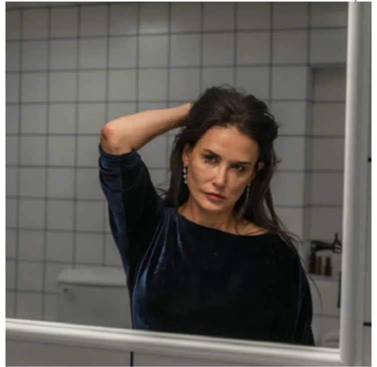
Imagem da sex symbol: longa se popularizou com postura sarcástica