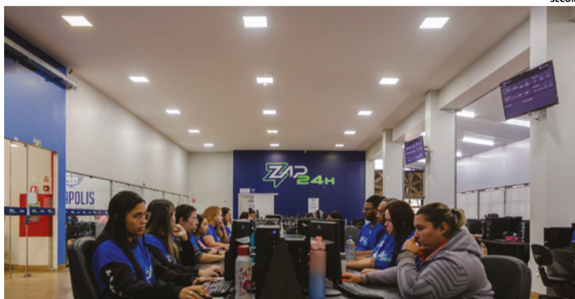
Oferecendo cerca de 400 serviços, o Zap funciona como um canal único para a solicitação de diversas demandas

Oferecendo cerca de 400 serviços, o Zap funciona como um canal único para a solicitação de diversas demandas, incluindo serviços urbanos, procedimentos de saúde, tributos e cadastro econômico. Entre junho e julho de 2024, as filas de atendimento mais procuradas foram: consultas (51.371 atendimentos, representando 33,4%), exames (42.149 atendimentos, 27,4%), atendimento 156 (11.638, 7,6%), IPTU (9.722, 6,3%) e protocolos (27.947, 6,1%), totalizando 80,8% de todas as solicitações.