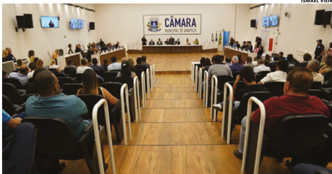
Logo após a posse dos vereadores, na sessão solene, são eleitos presidente, vice, 1º, 2º, 3º e 4º secretários

Mas, normalmente, após a eleição que define os eleitos para a próxima legislatura, os vereadores, nos bastidores, já começam a articular e debater sobre a escolha dos cargos