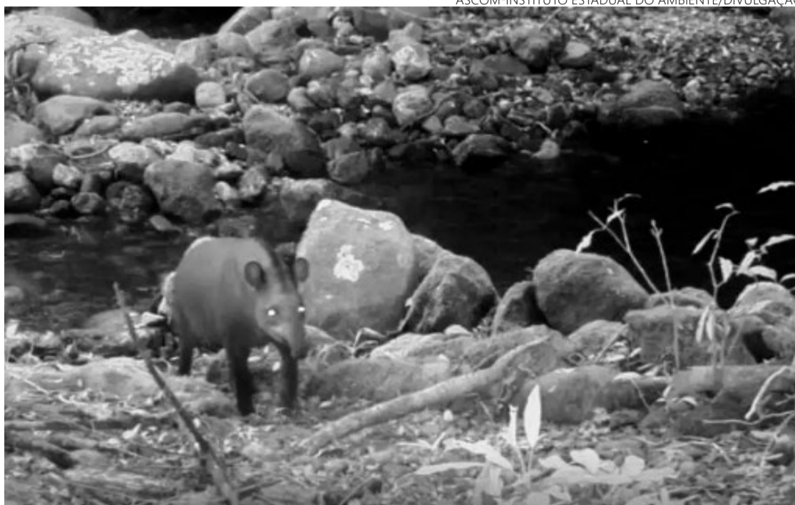
Último registro do animal no estado foi feito em 1914

Os 108 registros, feitos pelas dez câmeras instaladas em uma unidade de conservação administrada na Costa Verde, flagram grupos com até três indivíduos em uma única captura, além de uma fêmea com filhote – o que sugere uma população bem estabelecida da espécie na região. A redescoberta é resultado do trabalho de conservação da biodiversidade da Mata Atlântica, que oferece um habitat preservado para a anta e outras espécies-chave, como