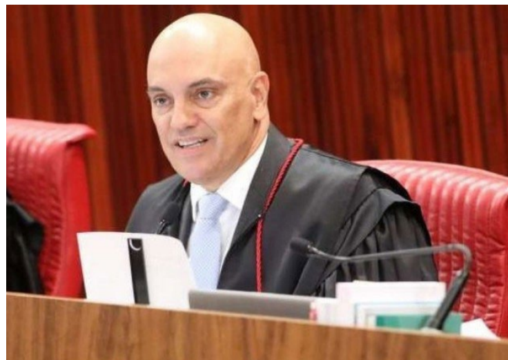
Alexandre de Moraes: combate à disseminação do ódio nas redes sociais

Moraes afirmou que a causa desses eventos está evidente nas redes sociais. Neste momento, ele voltou a defender a regulamentação das plataformas como meio de proteger a democracia e impedir a repetição de atos como os de 2023. "Tudo isso surgiu a partir do momento que extremistas de direita se apoderaram das redes sociais para por elas, ou com elas, instrumentalizarem a democracia.