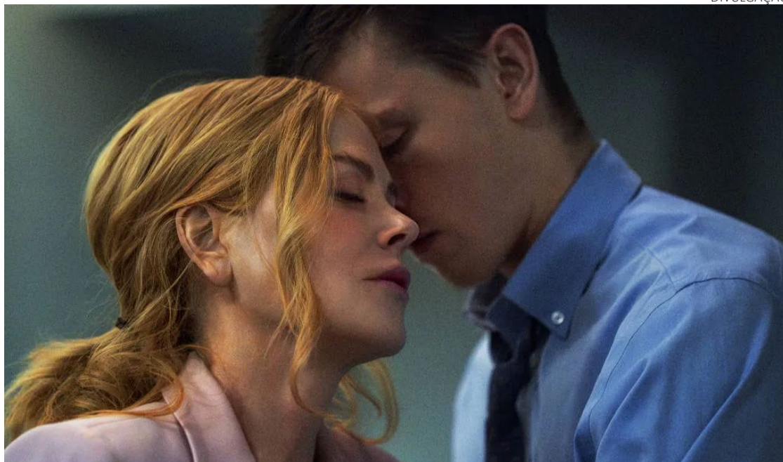
Obra não desperdiça tempo do espectador com explicações psicológicas

Pois então essa será menos uma crítica de filme quanto um desafio. Eu quero ver quem aqui (e ali, e em qualquer lugar) vai passar pela vida sem se abalar com um momento de "Babygirl" em que o personagem de Harris Dickinson dança com seus membros longos e desajeitados e o torso tatuado ao som de "Father Figure", hit de George Michael de 1987.