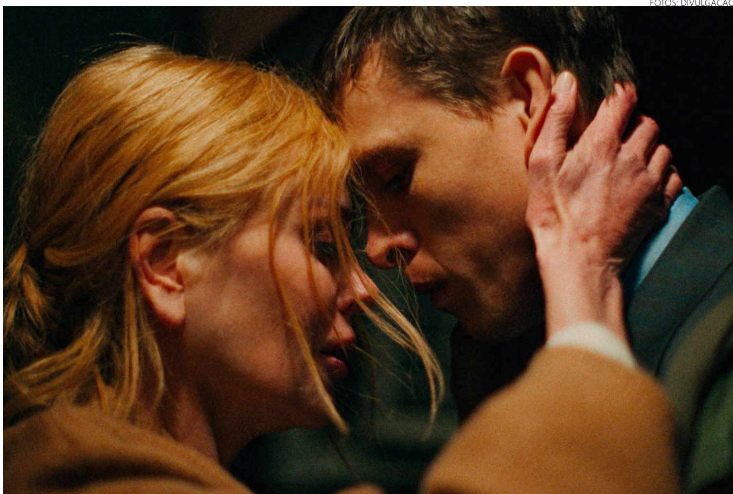
Parceria erótica: Nicole Kidman contracenando com Harris Dickinson em filme que estreia hoje nos cinemas goianos

Ele começa fazendo comentários rudes e dando ordens a ela, o que a enche de libido. Logo, a relação escala para es-