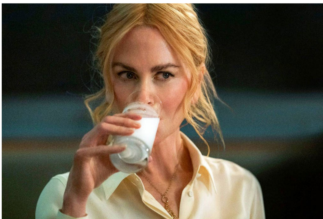
Libido nas alturas: atriz diz que filme é "odisseia emocional e sexual"

capadas sexuais em hotéis e no próprio escritório. "A maneira como o poder se move ao longo da trama, como é algo sempre em jogo, me atraiu. Está tudo bem uma mulher poderosa dizer que não quer ser poderosa em alguns momentos", diz a atriz.