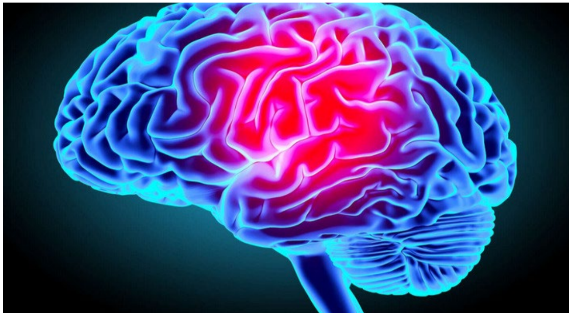
Lesão na cabeça pode aumentar o risco de doença neurodegenerativa ao reativar um vírus adormecido

O HSV-1 é um vírus que muitas pessoas contraem durante a vida. Embora ele possa