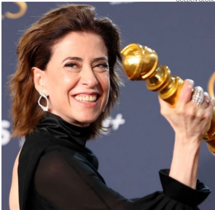
No páreo: atriz venceu Globo de Ouro nesta semana

A vitória de Torres no Globo de Ouro é outro elemento que pode influenciar o cenário, já que os votos para o SAG Awards foram registrados antes da premiação no último domingo, enquanto a votação do Oscar ainda está em aberto.