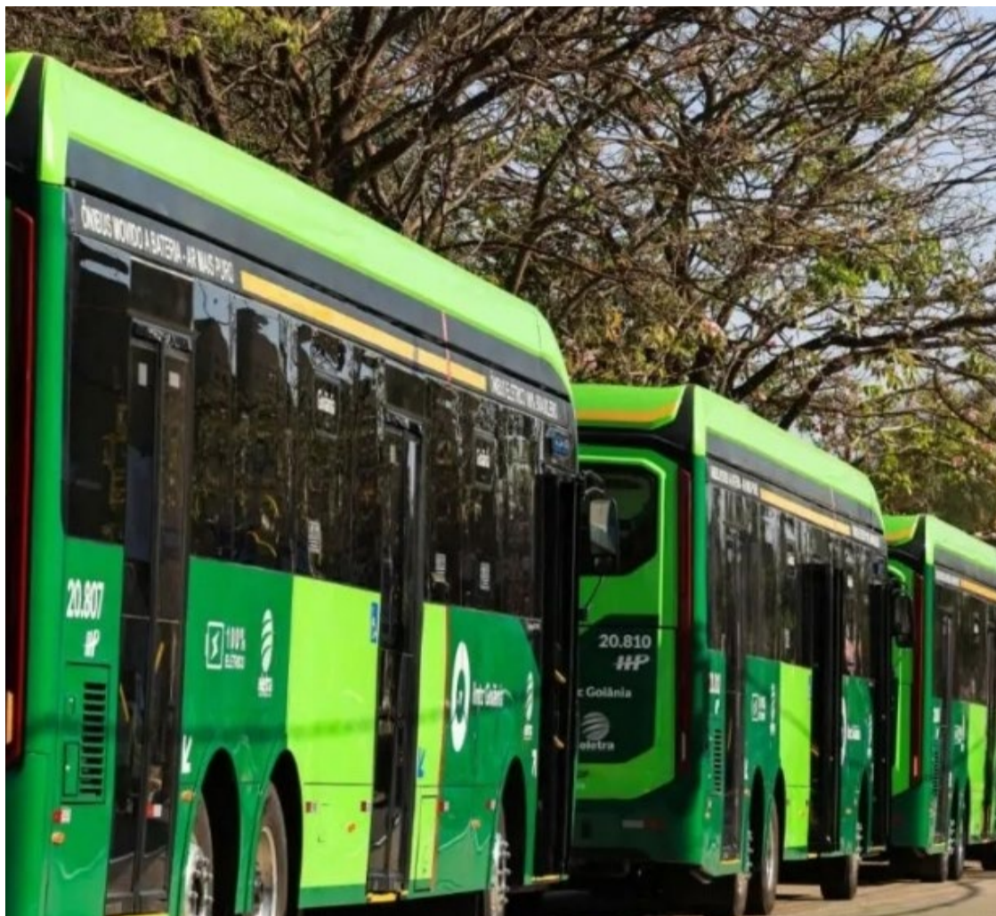
Projeto Nova Rede Metropolitana de Transporte Coletivo (Nova RMTC) abrange reforma de 19 estações e seis terminais, bem como nova frota de ônibus

O projeto Nova RMTC também contempla a reestruturação dos 7 mil pontos de ônibus do sistema. Em 2024, 5 mil pontos foram reformados, construídos ou mantidos, enquanto 1.720 receberam placas de identificação para facilitar a locomoção dos passageiros.