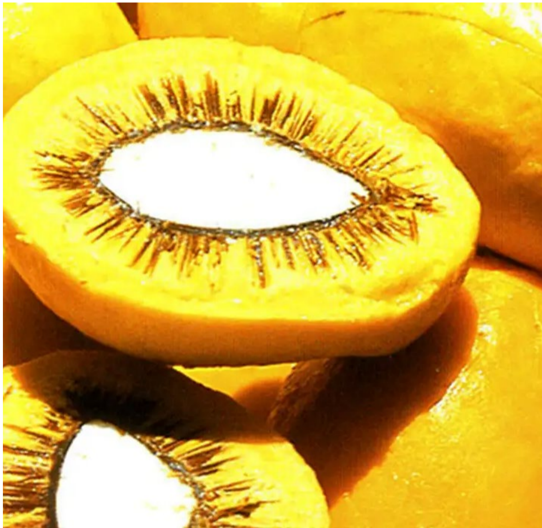
Projeto proíbe a derrubada e o uso predatório de pequi

Projeto de lei, sancionado pelo presidente Lula, estimula a produção e uso de frutos do Cerrado, em especial o pequi, além de dar mais eficiência no combate ao desmatamento do bioma