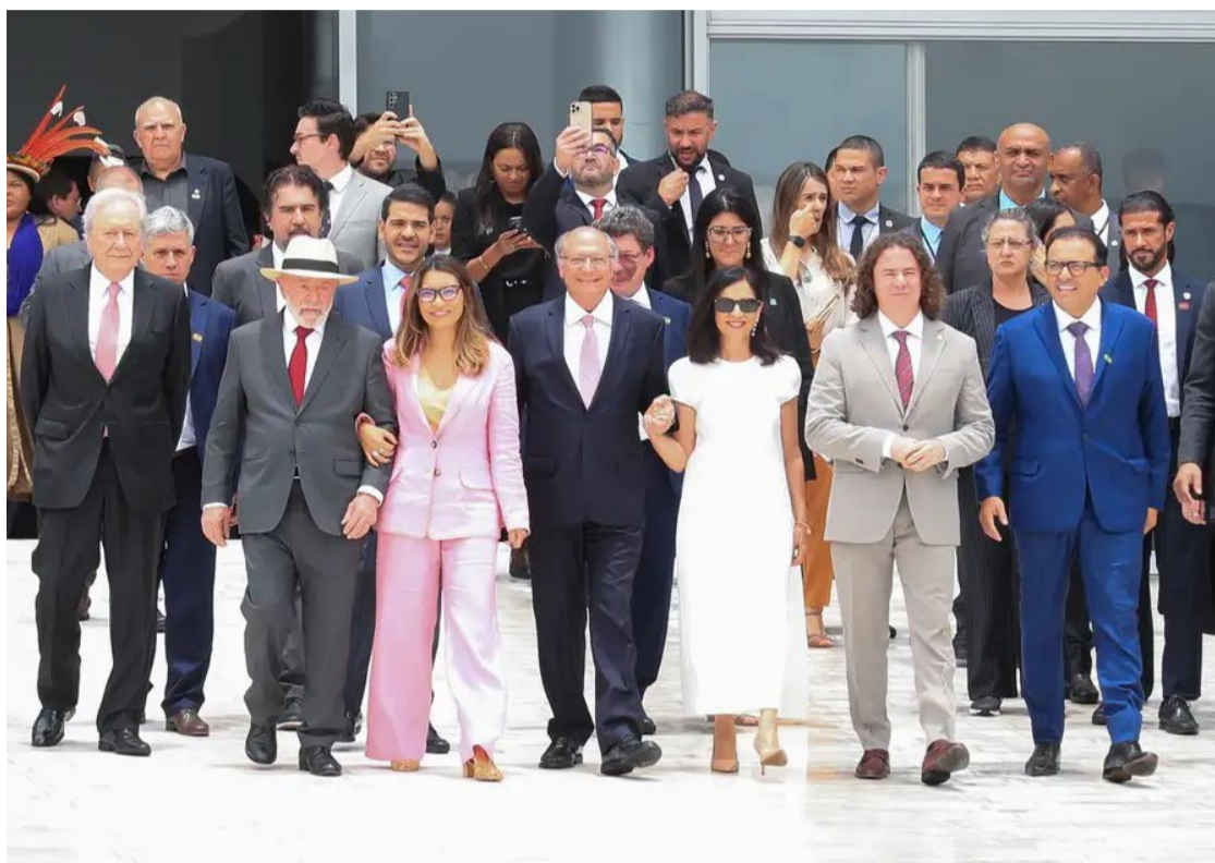
Lula da Silva e autoridades descem a rampa do Palácio do Planalto: "Defesa da democracia sempre"

Já a data do 8 de janeiro ficou marcada com um dos maiores ataques à democracia —o STF (Supremo Tribunal Federal) já condenou 375 réus pelos atos, que resultaram na denúncia de 1.682 envolvidos. "Hoje é dia de dizer, em alto e bom som, ainda estamos aqui. Estamos aqui para dizer que estamos vivos, que democracia está viva, ao contrário do que planejam golpistas de 8 de janeiro de 2023", disse Lula. "Estamos aqui, mulheres e homens de diferentes origens, crenças, uni-