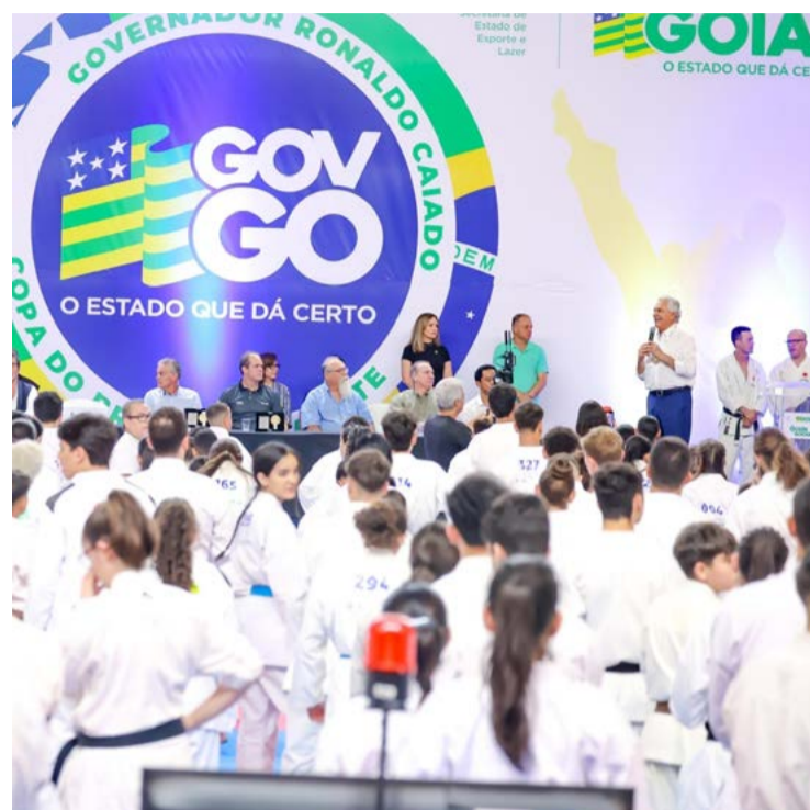
Ronaldo Caiado defende as lutas como prática esportiva: "É emocionante ver esse ginásio cheio de atletas"