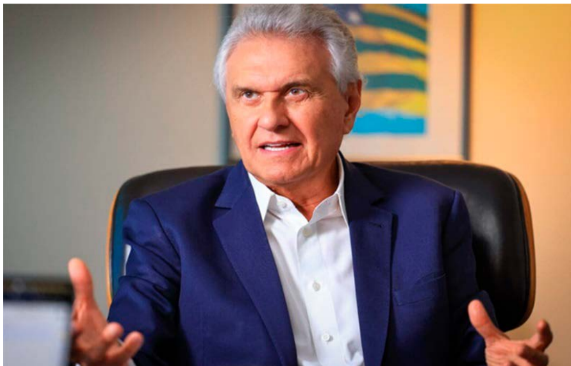
Ronaldo Caiado vai se apresentar ao eleitorado nacional em pílulas do União

Embora tenha base sólida em Goiás e trajetória reconhecida no Congresso Nacional, onde foi deputado federal e senador, Ronaldo Caiado ainda