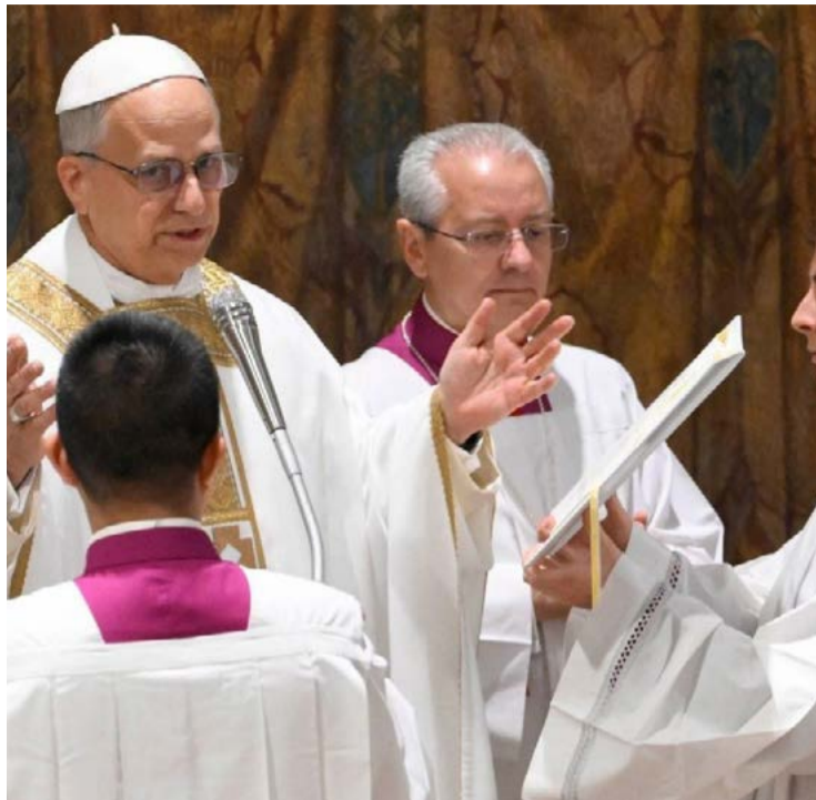
Novo pontífice reafirmou temas caros ao papa Francisco, como a necessidade de uma Igreja missionária, próxima dos que sofrem e aberta ao diálogo

Na manhã de ontem, Leão XIV celebrou sua primeira missa na Capela Sistina, cercado pelos cardeais que o elegeram. Em sua homilia, o papa destacou o papel da Igreja