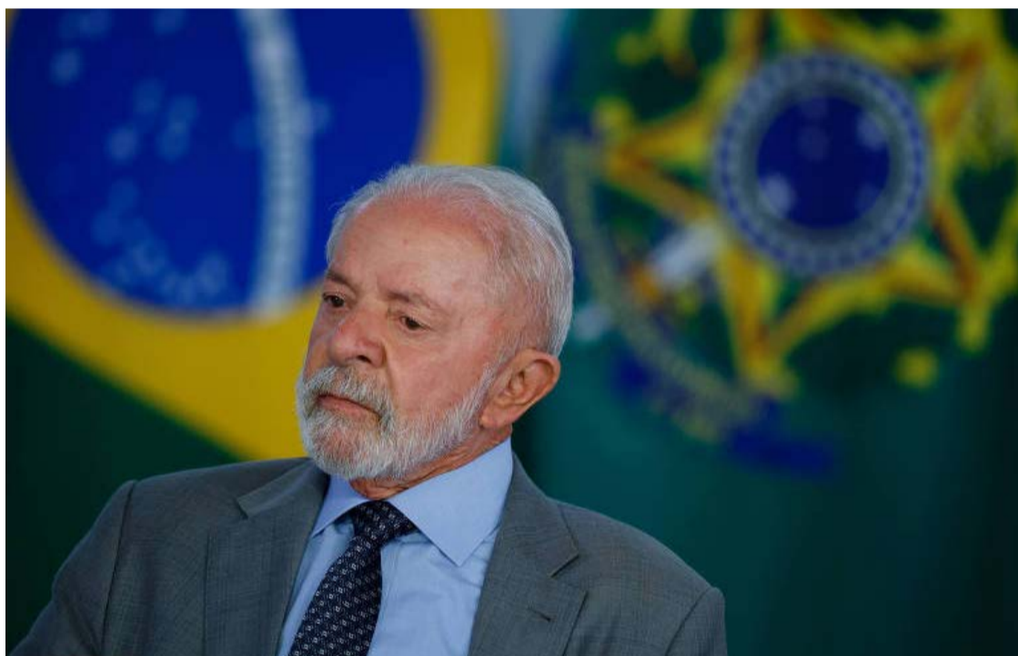
Lula é o presidente do Brasil e o nome a ser batido pela oposição em 2026

enfrenta um obstáculo importante para sua consolidação como presidente: o desconhecimento por parte do eleitorado fora da região Centro-Oeste.