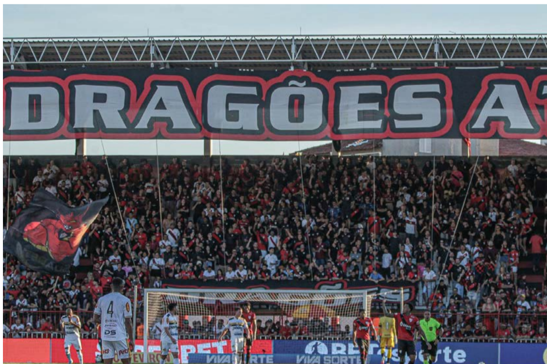
Dragão brilhou no futebol local em época pretérita, mas deu a volta por cima

crevinhador ludopédico no livro "Atlético, Campinas e Accioly — Memórias da Força Quente de um Dragão", publicada pela editora Ludopédio.