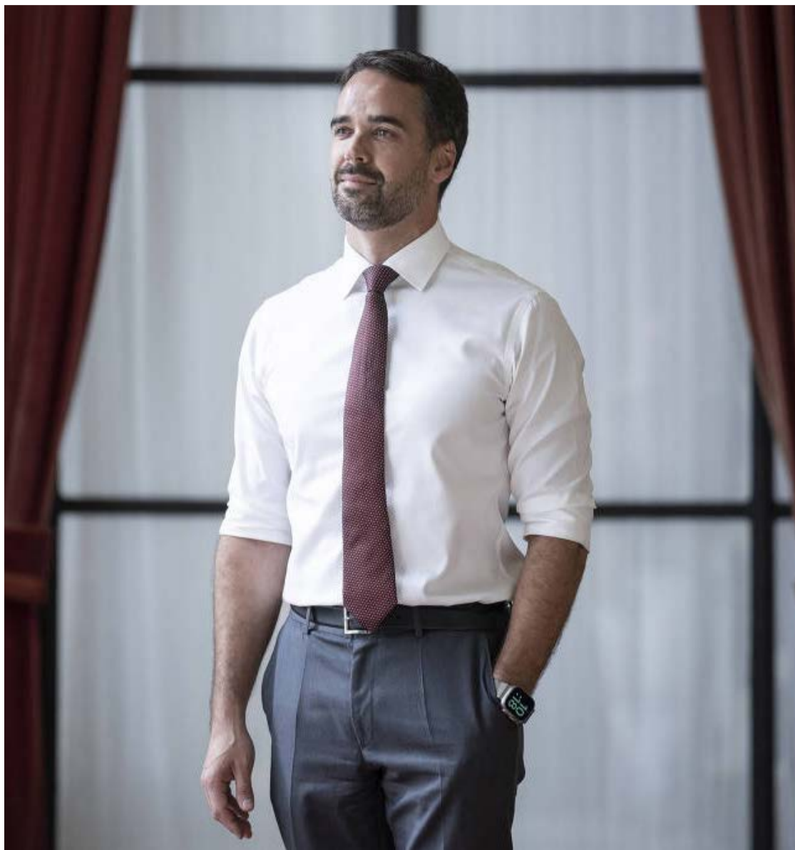
Governador Eduardo Leite, do Rio Grande do Sul, troca o PSDB pelo PSD de Kassab

PSDB tem enfrentado uma série de desligamentos de quadros com trajetória relevante. Além de Leite, a governadora de Pernambuco, Raquel Lyra, e o senador Izalci Lucas (DF) também formalizaram saída, ambos criticando a condução nacional. Lyra se filiou ao PSD, enquanto