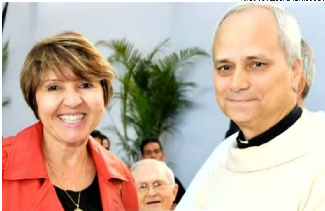
Leão XIV, Robert Prevost, esteve em escolas e obras da Capital: colégios como Santo Agostinho e Agostiniano celebram novo papa

O Colégio Agostiniano também celebrou com um "Habemus papa: primeiro papa agostiniano". A escola publicou também referências à Sociedade Agostiniana de Educa-