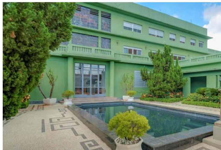
Palácio das Esmeraldas, sede do governo de Goiás, que deve hoje à União R$ 18,6 bilhões

Dívida goiana com a União, antes do RRF, era de R$ 11,6 bilhões. O saldo atual, hoje, é de R$ 18,6 bilhões