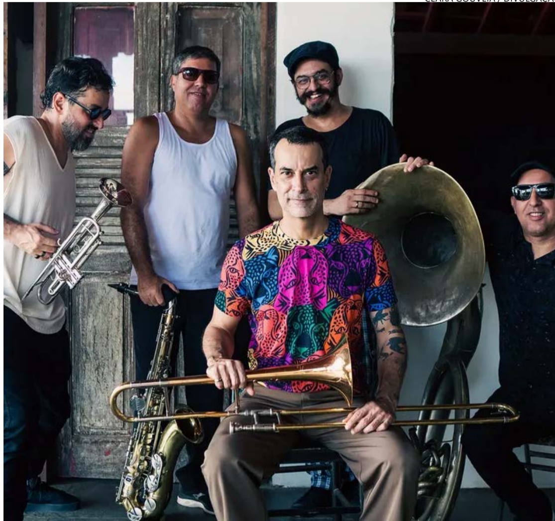
Eddie ajudou a oxigenar música brasileira nos anos 1990 com fusão de estilos