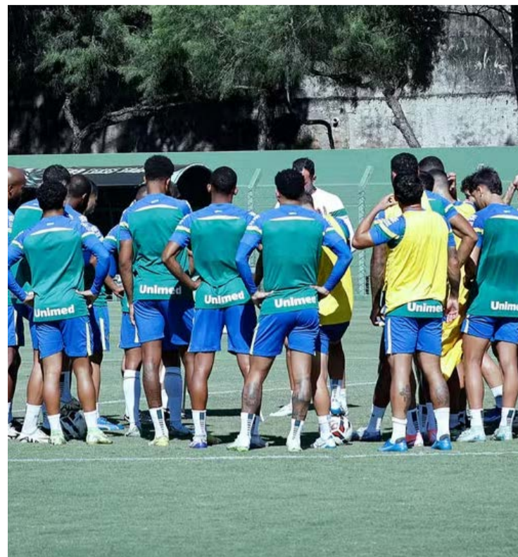
Verdão busca a terceira vitória consecutiva para avançar na Série B

Verdão está na segunda posição com a mesma pontuação do Vila e se vencer ou empatar neste sábado assume a liderança provisória da Série B