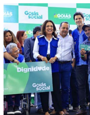
Gracinha Caiado durante edição itinerante do Goiás Social em Abadia: serviços sociais

A estrutura itinerante segue aberta até este sábado, 10, no Estádio Municipal Divino Cardoso Lourenço, com atendimento até as 17h nesta sexta e das 8h às 12h no sábado. O evento conta com a participação de órgãos estaduais, concessionárias e da prefeitura local.