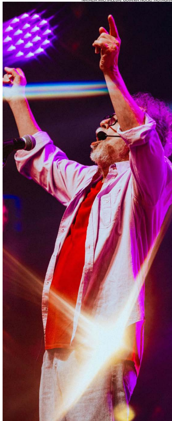
Tropicalista mostrou ao Noise a inventividade de sua música

Du Peixe contou que, desde o começo, o balanço de “A Tábua da Esmeralda” está na base da Nação Zumbi. Nos anos 1990, o grupo morou por meses em Santa Teresa, bairro do Rio. Não teve um dia em que seus músicos não curtissem Jorge Ben. Gravavam o CD “Afrociberdelia”.