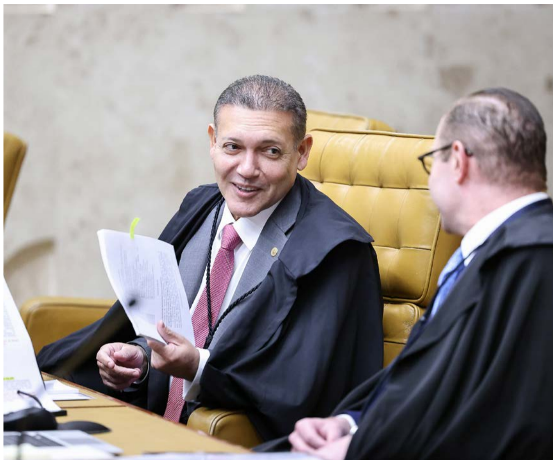
Kássio Nunes decidiu convidar Jair Bolsonaro para sua posse no TSE

Kássio Nunes Marques, é natural de Teresina (PI), e integra o TSE desde 2021. Foi indicado por Jair Bolsonaro e se consolidou como garantista, muitas vezes em sintonia com argumentos utilizados pelo ex-presidente e aliados. Tornou-se ministro efetivo em 2023 e assumiu a vice-presidência em 2024. Relator das normas das eleições de 2026, vai presidir o