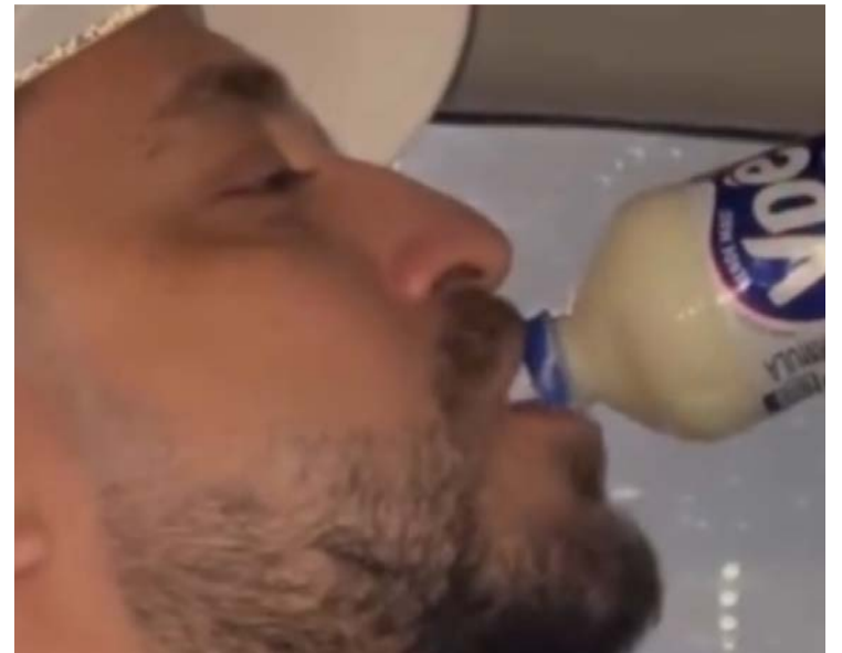
Gravação faz parte de uma onda de memes nas redes sociais