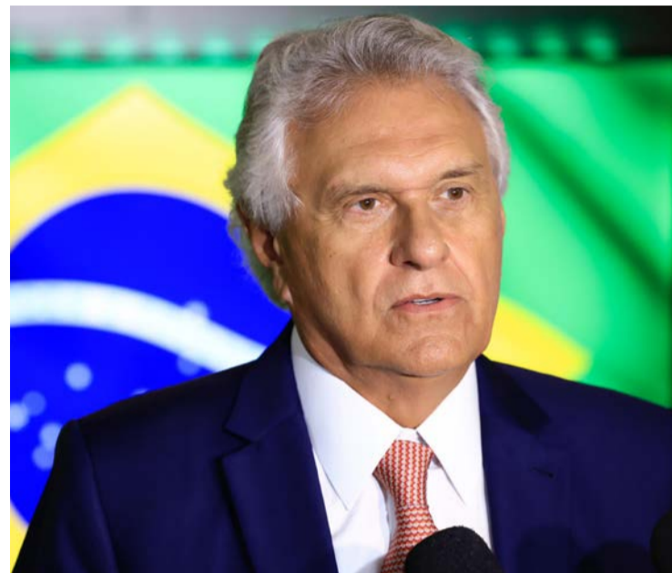
Ex-governador Ronaldo Caiado ataca decisão de Alexandre de Moraes

Barrar proposta aprovada no Congresso extrapola limites institucionais entre Poderes