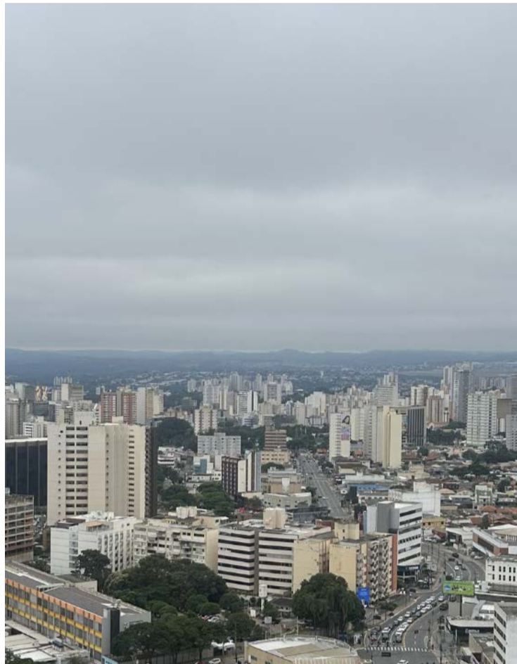
Na quarta-feira (13), as temperaturas já começam a subir novamente em todas as regiões de Goiás