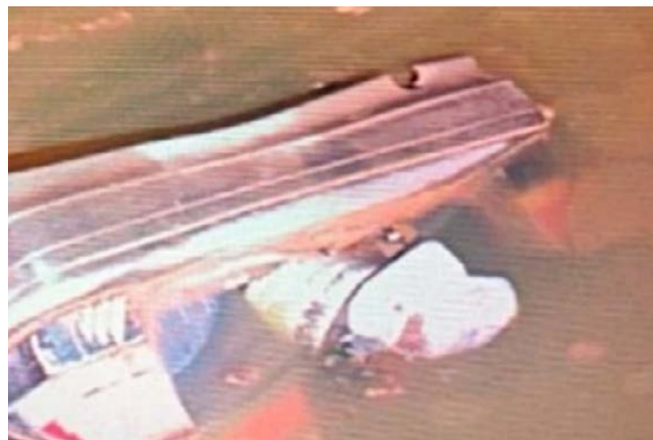
Entre as vítimas, quatro eram irmãos, a mãe deles sobrevive

Seis ocupantes de um carro morreram após o veículo cair no lago de um condomínio