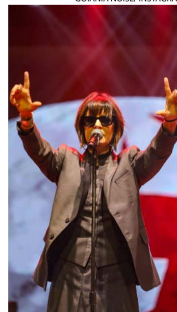
Garota sangue bom fez público ir ao delírio em Goiânia