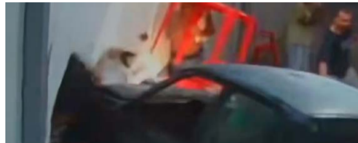
Duas pessoas ficaram gravemente feridas