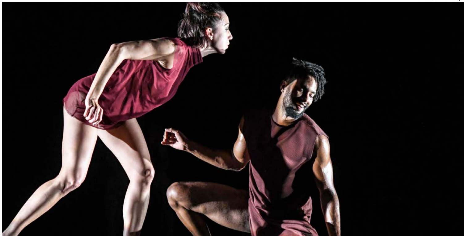
Montagem mistura dança contemporânea e teatralidade em uma reflexão sobre comportamento e identidade