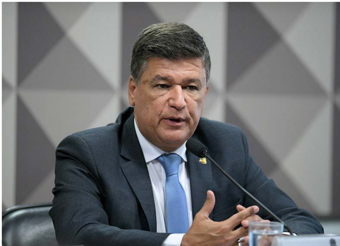
Senador bolsonarista Carlos Viana vai comandar CPMI para desgastar Lula

ção foi vista não só como uma falha na articulação do governo, mas também como uma nova afronta da oposição à autoridade dos presidentes da Câmara e do Senado, que haviam acertado relator e presidente antes da instalação da CPMI, como é de praxe.