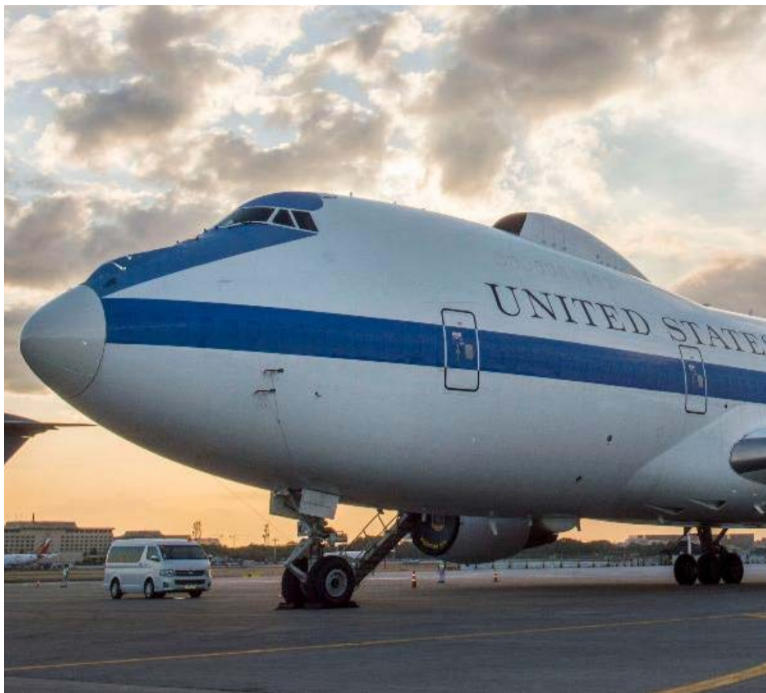
Avião com a fuselagem toda branca e sem identificação é usado em crises internacionais e missões secretas

O avião com a fuselagem toda branca e sem identificação é usado em crises internacionais e missões secretas. A aeronave costuma transportar equipes de ação rápida do Departamento de Estado, diplomatas, militares de elite e agentes da CIA (Agência Central de Inteligência dos