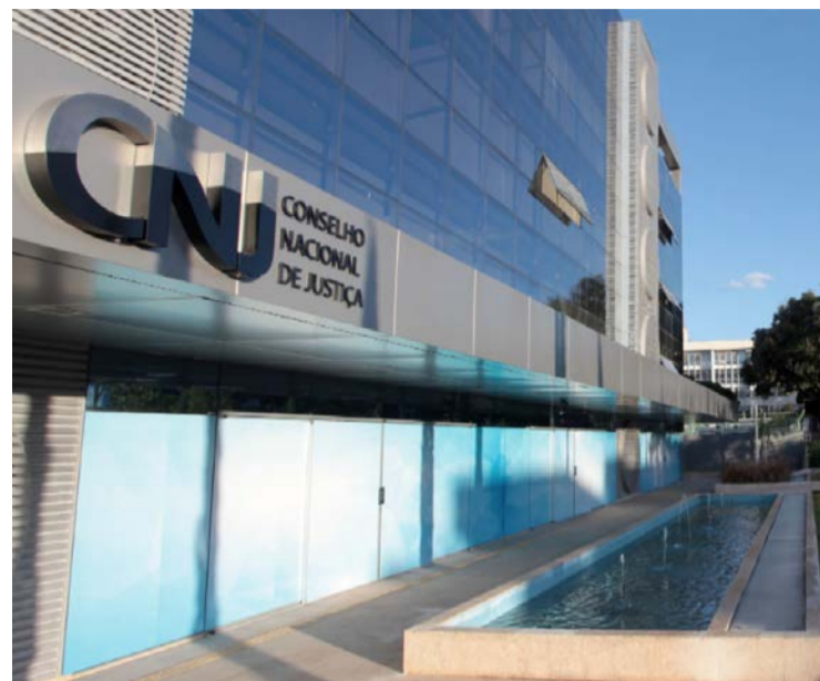
Sede do CNJ, que vai decidir sobre pedido da AMB

Associação diz que exposição sem controle aumenta riscos inerentes à função jurisdicional