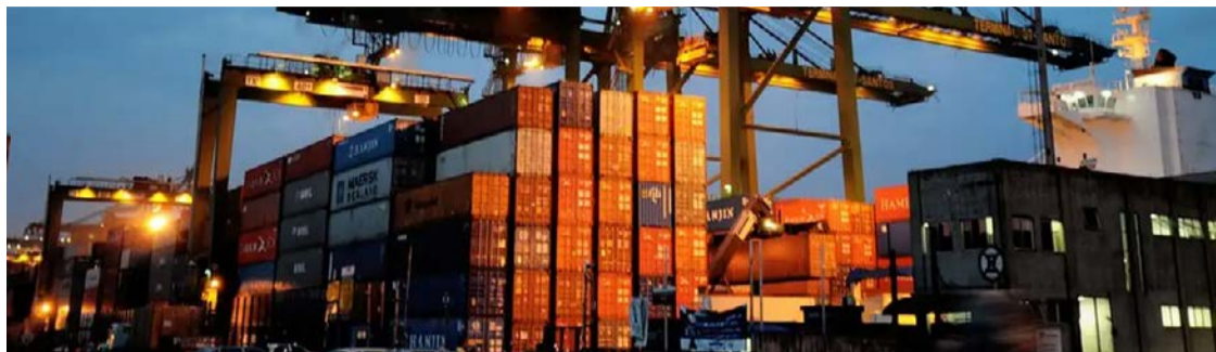
Expectativa de exportações da indústria recuou 5,1 pontos em agosto

Tarifaço norte-americano contra produtos brasileiros pode fazer com que, pela primeira vez em 21 meses, as exportações do Brasil apresentem queda