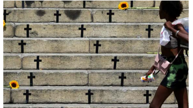
Levantamento aponta aumento de 45% nos crimes