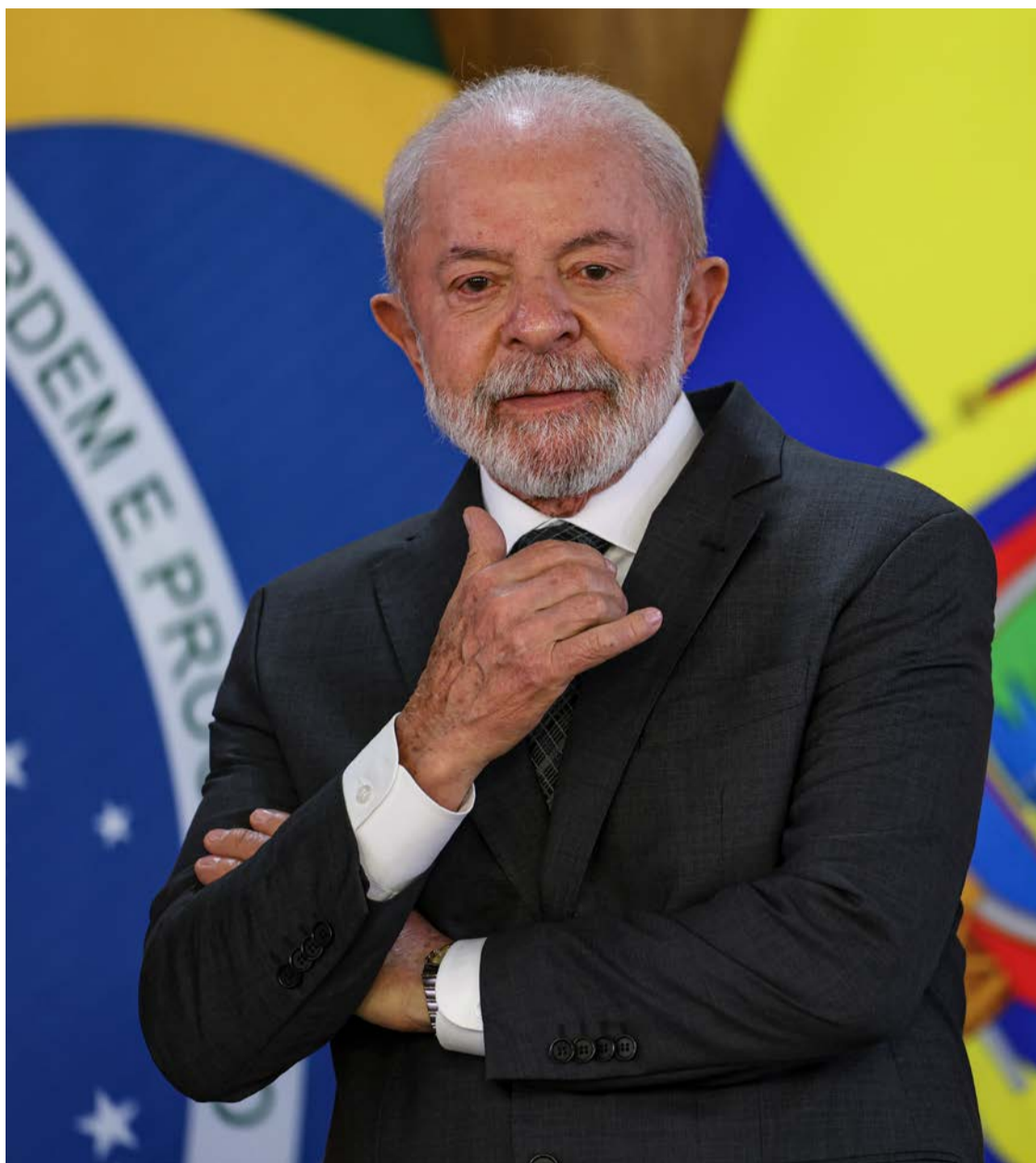
Presidente Lula não consegue melhorar os seus índices de aprovação em Goiás

dados reforçam a polarização no cenário político brasileiro: Lula consegue