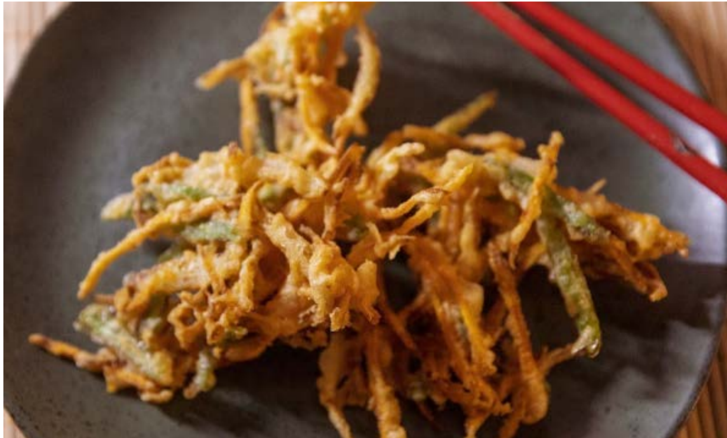
Tempurá: iguaria é destaque no cardápio da 23ª edição de festa que comemora música, dança, culinária e artes japonesas