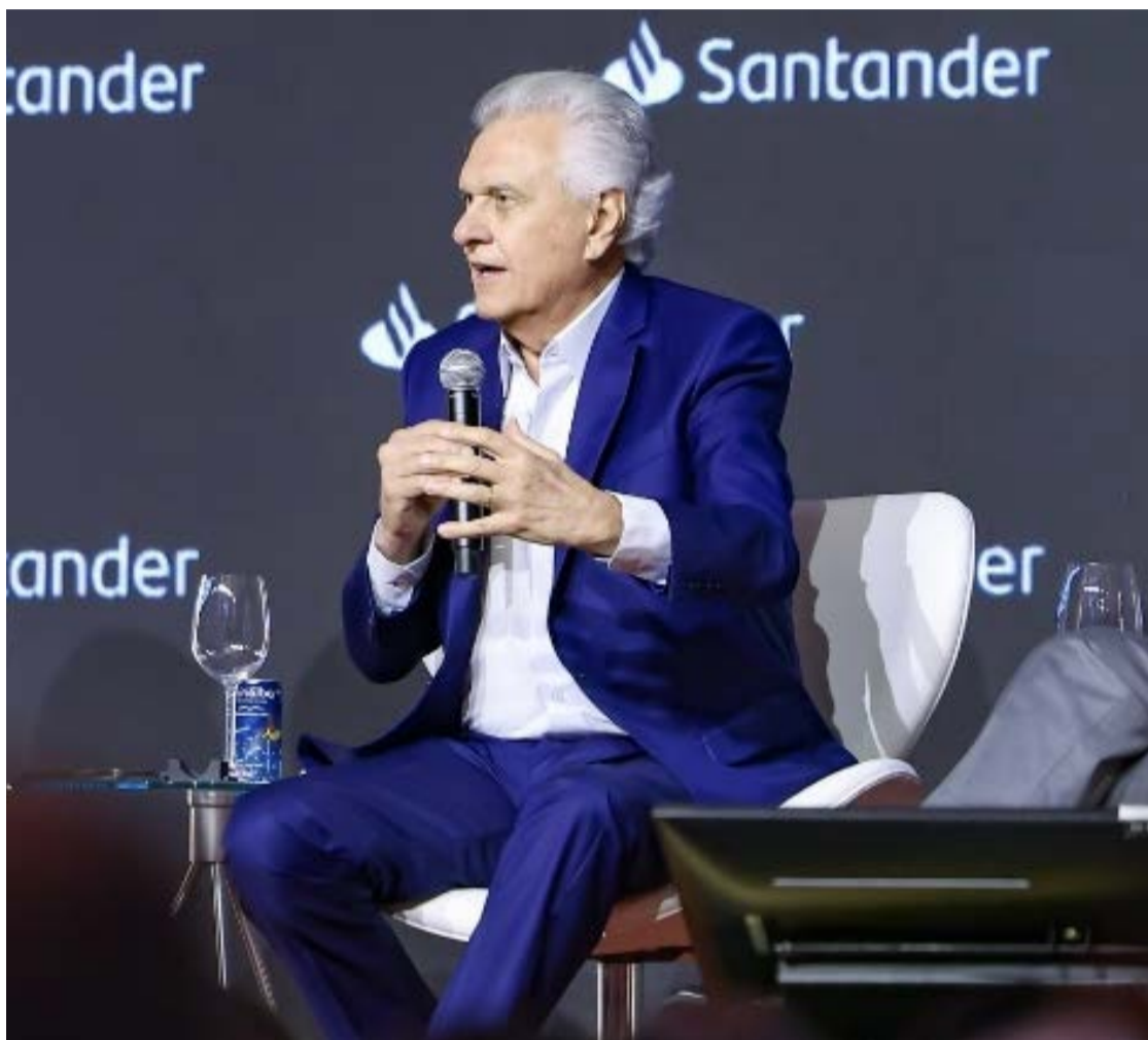
Ronaldo Caiado destacou avanços em segurança, educação e saúde: “legado de otimismo”

Caiado lembrou que, em 2019, assumiu um estado em colapso, com folhas salariais em atraso e débitos bilionários. Segundo ele, renegociações e reformas foram decisivas para estabilizar as contas e