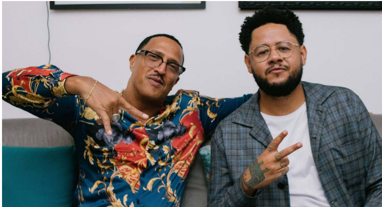
Na palavra perfeita: Brown e Emicida se destacam na música brasileira pelo discurso engajado e temáticas sociais