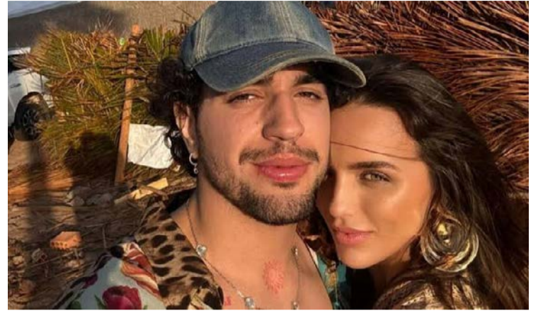
Rumores da crise surgiram após a série "Tempo Para Amar"