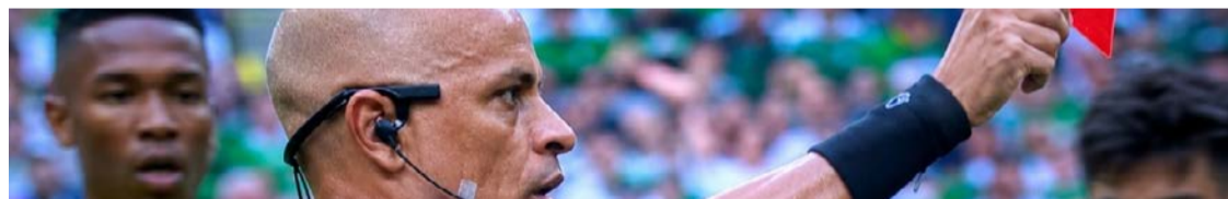
Wilton Pereira Sampaio apita jogo na abertura da Copa do Mundo