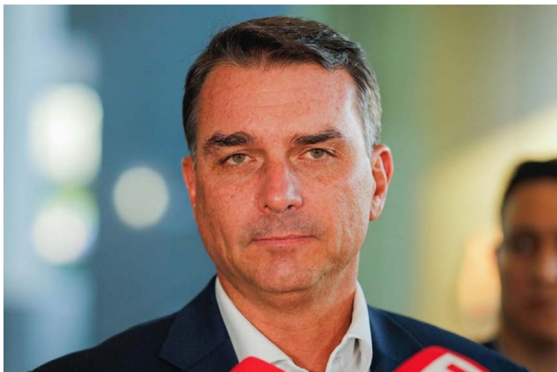
Flávio Bolsonaro pediu, e foi atendido, pela retirada de pesquisa eleitoral do ar