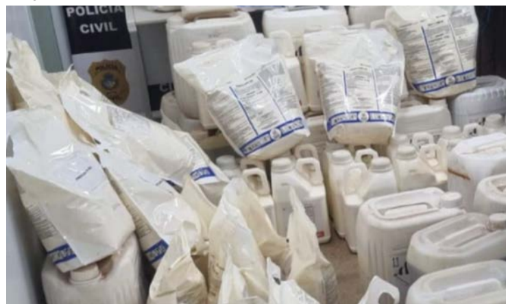
Agentes localizaram expressivo volume de defensivos agrícolas

Ação foi conduzida pelo Grupo Especial de Repressão a Narcóticos (Genarc)