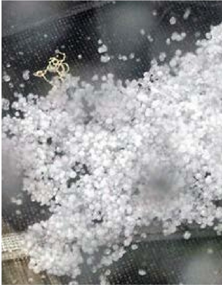
Rio Verde, Jataí, Quirinópolis e Chapadão do Céu estão entre as cidades em alerta para granizo