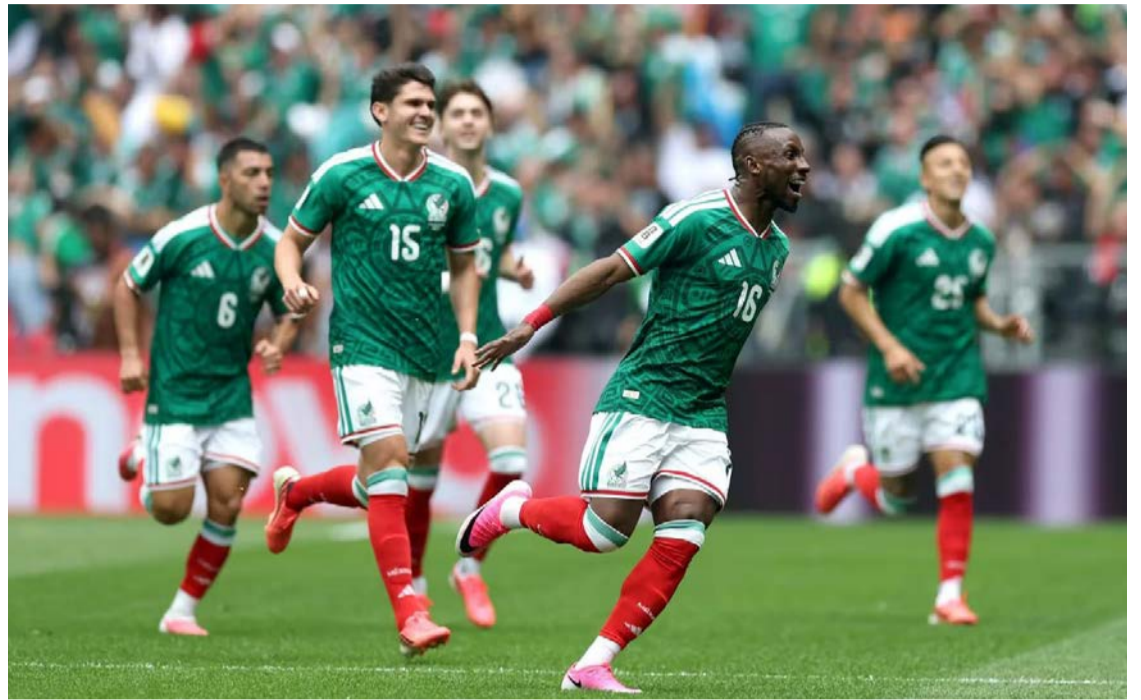
Primeira vitória da seleção mexicana na oitava participação em um jogo de estreia de uma edição do Mundial

Ainda como parte do cerimonial pré-jogo de abertura, 48 porta-bandeiras entraram no campo representando cada um dos participantes do Mundial expandido da Fifa, com o tenor italiano Andrea Bocelli interpretando em