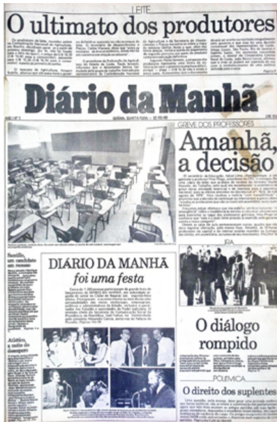
Primeira edição do Diário da Manhã, em 12 de março de 1980