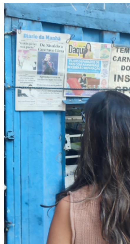
Diário da Manhã ontem nas bancas