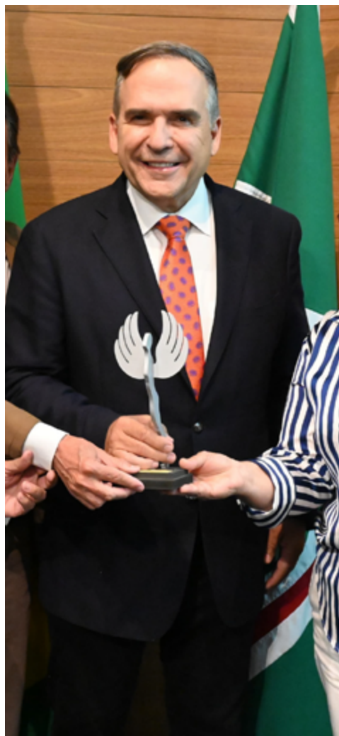
Prefeito de Goiânia, Sandro Mabel recebeu premiação no "Político do Ano", realizado pela Contato Comunicação

Idealizado pelo jornalista Rogério Lucas, o prêmio joga luz aos agentes políticos que se dedicam a fazer da vida pública um espaço de defesa da cidadania e da representatividade. "Ano a ano, a Con-