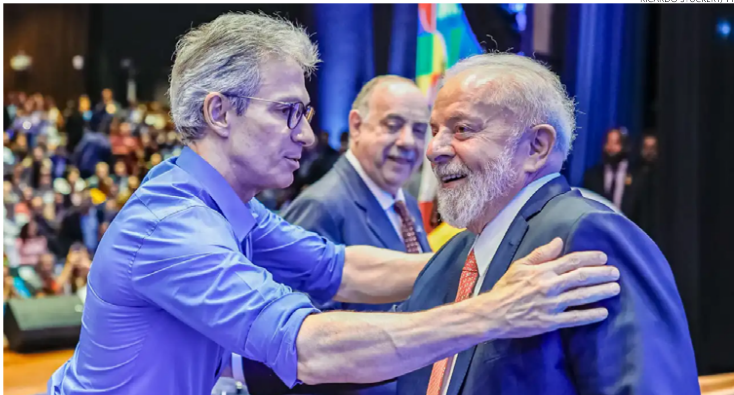
Líder do Palácio da Liberdade se reuniu com Luiz Inácio Lula da Silva em Betim, em Minas Gerais: Zema provocou petista ao falar de secretarias

O político do Novo vem tentando se movimentar para disputar a Presidência