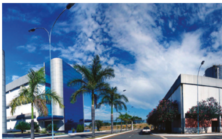
Destaque para as sete vagas para analista de controle de qualidade júnior, com curso técnico em química, processos químicos ou áreas afins

As oportunidades abrangem ainda áreas de distribuição, vendas, controle de qualidade, entre outros, para candidatos de vários níveis de escolaridade e pessoas com deficiência (PcDs). Destaque para as sete vagas para analista de controle de qualidade júnior, com curso técnico em química, processos químicos ou áreas afins; e dez va-