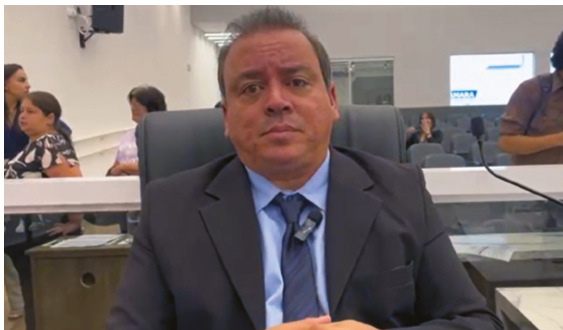
“A ideia é que os candidatos sejam selecionados entre servidores públicos efetivos – incluindo aposentados”

Segundo Suender, a mudança traria mais transparência e profissionalismo para essas instituições, e afastaria indicações baseadas em critérios políticos. A ideia é que os candidatos sejam selecionados entre