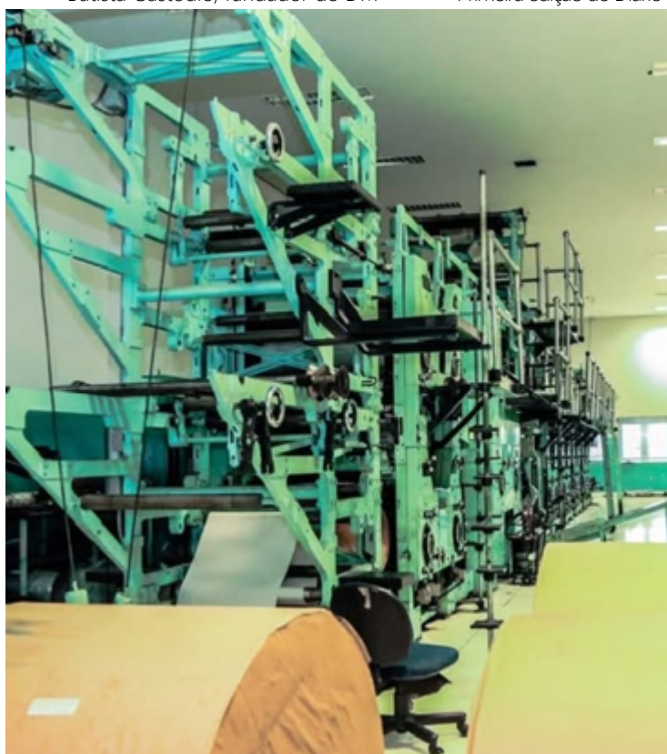
Indústria do Diário da Manhã leva o jornal para bancas e mãos do leitor: ler é a força do hábito