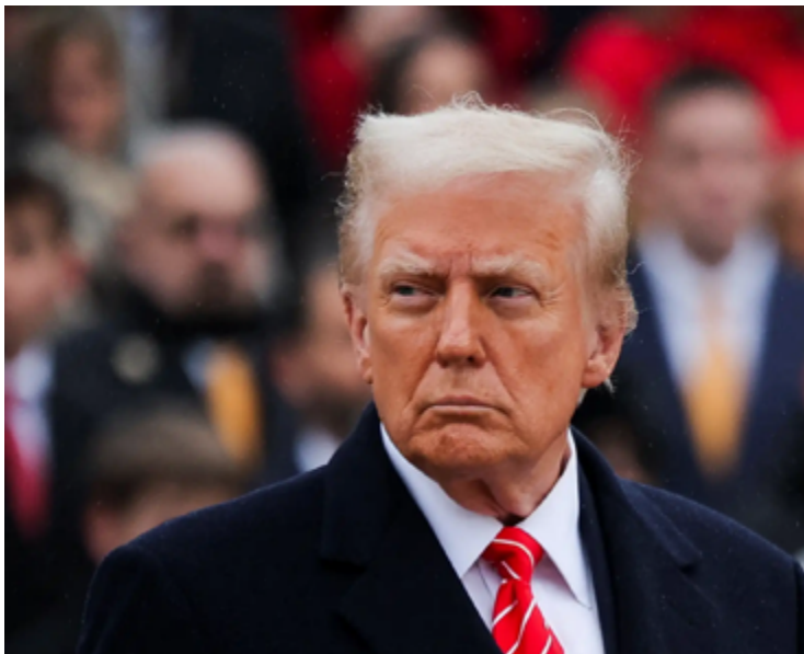
Receios de recessão, cortes radicais no governo federal e política externa abalam confiança no governo Trump

Donald Trump supera sua aprovação cerca de 50 dias após sua posse, no dia 20 de janeiro, em meio a receios de recessão