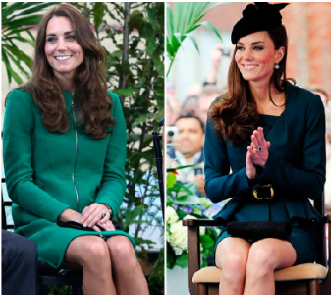
Postura correta é linguagem silenciosa que fala volumes sobre quem somos

Elegância é uma escolha. Cada movimento é uma oportunidade de expressá-la no dia a dia. Postura e a elegância são fundamentais para boa impressão