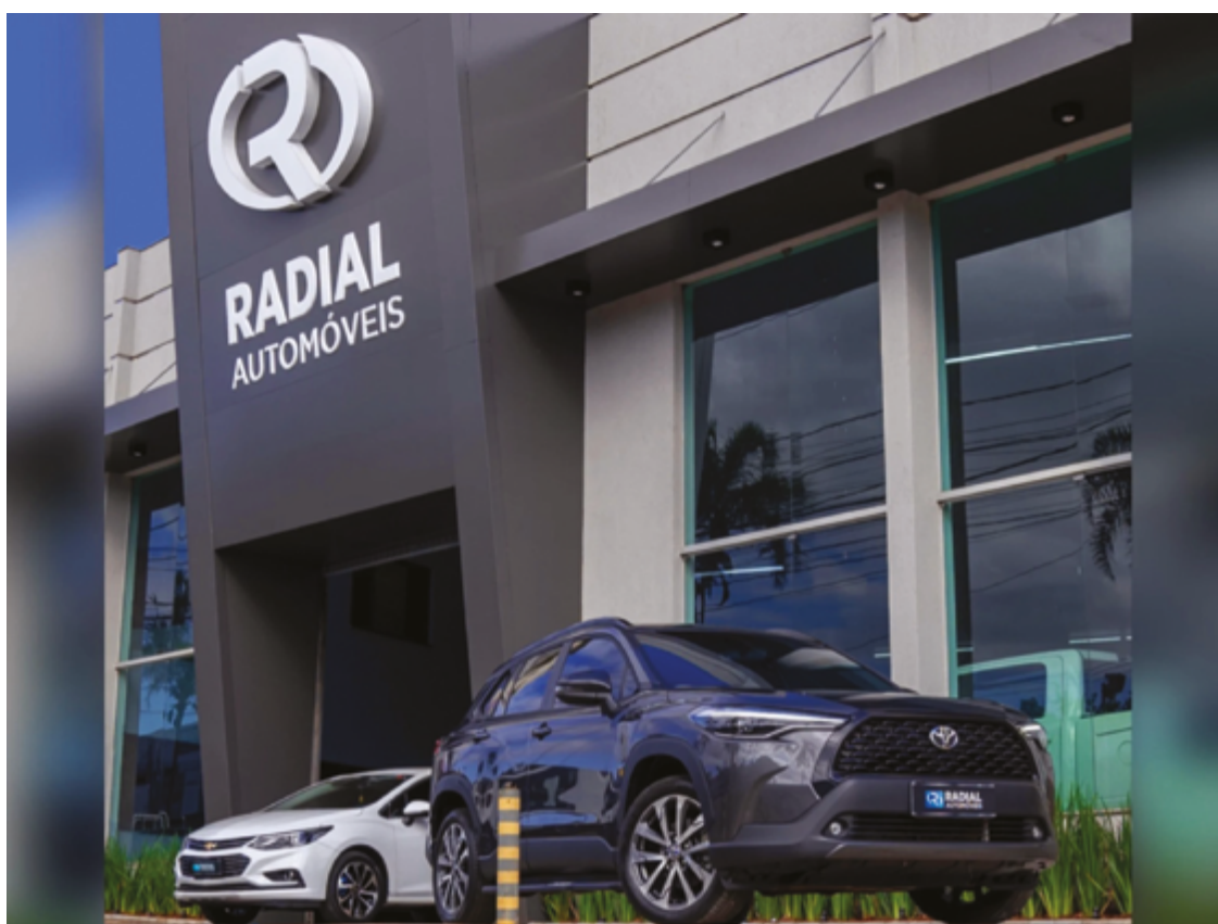
Com anos de experiência no mercado, a Radial Automóveis tem se consolidado como referência em negociação de carros seminovos

Ele também reforça a importância de estar atento para evitar prejuízos: “Às vezes, a pessoa quer economizar 5, 10 mil comprando mais barato de um particular e entra no risco de tudo o que falamos. Cair em um golpe, comprar um carro