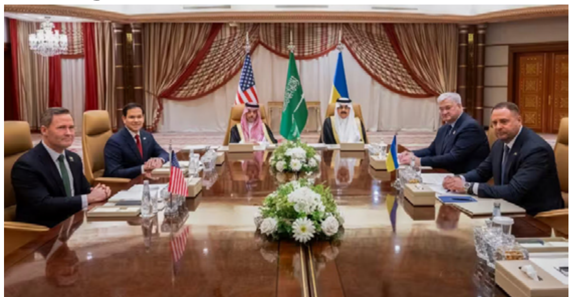
Após nove horas de reunião na Arábia Saudita, negociadores divulgam comunicado

Segundo o texto, “os EUA irão comunicar a Rússia, e a reciprocidade russa é a chave para chegar à paz”. Em um vitória para Kiev após semanas sendo bombardeada politicamente por Trump, “os EUA irão levantar imediatamente a pausa no compartilhamento de inteligência e retomar a assistência de segurança à Ucrânia”.