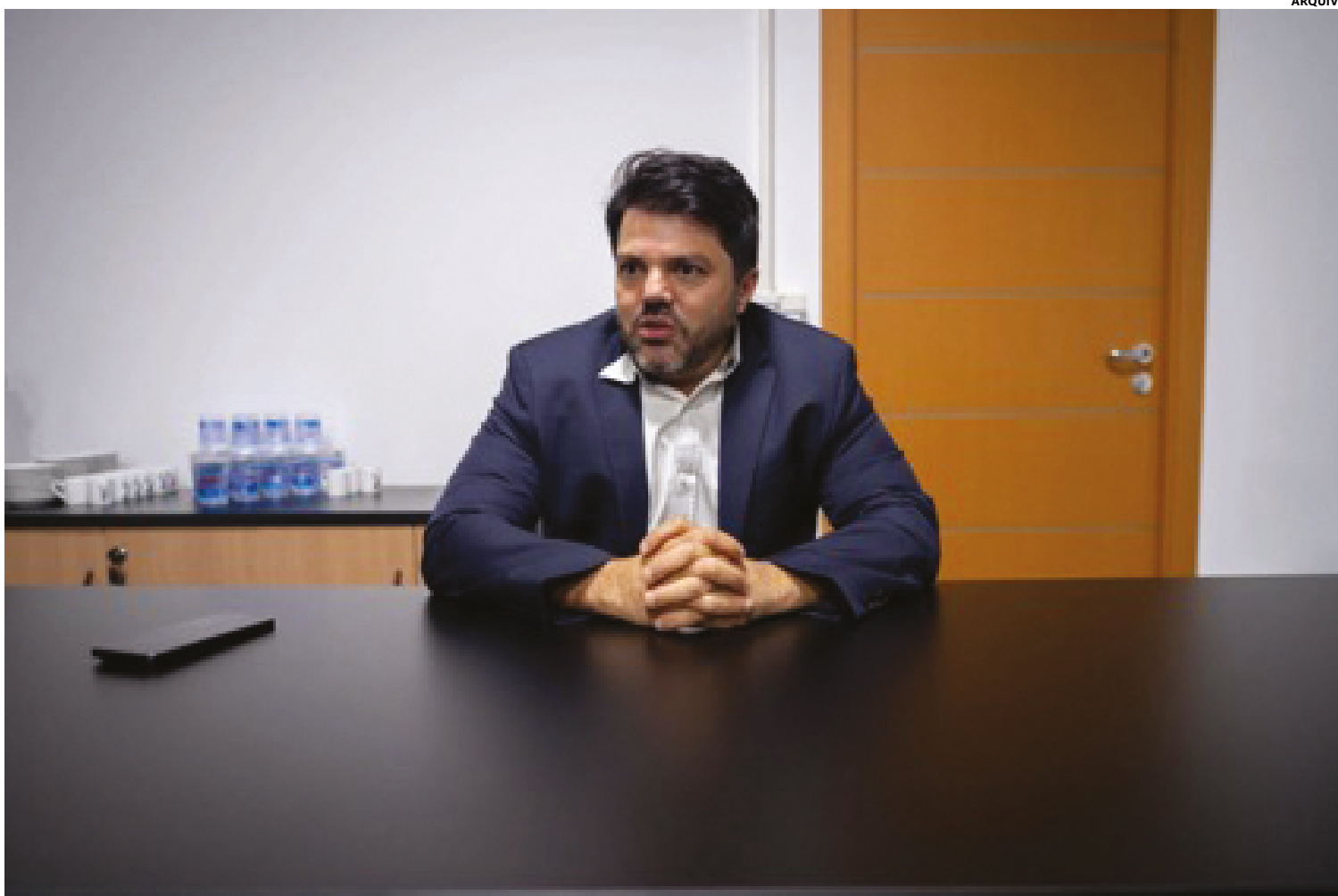
Ele teve boa evolução, segundo boletins médicos divulgados pela unidade, e recebeu alta.

Na última quarta-feira (5), o prefeito foi levado a Brasília, para o Hospital DF Star, onde foi novamente internado e passou por biópsia para investigar um qua-