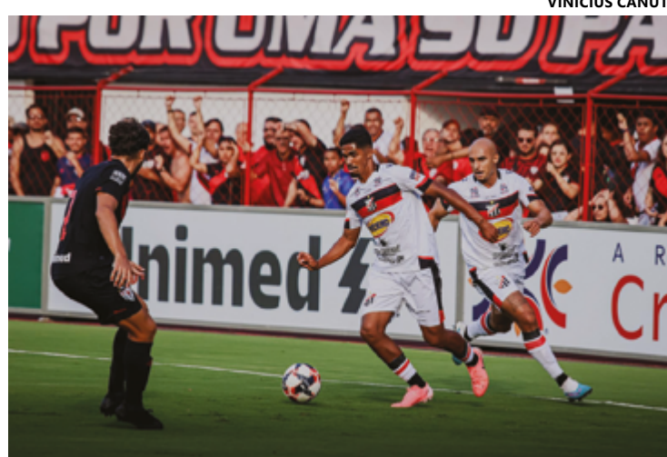
O Galo da Comarca vive um novo momento de brilho e está novamente entre os semifinalistas

Na grande final, o Galo enfrentou o tradicional Goiás. O empate sem gols no primeiro duelo, realizado no Jonas Duarte, manteve viva a esperança da torcida anapolina. No entanto, na partida decisiva, disputada no Serra Dourada, o Anápolis viu o título escapar nos pênaltis. Mesmo assim, a campanha inesquecível consolidou o clube como uma das forças emergentes