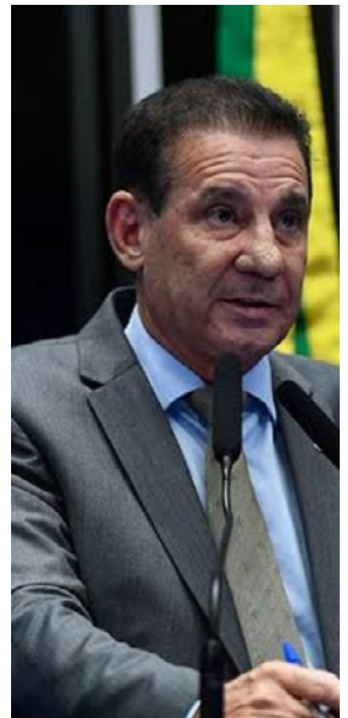
Vanderlan Cardoso foi eleito o melhor Senador: premiação tem voto de formadores de opinião

tato dá sua contribuição ao bom debate político, destacando aqueles que se comunicam melhor", disse.