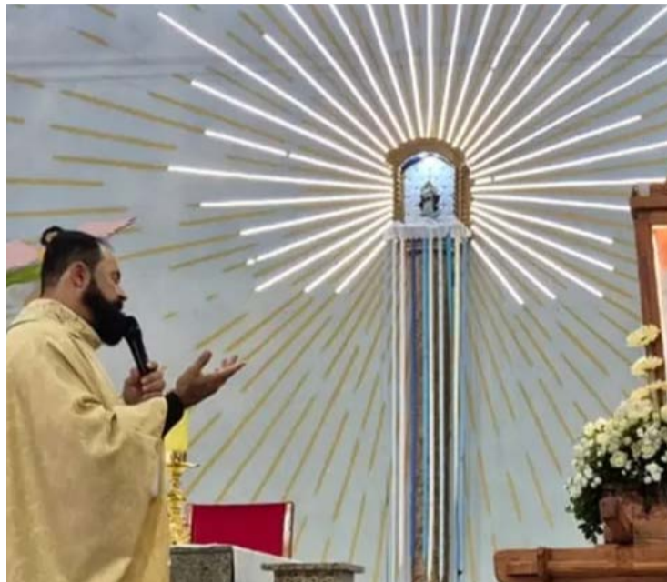
Romaria adota como tema "O Verbo se fez carne e veio habitar entre nós"

aguardados será o 17º Cerco de Jericó, previsto entre 7 e 14 de agosto na Capela do Santíssimo Sacramento. A programação inclui também a tradicional peregrinação ao Morro da Cruz, uma das expressões mais simbólicas da romaria.