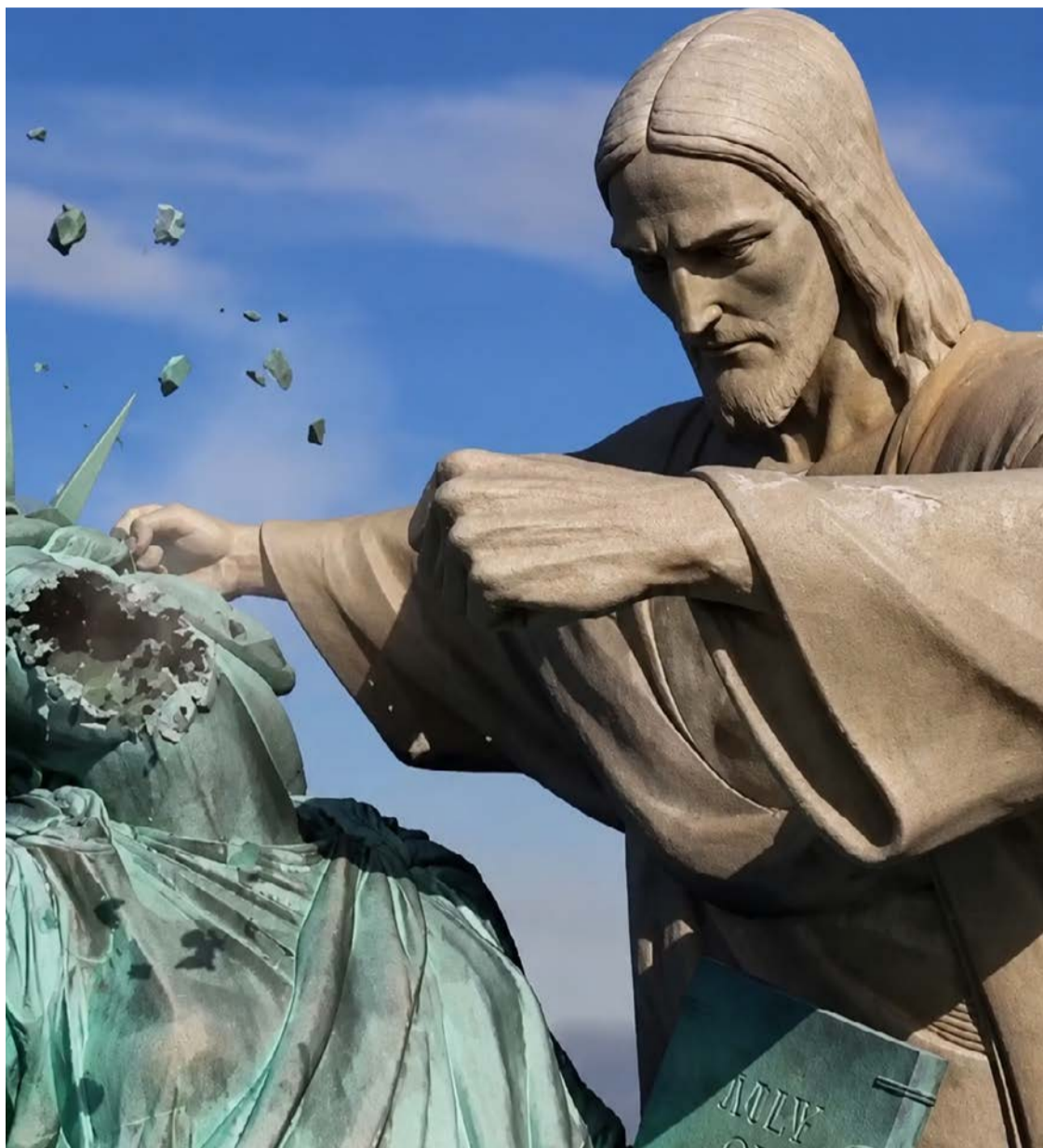
Produção com inteligência artificial divulgada por representação iraniana mostra o Cristo Redentor derrotando a Estátua da Liberdade

Internautas debateram a associação do Brasil à campanha iraniana. O Cristo Redentor é um dos monumentos mais conhecidos do mundo, enquanto a Estátua da Liberdade simboliza historicamente os ideais americanos. Colocar os dois frente a frente reforça o caráter simbólico da disputa retratada no vídeo, ampliando a repercussão para além do contexto EUA-Irã.