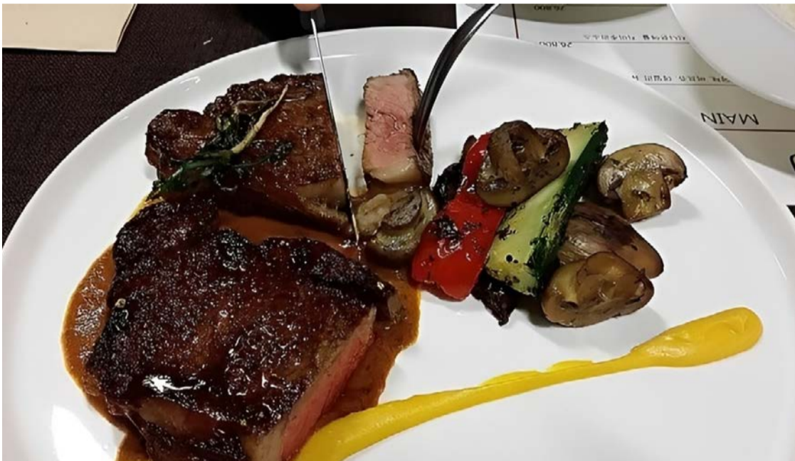
Regras são regras: é preciso cortar um pedaço por vez e colocá-lo na boca depois

Importante é, antes de tudo, ter a sensibilidade de transitar pelo mundo sem causar ruídos desnecessários. Linguagem silenciosa comunica valores