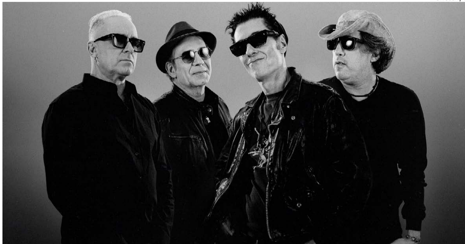
Grupo promete noite embalada por canções que atravessaram gerações na memória afetiva do público

Banda sobe ao palco nesta quinta-feira (4), em apresentação que marca primeira participação no festival. Capital consolidou sonoridade cheia de guitarra e, ao mesmo tempo, sem abrir do pop