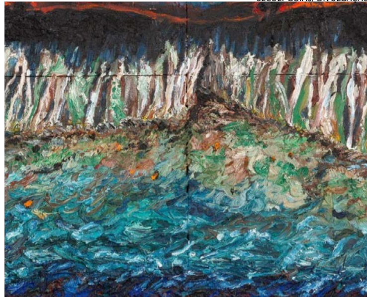
Obras ficarão expostas na Cidade de Goiás neste mês