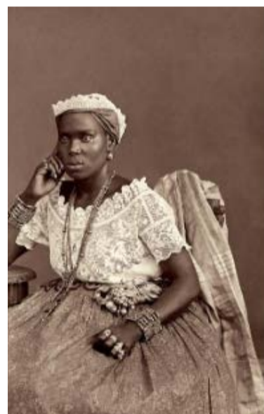
'Tia Ciata', doc de 2017