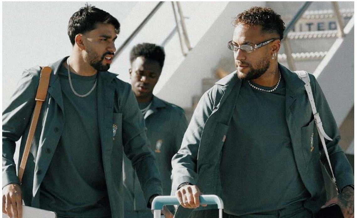
Delegação desembarcou em Newark, no estado de Nova Jersey, cidade escolhida para servir de base da equipe durante a fase de grupos do torneio

Não haverá tempo para descanso prolongado.