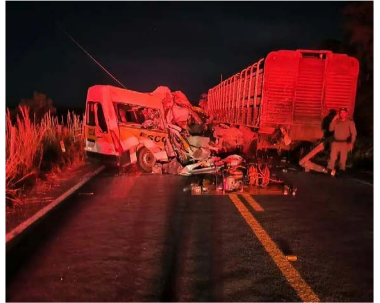
Van escolar colidiu na traseira de uma carreta

Estudantes voltavam da escola de Sanclerlândia para Córrego do Ouro quando ocorreu a colisão