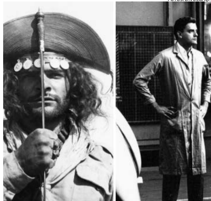
'Deus e o Diabo na Terra do Sol', de 1964: clássico do cinema novo

A Felicidade Chega aos 40. Brasil, 2014. Dir.: Daniel Nolasco. Com: Almir Amorim · Norval Barbari · Luzia Mello. Orcalino e Gertrudes, um casal de terceira idade, vê os móveis de sua casa sumirem repentinamente, como em um passe de mágica. (Folhapress, com Marcus Vinícius Beck)