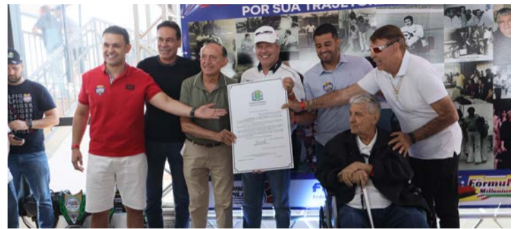
Evento marcou o início da temporada das principais categorias estaduais