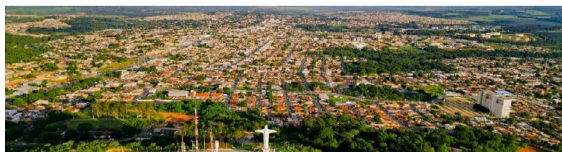
Senador Canedo sedia Celebrai 2026 com o tema "Hóstias vivas no mundo para a glória do Pai"