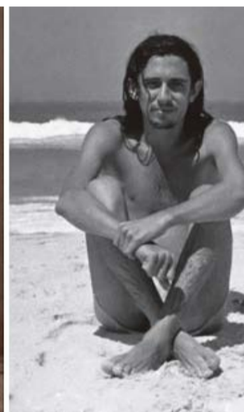
'Todas as Horas do Fim', de 2018