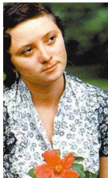
'A Hora da Estrela', de 1985: baseado em Clarice Lispector