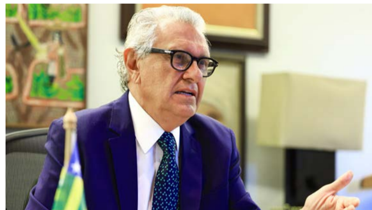
Ex-governador Ronaldo Caiado defende mudanças nos rumos da

Ex-governador defende redução de despesas e pede recuperação da capacidade de investimento