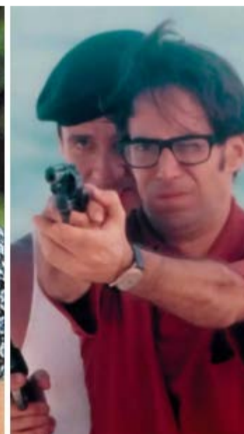
'O Que é Isso Companheiro', de 1997: relato de Gabeira