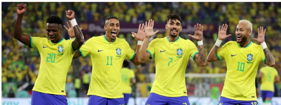
Seleção Brasileira tem valor de mercado estimado em R$ 5,28 bilhões