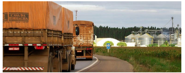
Em dezembro os fretes rodoviários tiveram os valores reduzidos em quase todas as regiões

Depois da queda nos preços dos fretes rodoviários registrada no ano passado, a expectativa é de que os valores voltem a subir entre 15% e 20% a partir do início deste ano