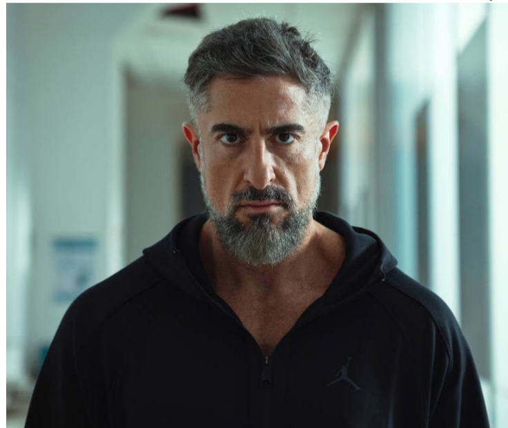
Marcos Mion interpreta lutador em 'MMA: Meu Melhor Amigo'