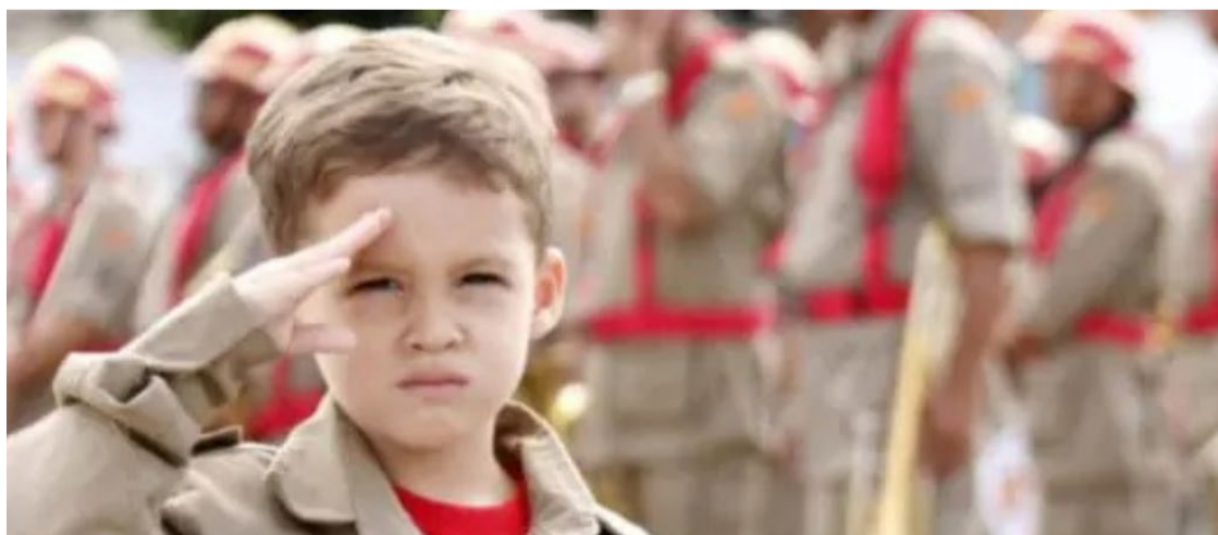
Oportunidade para crianças: edital publicado do Programa Educacional Bombeiro Mirim receberá inscrições

Para realizar a inscrição, é necessário acessar o site oficial do programa no endereço: www.bombeiro.go.gov.br .