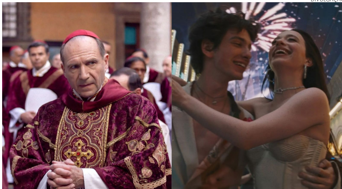
American Film Institute incluiu ambos os longas dentre os dez melhores do ano passado

"Anora" é escrito e dirigido por Sean Baker ("Projeto Flórida") e estrela Mikey Madison ("Pânico 5") como Ani, uma