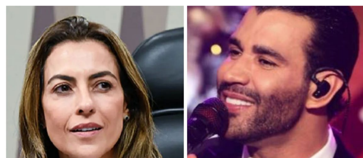
Soraya Thronicke e Gustavo Lima: CPI das Bets do Senado