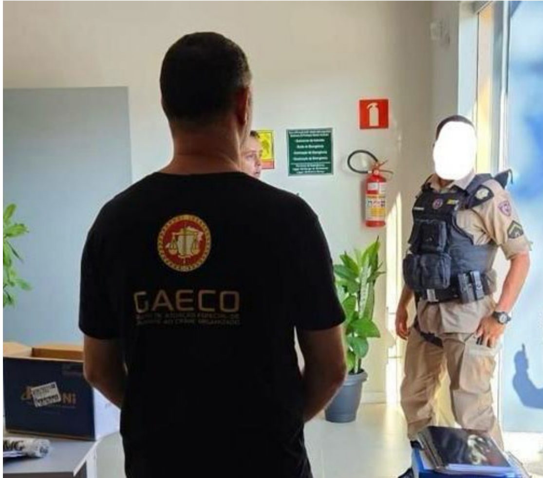
Agente do Gaeco e policial militar cumprem mandados da Operação Escola de Papel

Investigação teve início quando servidores públicos de Perolândia, em Goiás, apresentaram diplomas visando ao recebimento de gratificação de 30% de incentivo profissional por aperfeiçoamento ou capacitação. Mais de R$ 17 milhões foram bloqueados de cada um dos investigados