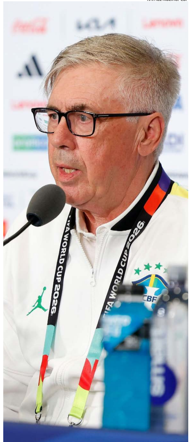
Carlo Ancelotti: italiano se formou na escola moderna do calcio

Dentro de campo, Meazza representava o orgulho nacional, utilizado pelo fascismo. Para muitos, Peppino foi o homem de Pozzo e Mussolini em campo, um garoto-propaganda do regime totalitário. A Squadra Azzurra chegou ao Olimpo do futebol vencendo em 34 e 38.