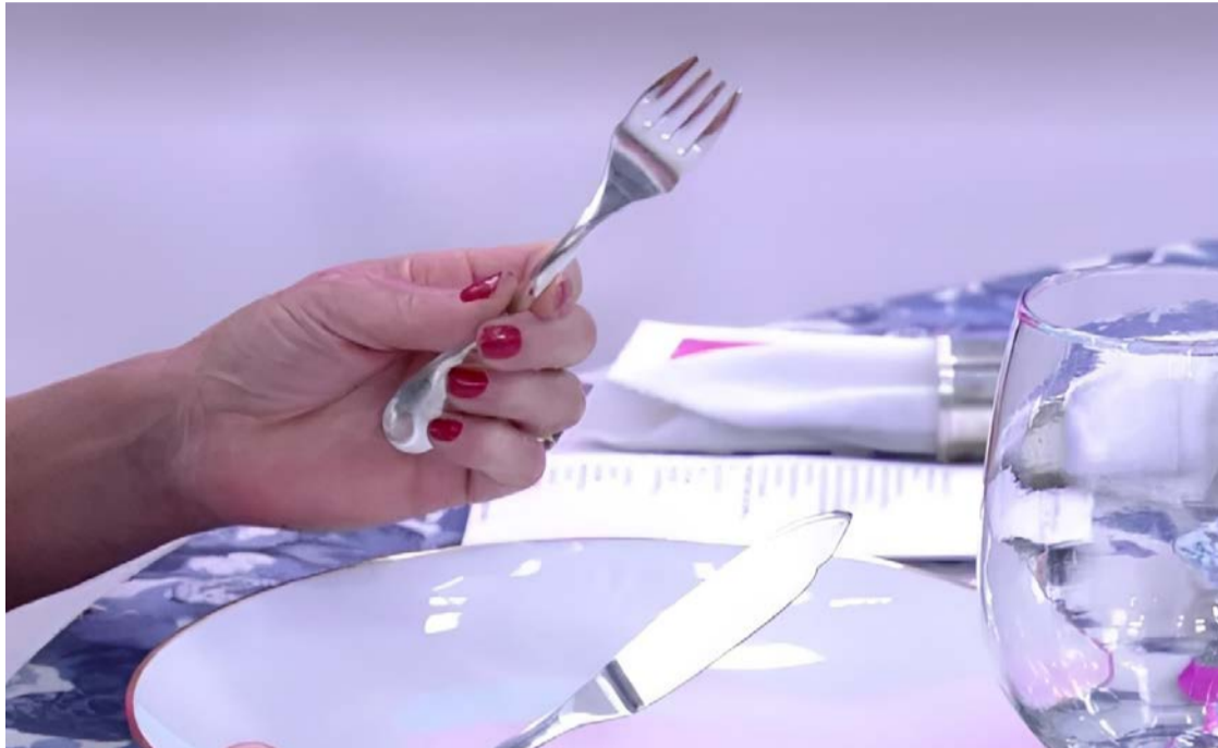
Orientação: não é frescura, é respeito ao paladar e ao trabalho do chef

Boa notícia é que a etiqueta existe justamente para nos ajudar a navegar por esses momentos com naturalidade e respeito. A seguir, veja dicas