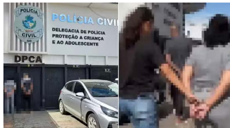
Familiar gravou o depoimento da criança e levou o áudio à Delegacia

Crime acontecia dentro da residência onde a família morava. Criança fez a denúncia