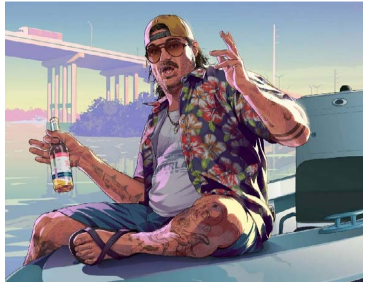
Pré-venda tem início nesta quinta-feira (25/6)