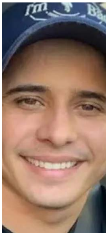
Humorista foi preso nesta terça-feira (23/02) no Paraguai