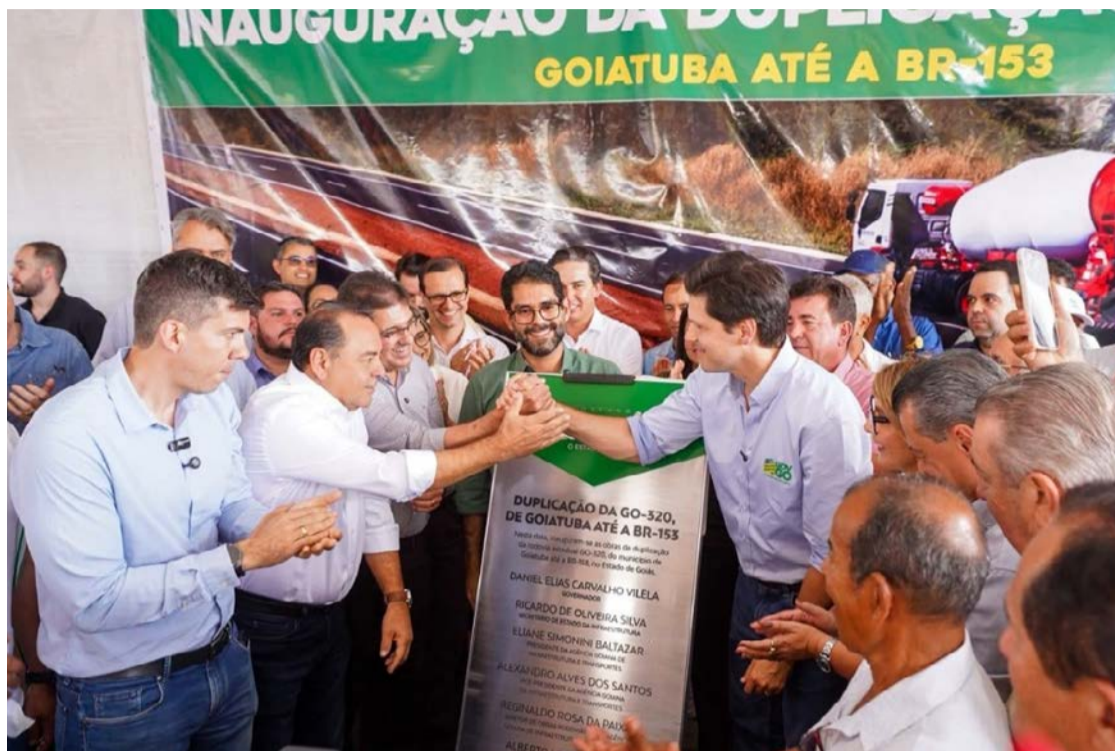
Governador Daniel Vilela destacou padrão de qualidade das rodovias goianas em Goiatuba

O governador inaugurou, também na nesta terça-feira (23/6), as obras de pavimentação asfáltica e drenagem das vias internas do Distrito Agroindustrial de Itumbiara (Diagri). O investimento estadual foi de R$ 14,8 milhões e contemplou 4,97 quilômetros