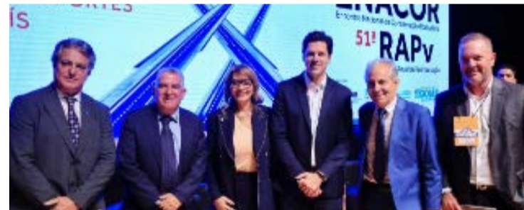
Enacor reuniu em Goiânia especialistas de todo país