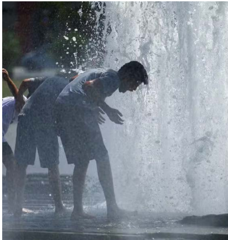
Fenômeno ocorre por uma massa de ar quente vinda do deserto do Saara

A França enfrenta a situação mais crítica. A agência meteorológica Meteo France colocou 49 departamentos em alerta vermelho e prevê temperaturas acima de 42°C na região de Bordeaux. Três idosos, com idades entre 80 e 95 anos, morreram após complicações relacionadas ao calor. Segundo a ministra da Saúde, Stéphanie Rist, não há previsão de alívio imediato, e o país deve enfrentar vários dias consecutivos