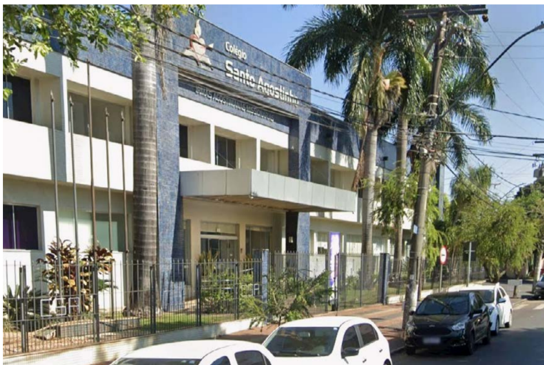
Ranking revela melhores escolas de Goiás: Santo Agostinho, segunda mais antiga escola da Capital, aparece dentre as primeiras colocadas

Completam as dez primeiras posições a Arena Enem Vestibulares, de Goiânia (698,17), que tem se destacado em outras aprovações