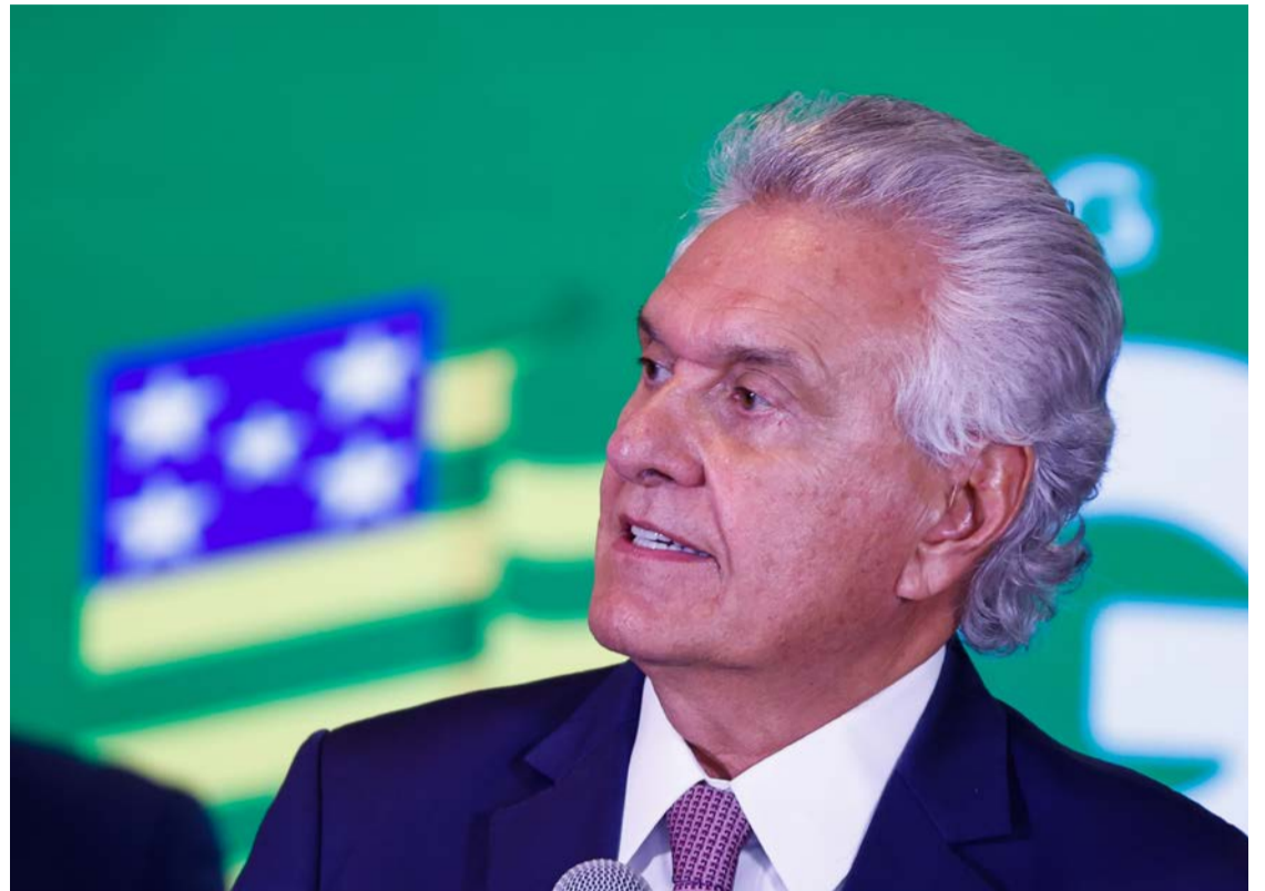
Ronaldo Caiado participou de debate com outros presidenciais

Os demais participantes também defenderam medidas de endurecimento no combate às facções criminosas. Romeu Zema