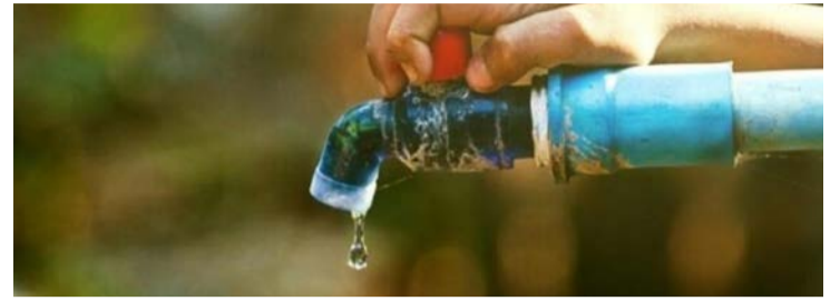
Goiânia é a capital com o menor índice de perda pelo quinto ano consecutivo