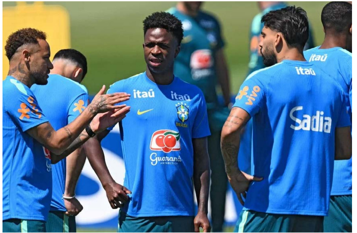
Com quatro pontos, a Seleção Brasileira lidera o grupo ao lado do Marrocos, que também soma quatro, mas aparece com saldo inferior

A principal dúvida na escalação está no ataque,