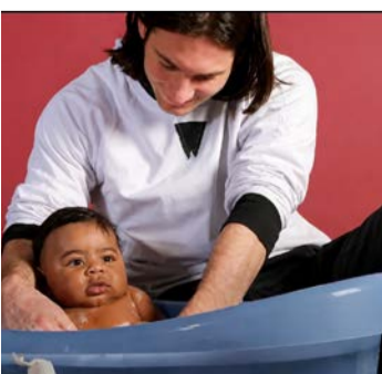
Feita durante ação beneficente em 2007, foto mostra Messi segurando o pequeno Lamine Yamal, uma das maiores promessas do futebol mundial

O registro foi feito quando Messi ainda construía os primeiros capítulos da trajetória que o levaria a conquistar títulos, recordes e o reconhecimento como um dos maiores jogadores da história. Do outro lado da foto estava Yamal, então com apenas cinco meses de idade, sem que ninguém pudesse imaginar que ele também vestiria a camisa do Barcelona e alcançaria projeção mundial na seleção espanhola.