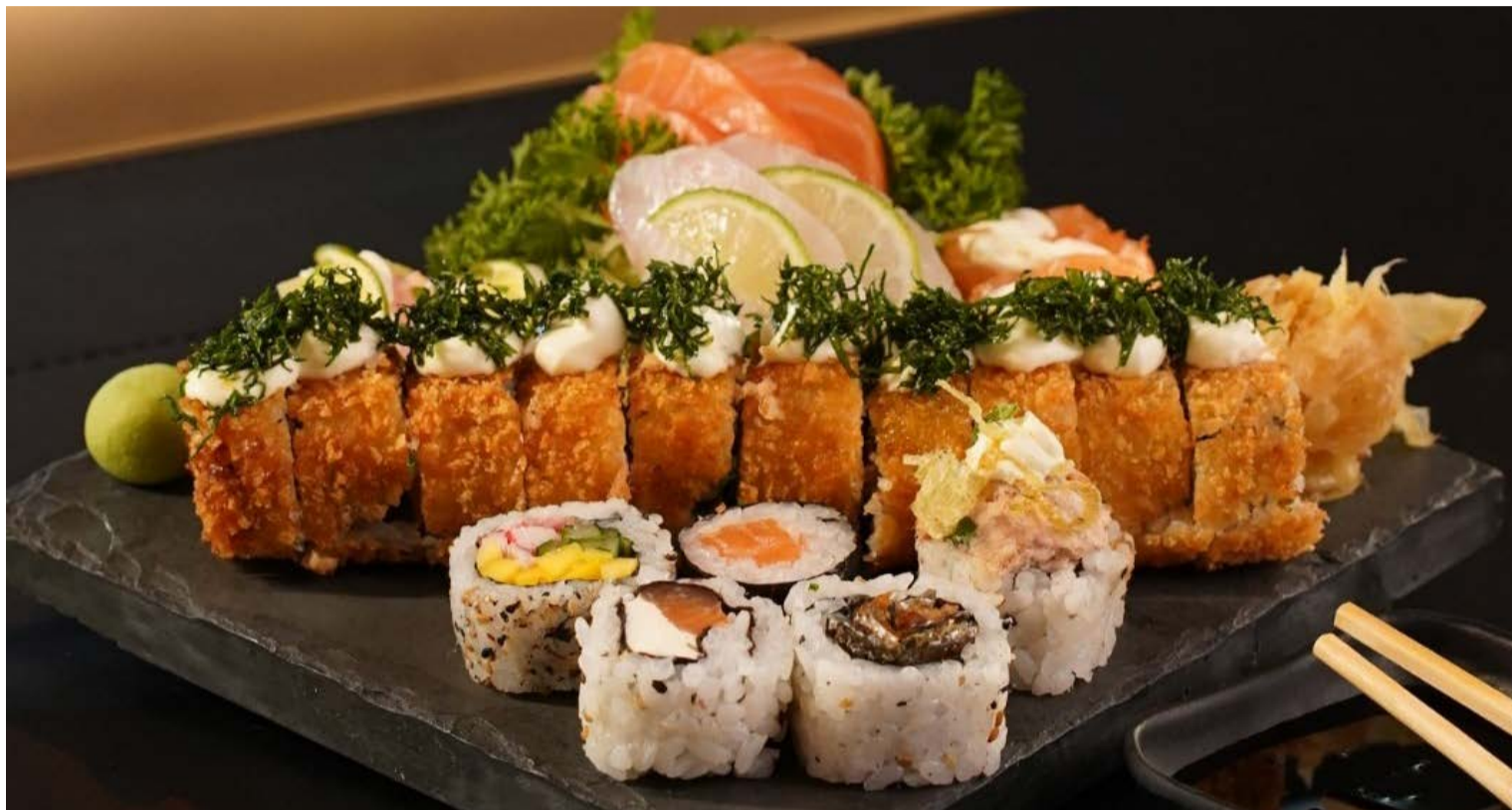
Mesa japonesa: rodízio e pratos à la carte reúnem referências à culinária oriental tradicional e contemporânea

Com bares, restaurantes e opções para diferentes públicos, Diário da Manhã lista destinos no Eldorado, que se consolida como point para encontrar amigos e acompanhar jogos do Brasil na Copa do Mundo