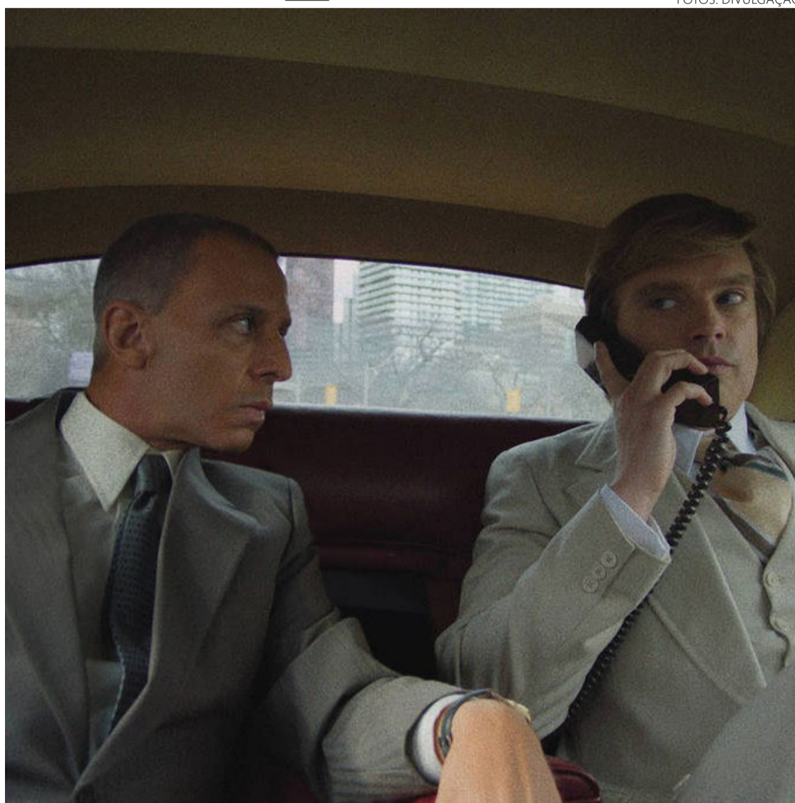
Caracterização: longa-metragem existe, em princípio, para narrar juventude de um trapaceiro, Trump

Logo depois, Tom Ortenberg, que ajudou a lançar filmes politizados como "Fahrenheit 11 de Setembro" e "Spotlight", adquiriu os direitos de distribuição num acordo que levou meses de negociações e adiantamentos que só vai gerar lucro caso o longa seja