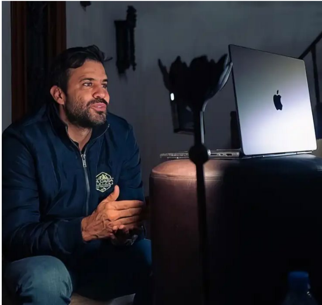
Patrimônio milionário de Pablo Marçal teve origem em uma carreira de influenciador e coach

A atividade do autodenominado ex-coach goiano Pablo Marçal é apenas um bloco no império da chamada economia dos criadores, que faz girar as engrenagens dos conglomerados trilionários das redes sociais