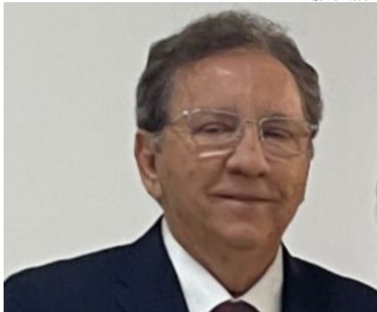
Escritor tece contundentes críticas à realidade política brasileira