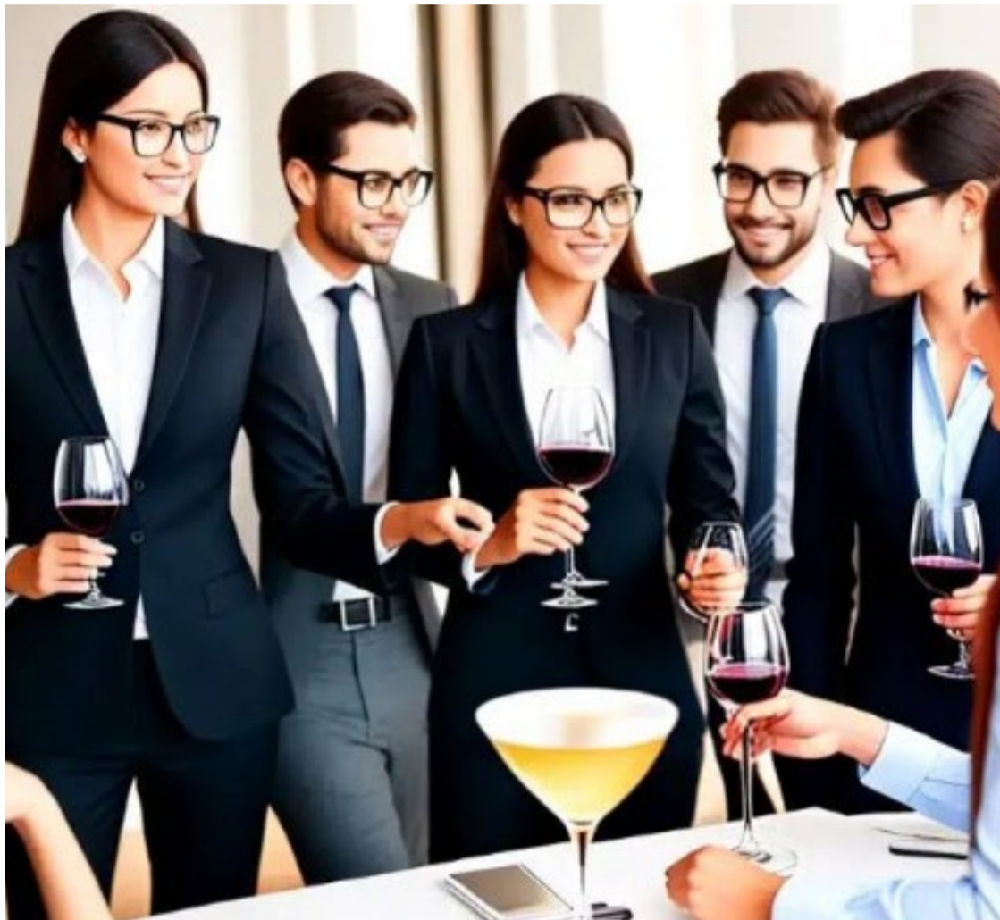
Reuniões são ótimas para networking, mas é preciso saber se comportar

Participar de eventos profissionais é uma excelente oportunidade para networking, entretanto, saber como se vestir e se portar é crucial para causar uma boa impressão. As dicas sobre como se vestir e se comportar vão garantir a você maximizar o impacto positivo que terá abrindo portas para novas oportunidades.