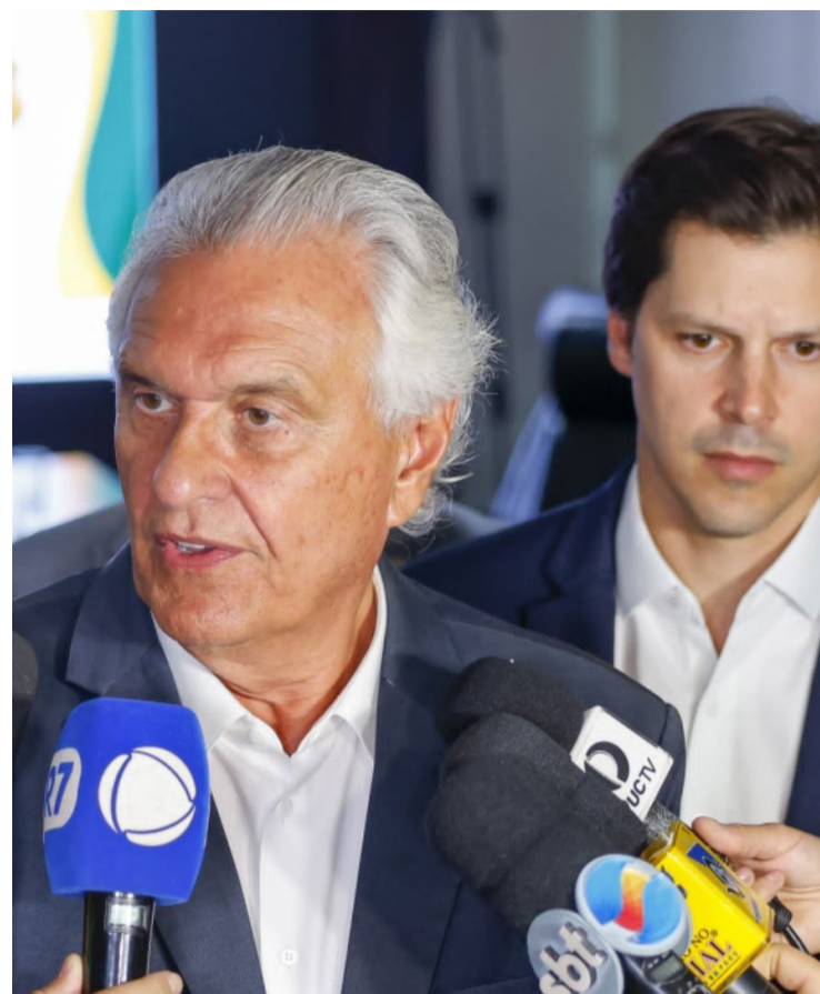
Ronaldo Caiado alertou governador de São Paulo há dois anos sobre situação da Enel: "Tem que ser jogo pesado. Em Goiás, consegui expulsá-los"

Até a manhã de terça-feira, 15, 220 mil imóveis na região metropolitana de São Paulo seguiam sem qualquer sinal de energia elétrica, sendo 147 mil ocorrências na capital, 6,5 mil em Diadema (SP) e 5 mil em São Bernardo do Campo (SP).