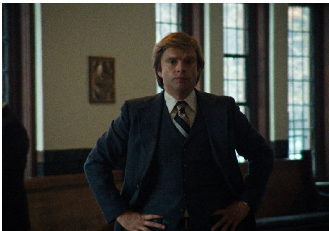
Desmascarado: produção mostra que político fez cirurgia de lipoaspiração e para impedir calvície

bem-sucedido nas bilheterias. E Trump ainda pode cumprir a ameaça de processar todos.