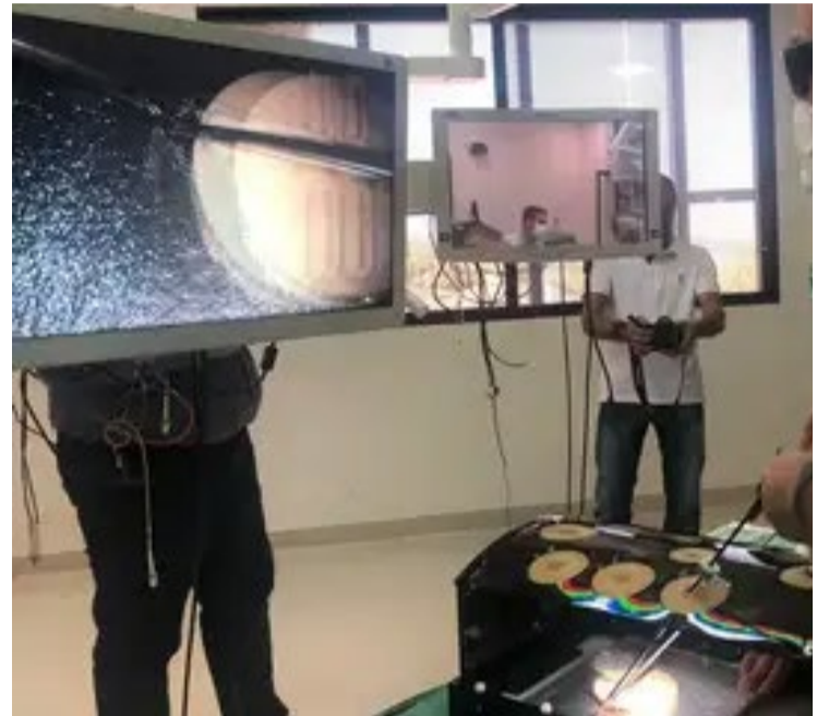
O diferencial da radioterapia Flash é o uso de altas doses de radiação em milissegundos

Chamada de Flash, a técnica tem sido objeto de estudos em vários países, inclusive no Brasil, e está sendo desenvolvida em parceria com o maior laboratório de física de partículas do mundo