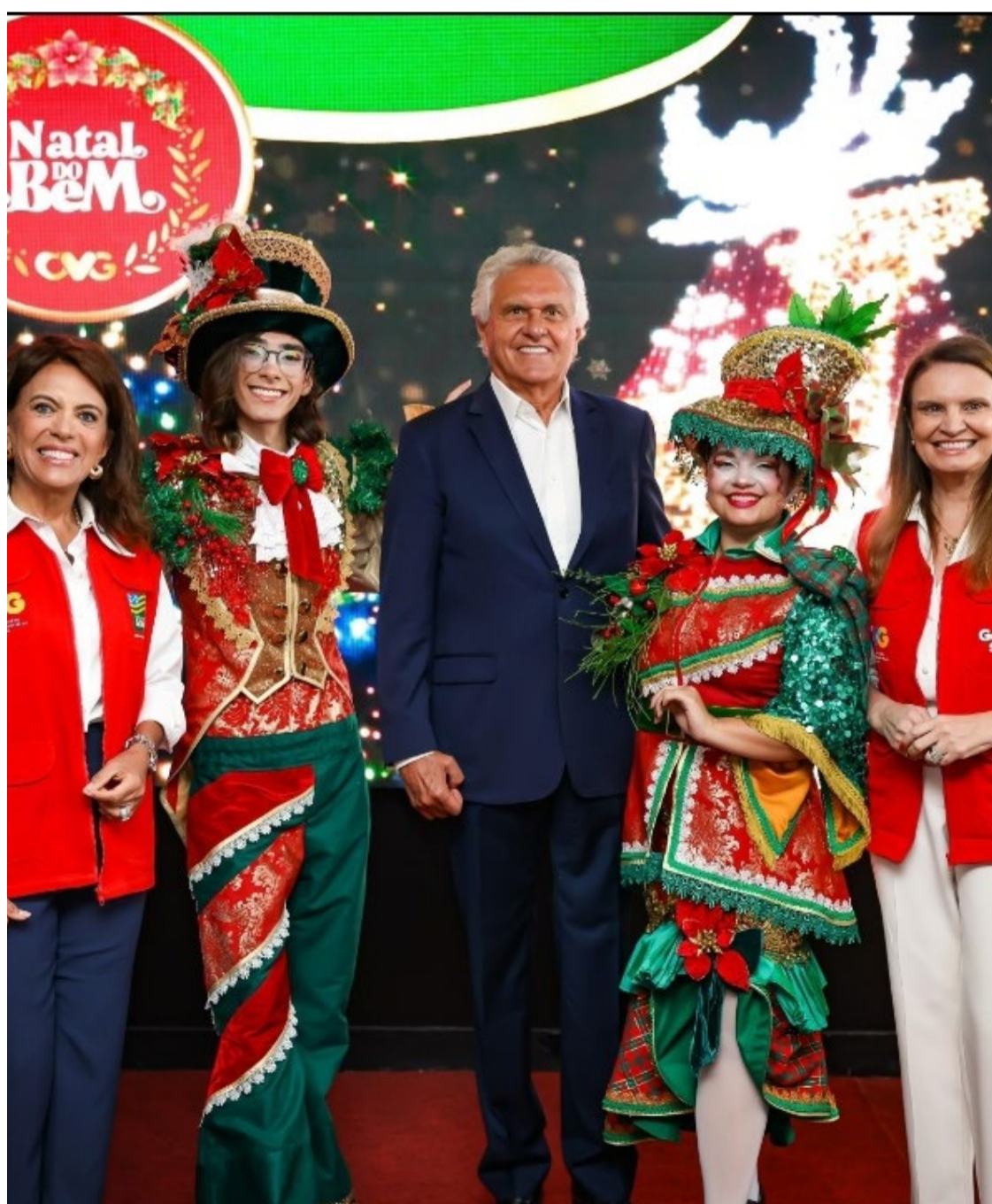
Ronaldo Caiado e primeira-dama Gracinha Caiado anunciam Natal do Bem 2024

Para maior conforto dos visitantes, haverá equipes de saúde e segurança, além de seis estacionamentos com 12 mil vagas. O transporte público contará com quatro linhas exclusivas, sendo duas gratuitas. O evento funcionará de terça a domingo, das 18h às 23h, com horários especiais nos dias 24 e 31 de dezembro.