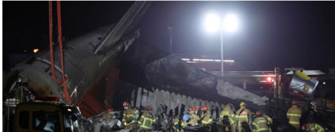
Avião acidentado foi consumido pelas chamas: 179 mortos e dois sobreviventes

Boeing 737-800 da Jeju Air caiu enquanto tentava pousar no aeroporto de Muan, locali-