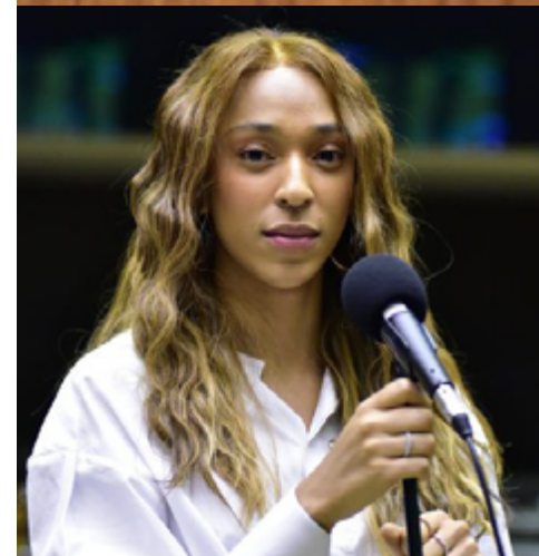
Ricardo Nunes (MDB/SP), Flávio Dino (STF), Alexandre de Moraes (STF), Lula da Silva (PT), Erika Hilton (PSOL/SP) e Braga Netto (PL)

Política e Eleitoral (OVPE), do Grupo de Investigação Eleitoral da Universidade Federal do Estado do Rio de Janeiro (Giel/Unirio), registros de violência referentes ao período entre 16 de agosto (início das campanhas) e 27 de outubro (segundo turno) apontam 328 casos contra lideranças políticas e/ou seus familiares.