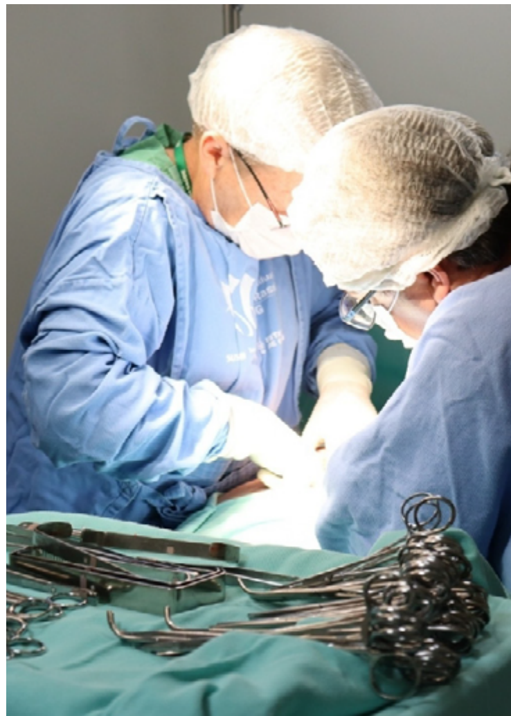
Ações de captações de órgãos envolvem várias equipes da Saúde estadual: ano passado foram realizadas 113 doações

Katiuscia prevê muito trabalho em 2025, para ampliar os números desse importante ato de solidariedade em Goiás. "A Gerência de Transplantes pretende continuar com as ações de capacitação de profissionais de saúde e campanhas de sensibilização da população, além de ter a previsão de utilizar o Sistema Integrado de Doação de Órgãos e Avaliação de Receptores (Sidoar), um importante sistema estadual criado para gerenciar todas as atividades de doação e transplante no Estado", adianta.