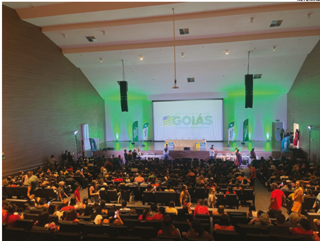
Cerimônia de entrega dos certificados foi realizada na sexta-feira, 27, no Centro de Convenções de Anápolis

O Crédito Social tem valor de até 5 mil reais, dependendo do curso de formação, calculado para comprar todos os insumos e ferramentas necessários para abrir o próprio negócio. A Bolsa Qualificação é um incentivo à profissionalização, no valor de R$ 250 mensais, relativos ao período de duração do curso, que podem ser gastos com produtos alimentícios. Uma das beneficiadas com