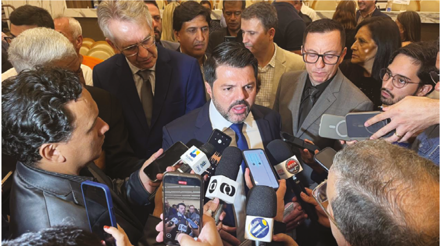
Prefeito eleito afirma que tem respeito pela oposição e a independência do poder legislativo; e garante que não tem dificuldade em receber críticas

Não, a gente ainda não tem esse projeto, essa discussão. A gente vai fazer a gestão a várias mãos, dialogando com o legislativo, com os servidores, com a população, conhecendo a realidade fiscal do município. Nós precisamos, sim,