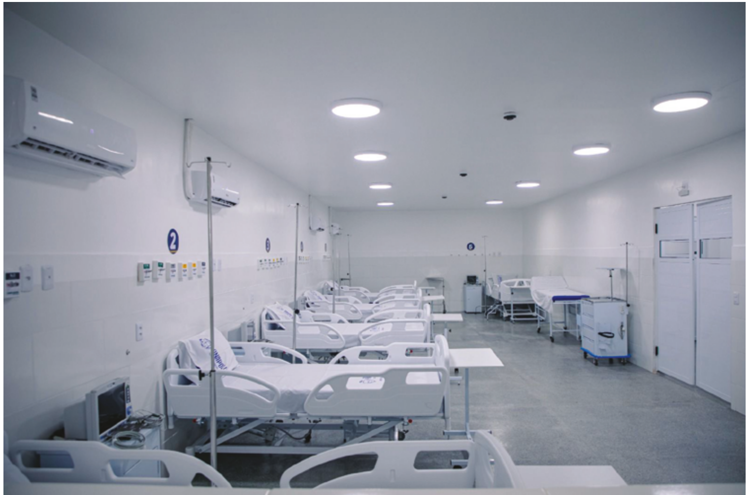
Toda estrutura do novo hospital municipal está finalizada, com mobiliário montado, e pronta para iniciar funcionamento a partir de janeiro de 2025

O Hospital Municipal Georges Hajjar é mais uma grande estrutura de saúde entregue pela Prefeitura em pouco mais de uma semana. Na última terça-feira (17), começou a funcionar a UPA da Mulher Anapolina Jamel Cecílio, que já