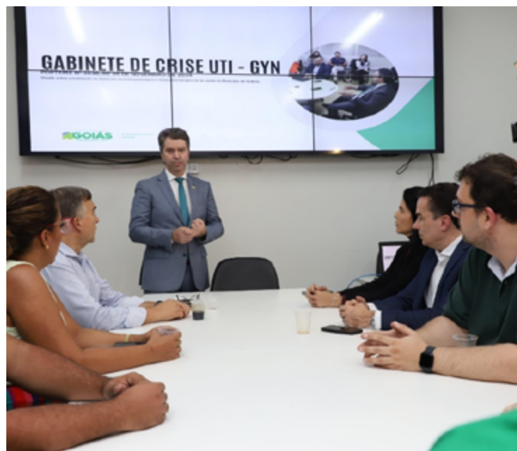
Gabinete de Crise da Saúde de Goiânia, coordenado pela SES-GO

Entre as medidas tomadas no período estão a abertura de 20 novos leitos de UTI e a reativação de outros 47 no Hospital Ruy Azeredo; a disponibilização de 16 leitos no Hospital das Clínicas da UFG; e a inauguração de 40 leitos de UTI e de 55 de enfermaria no Hospital Estadual de Águas Lindas. Essa expansão da rede de atendimento permitiu que a maioria das solicitações por UTI fosse atendida em menos de 24 horas.