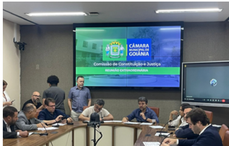
CCJ da Câmara de Goiânia: gratificação