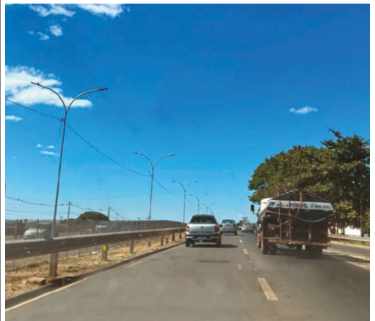
Trecho tem rodovias em perfeito estado de conservação, mesmo assim, não se pode arriscar, principalmente sob chuva ou neblina

Caso seja indispensável seguir viagem nessas condições, recomenda-se a utilização de faróis de neblina ou farol baixo. Também é importante assegurar o perfeito funcionamento do ar-condicionado, pois pode facilitar para desembaçar os vidros. (Com informações Ecovias do Araguaia)