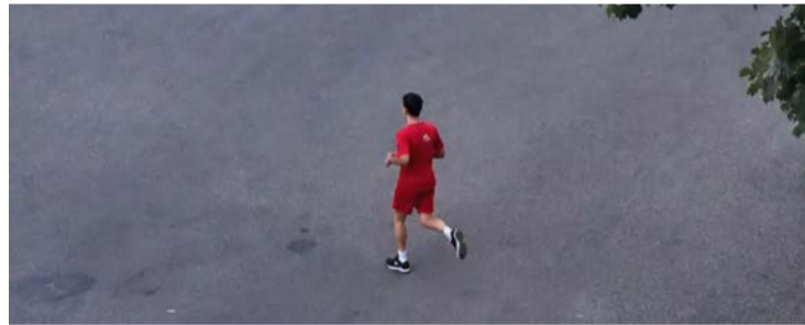
Bombeiro é indiciado por maus tratos a animais