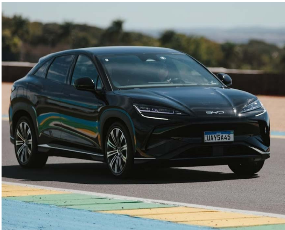
Sealion 7, primeiro SUV cupê da marca, em ação no Autódromo Ayrton Senna, em Goiânia

No desempenho, o Sealion 7 entrega números de superesportivo. Equipado com tração integral AWD, o modelo desenvolve 531 cavalos de potência e 690 Nm de torque, acelerando de 0 a 100 km/h em apenas 4,5 segundos. O veículo conta ainda com suspensão Double Wishbone na dianteira, sistema Multilink na traseira