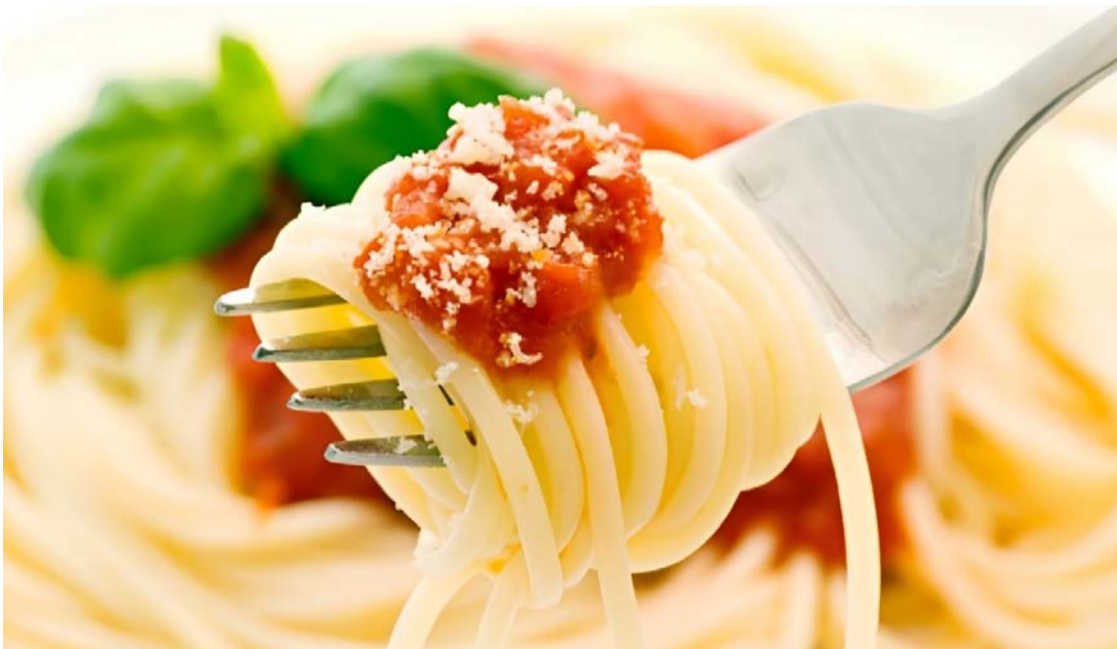
Segredo na simplicidade: massas longas geram apreensão em jantares

Ao conectar postura física à suavidade dos movimentos, convido você a desvendar pequenos mistérios do dia a dia que revelam presença segura