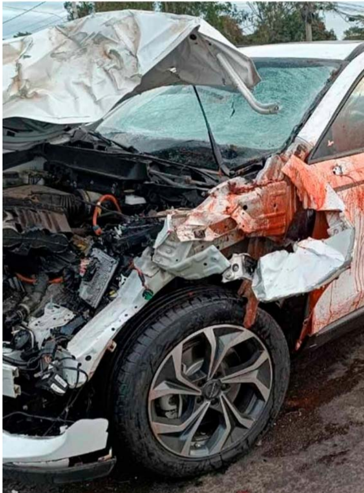
Polícia Civil investiga atropelamento de militar durante atendimento a acidente com o cantor Israel

A Polícia Civil abriu investigação para esclarecer as circunstâncias do caso. A apuração inclui o crime de lesão corporal, além do agravante relaciona-