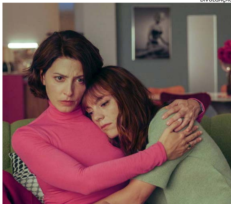
Longa se baseia em conto do livro "O Último Sonho", do diretor