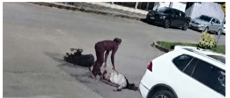
Mulheres atropeladas se recuperam em casa após atendimento em Hidrolândia