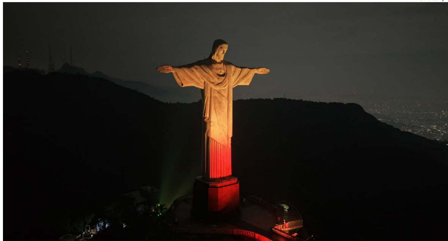
E foi assim: cartão-postal do Rio de Janeiro abre os braços para celebração da fé na Capital goiana

Com entrada gratuita, Totus Tuus Mariae Festival projeta neste sábado (30/5) caravanas de todo o país. Cristo Redentor recebeu iluminação especial para divulgar encontro na capital fluminense