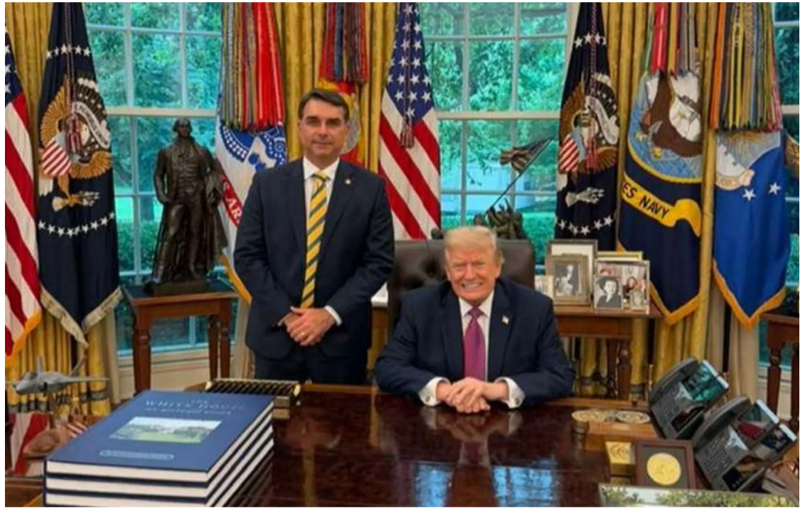
Flávio Bolsonaro se encontrou com o presidente Trump na Casa Branca: acordos

EUA com Trump há três semanas, afirmou que a designação de facções como terroristas não esteve presente no encontro entre eles no dia 7 de maio, mas que foi apresentada uma proposta de cooperação entre os EUA e Brasil para combate ao crime organizado.