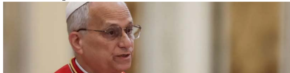
Papa Leão 14: documento do Vaticano afirma que tecnologia não pode dominar o ser humano