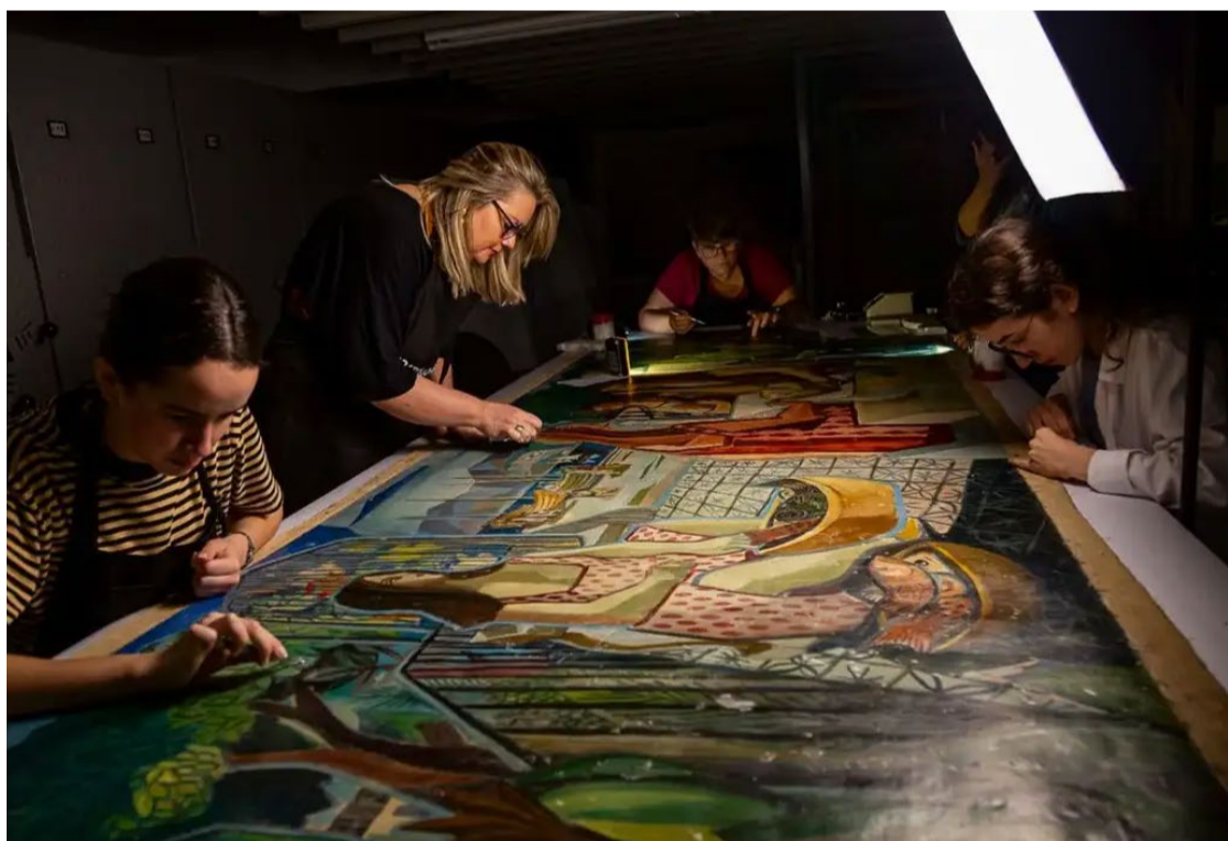
Esforços somados: empreitada uniu profissionais do Iphan e da UFPel

restaurada em um minucioso trabalho que contou com técnicas avançadas de raio-X e análise microscópica de esmalte e pigmentos. A escultura "Vênus Apocalíptica Fragmentando-se", de Marta Minujín, uma artista argentina, também foi devolvida, bem como a escultura de madeira "Galhos e Sombras", de Frans Krajcberg, artista polonês naturalizado brasileiro.