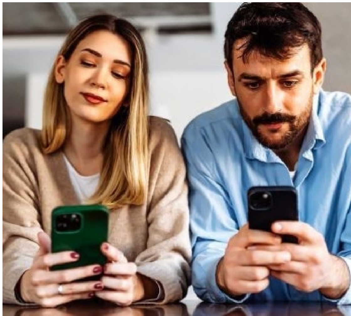
Aumento da comunicação virtual gerou regras de boa convivência

Em um mundo cada vez mais conectado, a comunicação digital se tornou um pilar essencial das nossas interações diárias. Com este aumento na comunicação virtual surgiu a necessidade de estabelecer regras de comportamento ou "netiqueta", como uma forma de garantir a convivência harmônica e respeitosa entre os usuários da internet. O termo é uma combinação de "network" (rede) e "etiquette" (etiqueta), refere-se a um conjunto de normas que devem ser seguidas para promover um ambiente digital civilizado.