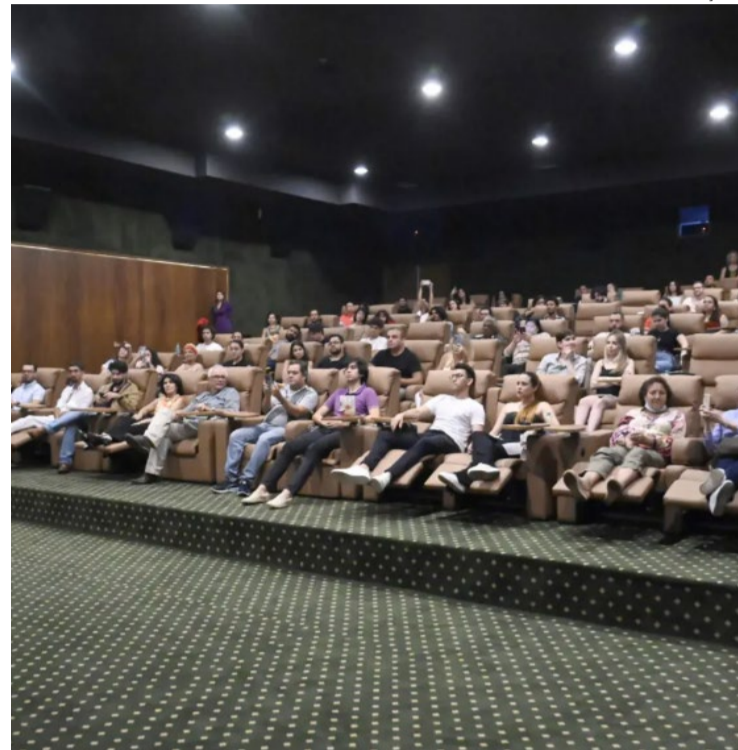
Evento reuniu mais de 330 mil espectadores desde 2001