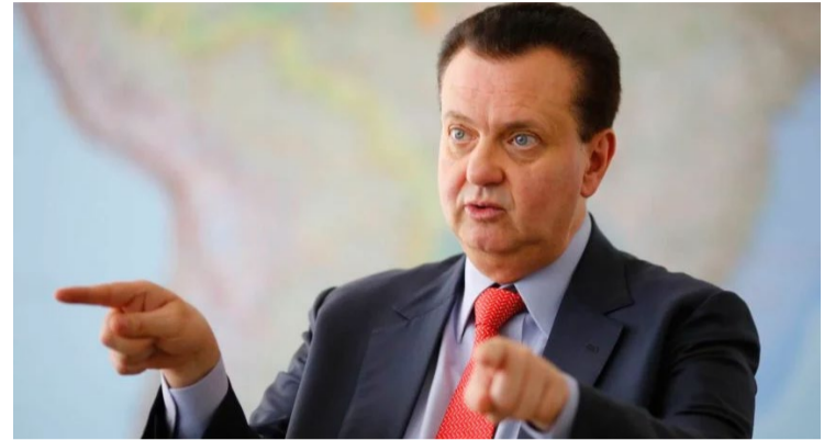
Gilberto Kassab: fusão do PSD e PSDB