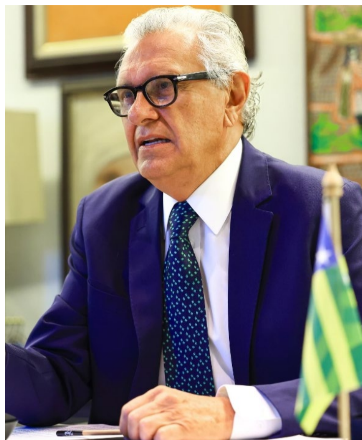
Governadores como Tarcísio de Freitas e Eduardo Leite também expressam insatisfação semelhante a de Ronaldo Caiado: controle em vez de ação

Com críticas alinhadas a outras lideranças estaduais, o governador promete intensificar o debate com o governo federal para garantir que as prerrogativas dos estados sejam respeitadas e que ações mais contundentes sejam tomadas contra o avanço do crime organizado no Brasil.