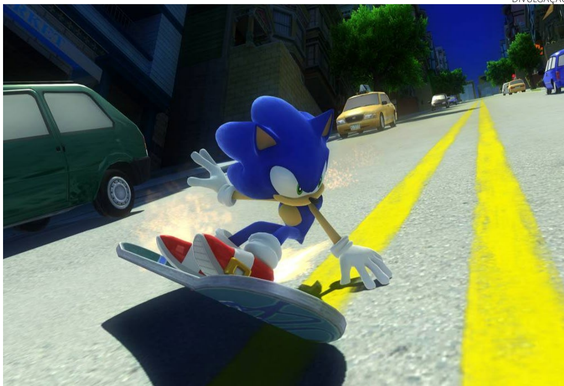
Jogo parece ter sido feito sob medida para quem jamais largou a mão do ouriço azul

O jogo antecipa uma publicidade do filme "Sonic 3", que estreia nos cinemas perto do Natal com Shadow no elenco. Mas desde 2005, o bichano virou motivo de polêmica quando protagonizou seu jogo solo, numa pegada mais sombria, lutando contra alienígenas de metralhadora na mão — algo