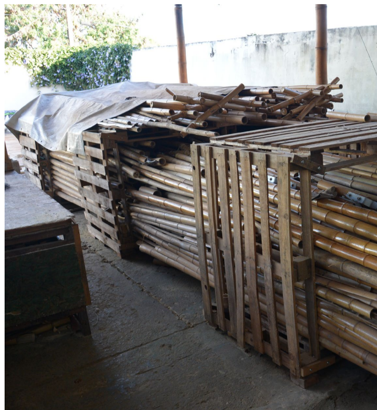
Faculdade de Agronomia da UFG criou uma disciplina sobre o cultivo e artesanato do bambu

Apesar de seu potencial para impulsionar a economia, promover a sustentabilidade ambiental e beneficiar comunidades rurais, o cultivo do bambu enfrenta desafios a serem superados