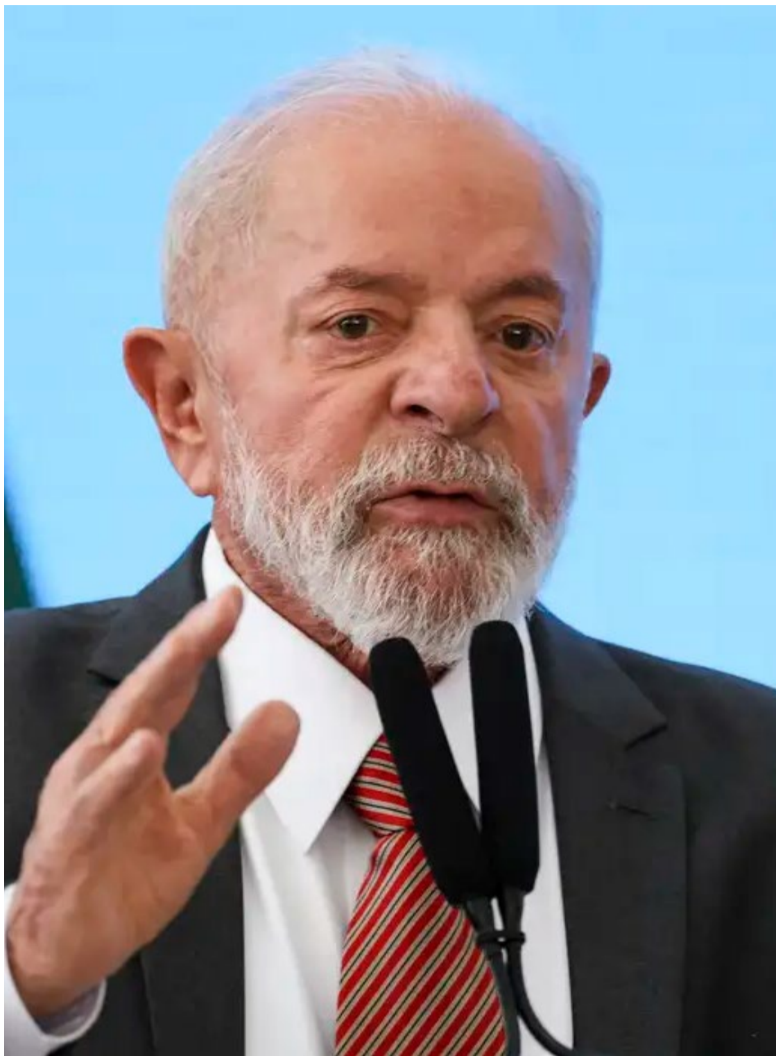
Lula da Silva: "Abraço da Democracia" no 8 de janeiro, na Praça dos Três Poderes

Os dois primeiros, pela manhã, serão de lançamento de peças degradadas na invasão do 8 de Janeiro. Segundo o governo, 21 obras e peças históri-