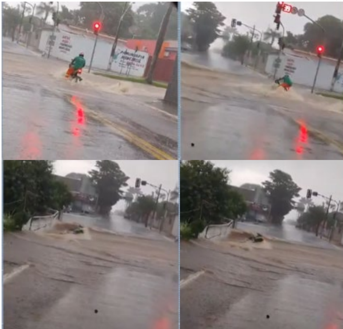
Motociclista foi carregado por uma enxurrada em Mineiros, no sudoeste de Goiás e desapareceu em um córrego