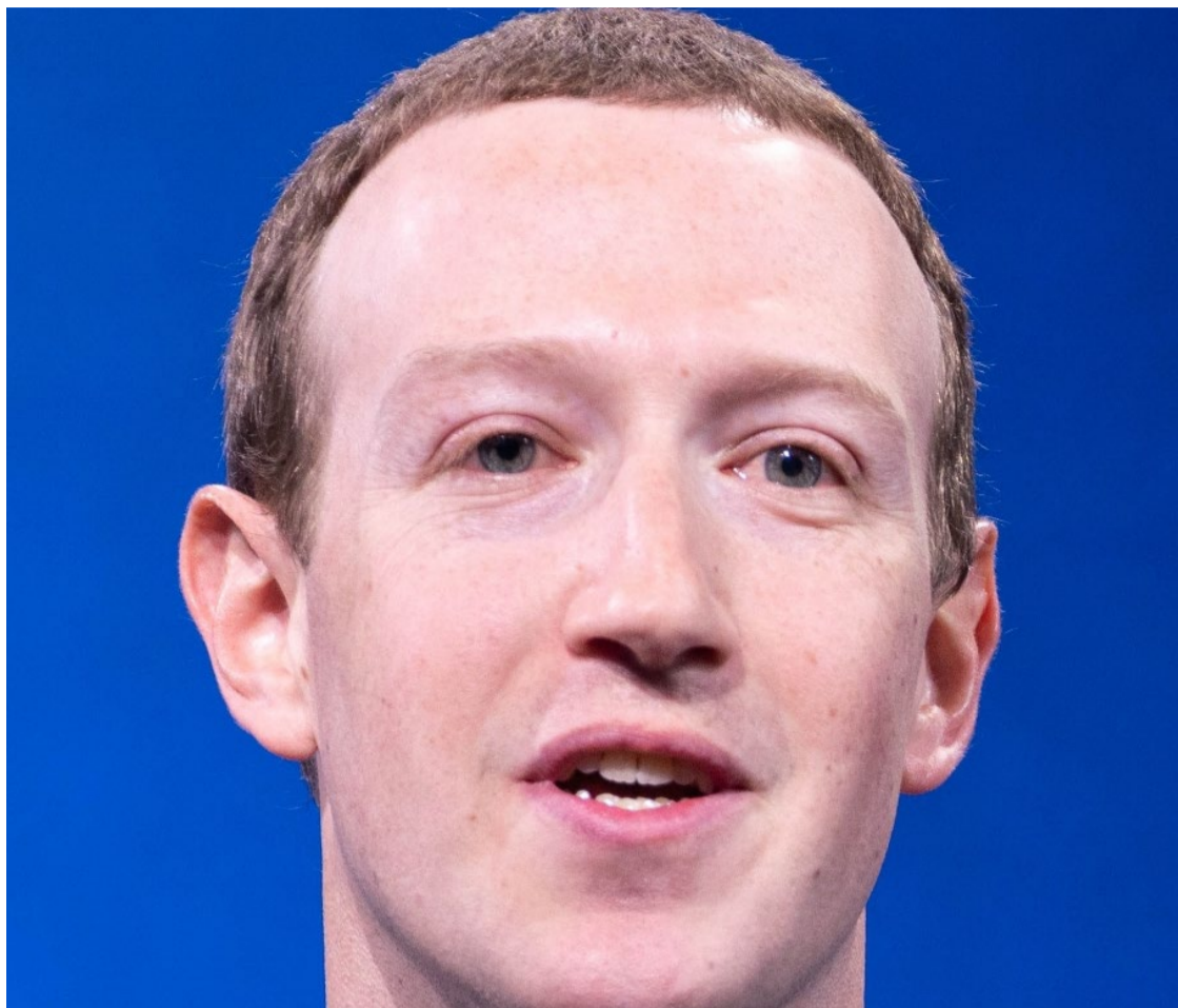
Mark Zuckerberg, CEO da Meta: aposta segura para alinhamento ideológico

Em artigo assinado pelo novo vice-presidente de assuntos globais, Joel Kaplan, a companhia afirma que as medidas anunciadas por Zuckerberg visam incentivar que as pessoas se comuniquem mais e evitar bloqueios equivocados.