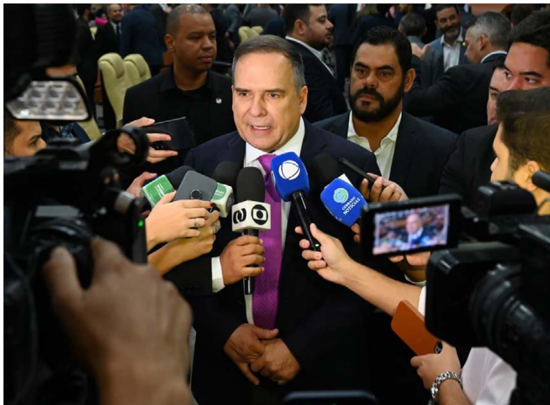
Prefeito Sandro Mabel fez balanço do primeiro ano de gestão e busca conciliação e estabilidade

Ao tratar o tema apenas sob a ótica administrativa, o prefeito reforça um discurso de gestor técnico, mas deixa em segundo plano o debate sobre os impactos políticos dessas decisões.