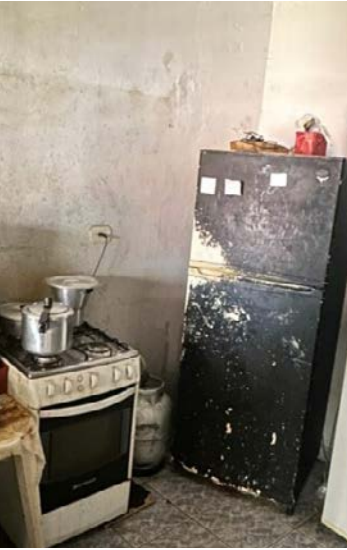
Nove crianças, com idades entre 1 e 6 anos, estavam no imóvel

Ainda conforme informações dos policiais, as investigações devem prosseguir com o objetivo de apurar eventual responsabilidade criminal dos pais ou responsáveis legais pelas crianças.