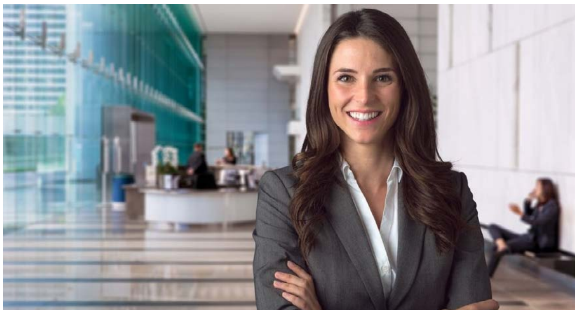
Líder moderno sabe que imagem gera confiança em uma sociedade competitiva

Em um mundo onde atenção é escassa e impressões são rápidas, presença se torna ferramenta estratégica de influência na vida profissional