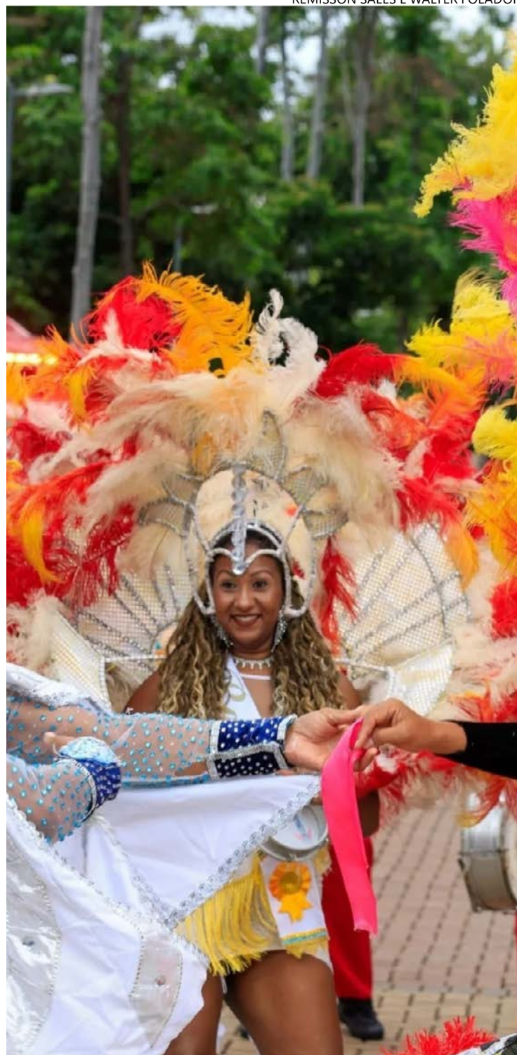
Goiânia se prepara para ter intensa programação carnavalesca, com atividades gratuitas abertas ao público