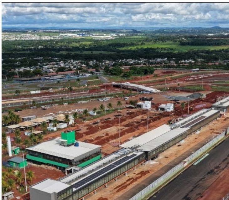
Obras finais para sediar Grande Prêmio do Brasil de MotoGP

Entre as intervenções conduzidas pela Goinfra estão a reconstrução e ampliação do paddock, modernização das arquibancadas, camarotes e sala de imprensa, além da construção de nova torre de controle e centro médico. Também passam por reforma os setores administrativos e áreas de apoio, com foco em conforto, segurança e funcionalidade para público, equipes e profis-