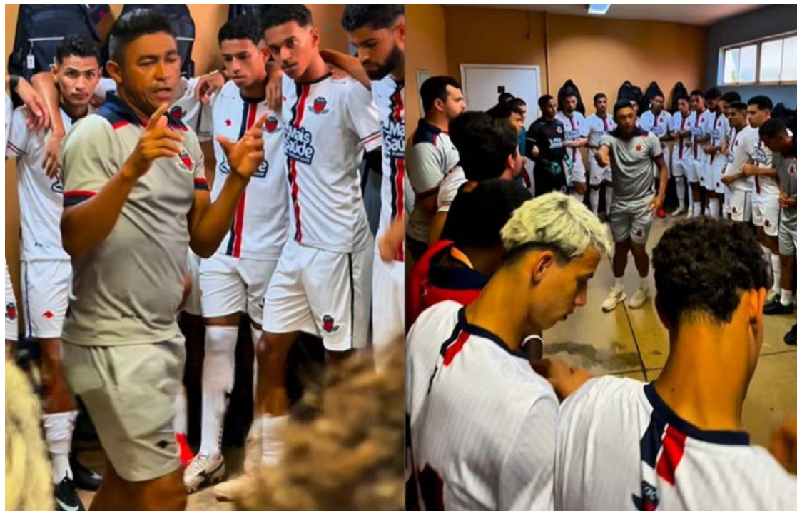
Valorização do esforço individual associado ao objetivo comum reforça a importância de cada jogador dentro do elenco

O duelo desta quarta-feira (14), às 19h30, em Cravinhos-SP, coloca o time goiano diante de um adversário que também chega com 100% de aproveitamento. O cenário reforça o peso da partida e a necessidade de manutenção dos aspectos que