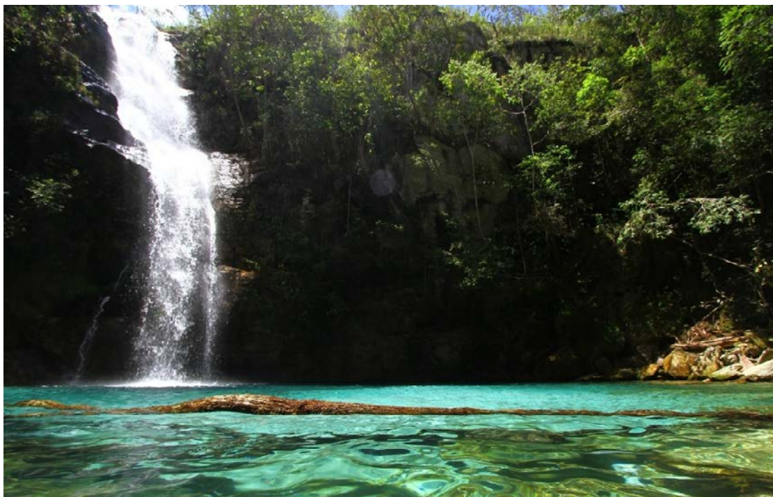
Goiás se destaca no turismo nacional, com atrativos naturais como a Cachoeira Santa Bárbara, em Cavalcante

O protagonismo do Estado também aparece em outro levantamento do IBGE. De acordo com a PNAD Contínua 2024, Goiás foi o oitavo destino mais visitado do Brasil, com 741 mil viagens recebidas, o equivalente a 3,7% do total