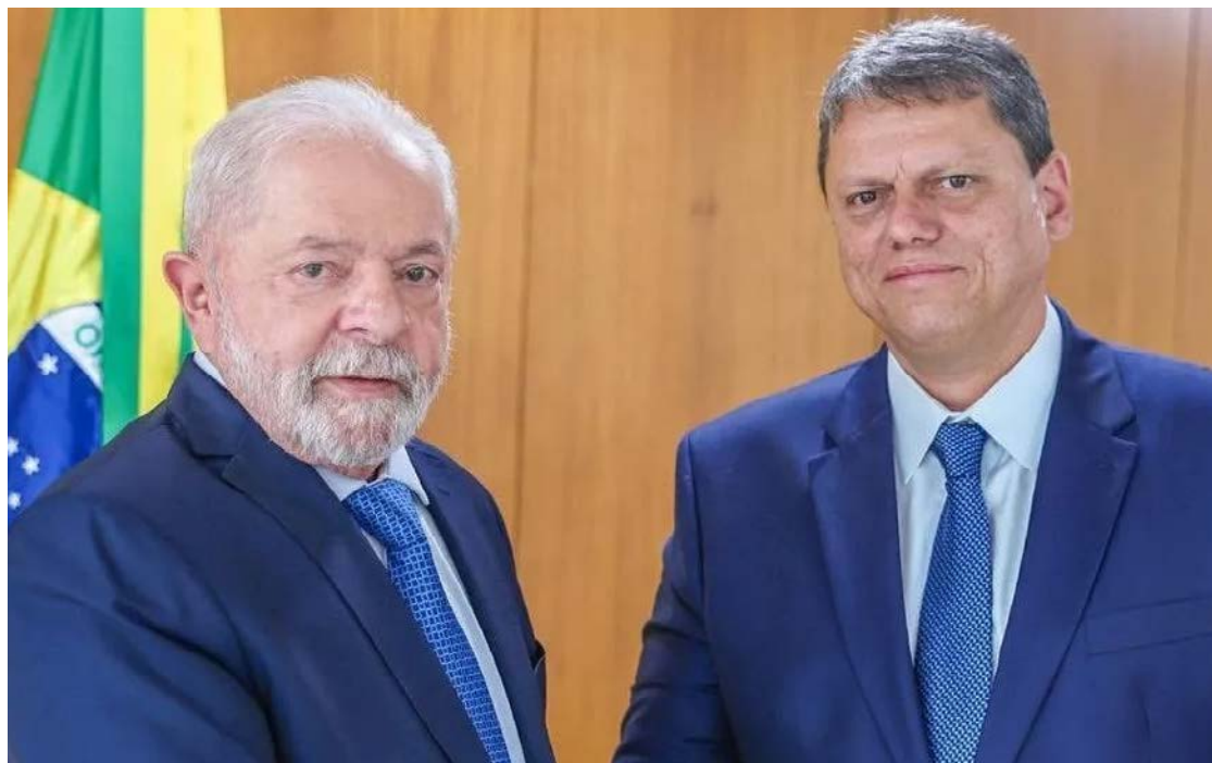
Lula empata dentro da margem de erro com Tarcísio Freitas

Na pergunta espontânea, em que os entrevistados respondem "Em 2026 teremos eleições para presidente do Brasil, se as eleições fossem hoje em quem você votaria?". Lula aparece com 32% das intenções de voto. O ex-presidente Jair Bolsonaro, inelegível e condenado a 27 anos e três meses de prisão, tem 9,5%, seguido por Flávio Bolsonaro (6,6%), Tarcísio