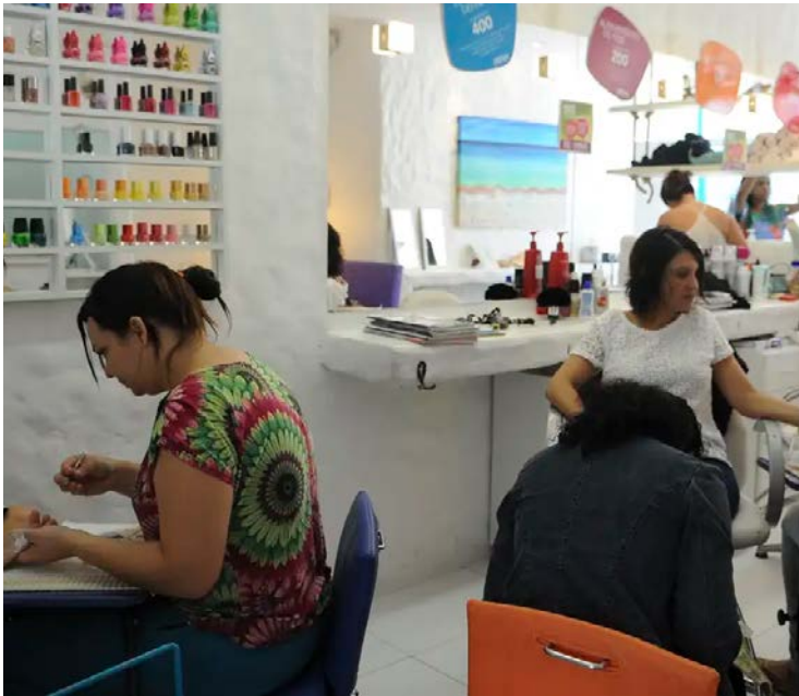
Estado acumula índices de crescimento de 2,6% no ano e de 2,4% em 12 meses

Dessa forma, o setor de serviços se encontra 20,0%