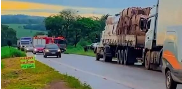
Acidente causou congestionamento na rodovia