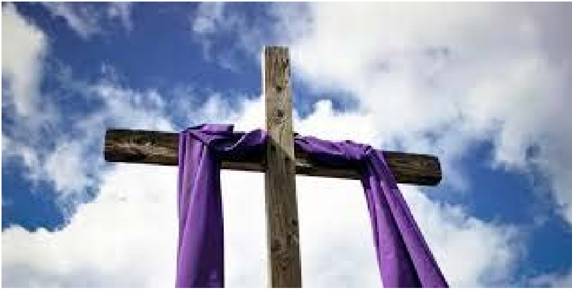
Durante a Quaresma, a tradição católica orienta restrições alimentares em alguns dias específicos

Durante a Quaresma, a tradição católica orienta restrições alimentares em alguns dias específicos. A principal recomendação