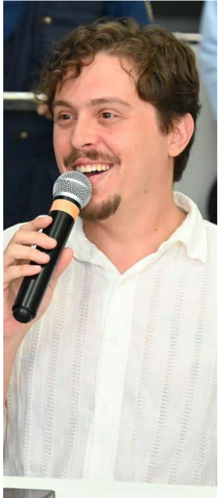
Cadillac afirma: "aprendemos que carnaval é construção permanente"