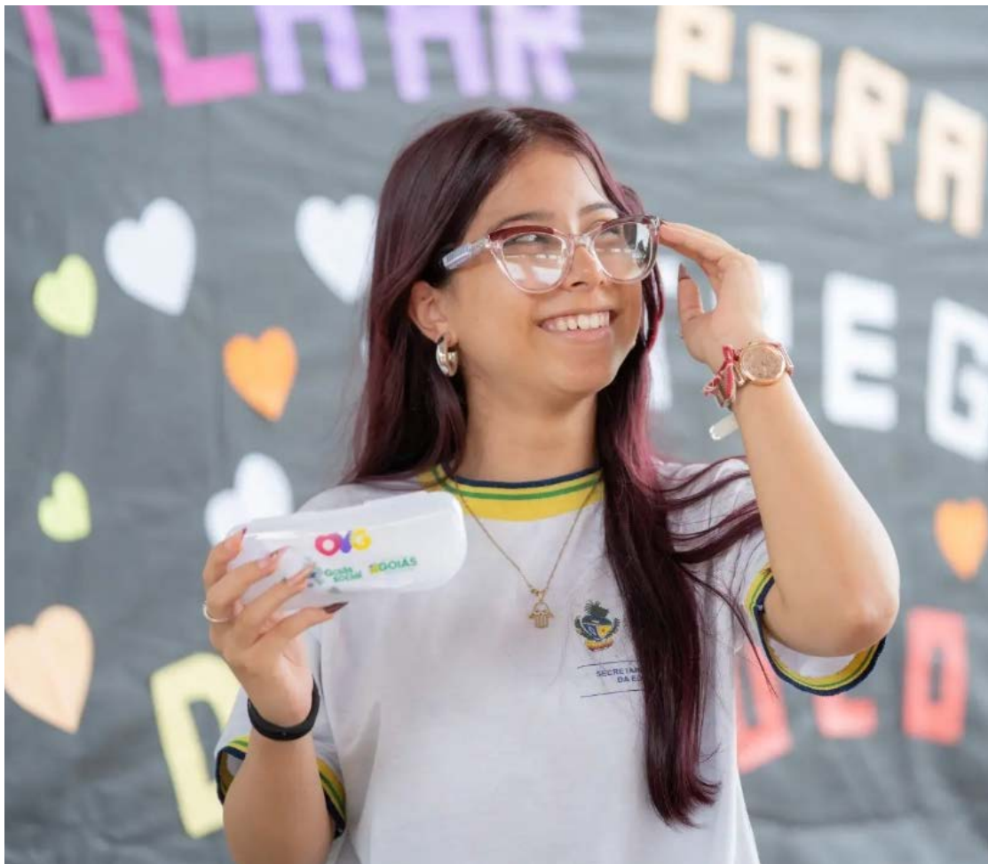
Centro de Referência em Oftalmologia (Cerof), da UFG, é parceiro da ação do governo

Promovido pelo Governo de Goiás, por meio do Goiás Social e da OVG, em parceria com o Centro de Referência em Oftalmologia (Cerof) da Universidade Federal de Goiás (UFG), o Olhar para Todos leva atendimento especializado às escolas estaduais e às ações itinerantes do Goiás Social, por meio de unidades móveis.