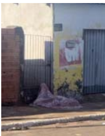
Polícia Civil de Goiás investiga circunstâncias da morte da vítima

A Guarda Civil Municipal atendeu a ocorrência e isolou a área até a chegada da Polícia Científica, responsável pela perícia técnica.