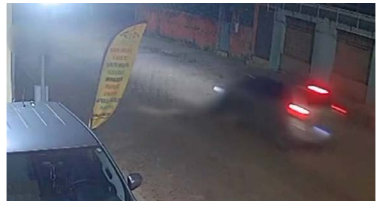
Mulher foi arrastada por um carro na madrugada de domingo