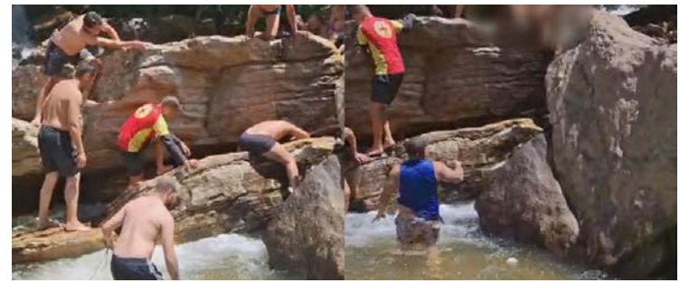
Acidente ocorreu quando a criança estava no local com familiares

Menina ficou presa em uma fenda entre formações rochosas submersas no rio