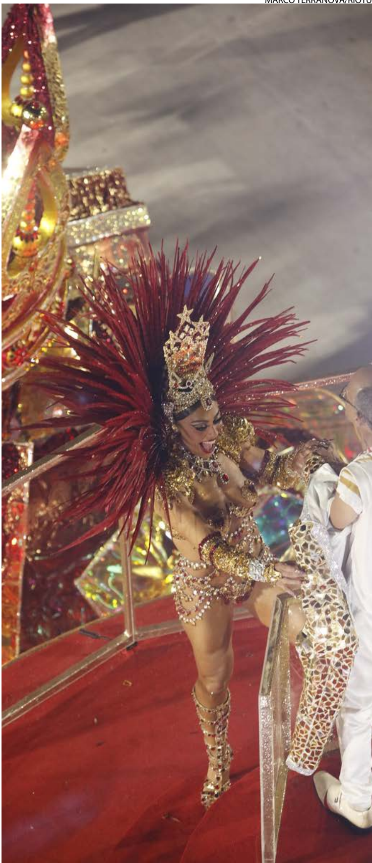
Escola de samba desfilou com atriz Juliana Paes

Em evolução, penúltimo quesito a ser divulgado, a Viradouro totalizou 240 pontos e manteve a liderança. A Imperatriz Leopoldinense recebeu três notas dez e uma 9,8. Como o regulamento prevê o descarte da menor nota, a escola manteve pontuação máxima no quesito, o que retirou efeito prático do recurso apresentado. (Com Agência Brasil)