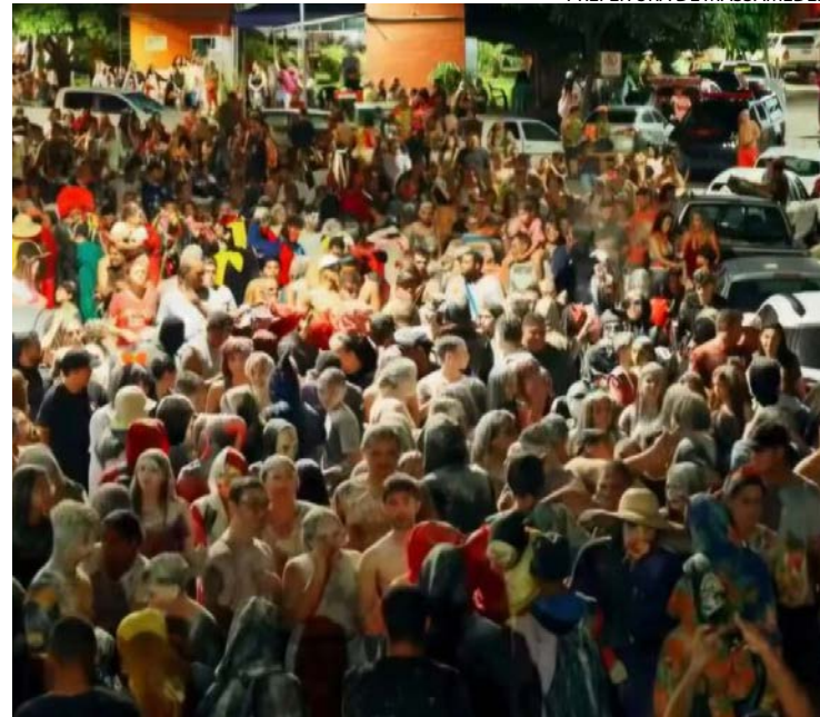
Participação popular marcou os dois dias de desfile