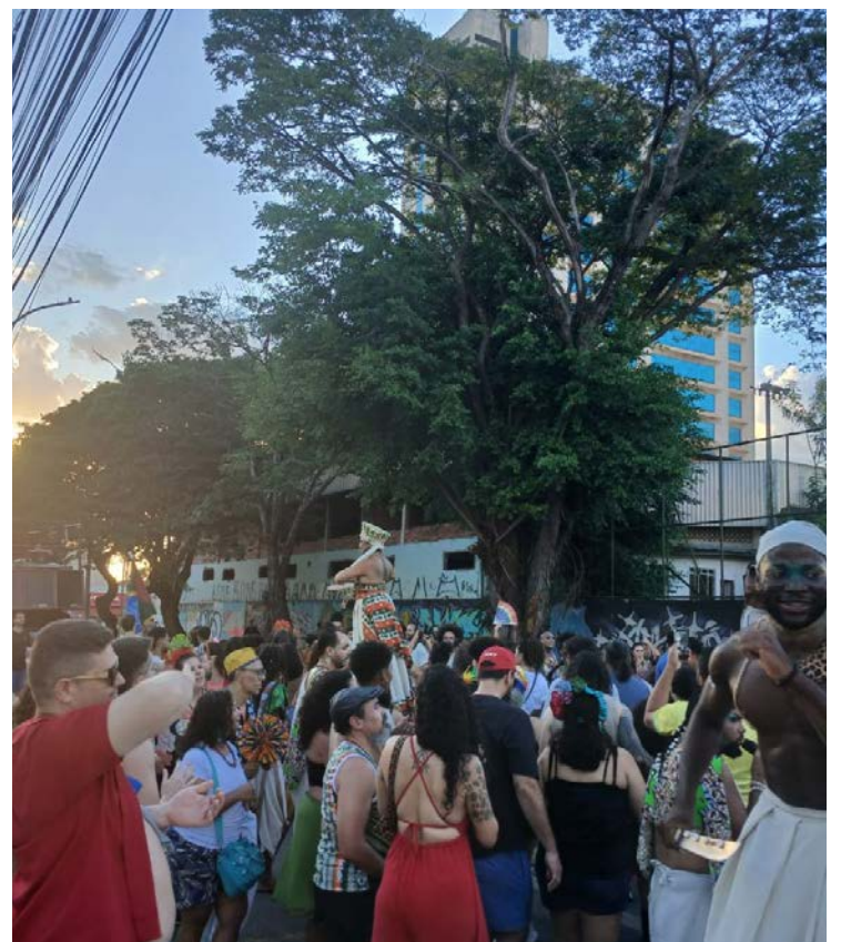
Tambores de Orum levaram Palmares ao Centro na terça (17/2)