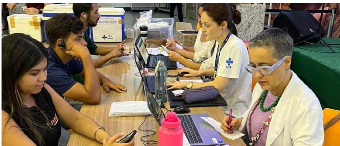
Foram realizadas ações de vacinação em cinco shoppings da capital

Já foram realizadas ações de vacinação em cinco shoppings da capital, nos hotéis com mais de 50 funcionários, na Guarda Civil Metropolitana (GCM) e com entregador por aplicativo, quando 288 motociclistas foram imunizados. Até o fim deste