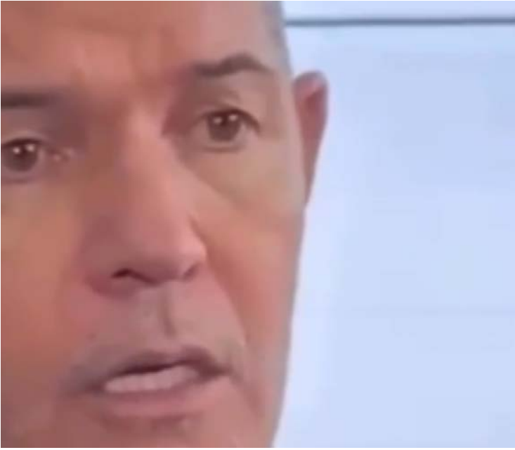
Sistema conta com recursos de inteligência artificial para monitoramento durante toda a prova

O Departamento Estadual de Trânsito de Goiás (Detran-GO) começou a implantar a prova teórica online para candidatos à primeira habilitação. A novidade funciona como modalidade complementar ao exame presencial e permite que o candidato faça a avaliação em computador ou celular, de casa, desde que atenda aos requisitos técnicos e tenha conexão adequada com a internet. O sistema conta com recursos de inteligência artificial para monitoramento durante toda a prova, com o objetivo de evitar fraudes, como substituição de candidatos ou interferência de terceiros. Além do controle automatizado, há fiscalização humana remota, com um servidor acompanhando o exame em tempo real, podendo intervir em caso de irregularidades.