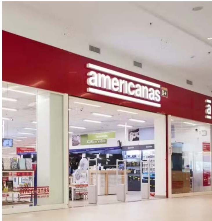
Justiça determinou bloqueio de bens e valores em nome de investigados até o limite de R$ 54 bilhões