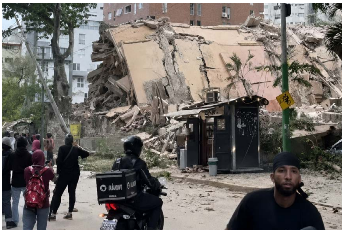
Equipes de resgate trabalham entre os escombros após o raro duplo terremoto

Em razão da gravidade da situação, o Ministério do Poder Popular para a Educação anunciou a suspensão das aulas em todo o território venezuelano por tempo indeterminado. Organizações da sociedade civil e grupos de oposição também iniciaram campanhas de arrecadação de água e suprimentos. Em uma publicação nas redes sociais, o Comitê de Direitos Humanos do Vene