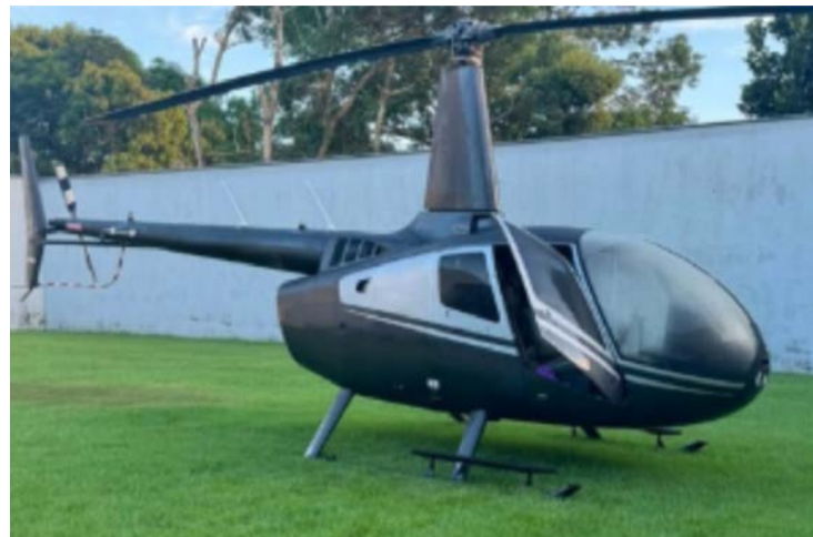
Agentes cumpriram 18 mandados e apreenderam até um helicóptero

Grupo atuava para direcionar recursos públicos oriundos de emendas parlamentares