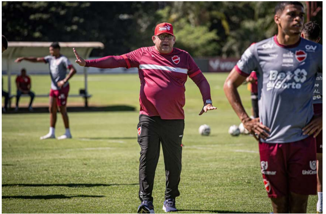
Tigrão soma 28 pontos e faz uma das melhores campanhas do campeonato

Enquanto busca manter a ponta da tabela, o Vila Nova já trabalha nos bastidores para fortalecer o elenco na sequência da