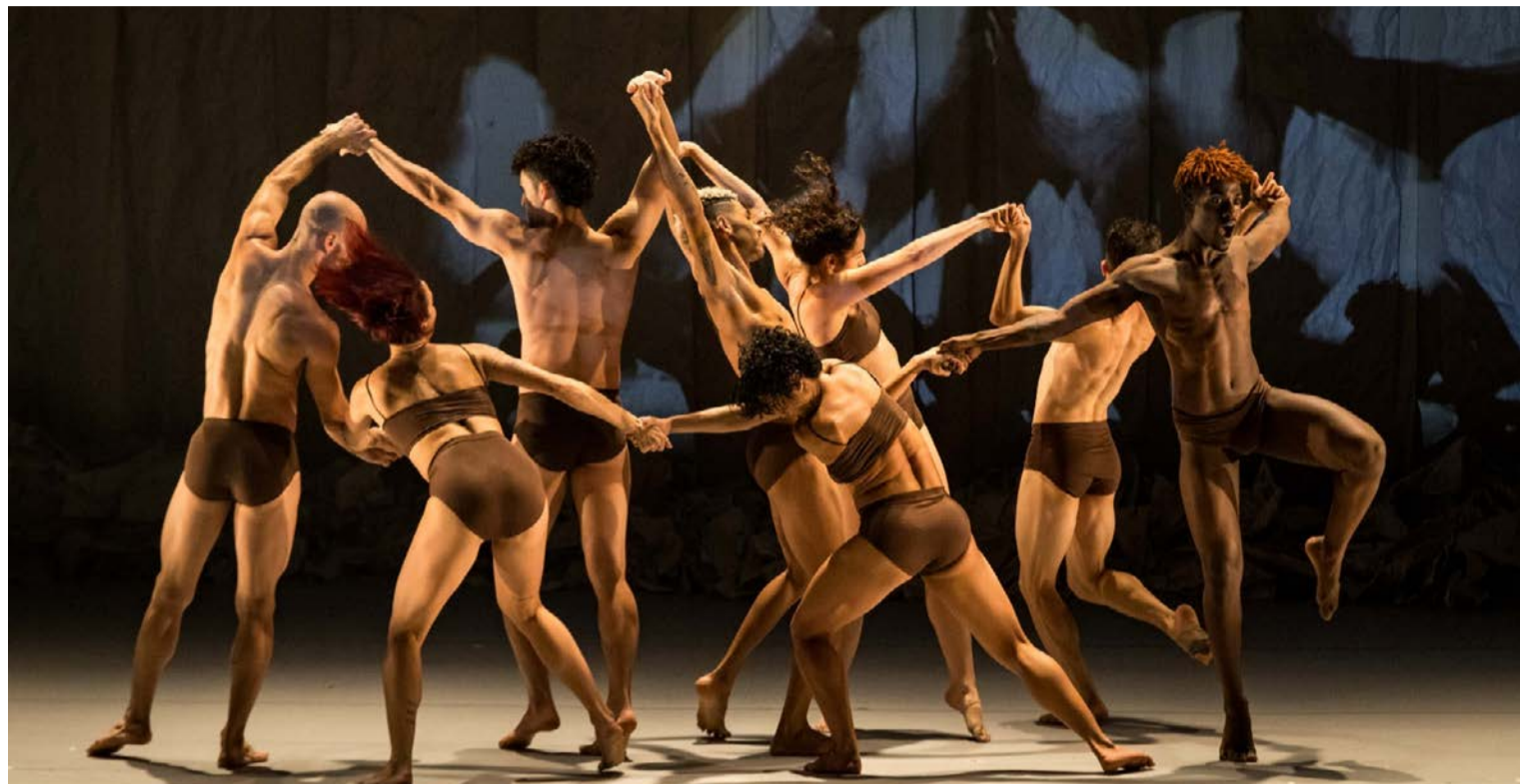
Giro8 consolidou-se como uma das principais companhias de dança contemporânea do Centro-Oeste