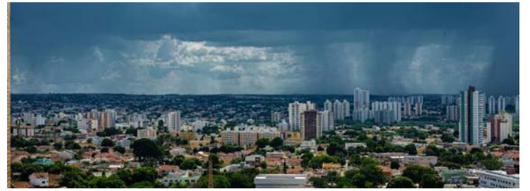
intensidade do frio diminui a partir desta sexta