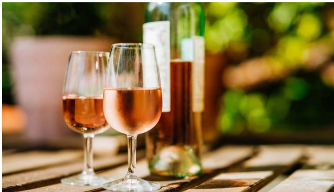
Rosé costuma oferecer aos paladares uma explosão de sabores

Durante décadas, ele foi tratado como uma bebida para quem não gosta de vinho e, pior, chegou a ser evitado por homens. Um enorme equívoco