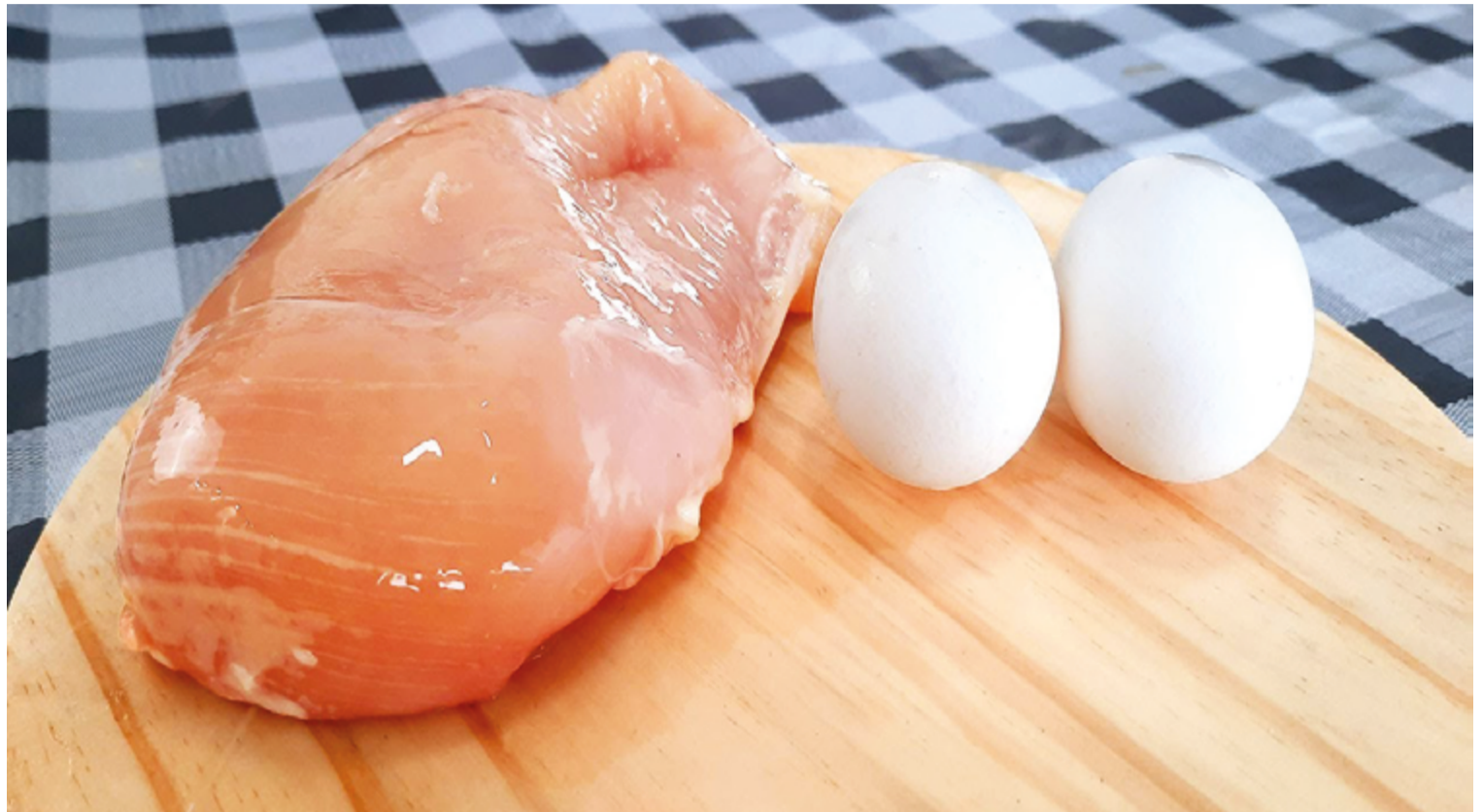
Com preço mais elevado do frango, muitos consumidores optam pelos mais acessíveis; ovos tornaram-se uma escolha popular

Em casas de carnes, a coxa e sobrecoxa foram encontradas com preços variando de R$ 10,98 a R$ 17,00, uma diferença de 55%. O filé mignon apresentou uma variação de 37%, com preços entre R$ 61,90 e R$ 85,00. A costela bovina teve flutuação de 28%, sendo