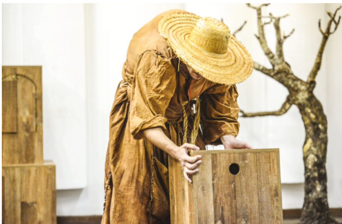
Grupo de Teatro Arte & Fatos apresenta o espetáculo "Os Avestos", baseado na obra de Guimarães Rosa