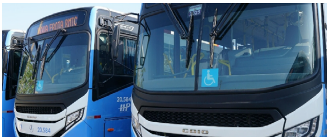
Veículos novos adquiridos pelo Governo de Goiás: ônibus vão circular de quarta-feira até domingo

Dois novos veículos com ar condicionado estarão em circulação para atender o itinerário. Eles foram adquiridos por meio de investimentos do projeto Nova RMTC, com recursos do subsídio do transporte por parte do Governo de Goiás e das prefeituras de Goiânia e de cidades da Região Metropolitana.