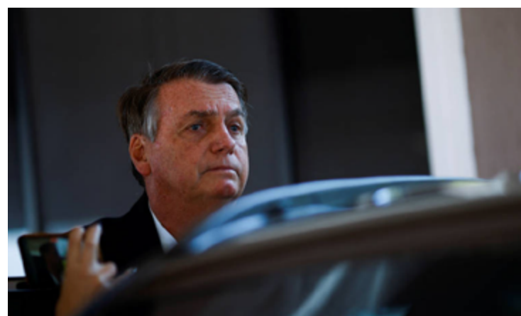
Jair Bolsonaro nega que ter estimulado golpe de estado em 2022

"Da minha parte nunca houve discussão de golpe. Se alguém viesse pedir golpe para mim, ia falar, tá, tudo bem, e o 'after day'? E o dia seguinte, como é que fica? Como fica o mundo perante a nós. (...) A palavra golpe nunca esteve no meu dicionário."