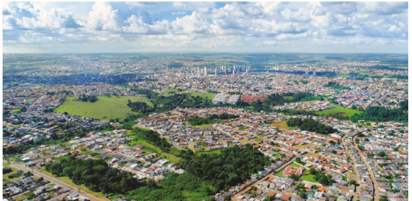
Dívidas de imóveis em atraso podem ser renegociadas para pagamento com até 100% de isenção de juros e multa

A adesão ao programa pode ser feita presencialmente no Rápido do Anashopping ou de forma online pelo Zap da Prefeitura. Para um atendimento mais especializado, os contribuintes são encaminhados ao Centro Administrativo. É importante desta-