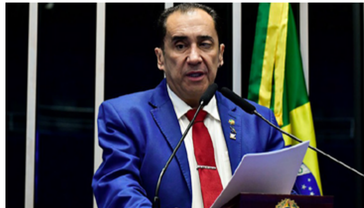
Jorge Kajuru: nova reforma política no país