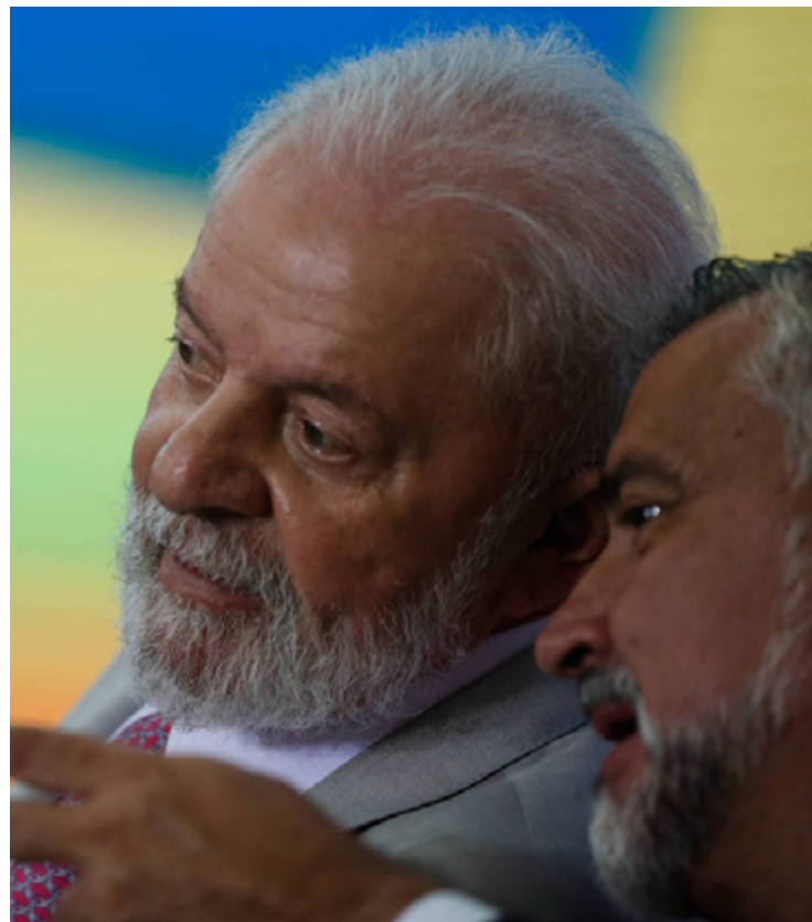
Lula da Silva e Paulo Pimenta: queixas sobre a comunicação do governo

Mas a mudança depende da posição de Gleisi sobre abreviar seu mandato como