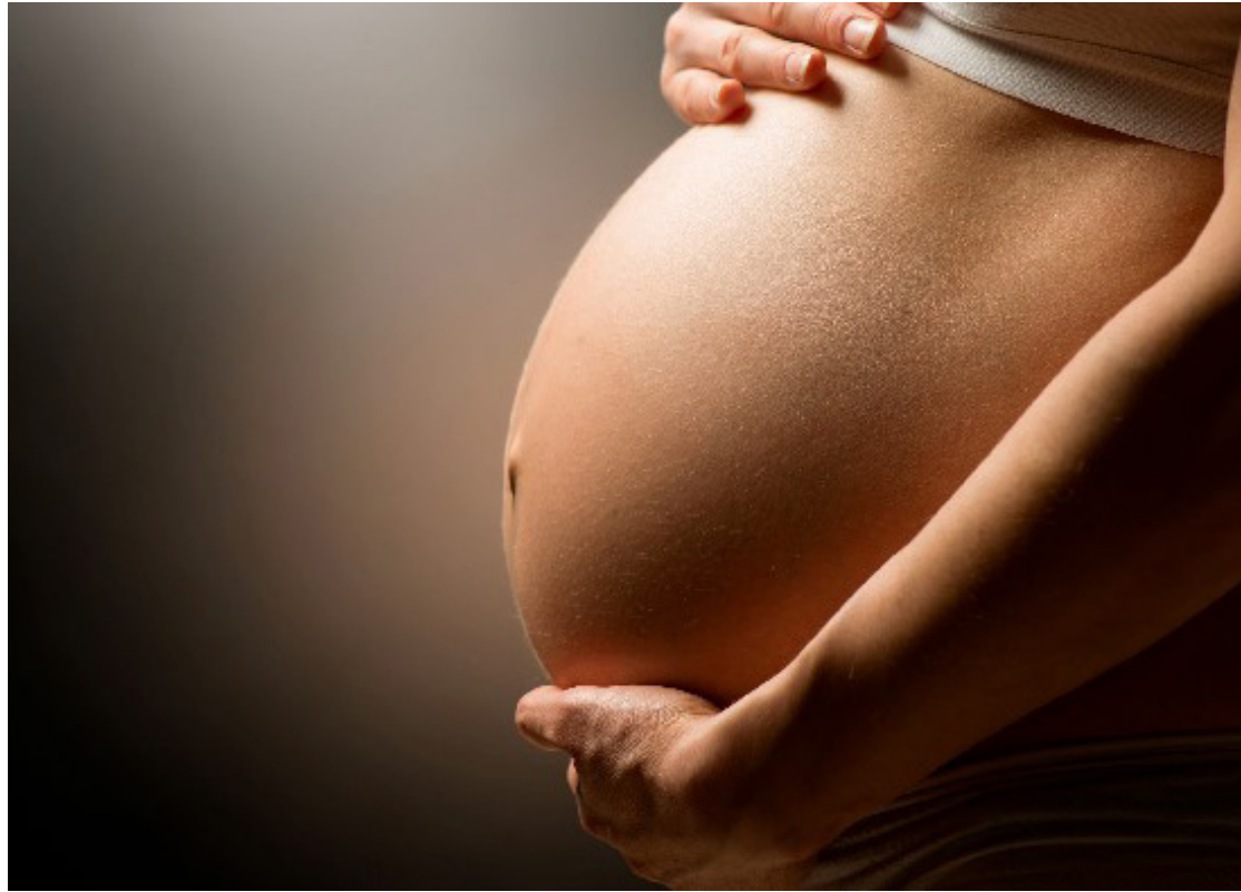
Durante a gestação, o cérebro materno passa por um refinamento neuronal significativo, especialmente em áreas associadas à cognição social e ao processamento emocional.

A redução no volume da matéria cinzenta, que ocorre à medida que a produção hormonal aumenta durante a gravidez, é considerada um aprimoramento da especialização cerebral para tarefas parentais. Além das alterações na matéria cinzenta, a gravidez também afeta a integridade da matéria