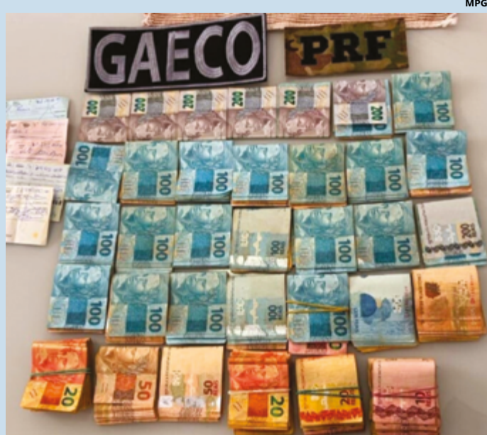
Em Anápolis foram cumpridos mandados judiciais, que resultaram na prisão

Em Anápolis e outros municípios de Goiás, como Goiânia, Goianira e Trindade, os mandados foram executados com apoio de 268 agentes da Polícia Rodoviária Federal e 96 membros do Ministério Público Estadual, incluindo 26 promotores de Justiça. Em Nova Crixás, um dos mandados foi cumprido dentro da Unidade Prisional Regional, onde um dos investigados já estava detido. Durante as buscas, cães farejadores foram empregados para localizar entorpecentes.