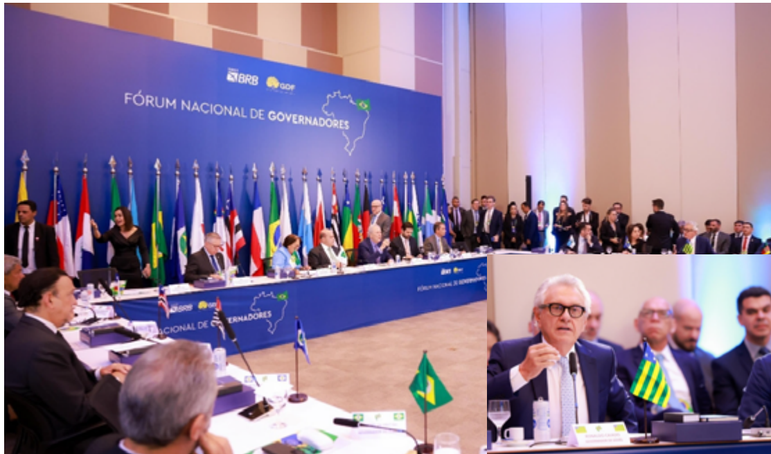
Fórum Nacional dos Governadores, realizado em Brasília (DF): gestores aproveitaram proposta para desabafar sobre intervenção federal

“É um absurdo que nós, governadores, sejamos tutelados pelo ministro da Justiça e pelo governo federal, sendo que nós assumimos todos os gastos. Te-