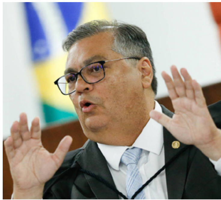
Flávio Dino: transparência das emendas parlamentares

Dino diz que não faz sentido ocultar o nome dos parlamentares autores dos pedidos de destinação de recursos. Ele comparou o caso com os projetos de lei: os parlamentares autores das propostas são identificados, apesar de o projeto de lei só ser aprovado de forma colegiada nos plenários das Casas.