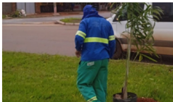
Avenidas da Região Oeste recebem replantio: aumento da cobertura verde de Goiânia