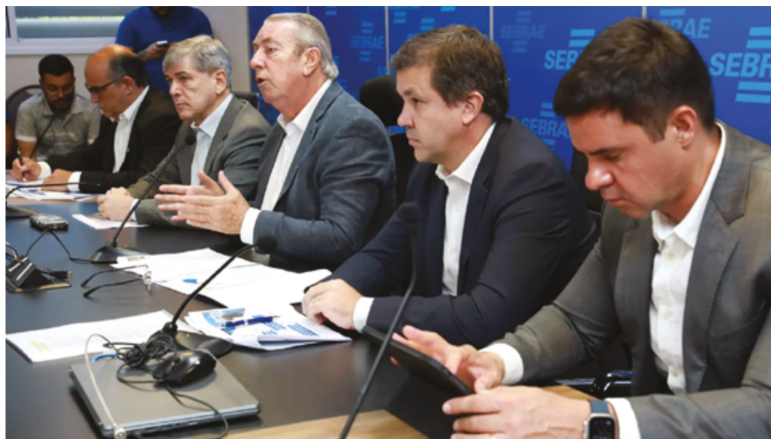
Sebrae revela aumento da proporção de empreendedores que iniciam negócios por oportunidade: 56,9% em 2024

Os resultados de 2024, que incluem a geração de empregos e o crescimento de empresas abertas, foram apresentados como reflexo do trabalho conjunto entre a equi-