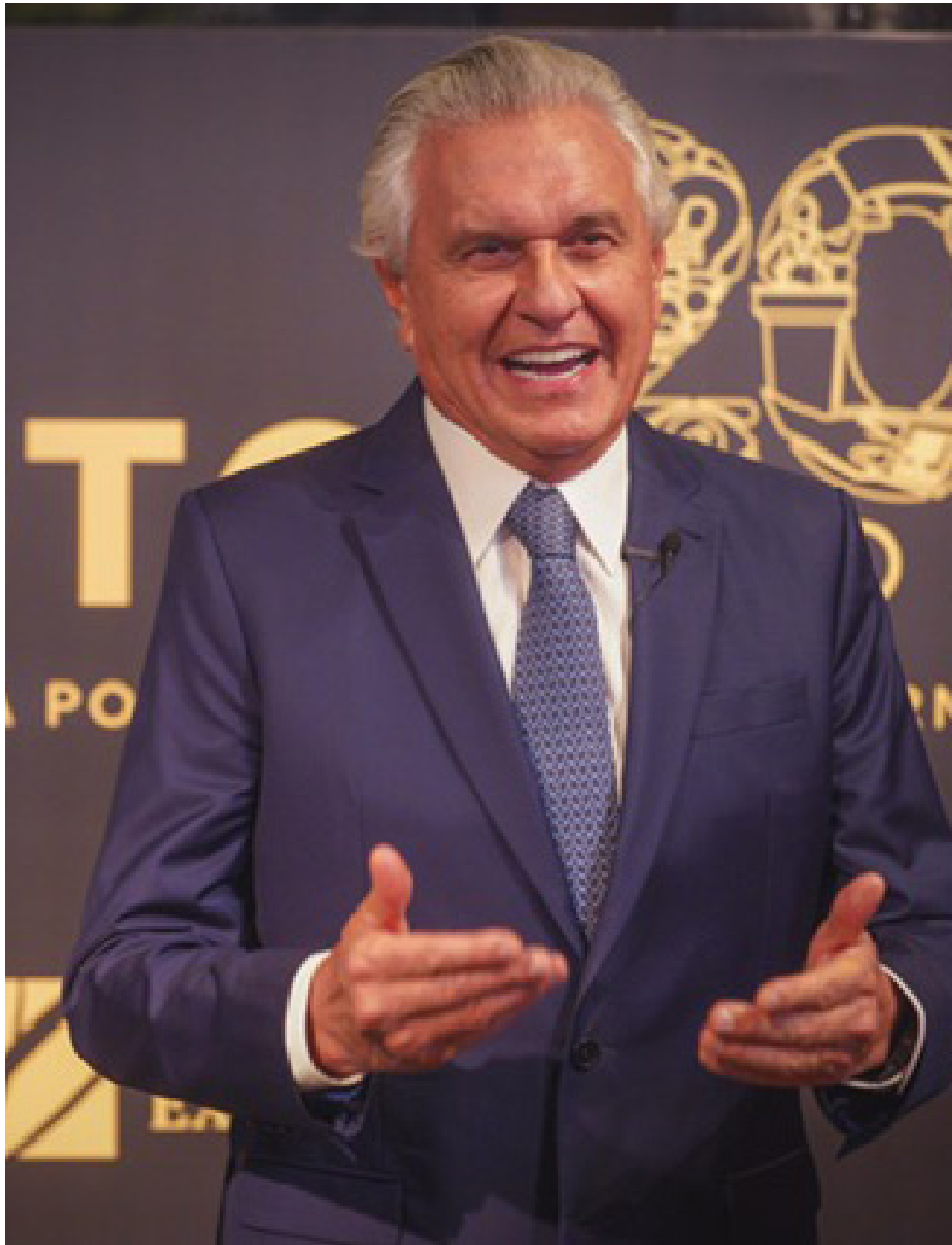
Ronaldo Caiado: atuação no Congresso Nacional e no governo de Goiás atesta trabalho em favor do Brasil

A homenagem foi realizada durante o tradicional jantar “Um Brinde à Democracia”, promovido pelo Grupo Voto ao final de cada ano e que reuniu personalidades da política e do empresariado brasileiro na Hípica Paulista. Nesta edição, a celebração é alusiva ao 20º aniversário do Grupo que atua com informação empresarial e interlocução política. “Esse trabalho é o que todos nós queremos pelo Brasil. Um Brasil que realmente venha atender o sentimento da população brasileira em termos de desafios que precisam ser, de uma vez por todas, superados”, afirmou Caiado.