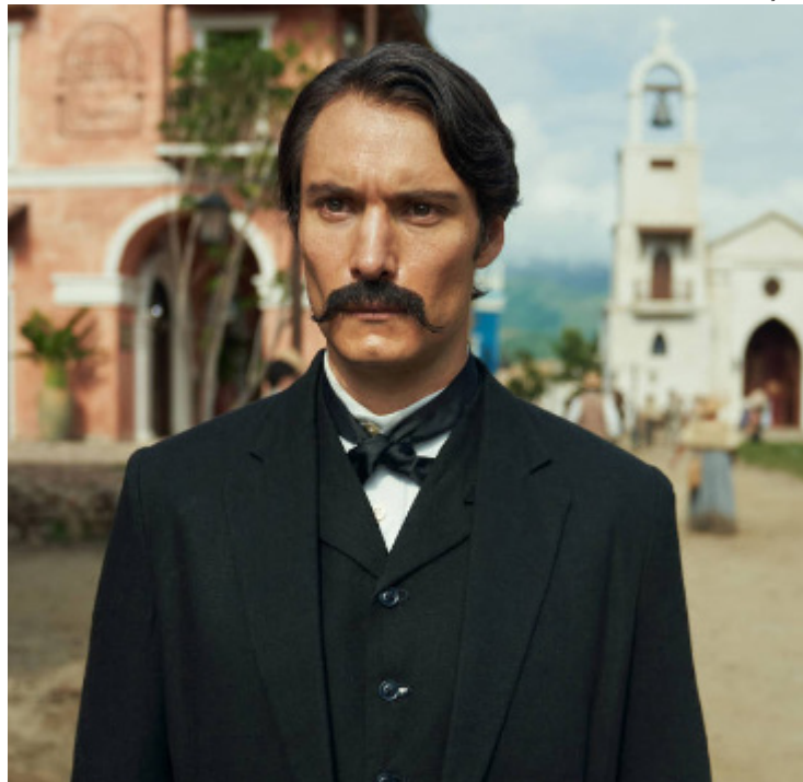
Claudio Cataño atua em 'Cem Anos de Solidão', da Netflix