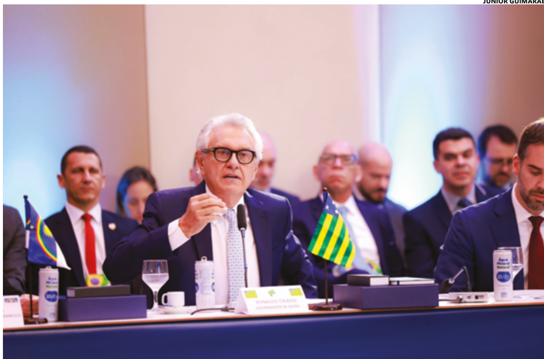
Ronaldo Caiado entregou o documento aos representantes dos estados e ao ministro da Justiça Ricardo Lewandowski

Elaborada em conjunto com a Procuradoria-Geral do Estado de Goiás, a PEC alternativa foi entregue aos governadores e ao