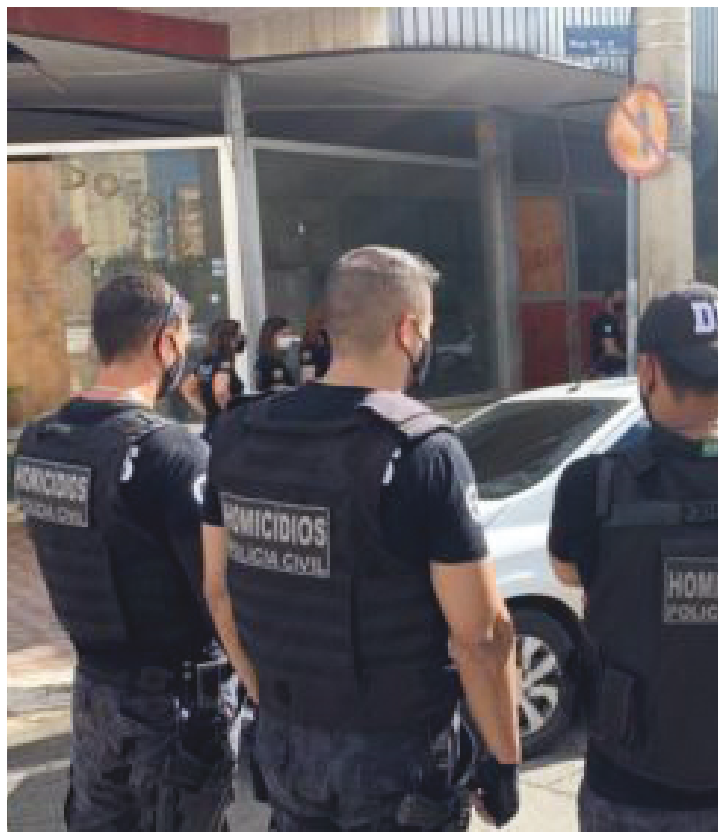
Goiás tem índice de 86% em esclarecimentos de casos de homicídios dolosos; no Brasil índice é de apenas 39%

Os números dizem respeito à investigação, e não ao julgamento. A denúncia pelo Ministério Público não significa que alguém foi condenado e preso pelo homicídio. (Com informações Carlos Lins/UOL)