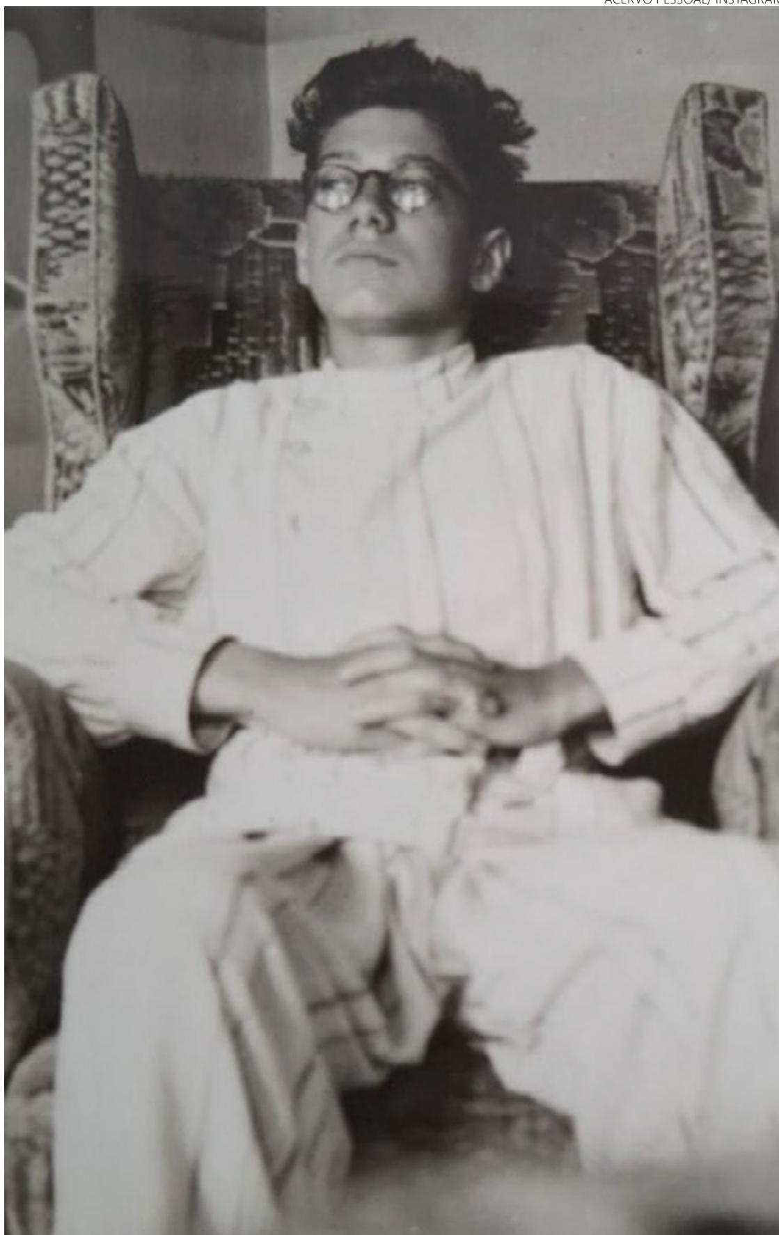
Escritor foi laureado com Camões, maior prêmio da língua portuguesa, em 2012