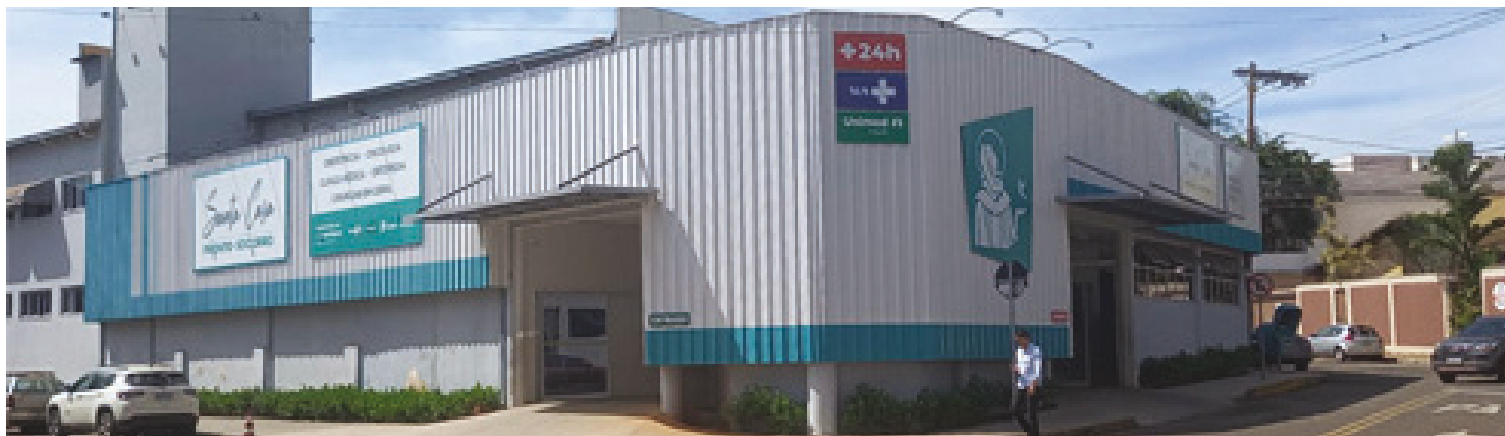
Neste ano Município teve R$ 120 milhões a mais de arrecadação além do previsto na LOA, mas precisa de autorização para utilizar os recursos

O PL enviado pela Prefeitura retira o limite de movimentações de 38% dentro do orçamento apenas para pagamento de pessoal e seus encargos e decisões judiciais. Para todas as demais dotações se-