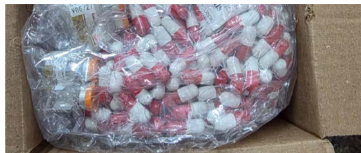
Ação integrada envolveu a Central Geral de Flagrantes

Encomenda seria entregue no campus de uma instituição de ensino superior em Goiânia