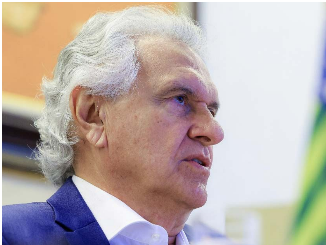
Ronaldo Caiado, governador de Goiás: projeto atende produtores goianos

Durante discurso na instalação da quarta sessão legislativa ordinária da 20ª Legislatura, Caiado afirmou que a medida busca encerrar um impasse que se arrastava há anos. “Em decorrência de uma artimanha, uma armadilha montada contra os produtores rurais, a dívida chegou a R$ 1 bilhão, penalizando mais de 10 mil trabalhadores, com nome e CPF”, declarou. A proposta foi submetida ao Conselho Nacional de Política Fazendária (Confaz), que autorizou o Estado a formalizar a