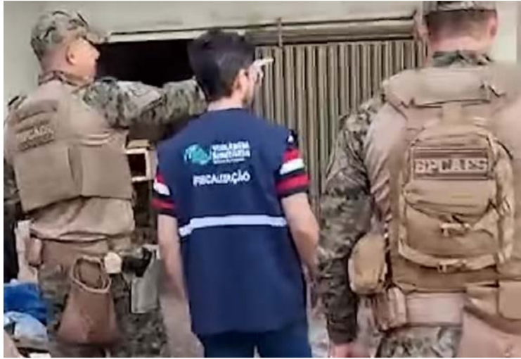
Fórmulas infantis vencidas eram remarcadas com datas falsas