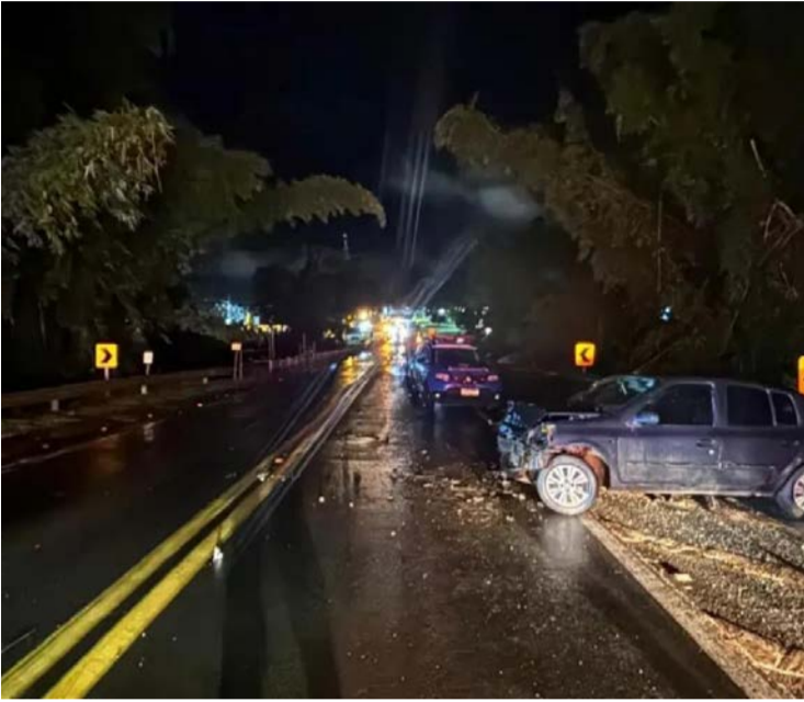
Ao todo, cinco pessoas perderam a vida durante o feriado, o maior número dos últimos dois anos

A corporação constatou aumento no número total de acidentes, que saltou de 28 (em 2025) para 44 (em 2026). Os óbitos mais recentes ocorreram em 18 de fevereiro, com mortes na BR-153 em Goiânia e Rialma. No dia 15, um motorista morreu na BR-452 em Rio Verde após tombamento de carreta. Em 14 de fevereiro, duas