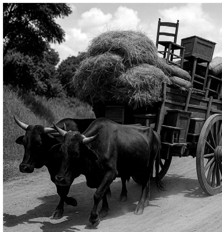
Carro de boi marca imigração paulista e mineira para Goiás

É desse tecido social que surgem nomes como Iris Rezende, figura central da política goiana, cuja trajetória pública se conecta às raízes do interior goiano.