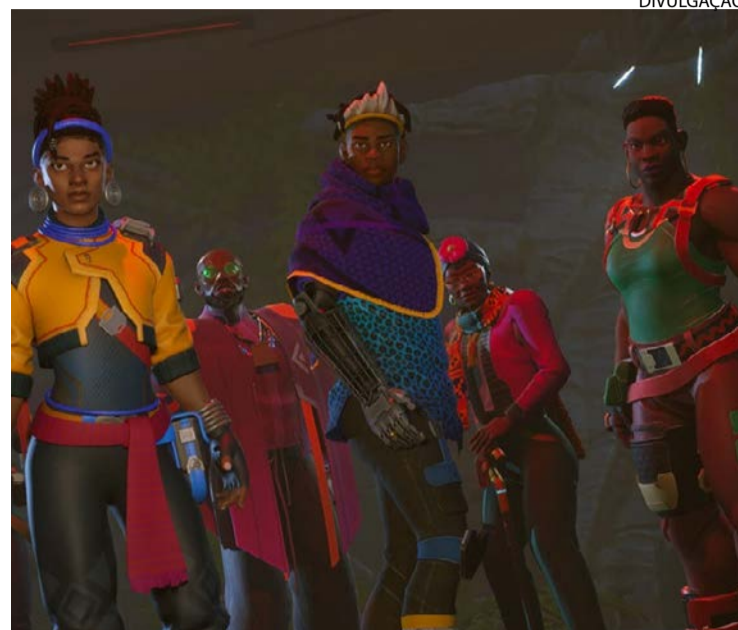
Polêmica: itens furtados no jogo são reais