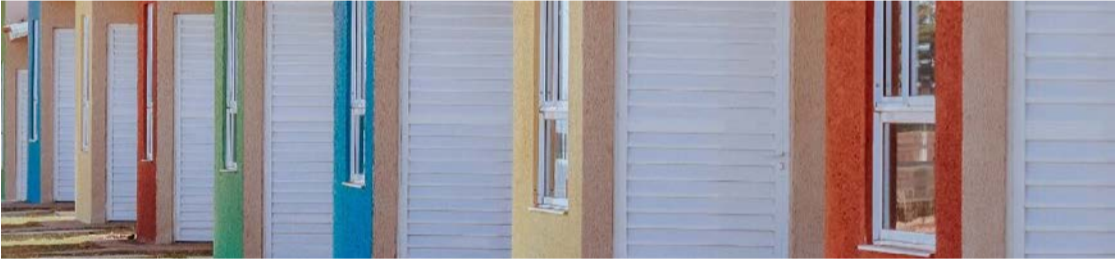
Iniciativa prevê subsídios diretos do município para facilitar a aquisição da casa própria