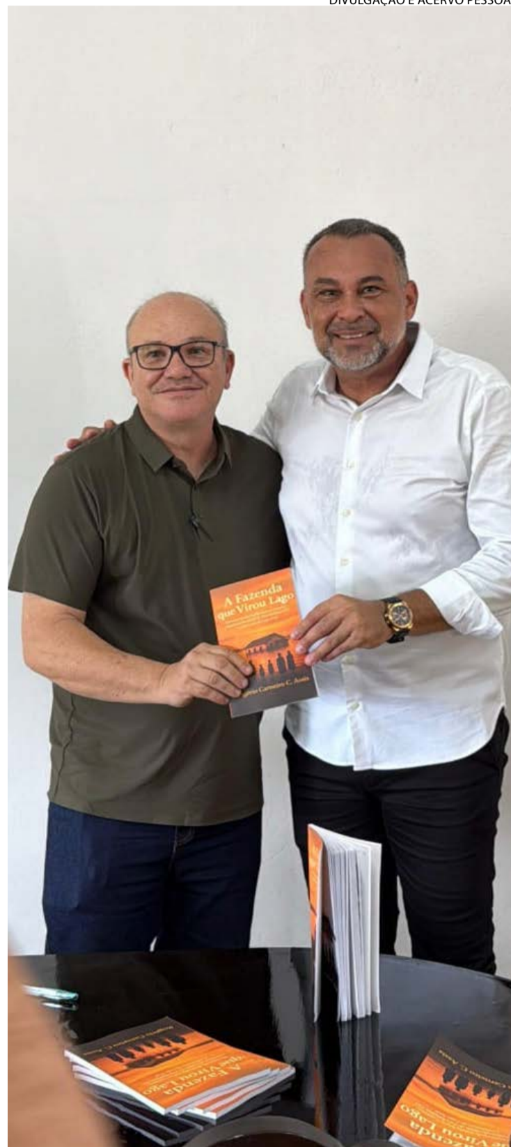
Escritor autografa obra em que analisa sul goiano

“Antes de se tornar a cidade conhecida hoje, a região que hoje chamamos de Três Ranchos era um território de Cerrado aberto, cortado por rios e caminhos naturais que serviam para o deslocamento dos povos indígenas, exploradores e tropeiros”, explica o escritor, na obra.