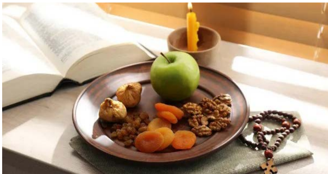
Ensinamentos: Quaresma propõe pausa nas marcas do excesso

Abstinência da carne vermelha surge como símbolo de contenção. Mesmo o vinho, tão presente na cultura da boa mesa, pede moderação