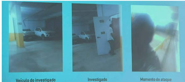
Veículo do investigado