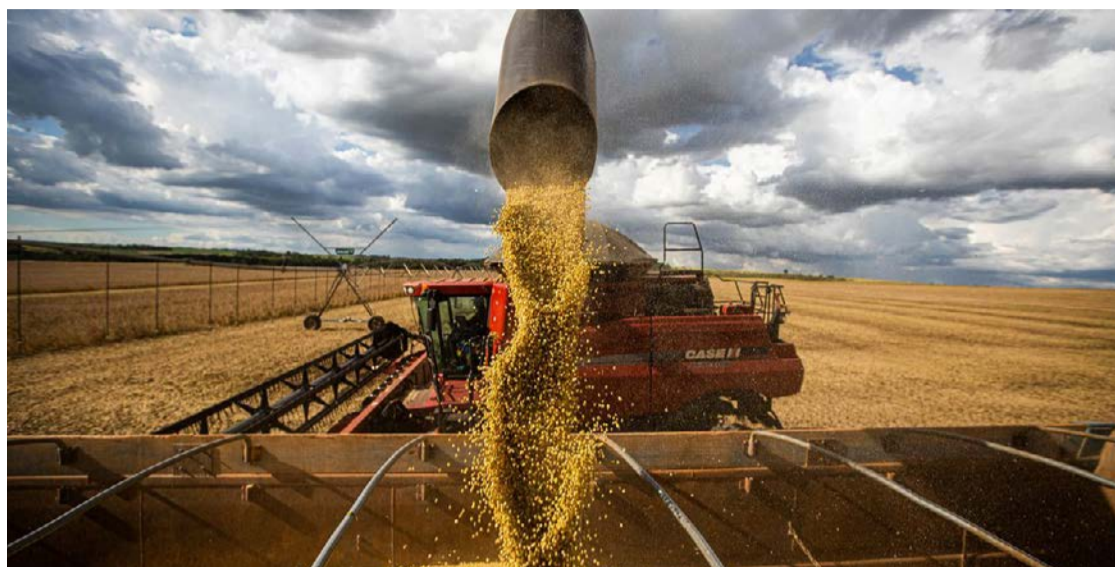
Com a efetivação da medida, Estado deixa de arrecadar um bilhão de reais por ano

Acrescenta: - Na retomada dos trabalhos legislativos, o governador enfim anuncia o fim da cobrança. O Sistema Faeg inicia agora o trabalho de convencimento dos deputados para que a revogação se efetive como