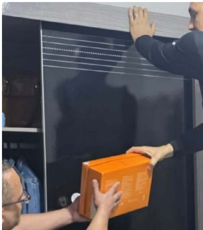
Justiça determinou o bloqueio de valores para assegurar a recuperação dos recursos desviados

O principal alvo é um empresário de 38 anos, apontado como líder do esquema. As investigações indicam que o empresário estruturou um esquema de crimes contra a ordem tributária, com supressão