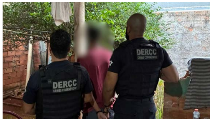
Homem foi preso em flagrante com pornografia infantil

Investigação apura a realização e o armazenamento de arquivos contendo imagens e vídeos de crianças