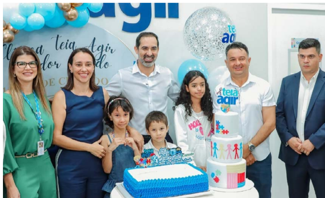
Evento na Clínica Teia teve a presença do prefeito Fernando Pellozo e gestores