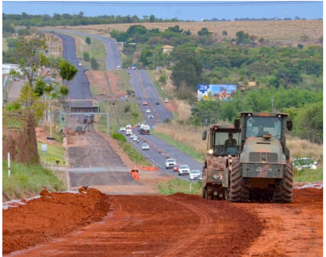
Rodovias goianas registram avanço na qualidade após recuperação e manutenção promovidos pelo Governo

O governador Daniel Vilela destacou que os resultados reforçam a importância estratégica da infraestrutura para o desenvolvimento econômico e social de Goiás. "Estrada boa reduz custos, salva vidas, melhora o escoamento da produção e aproxima oportunidades das pesso-