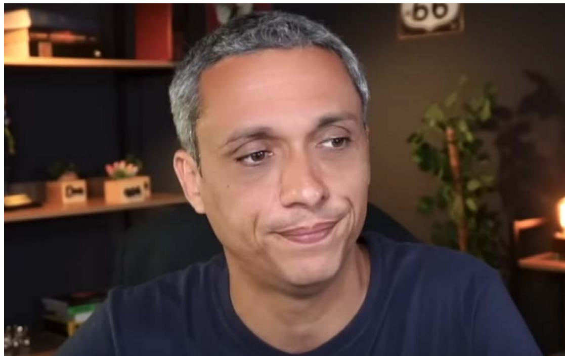
Gustavo Gayer é réu em processo no STF por injúria contra Lula

corde dá início à instrução penal para o julgamento definitivo, com a coleta de provas, depoimentos, interrogatórios.