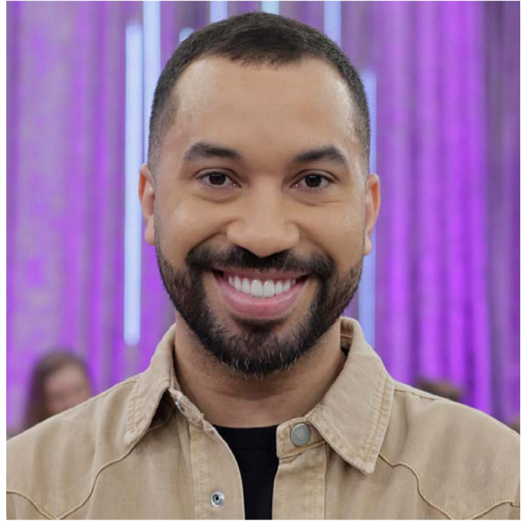
Gil do Vigor é ex-BBB: relatos de vida

Ex-BBB diz que ansiedade e preocupação mexeram com seu lado emocional: "Medo"