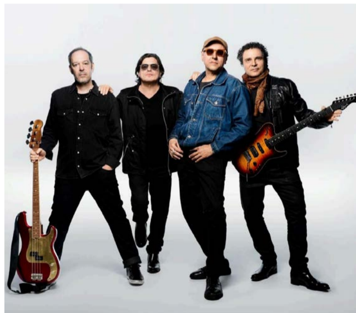
Barão Vermelho fabricou hits que entraram para galeria do rock brasileiro