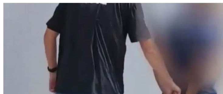
Investigado solicitava pagamentos via Pix após oferecer freezer