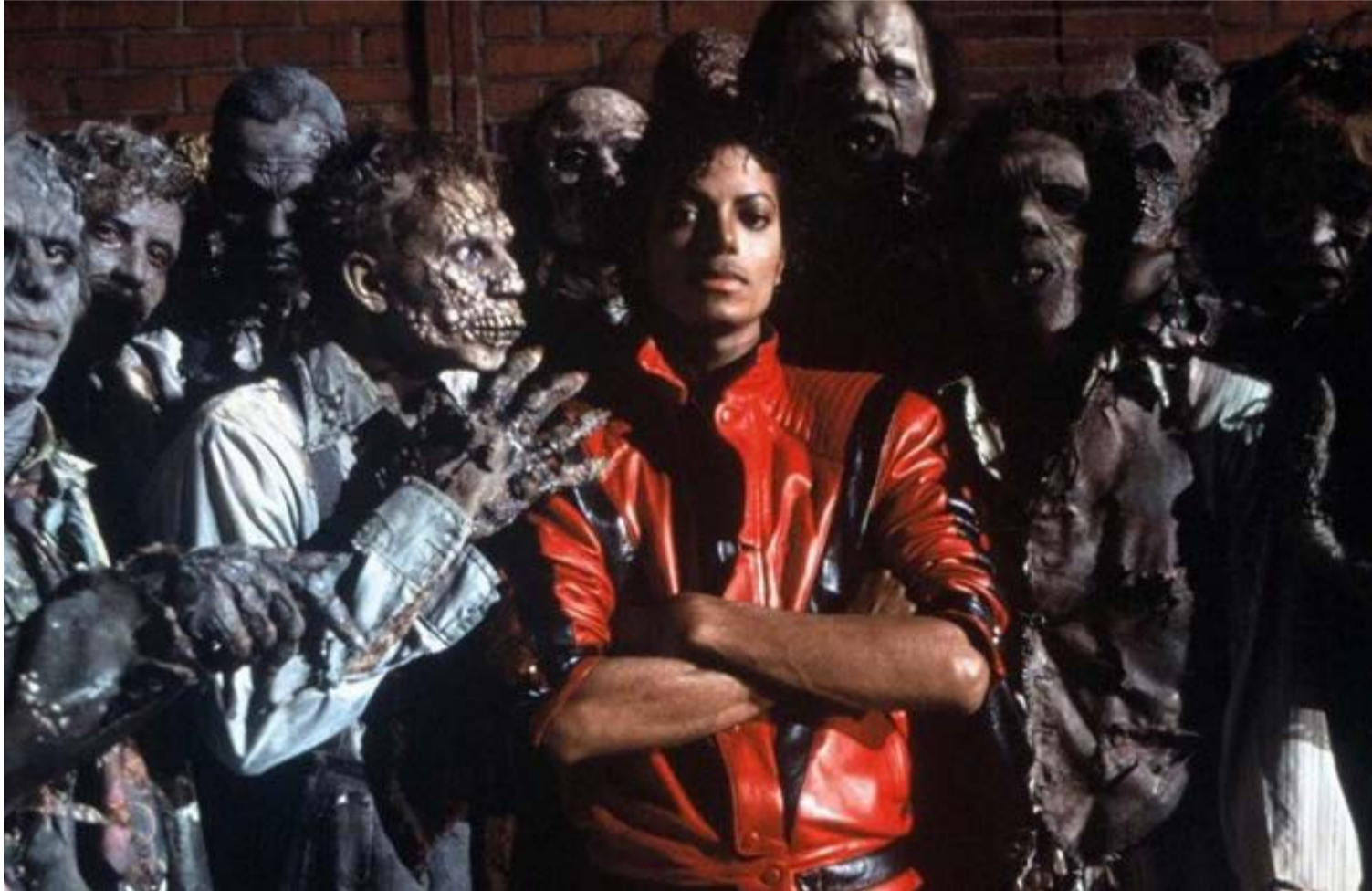
Cinebiografia "Michael" retrata a carreira e o impacto cultural de Michael Jackson

Repercussão do filme fez com que faixas lançadas há mais de quatro décadas voltassem a figurar entre as mais executadas atualmente. Cantor passou, pela primeira vez, a integrar o grupo dos 10 artistas mais ouvidos do Spotify