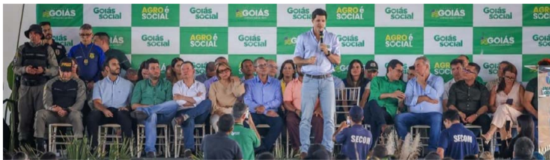
Uruaçu realizou o encerramento do Agro é Social: produtores passaram por capacitação