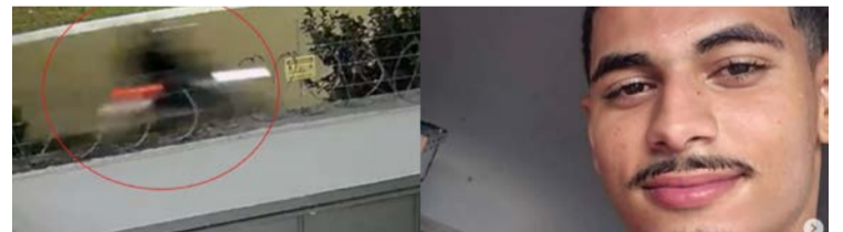
Testemunhas dizem que motociclista trafegava em alta velocidade