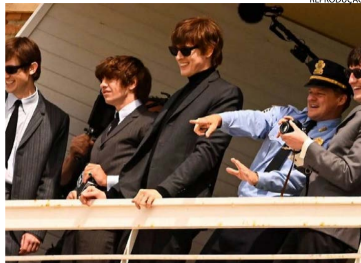
Cena recria ambiente de fama nos anos 1960