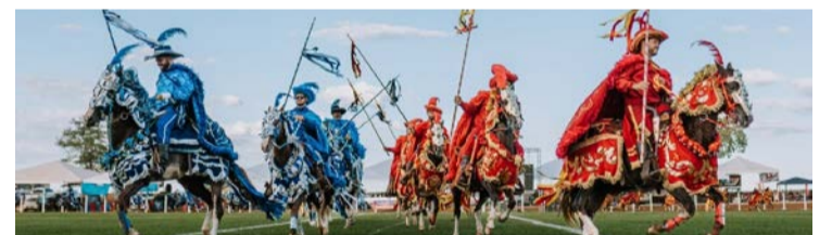
Tradicionais Cavalcadas unem cultura, religiosidade e movimentam a economia local