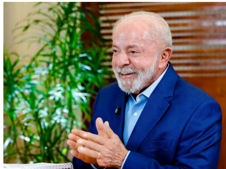
Presidente Lula determina retirada da urgência para projeto

Com a decisão do governo federal, texto deixa de ter prazo obrigatório para análise pelo Congresso