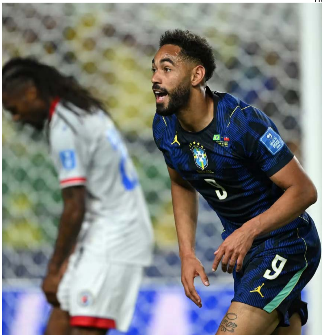
Matheus Cunha marca duas vezes, Brasil domina Haiti na Filadélfia e assume liderança do Grupo C da Copa do Mundo

Com a vitória, o Brasil chegou aos quatro pontos e assumiu a liderança do Grupo C no saldo de gols, à frente de Marrocos. Na