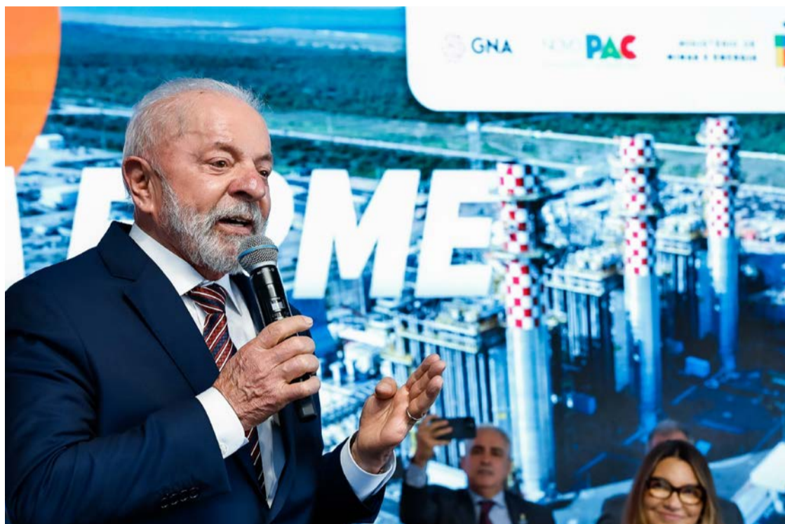
Lula demonstra incômodo com denúncias envolvendo Jaques Wagner

Integrantes do Planalto que antes defendiam o afastamento de Wagner por causa de problemas na articulação política afirmaram nesta quinta à Folha de S. Paulo que sugeririam a Lula mantê-lo no cargo.