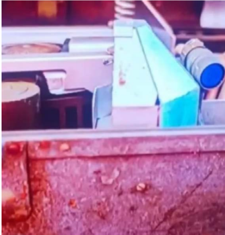
Técnicos especializados efetuaram medições nos equipamentos e não identificaram emissão de radiação gama

De acordo com relatos apresentados durante a fiscalização, os aparelhos