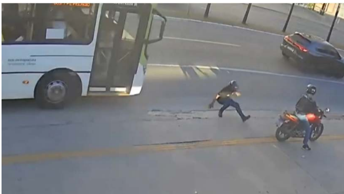
Momento em que a vítima cai de costas: morte na avenida