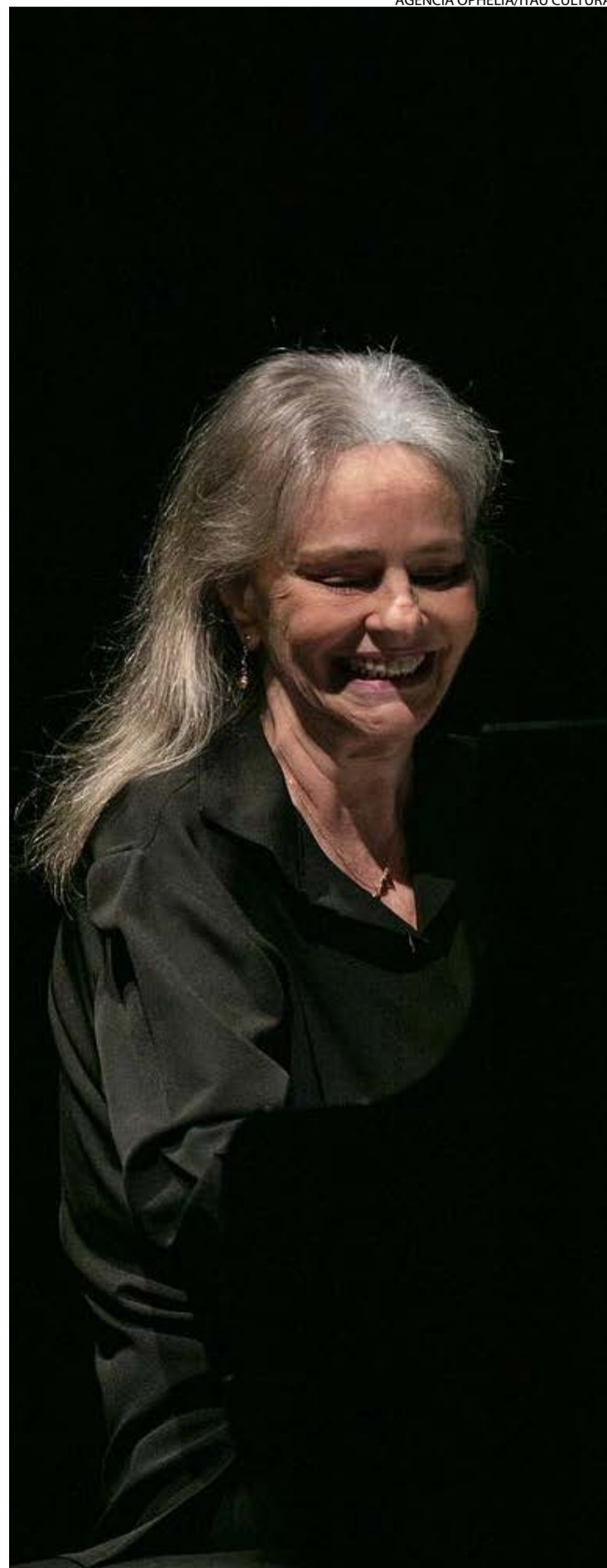
Instrumentista: artista dominava o piano e a arte da composição

A artista se despia e dava a cara a tapa, desacatando autoridades e às vezes se dando mal. Foi sequestrada duas vezes, espancada em quatro ocasiões por milícias, grupos que definiu como “delinquentes adultos e, infelizmente, polícia fardada”. “Eu fiquei cega de um olho e surda de um tímpano na base da porrada da polícia militar”, disse à “Revista Plural”.