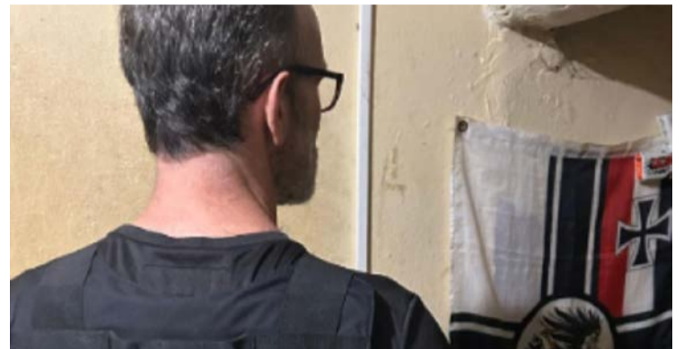
Agentes cumpriram mandado de busca e apreensão

Investigação da PF apura a divulgação de apologia ao nazismo em plataformas digitais