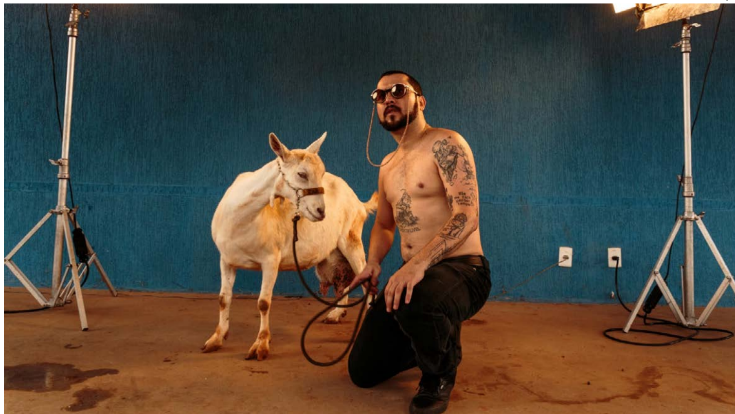
Artista combina remixes, mashups e batidas que aproximam tradição e inovação em uma pista de dança sem regras

Evento celebra a diversidade da música e da cultura com encontros que misturam diferentes públicos, estilos e manifestações artísticas. Direto do DF, Cabra Guaraná leva para palco mistura de sons e estilos