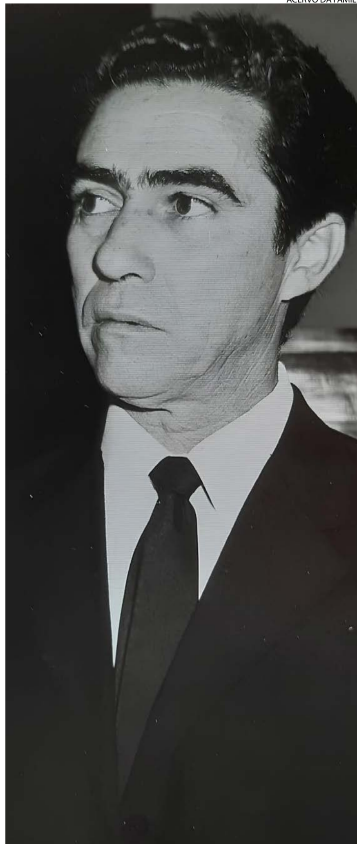
Autor se destacou por exercer diferentes frentes da palavra