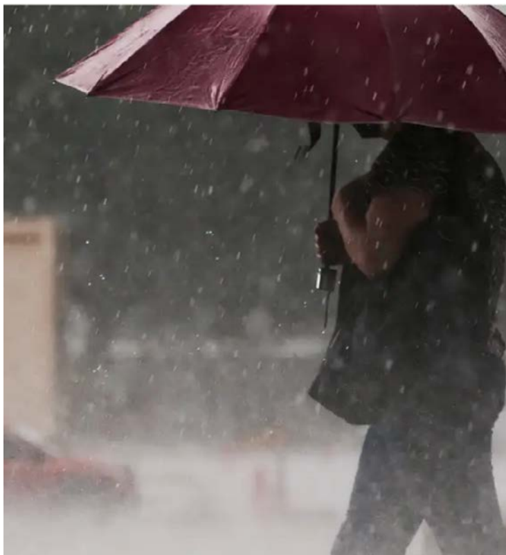
Previsão é de que as tempestades avancem no decorrer da semana

tará chuvas na próxima semana, pois outra frente fria se formará após a passagem desse ciclone,