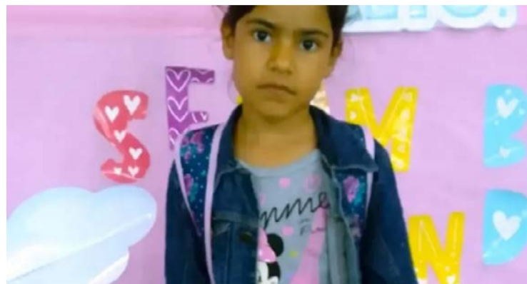
Criança apresentou sintomas graves após o jantar em família

Menino ingeriu alimento contaminado com veneno em Alto Horizonte, no Norte de Goiás