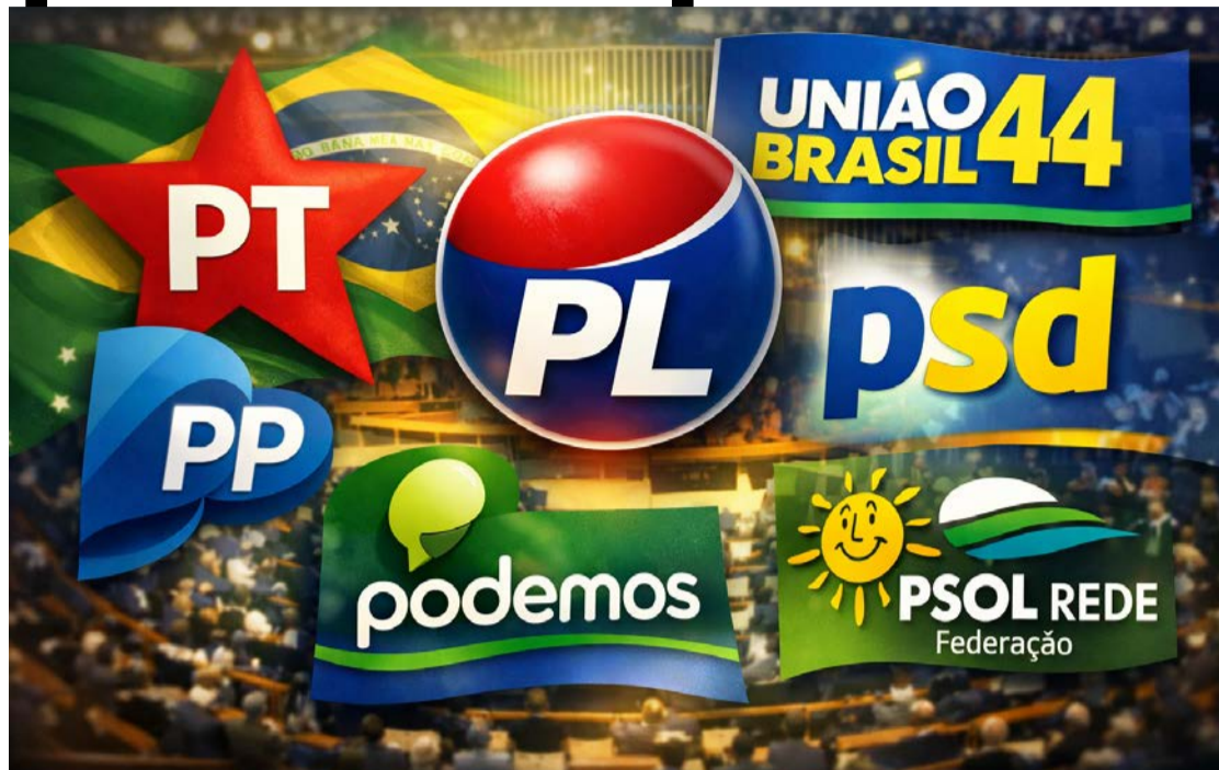
Janela partidária praticamente não patrocinou grandes mudanças nas legendas brasileiras

O mecanismo da janela partidária, previsto na legislação eleitoral e aberto seis meses antes das eleições, permite a troca de