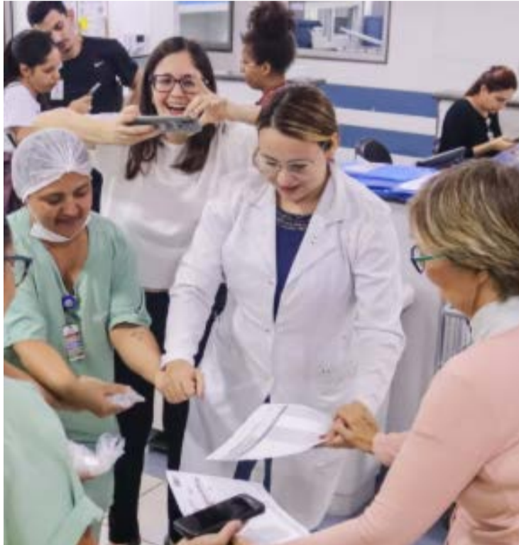
Iniciativa contou com oficinas de fotografia, jogos, desenho e contação de histórias

As fotografias produzidas ao longo das oficinas formaram uma exposição