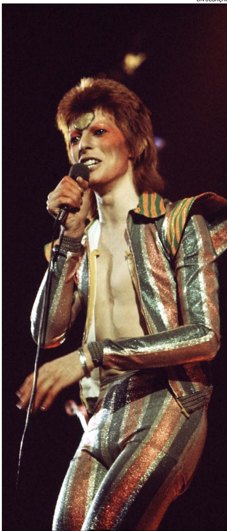
Documentário destrincha crise existencial após sucesso pop

Entre as inovações sonoras estava o mellotron, uma espécie de teclado com várias modalidades que foi, em suma, o primeiro sampler.