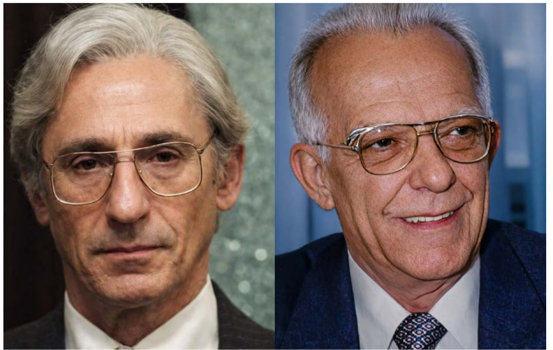
Série mostra o governador [personagem] diferente de Santillo: gestor real era médico e professor de atomística

"A batalha em torno do lixo radioativo também era