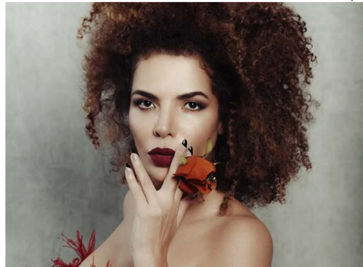
Artista leva turnê 'Todas Elas' para a Cidade de Goiás