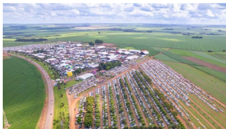
Feira Tecnoshow Comigo 2026, uma das maiores do país no mundo do agronegócio, teve início ontem e prossegue até sexta-feira (10) em Rio Verde

O ciclo de palestras traz temas como "Desafios climáticos em solos de textura contrastante e a segurança produtiva no agronegócio", "Gestão de propriedades rurais: uma visão de agro-empresa", "Estratégias de manejo no cultivo de soja em solos arenosos e argilo-