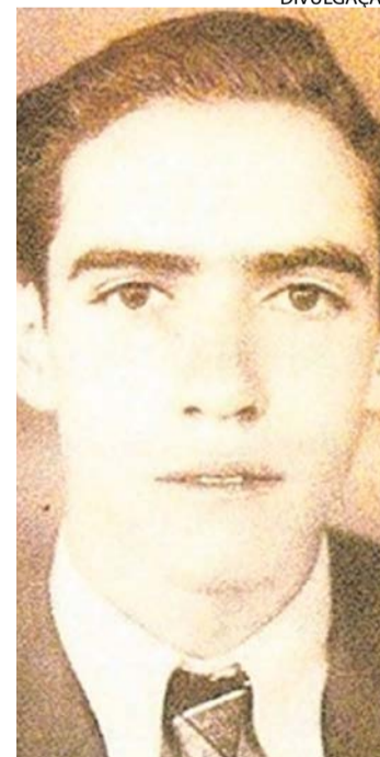
Obra revela virtuoso da linguagem em 20 contos inéditos

Morto aos 89 anos, em 2012, criou poesia nas veredas abertas pela Geração de 45, como diz Carlos Nejar. Na ficção, encaixa-se no modernismo de Aníbal Machado. Foi, além disso, homem de jornal — era a voz de seu tempo na crônica. Resta a leitura de seus textos.