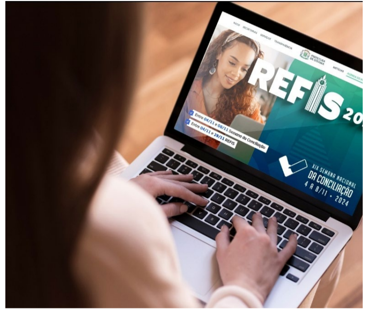
Conforme a Prefeitura, nenhuma parcela pode ser inferior a R$ 100 para pessoas físicas ou R$ 300 para empresas

A Prefeitura alerta que a regularização é essencial para evitar a inscrição em dívida ativa e a inclusão nos órgãos de proteção ao crédito.