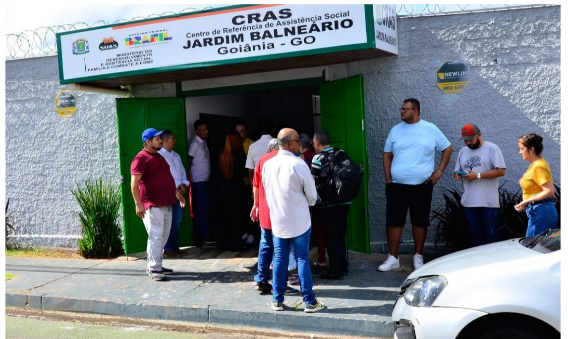
Cras do Setor Balneário Meia Ponte beneficiará moradores de mais de cinco bairros da região