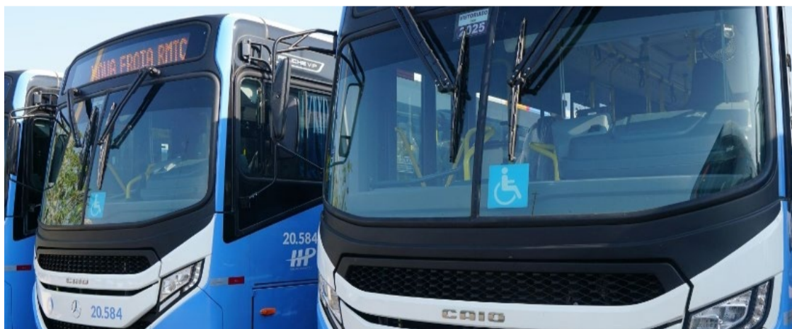
Veículos novos adquiridos pelo Governo de Goiás: ônibus vão circular de quarta-feira até domingo

Dois novos veículos com ar condicionado estarão em circulação para atender o itinerário. Eles foram adquiridos por meio de investimentos do projeto Nova RMTC, com recursos do subsídio do transporte por parte do Governo de Goiás e das prefeituras de Goiânia e de cidades da Região Metropolitana.