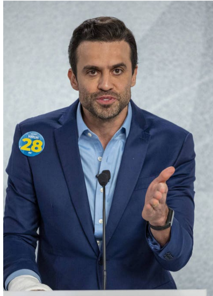
Pablo Marçal: diálogo para filiar-se ao União Brasil