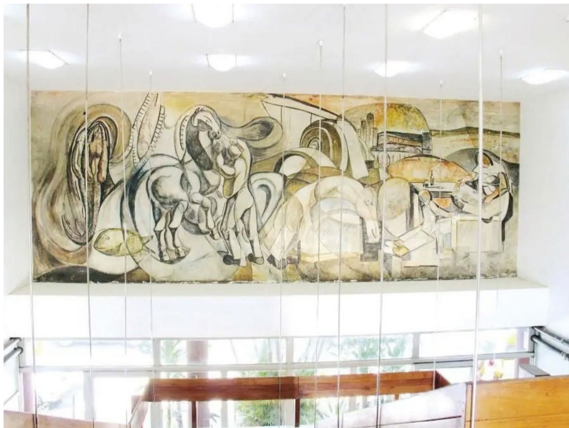
'Energia elétrica: a origem, a invenção e o usufruto': modernização do estado de Goiás

De acordo com o documento, não é segura a transferência da peça, pois o painel já sofreu danos com a primeira intervenção de seccionamento e transporte, e o trajeto específico e características da cidade podem comprometer ainda