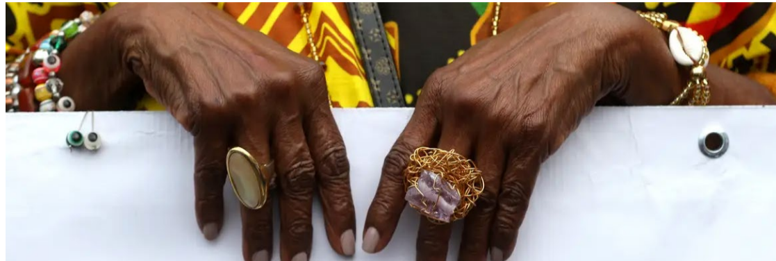
Para 59% a maioria é racista, enquanto outros 5% dizem que todos são racistas

93% dos entrevistados dizem acreditar que as pessoas com maior poder aquisitivo são mais bem tratadas pela Justiça no Brasil, no que se refere a apuração e punição de crimes