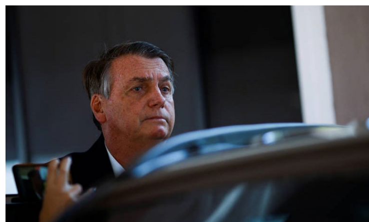
Jair Bolsonaro nega que ter estimulado golpe de estado em 2022

"Da minha parte nunca houve discussão de golpe. Se alguém viesse pedir golpe para mim, ia falar, tá, tudo bem, e o 'after day'? E o dia seguinte, como é que fica? Como fica o mundo perante a nós. (...) A palavra golpe nunca esteve no meu dicionário."