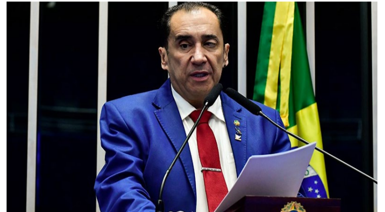
Jorge Kajuru: nova reforma política no país