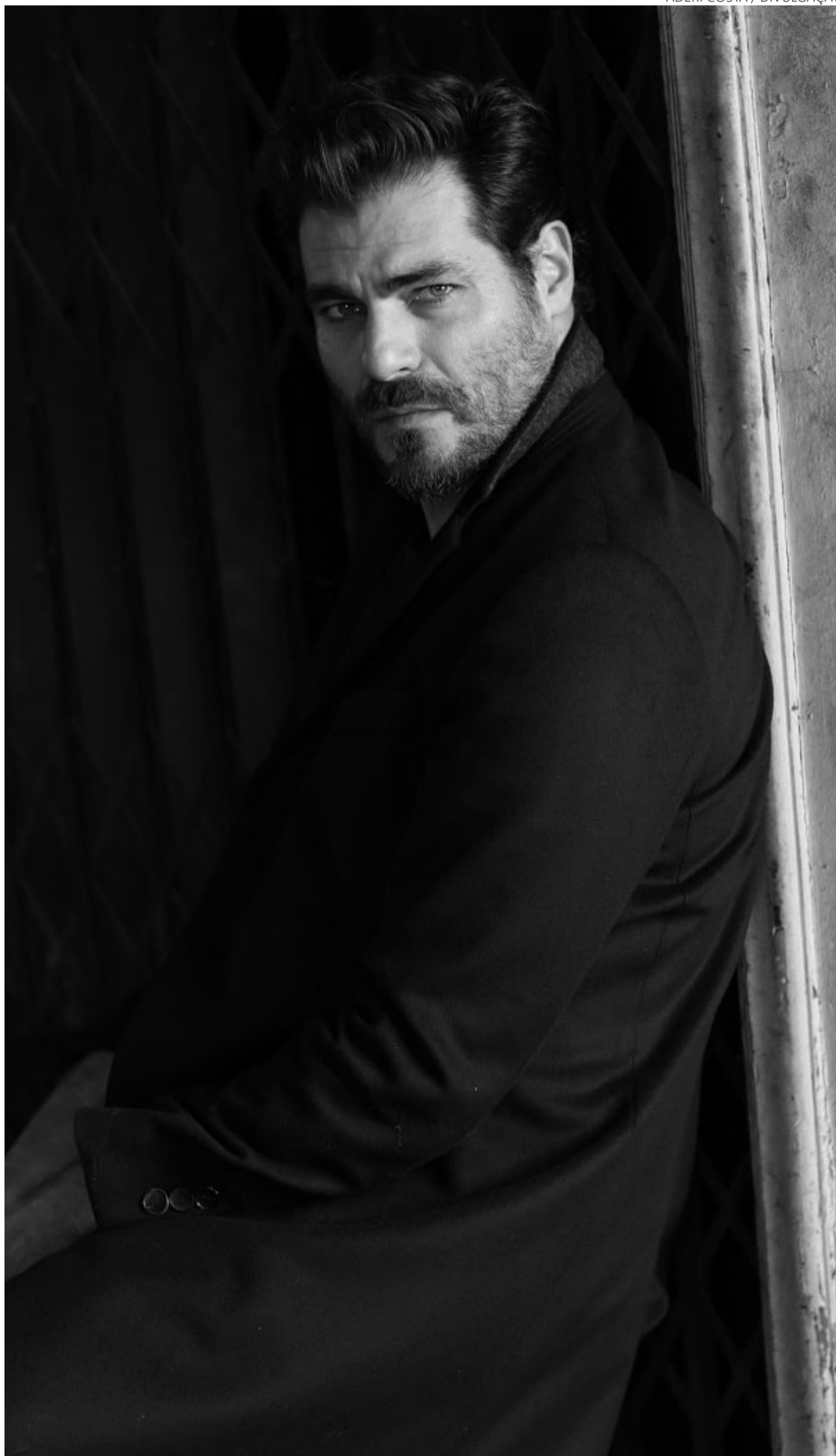
Ator encena personagens marcantes da dramaturgia shakespeariana em Goiânia

Em cena, refletiremos sobre poder e ambição, justiça e loucura, traição e morte. São assuntos universais que atravessaram os séculos (Shakespeare vivera durante o período Renascentista) e se tornam ques-