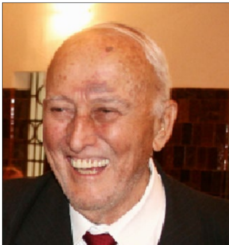
Mauro Borges: governador afastado pelo golpe de 1964

Mauro Borges, tomou posse no dia 31 de janeiro de 1961,