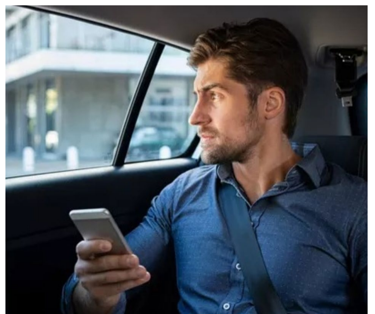
É obrigatório o uso do cinto de segurança para condutor e passageiros em todas as vias do território nacional