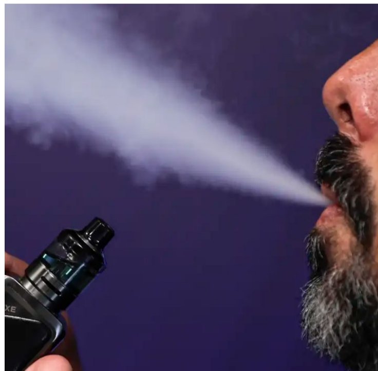
Usuários de cigarros eletrônicos manifestam altas incidências de ansiedade e outros problemas mentais

Conclusão é de uma pesquisa divulgada pelo InCor (Instituto do Coração) a partir da análise da saliva de 417 fumantes exclusivos de cigarro eletrônico