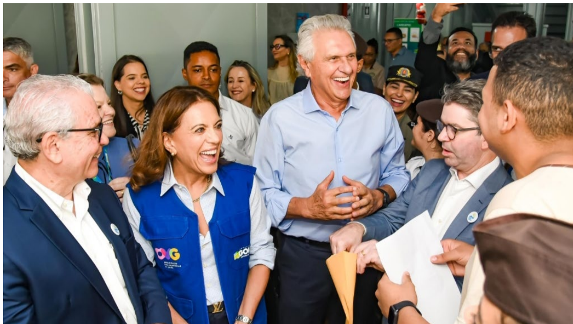
Maior programa do Centro-Oeste abrange jovens em situação de vulnerabilidade: governador Ronaldo Caiado e primeira-dama Gracinha Caiado destacam abrangência

A primeira-dama Gracinha Caiado recordou a situação com a qual se deparou há quase seis anos, ao chegar em São Domingos, no município de Cavalcante. "Uma criança olhou para mim e disse 'eu não consigo estudar, porque eu não enxergo na sala de aula'. A partir desse momento, eu comecei