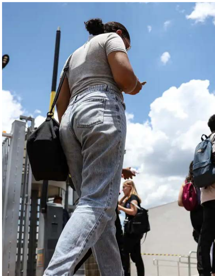
Para os estudantes não isentos, o prazo para pagar a taxa de inscrição (R$ 85) vai até o dia 17 de junho

Todos os detalhes do Enem 2026 estão no edital da prova, com informações sobre atendimento especializado para pesso-