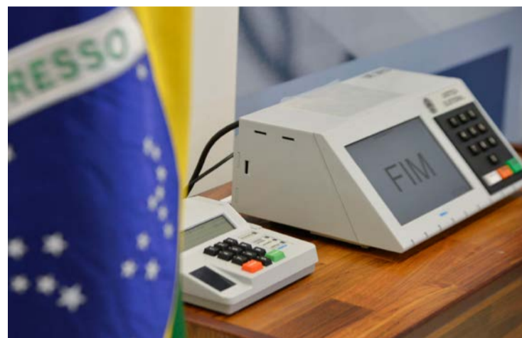
Nas eleições de 2026 mais igualdade para as chamadas minorias

O desafio da democracia: MPE cobra espaço real para mulheres, negros e indígenas: igualdade