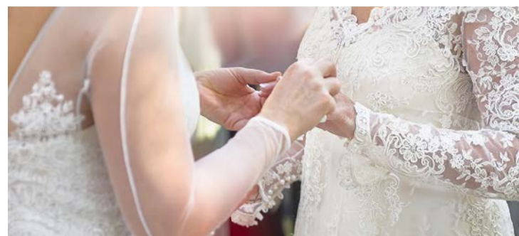
Em 2025 Foram registrados 15.520 casamentos homoafetivos