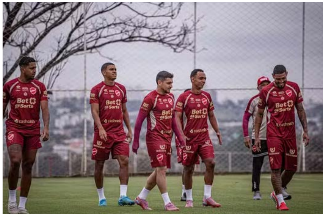
Com 22 pontos, Vila busca aproveitar o fator casa para seguir entre os primeiros colocados da Série B