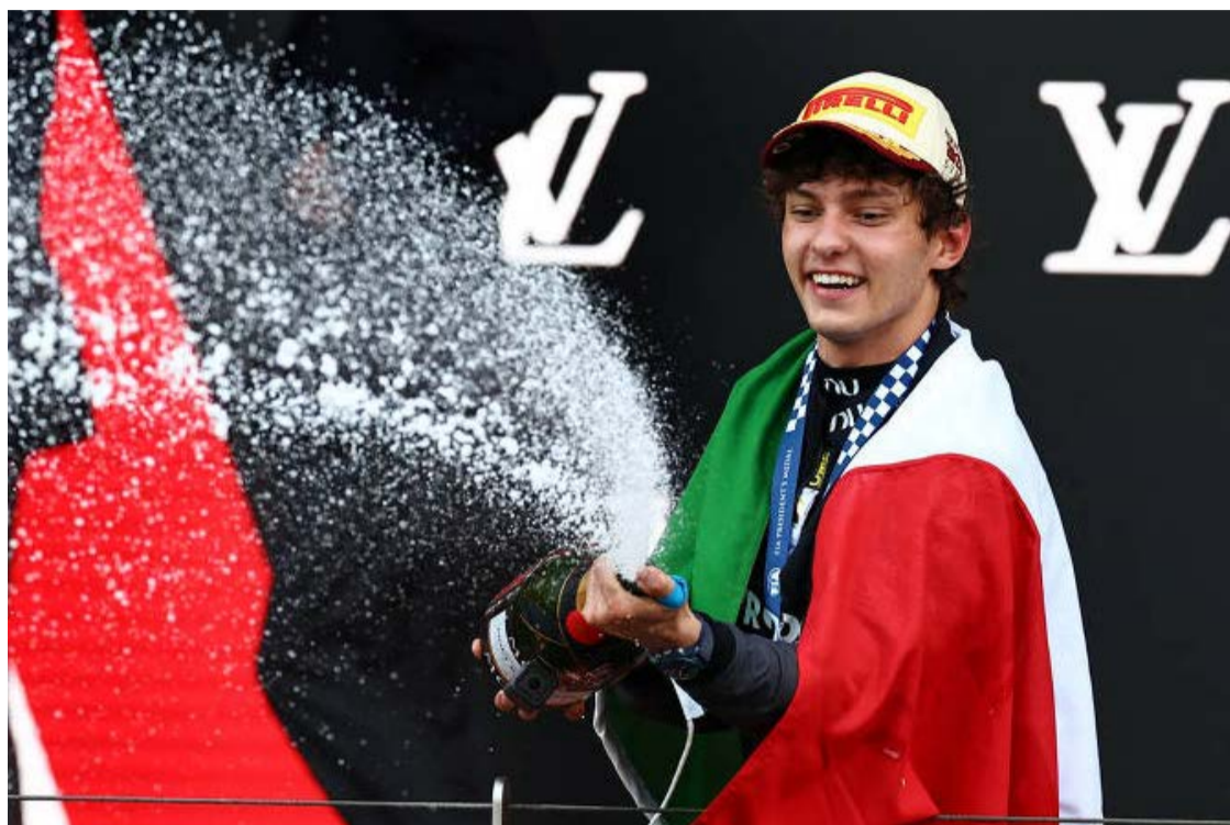
Italiano Kimi Antonelli dominou o GP de Mônaco do começo ao fim para vencer pela quinta vez consecutiva na Fórmula 1

Primeiro Lance Stroll causou um Safety Car na