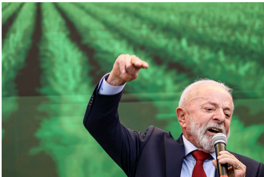
Lula acelerou pagamento de emendas para colocar fim à escala 6x1

Os R$ 16,1 bilhões pagos pelo governo Lula em maio incluem R$ 11,2 bilhões em emendas individuais e R$ 3,3 bilhões em emendas das bancadas estaduais —modalidade em que o Executivo é obrigado a repassar a verba aos parlamentares, mas pode definir o momento da libera-