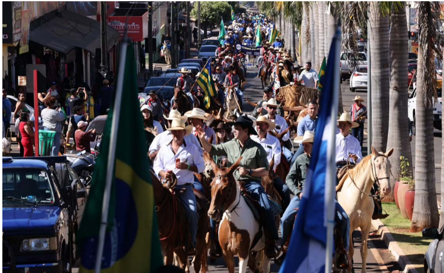
Governador de Goiás destaca importância da cultura sertaneja durante tradicional Desfile de Cavaleiros em Jataí