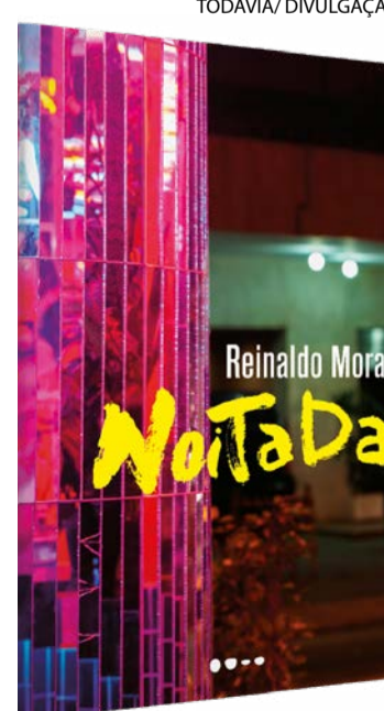
Saiu do forno: romance chega às livrarias hoje

Ao alternar entre as vozes da primeira e da terceira pessoa, inventar palavras-valise sem alça e forçar os limites da moral e da literatura com humor, Reinaldo Moraes define seu novo livro como "uma espécie de playground maluco" do espaço literário contemporâneo.