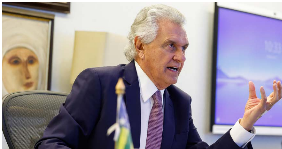
Ronaldo Caiado culpa Lula pelo tarifaço impostos pelos EUA ao Brasil

Ao comentar a disputa política em torno da responsabilização pelo episódio, Caiado rejeitou a ideia de que a questão possa ser atribuída a ações isoladas ou a viagens específicas realizadas por lideranças brasileiras aos Estados Unidos. Para ele, o caso é resultado de um contexto mais amplo e de decisões acumuladas ao