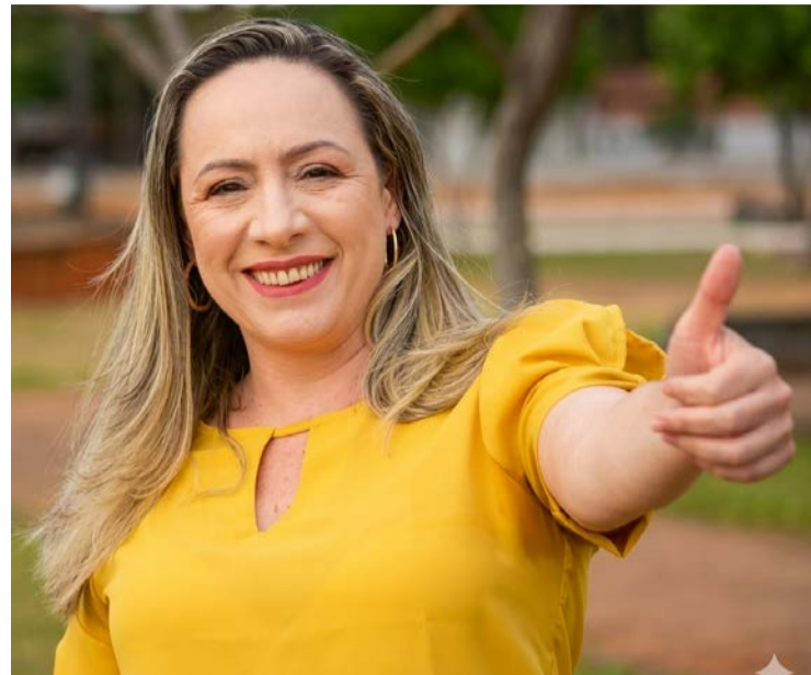
Nome de Adriana Accorsi volta a ser ventilado no PT