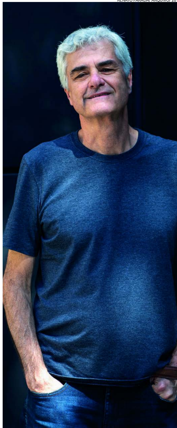
Autor cria constelação de significado em nova obra