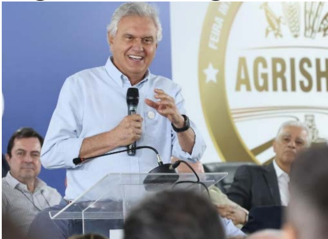
Ronaldo Caiado requereu no evento mais inovação para impulsionar o agronegócio brasileiro

Caiado destacou o crescimento expressivo da produção agrícola em Goiás, que deverá atingir 38,4 milhões de toneladas na safra de 2025, aumento de 19% em relação ao ano anterior. Segundo o governador, esse avanço mostra a força da ciência aplicada ao campo, principalmente em condições climáticas desafiadoras.