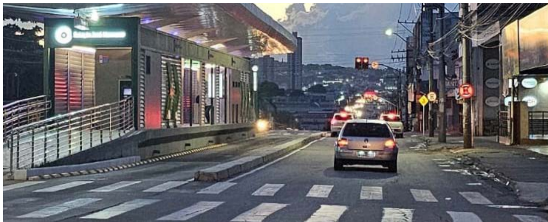
Avenida Anhanguera, na região de Campinas: criação do percurso uniu a cidade originária e a derivada

Novos investimentos públicos na mobilidade e estações, além de esperança de comerciantes, aumentam expectativas de recuperação histórica da avenida