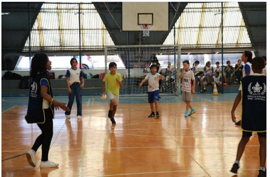
Queimada é esporte popular nas ruas e escolas: prática reforça habilidades

As partidas serão realizadas em diferentes pontos da cidade, sempre às 8h ou às 14h. Além do Parque da Vizinhança 2, escolas como a EMTI Professora Lousinha, EM Professor Trajano de Sá Guimarães e EM Benedita Luiza da Silva Miranda receberão os jogos ao longo do festival, garantindo que o maior número possível de estu-