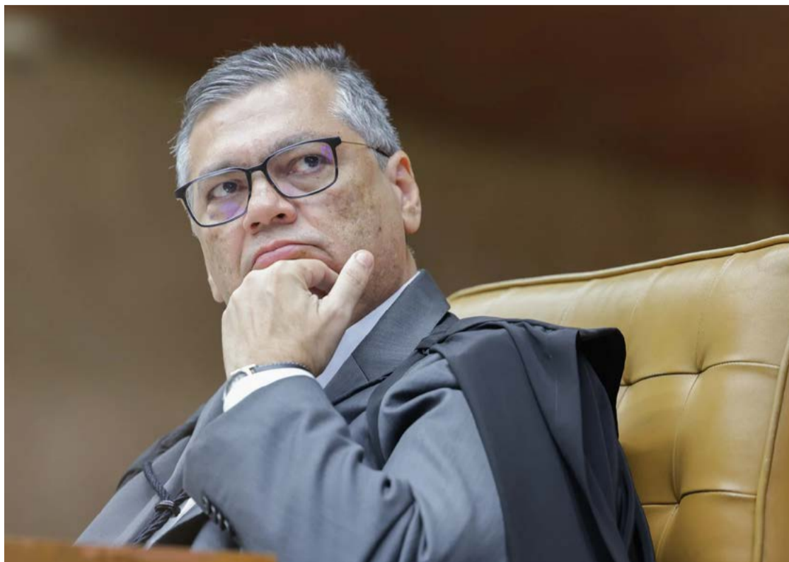
Ministro Flávio Dino cobra explicações de líder do PL sobre divisão de emendas impositivas

Motta e demais líderes partidários acertaram a divisão desses recursos seguindo esta proporção: 30% do valor total que uma comissão permanente da Câmara tem direito fica com o partido que tem o comando do colegiado, enquanto os demais 70% são distribuídos por Motta