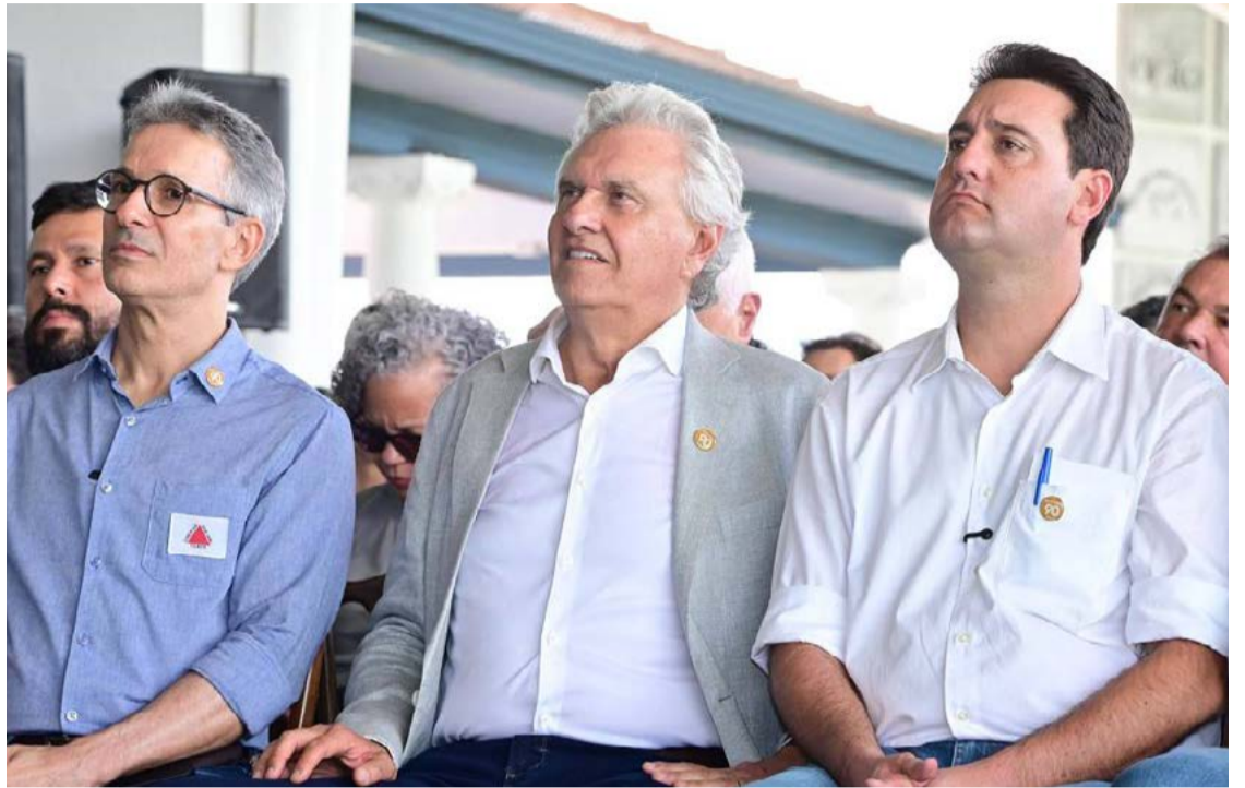
Romeu Zema (Minas Gerais), Ronaldo Caiado (Goiás) e Ratinho Jr. (Paraná) participam da abertura da Expozebu

governadores que estiveram na feira na cidade mineira caminharão juntos na eleição presidencial do ano que vem, ele afirmou "ter certeza" disso. "Tenho certeza que vamos caminhar juntos. Nós temos que entender que o Tarcísio [de Freitas, governador de São Paulo] também é uma grande liderança. Nós também estaremos compartilhando toda essa nossa capacidade para poder apresentar um candidato ou, se não, vários", afirmou.