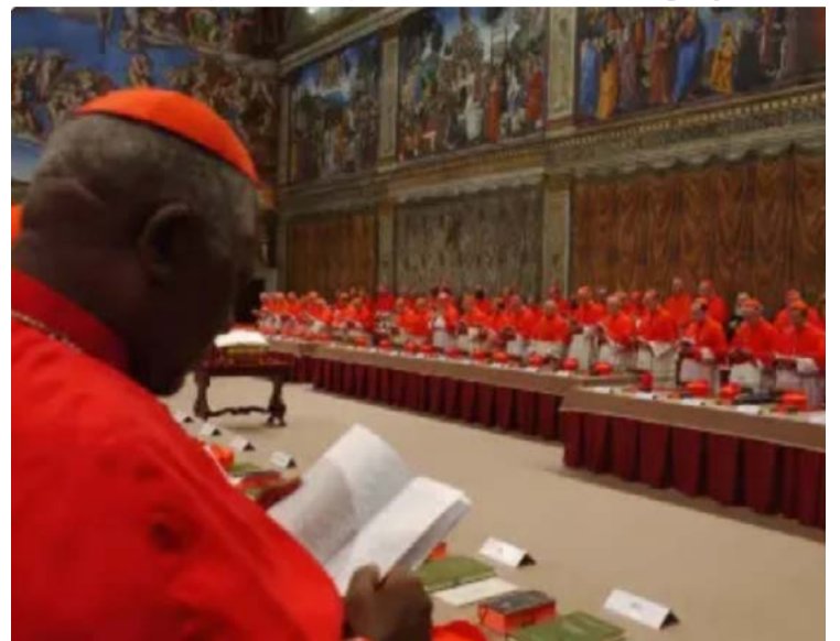
Cena do filme "Conclave", inspirado na realidade da escolha de um novo papa

Sete cardeais brasileiros participarão do Conclave que elegerá o sucessor de Francisco. Escolha deve começar dia 5 de maio. América Latina pode impactar escolha da Igreja