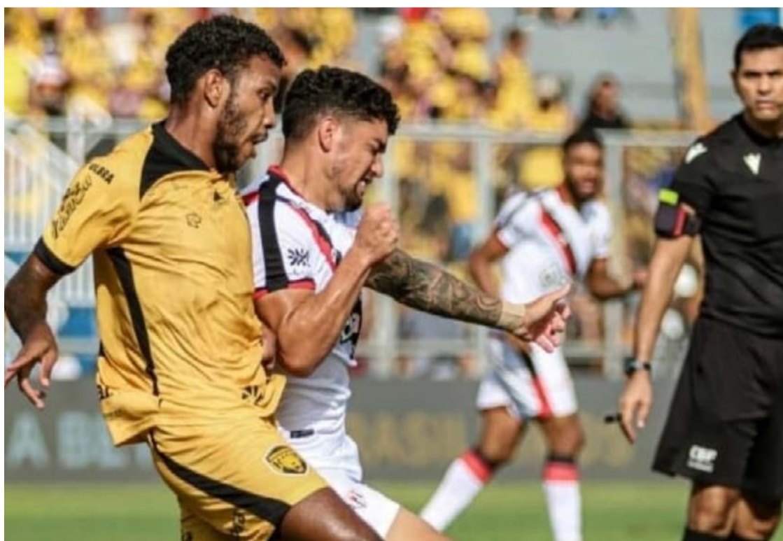
Atlético Goianiense volta para casa com empate e distância do grupo que pode subir para série A

O Dragão terá que enfrentar o Novorizontino no estádio Antônio Accioly, no próximo domingo, 4, às 16h. É jogo essencial para a recuperação do time. Por sua vez, o Amazonas pegará o Remo no estádio do Mangueirão.