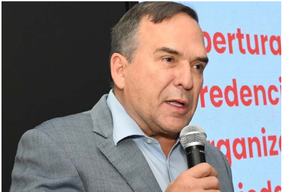
Sandro Mabel, prefeito de Goiânia: laboratórios de anatomopatologia reduzem tempo de laudos

O SVO é uma unidade essencial para o sistema de saúde pública, responsável por investigar e esclarecer óbitos de causa desconhecida ou suspeita fora de unidades hospitalares. Em média, o serviço realiza cerca de 1.200 exames por ano em Goiânia, gerando informações que alimentam os bancos de dados da vigilância epidemiológica