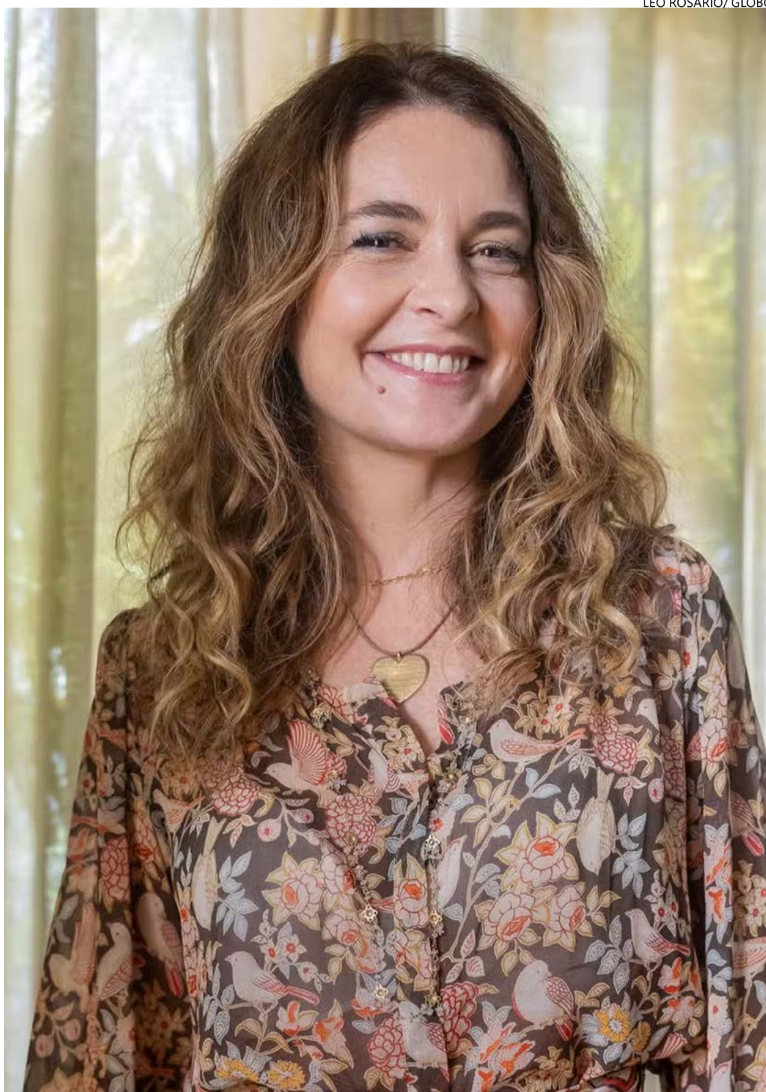
Artista percorreu o País os últimos dois anos com espetáculo "Virginia"

cutir saúde mental. Discutir quem tem humor instável. Filipa é muito intensa. Ou está na euforia excessiva, na empolgação, com um projeto novo, um sonho novo, ou está depressiva, achando que nada deu certo. Ela é agressiva, muito reativa. Apesar de não estar esperando fazer novela, pensei que era uma oportunidade maravilhosa."