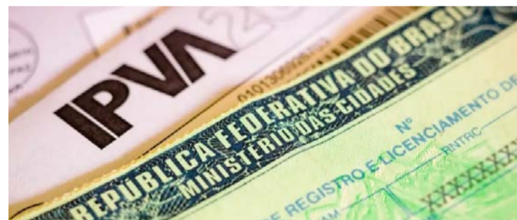
Detran do Distrito Federal era alvo de ação de organização criminosa