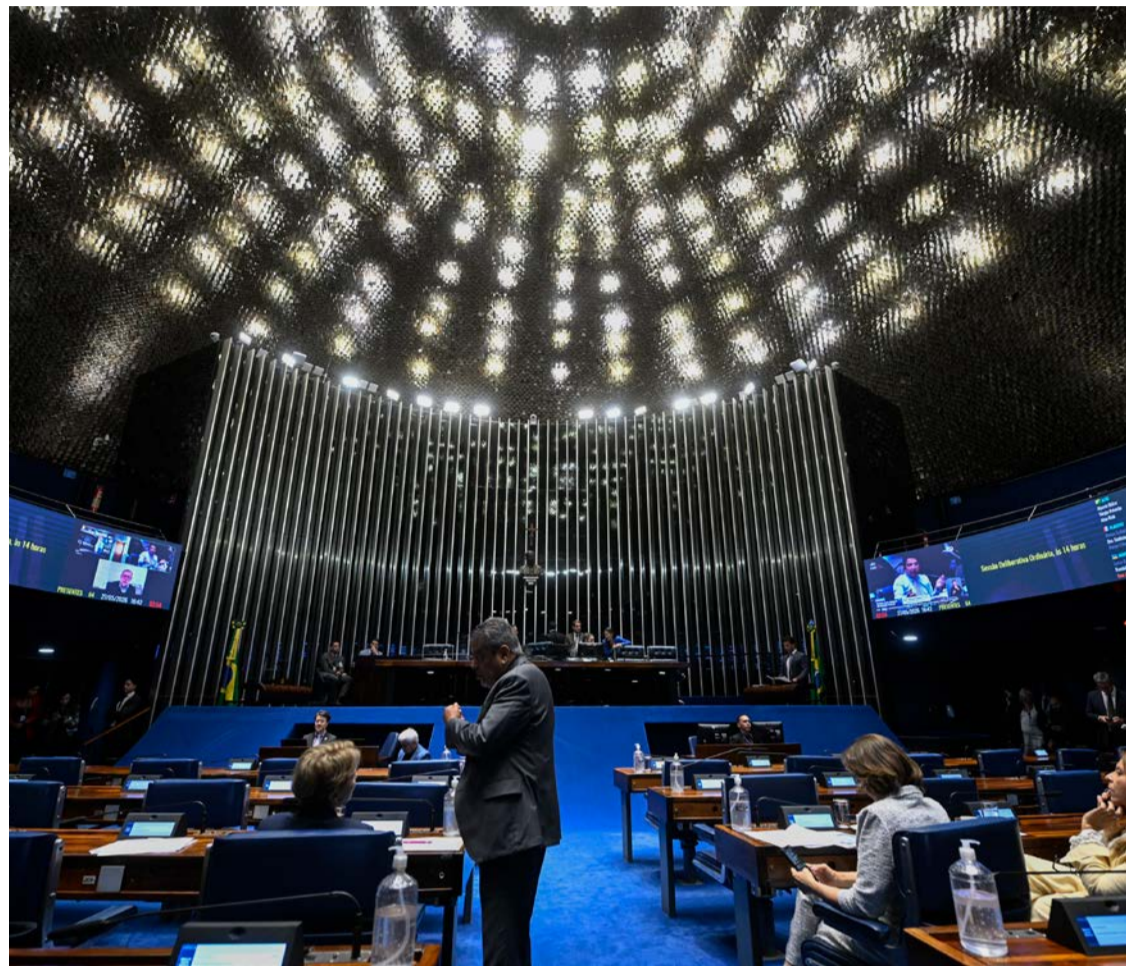
Emenda que reduz escala de trabalho para 5 x 2 será votada no Senado nos próximos dias

O presidente da Câmara, Hugo Motta (Republicanos-PB), e o governo Lula (PT) trabalham para votar um projeto de lei que atualiza o limite de faturamento dos microempreendedores individuais (MEI) antes da eleição, como forma de mitigar os impactos do fim da escala 6x1, mas a exclusão das