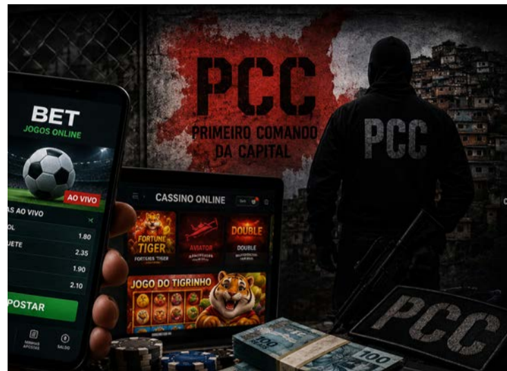
PC e MP miram bets clandestinas em São Paulo

Entre os alvos estão a Aposte Fácil e o site clandestino Black Vegas, ligado ao “tigrinho”