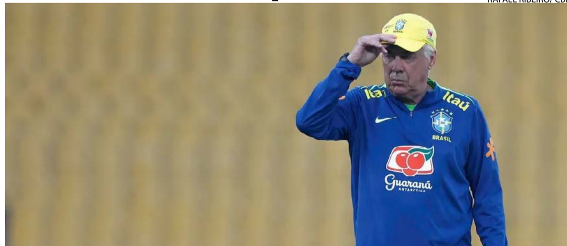
Treinador deixa craque brasileiro em seus planos, apesar da contusão