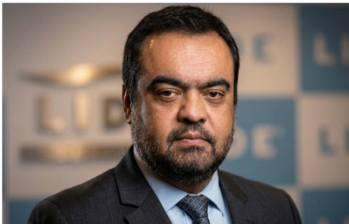
Cláudio Castro desistiu de disputar mandato de senador no Rio de Janeiro

A ação ocorreu 11 dias depois de outra operação contra o ex-governador, para apurar na ocasião sua atuação em favor do grupo Refit, ligado ao empresário Ricardo Magro, apontado como um sonegador contumaz.