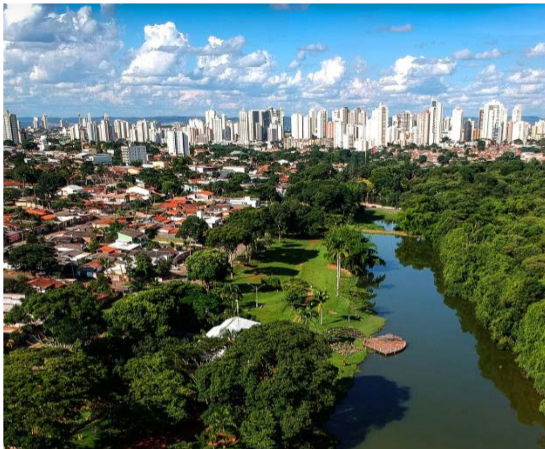
Grande Goiânia registra melhor desempenho da série histórica e aparece entre as cinco regiões metropolitanas mais desenvolvidas do país

Em 2012, a Região Metropolitana de Goiânia possuía índice de 0,770. Antes da pandemia, em 2019, o indicador havia chegado a 0,802, mas sofreu queda em 2021, atingindo 0,769