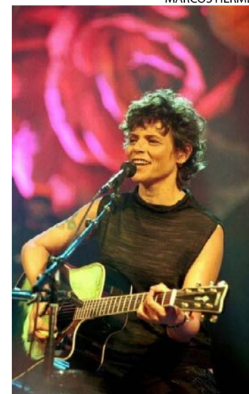
Cássia Eller: mãe do cantor e compositor carioca

Até que enfim, vamos sair de casa para assisti-lo. O artista carioca é a novidade do Um Festival, que também terá Samuel Rosa, Detonautas, CPM 22, Raimundos e Biquíni. O evento acontece amanhã, a partir das 15h, no Centro Cultural Oscar Niemeyer.