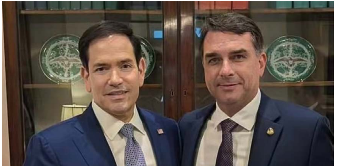
Flávio Bolsonaro e secretário de Estado Marco Rubio. Ele diz que facções brasileiras representam ameaça aos interesses dos EUA

O governo Lula tentou evitar que os Estados Unidos adotassem a medida. Integrantes do Palácio do Planalto demonstravam preocupação com possíveis impactos diplomáticos e eleitorais da decisão, além do risco de ampliação da influência americana em questões de segurança pública no Brasil. O presidente Luiz Inácio Lula da Silva afirmou recentemente que o tema não foi tratado diretamente em conversa de mais de três horas com Donald