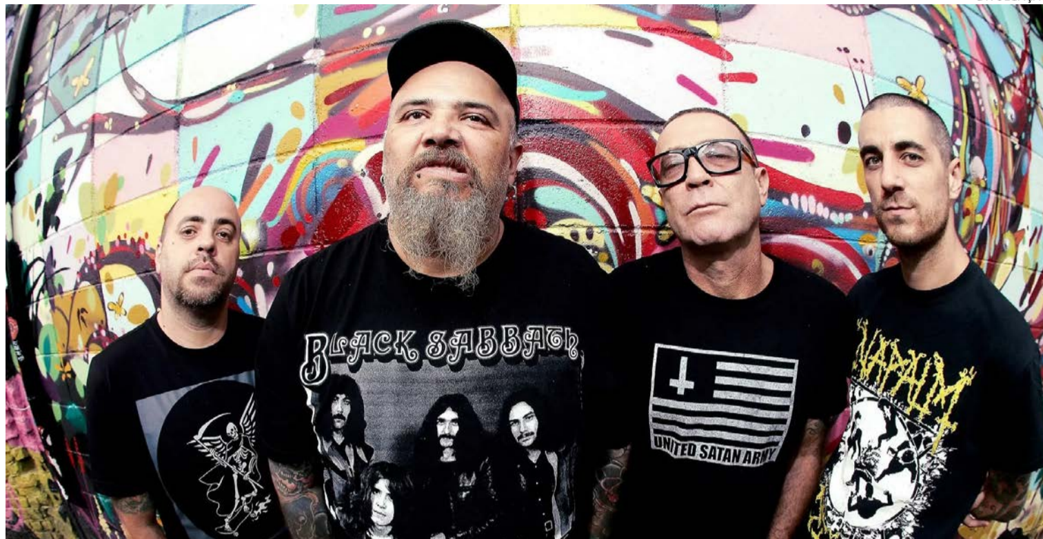
João Gordo (ao centro) se tornou uma das figuras mais reconhecidas do rock brasileiro com sua voz gutural

Punks levaram música rápida e de crítica social ao Deleon Music Pub, em Goiânia, a partir das 21h. Noite vai ter também apresentação das bandas Aurora Rules, Dergo e Rocco, além da Imortal Joe