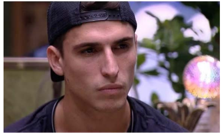
Ex-BBB Felipe Prior pode recorrer da sentença em liberdade

Arquiteto foi sentenciado a oito anos de prisão por um crime ocorrido em 2014, em São Paulo