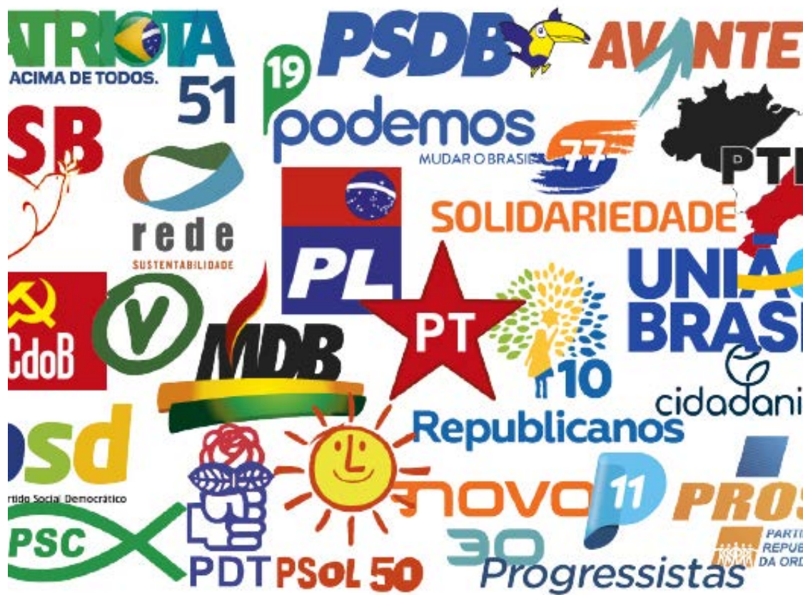
Partidos vão utilizar o fundo eleitoral para bancar as campanhas à Câmara dos Deputados

A federação União Brasil/Progressista vai definir que seus parlamentares que forem tentar a reeleição terão de R$ 2,5 milhões a R$ 3,5 milhões para financiar suas campanhas e, caso não entrem na disputa, podem indicar outro candidato para receber sua cota, o partido hoje tem a segunda maior bancada na Câmara, com 111 deputados, e a terceira do Senado, com 14. Com isso, mais de 40% que o partido receberá já está reservado, sem contar o que será enviado a candidatos sem mandato.