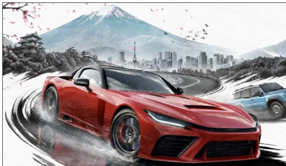
Clássico das estradas, Forza Horizon 6 tem lançamento estimado para o primeiro semestre