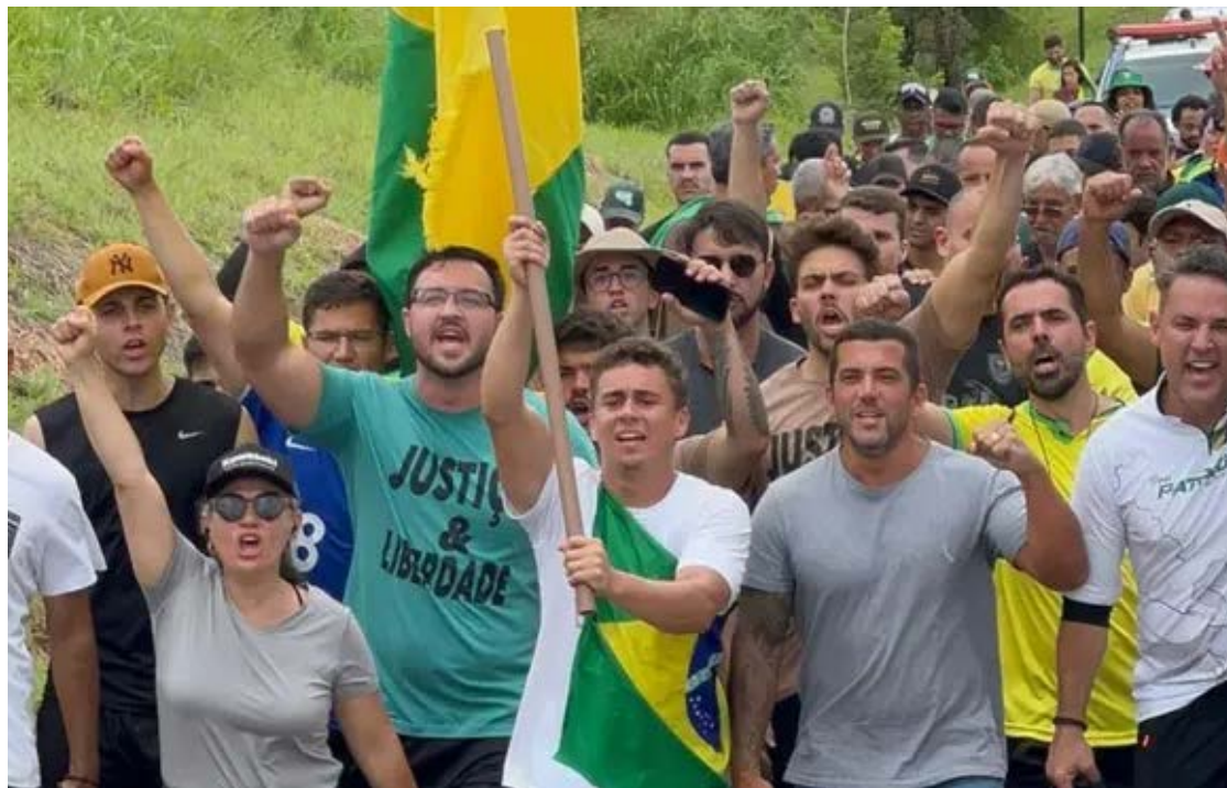
Deputado federal Nikolas Ferreira durante caminhada pela liberdade de Bolsonaro

Apoiadores que quiseram falar ou tirar fotos com o deputado durante a manifestação têm pouco tempo, já que o cordão de segurança tenta controlar o movimento de pessoas e pede que elas se retirem