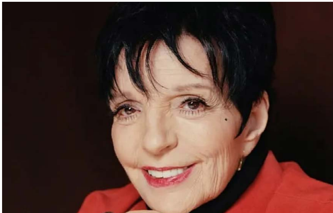
Liza Minnelli lança “Kids, Wait Til You Hear This”

Em comunicado enviado à imprensa, a artista afirmou que o uso da tecnologia foi pensado como ferramenta criativa, e não como substituição do trabalho humano. “Sempre acreditei que a música tem a ver com conexão e verdade emocional. O