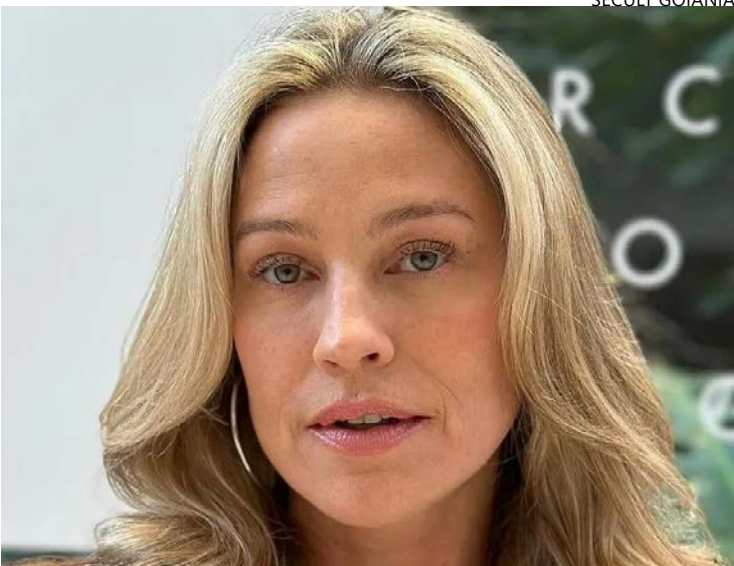
Luana Piovani faz ensaio nua e reclama de intolerâncias