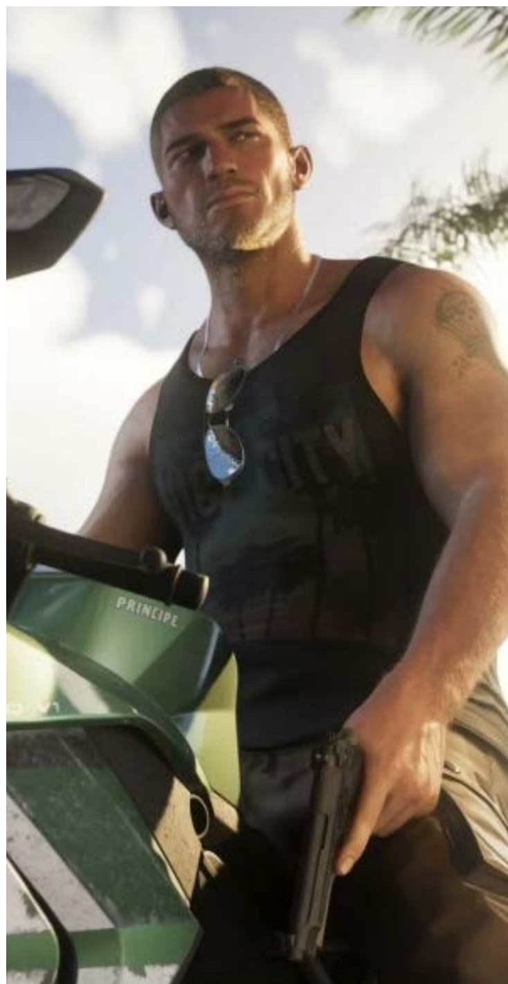
Grand Theft Auto VI deve levar os jogadores em um mapa expansivo, com ultra realismo: previsão para novembro

Tem outra nova-velha-novidade: o jogo do agente 007 ("First Light") desenvolvido pela IO Interactive. O título de espionagem aposta em narrativa cinematográfica. Traz evidente nostalgia para quem teve um Nintendo 64 e soprava o disputado cartucho do 007.