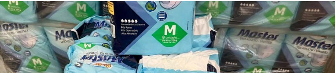
Atualização é obrigatória e deve ser feita presencialmente no Atende Fácil do Paço Municipal

A Prefeitura de Goiânia, por meio da Secretaria Municipal de Saúde, prorrogou até o dia 27 de fevereiro de 2026 o prazo para o cadastramento de pacientes que recebem bens, medicamentos e insumos de saúde. A atualização é obrigatória e deve ser feita presencialmente no Atende Fácil do Paço Municipal, de segunda a sexta, das 8h às 18h.