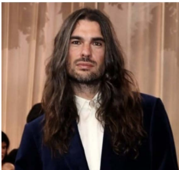
Declaração de diretor indicado ao Oscar reacende debate sobre nacionalismo: Oliver Laxe estaria com medo?

Ou seja, motivou os brasileiros a iniciarem movimento semelhante ao ocorrido no ano passado e que teve êxito com “Ainda estou aqui”. “O Agente Secreto” é favorito a estatueta em que o cineasta também