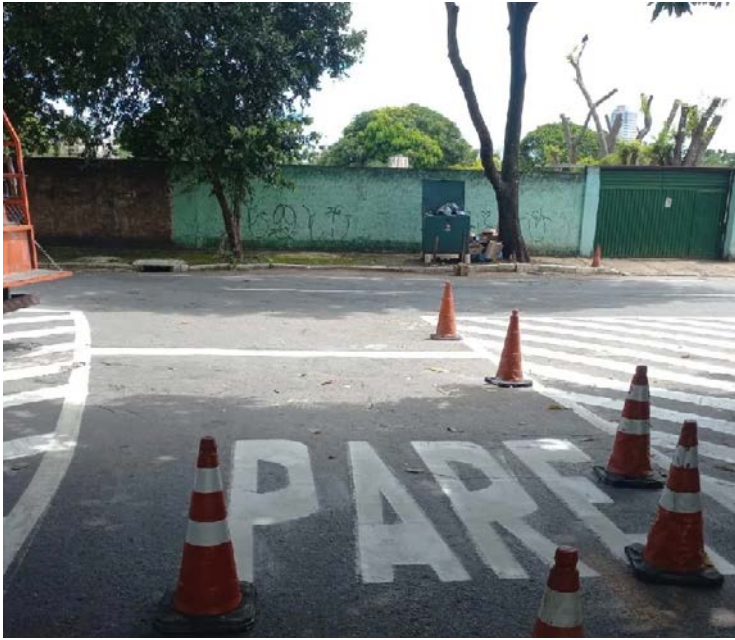
Projeto estratégico busca materiais com durabilidade para melhorar sinalização