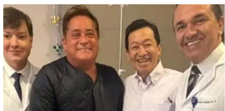
Leonardo realizou blefaroplastia com laser de CO 2 para corrigir região dos olhos: cantor já recebeu alta

As imagens de Poliana Rocha, esposa do cantor, mostram Leonardo ao lado da equipe médica após a cirurgia.