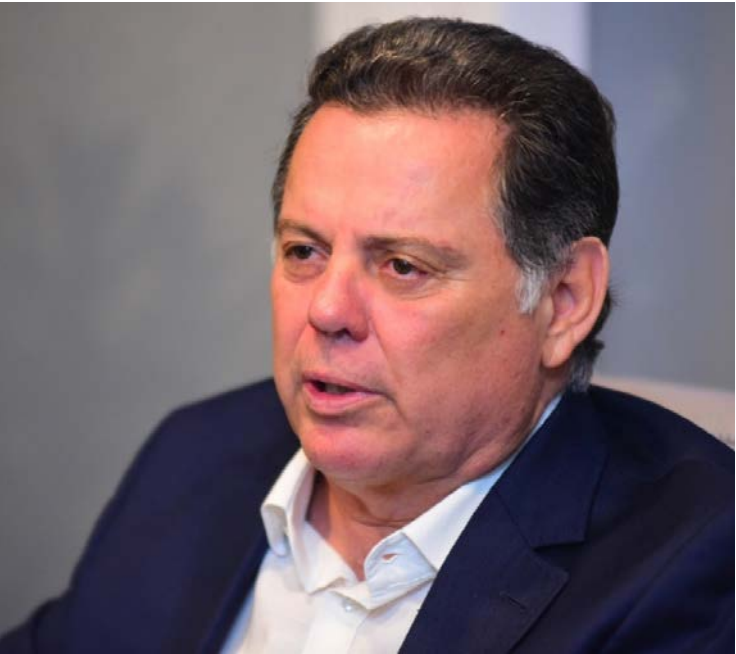
Marconi Perillo tem atuado para atrair descontentes da base governista

Um dos alvos do ex-governador é Zacharias Calil, deputado federal que quer uma vaga no Senado