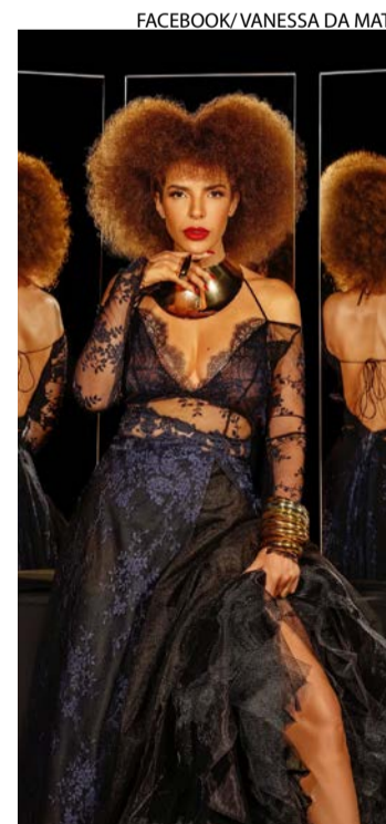
Artista percorre uma jornada barroca da Santa à Maria Sem Vergonha durante seu show

No domingo (21), o cantor Marcelo Falcão fecha o Fica, a partir das 20h, no palco Beira Rio. O artista, ex-O Rappa, vai cantar para o público canções que marcaram a música brasileira nos anos 1990. Em 2019, ele lançou seu primeiro disco solo, “Viver (Mais Leve que o Air)”.