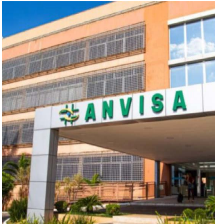
Recomendação da Anvisa é que uso dos lotes citados seja interrompido

A resolução também atingiu o lote 24101854 do antibiótico fosfato de clindamicina 150 mg/ml, produzido pela Hypofarma. A agência informou que foram encontrados alteração na coloração da solução, partículas estranhas e precipitados no interior de frascos lacrados, situação considerada incompatível com os padrões