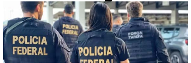
Organização é suspeita de operar esquema financeiro fraudulento