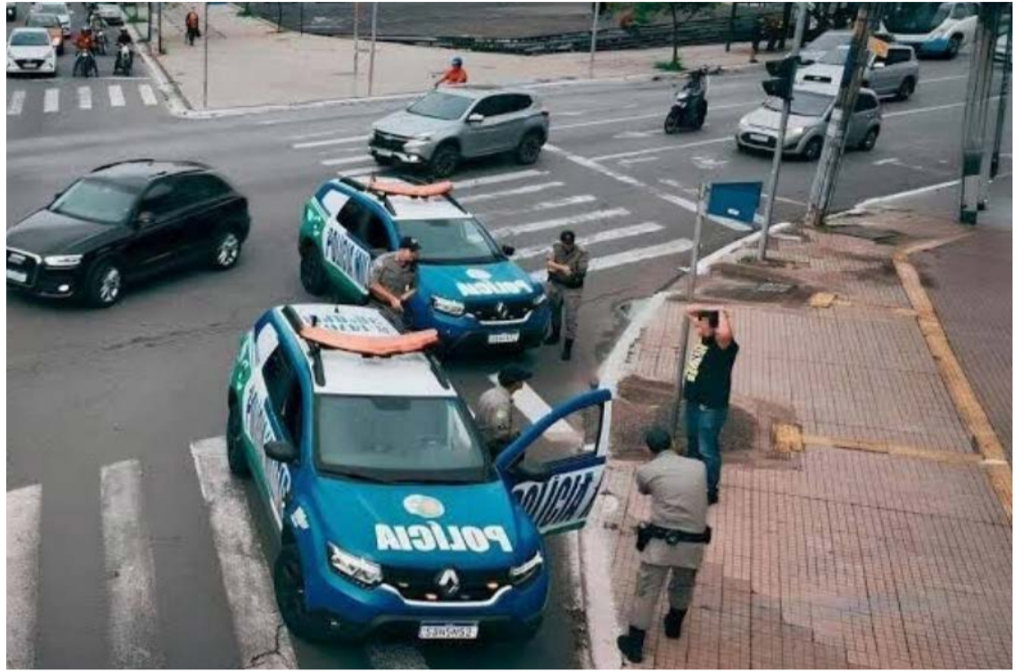
Programa IA Contra o Crime ampliou a operacionalidade policial: elucidação de 1,4 mil casos

Segundo ele, a ferramenta tem permitido uma atuação mais integrada e eficiente das corporações. "Em diversas ocorrências, a tecnologia permitiu que as equipes atuassem com mais rapidez, precisão e integração, fornecendo inteligência qualificada para subsidiar decisões em campo. Trata-se de uma ferramenta que não subs-