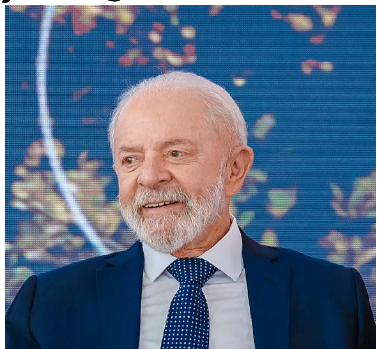
Presidente Lula deve mudar líder do governo no Senado

Caso a mudança se confirme, o nome mais citado para assumir a liderança governista no Senado é o do senador Camilo Santana (PT-CE), que aparece como principal alternativa para conduzir a articulação política da bancada petista na Casa em um momento de forte pressão sobre o governo.