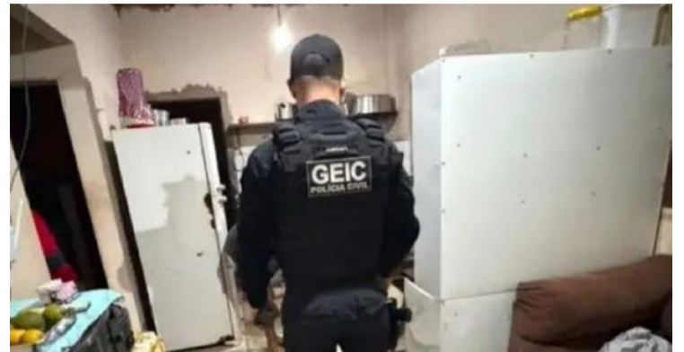
Em Goiás, alvos estão localizados em Jataí, Mineiros e Perolândia

Combate ao tráfico de drogas e ao crime organizado cumpriu 15 mandados de prisão