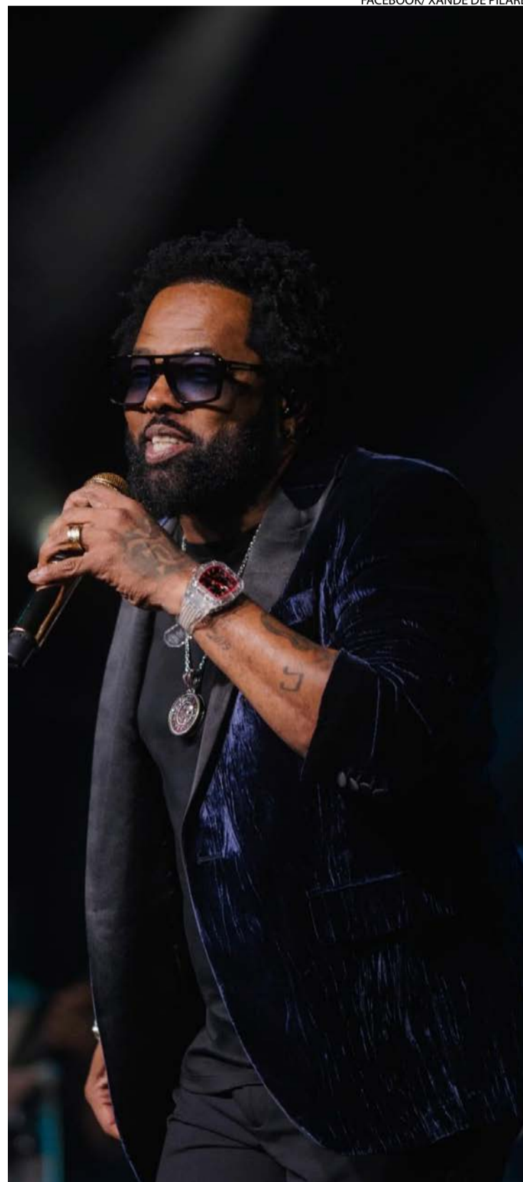
Sambista traz a Goiás repertório criado em décadas