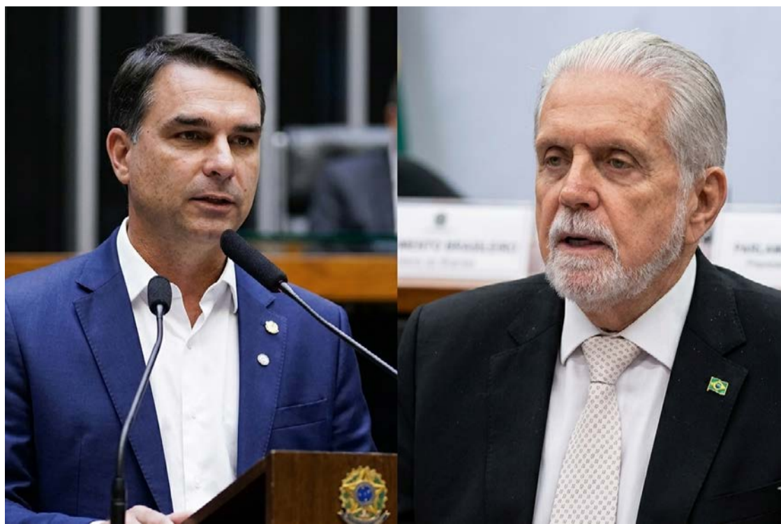
Flávio Bolsonaro de volta ao jogo após escândalo envolvendo Jaques Wagner

Durante evento em São Paulo, Flávio classificou a ação da Polícia Federal como um sinal de combate à impunidade e vinculou o caso ao histórico político do PT baiano. A declaração reforçou uma estratégia de campanha baseada