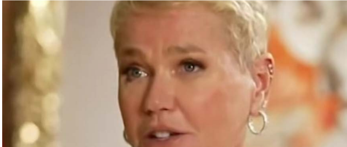
Xuxa Meneghel diz que os boatos sobre pacto com o diabo estão entre os assuntos que mais a incomodam

Xuxa relembra rumores que marcaram sua carreira, critica as teorias conspiratórias sobre seu sucesso e relata que já foi enganada