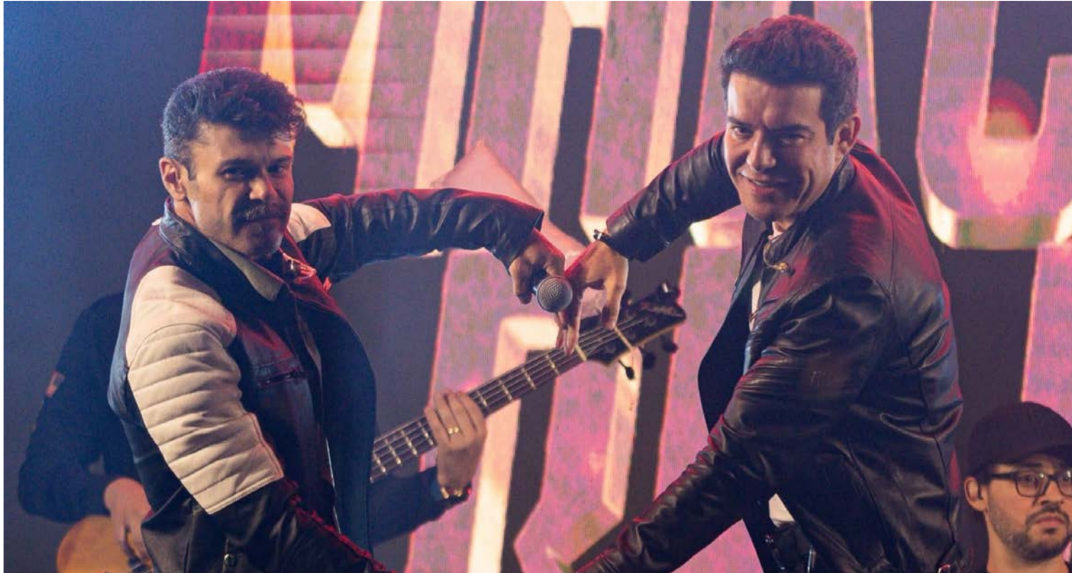
Dupla sertaneja comanda a programação especial desta sexta-feira (19/6) no Centro Cultural Oscar Niemeyer