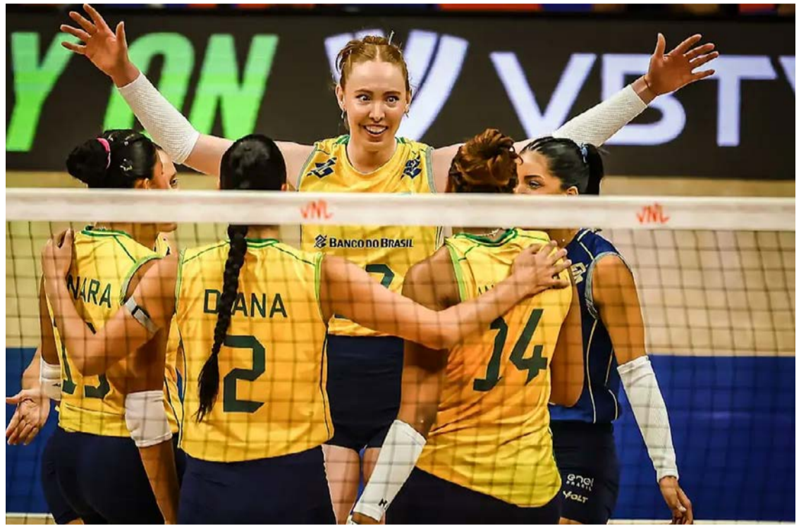
Seleção enfrentou a Bélgica e conseguiu se manter invicta

O público no ginásio de Ancara ficou aquém do esperado, apenas 824 pessoas pagaram ingresso para acompanhar as líderes da Liga Mundial. As chinesas estão na sexta posição da Liga Mundial, com quatro vitórias em seis jogos.