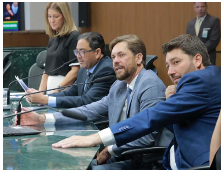
Deputados durante sessão na Alego: mais dependentes no Ipasgo-Saúde primos, tios-avós e sobrinhos-netos.

Beneficiários titulares poderão incluir no plano parentes de quarto grau até por afinidade