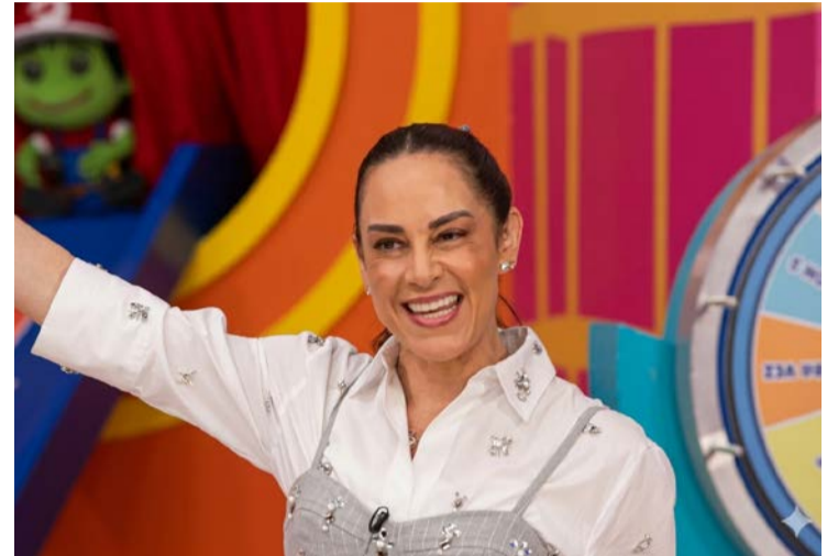
Filha de Sílvio Santos declara apoio à candidatura de Caiado

Empresária manifestou respeito ao ex-governador e afirmou que apoia integralmente o seu projeto