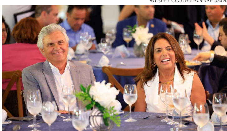
Governador Ronaldo Caiado e primeira-dama Gracinha Caiado, no evento de Lançamento do Pacote de Ações de Apoio ao Carnaval 2025, "Folia Goiás", e do site "Ocupa Goiás", na Sala Dona Gercina, no Palácio das Esmeraldas.

O Boticário acaba de lançar a fragrância compartilhável EGEO Choc High, uma nova e ousada interpretação do já amado Egeo Choc. Presente no universo gamer desde 2021 e reconhecida como a marca de cosméticos mais conhecida e usada pelos gamers, EGEO Choc High está no universo gamer com a Arena Choc High – uma experiência dentro do modo criativo do Fortnite.