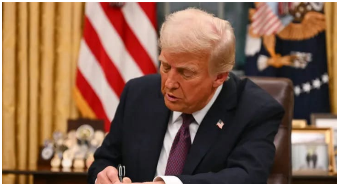
Trump: "É hora de fechar um acordo. Nenhuma vida a mais deve ser perdida!!!"

Volodymyr Zelensky expressou disposição para colaborar com os americanos na busca pela paz, mas enfatizou a necessidade de uma solução aceitável para a Ucrânia.