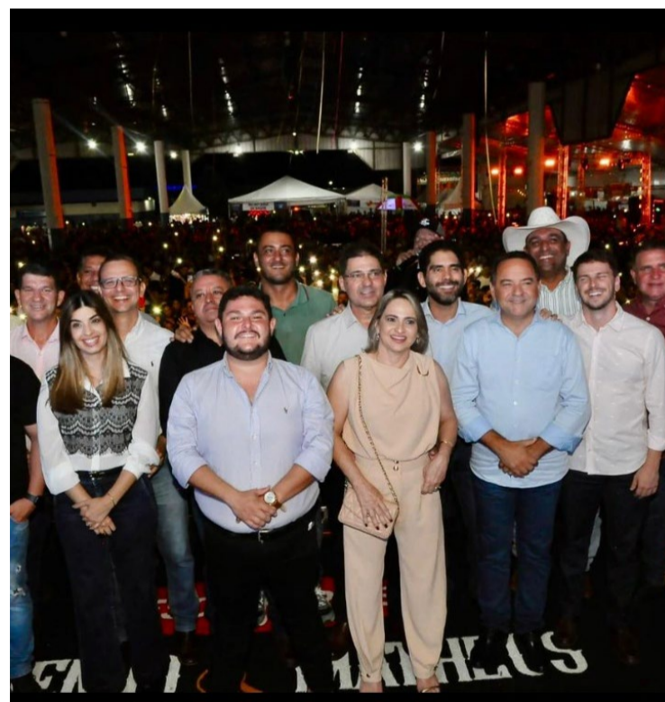
Adriano do Baldy, deputado federal, e moradores: "Momento de muita emoção celebrar com a população de Goiatuba 94 anos de história"

A celebração do aniversário foi marcada por momentos de alegria e reflexão, reafirmando a importância de olhar para o futuro sem esquecer as raízes que construíram a Goiatuba de hoje.