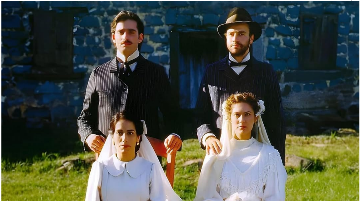
'O Quatrilho', de Fábio Barreto, concorreu ao prêmio máximo em 1996: entrada na disputa foi empenho da família Barreto

Na estreia em 1995, "O Quatrilho" acompanhou o sucesso de "Carlota Joaquina, Princesa do Brasil", primeiro filme do país a cruzar o milhão de espectadores desde o desmonte da estatal. Mesmo na euforia