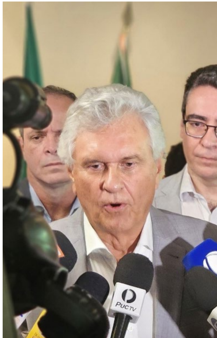
Ronaldo Caiado anuncia medida para ampliar turismo e empregos durante carnaval: "Evento que dinamiza a economia e promove integração"

A iniciativa integra eventos de artes visuais, concertos e espetáculos teatrais em locais como o Teatro Goiânia e o Centro de Convenções de Anápolis. Facilitará, enfim, a circulação de informações sobre lazer e cultura.