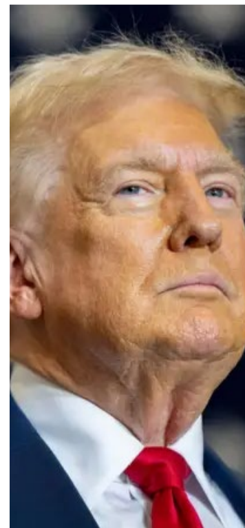
Donald Trump: posições polêmicas sobre a América Latina

Interlocutores da diplomacia brasileira veem particularmente Claver-Carone, ex-presidente do Banco Interamericano de Desenvolvimento (BID), como alguém que não terá uma abordagem agressiva de tarifas e pressão diplomática contra o Brasil. Ao contrário, é esperado que suas ações ampliem investimentos e parcerias para fazer frente à presença da China no país e no continente.