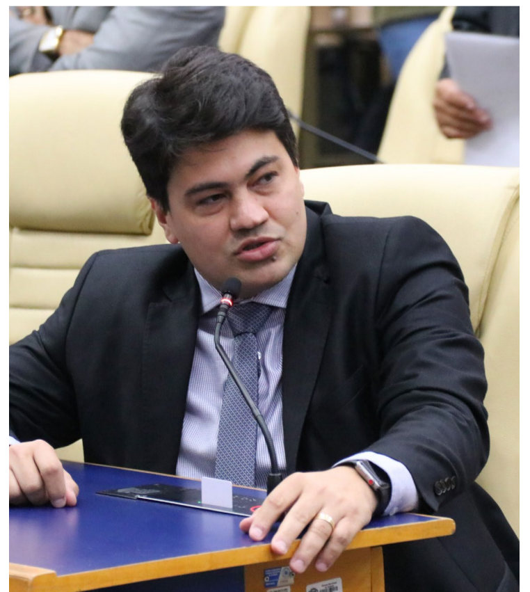
Igor Franco: relação harmônica entre Legislativo e Executivo

Levantamento sinaliza que Mabel tem apoio de 32 dos 37 vereadores goianienses, o que assegura aprovação dos projetos de interesse do Paço Municipal. Ele começa a nomear indicações dos vereadores aos cargos de segundo e terceiro escalão da prefeitura.