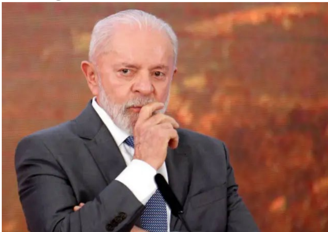
Lula da Silva: incertezas sobre candidatura à reeleição ao Planalto ano que vem

afirmaram à CNN que já planejam a organização de agendas e que a ordem é para que a equipe trabalhe ainda mais e viaje pelo Brasil nas entregas de cada ministério.