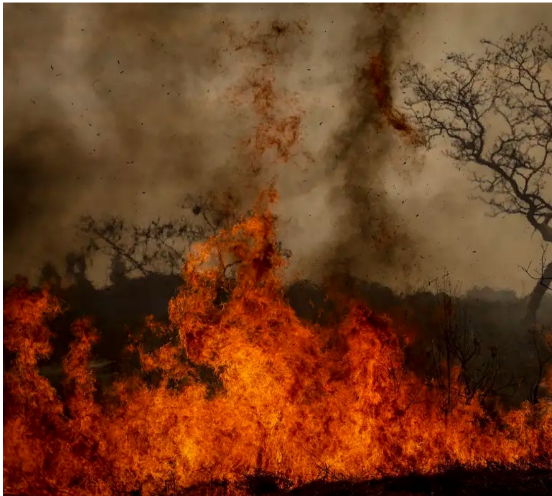
Cerrado, segundo lugar no ranking dos biomas, teve 9,7 milhões de hectares queimados

Área atingida por queimadas no Brasil chegou a cerca de 30,9 milhões de hectares em 2024, um crescimento de 79% em relação ao ano anterior