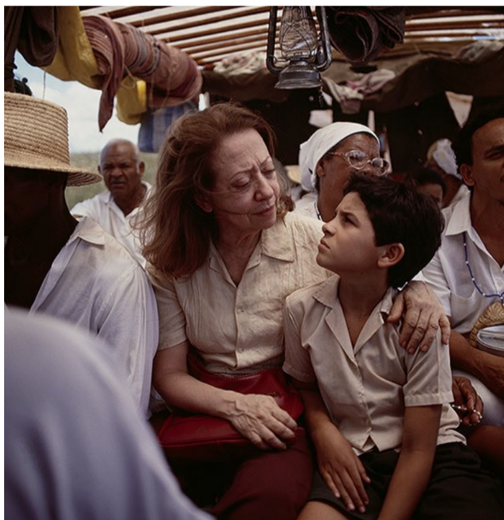
Fernanda Montenegro, com 'Central do Brasil', disputou estatueta em 1999: bateu na trave

financeira, a indicação ao Oscar foi surpresa até para Lucy Barreto, produtora do filme e um dos nomes por trás da campanha.