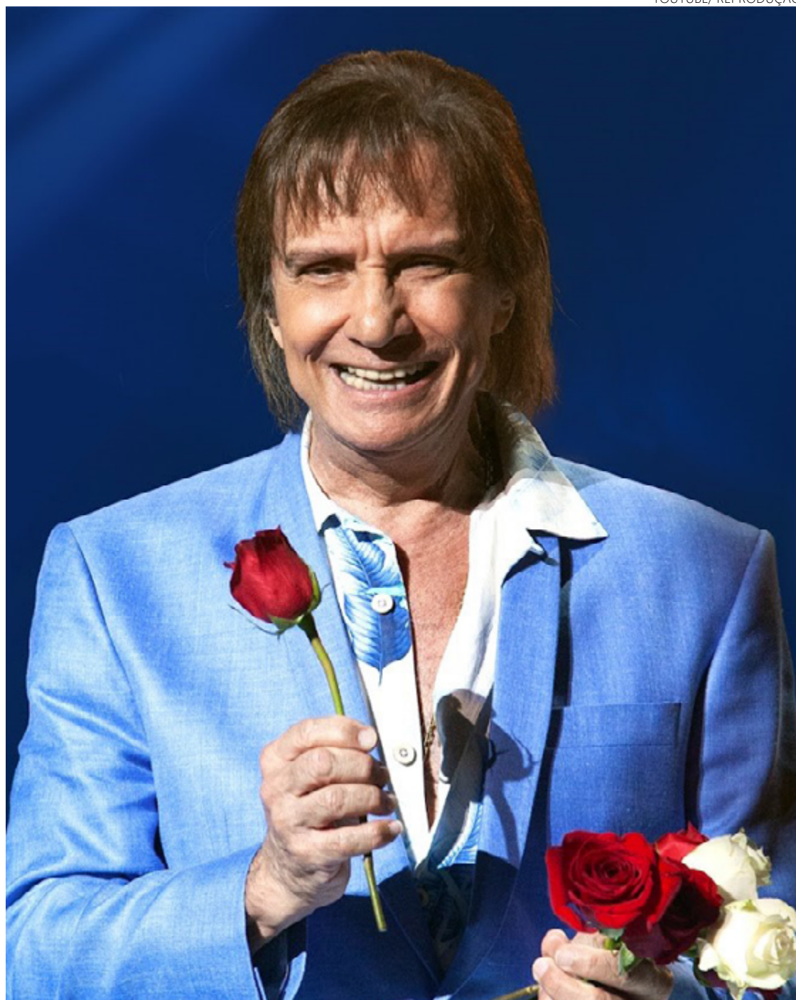
Roberto Carlos, cantor de vocação popular, gravou obra no inconsciente coletivo brasileiro