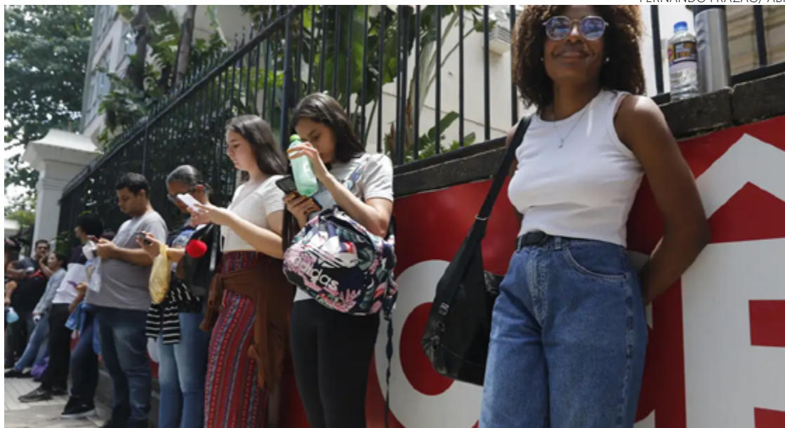
Jovens pensam em futuro estável ao escolherem vagas com salário de R$ 8 mil

Segundo especialistas e profissionais de RH consultados pela reportagem, o trainee acelera a carreira. Profissionais que passam pela experiência podem se tornar lideranças em pouco tempo, seja por uma condição do próprio treinamento ou pela rede de contatos