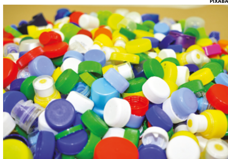
Esse é o 2º ciclo da Política Estadual de Logística Reversa executado pelo Estado; no 1º ciclo meta mínima foi de 22% e 25 mil empresas aderiram

Essa entidade vai informar para as cooperativas de reciclagem o volume de plástico,