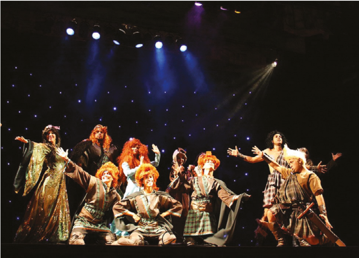
Organizadores da Mostra de Teatro entendem que acontece um avanço em torno do resgate da posição central que a cidade já teve nos anos pré e pós ditadura