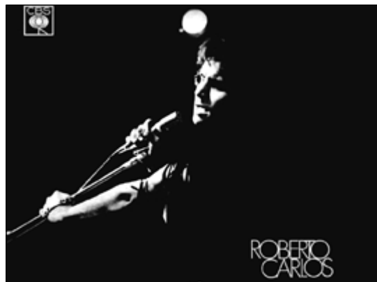
Disco de 1970 inicia fase adulta do artista

ra contribuição fonográfica do eterno parceiro à música de Roberto. Dançante à moda Beatles, trazia consigo potencial para convocação jovem — ricos, pobres, tímidos, extrovertidos, garotos, garotas, todos se identificavam com essa música.