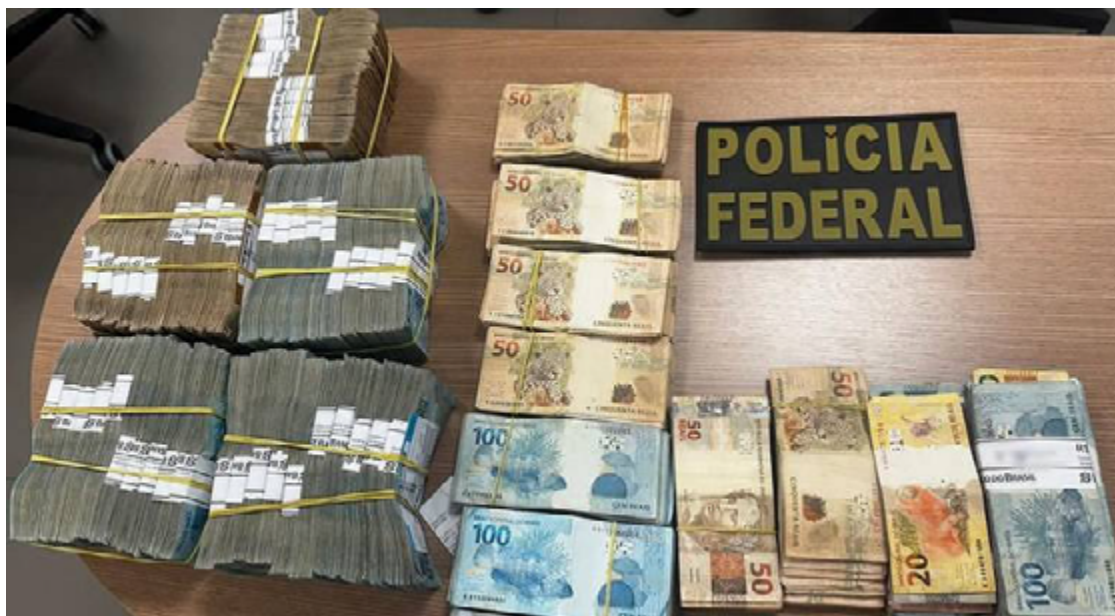
Caixa dois eleitoral consiste no uso de dinheiro pelos candidatos e partidos sem que haja declaração à Justiça Eleitoral

"Caros colegas, eu subo a esta tribuna para falar do show de horror que vimos nas eleições. Compra de voto, bandidagem. (...) É vergonhoso o uso de dinheiro público com essa bandidagem. É vergonhoso vermos pessoas que, além de venderem emenda parlamentar aqui, ali, nesta instituição e na outra, ainda vão cobrar a fatura", afirmou a deputada Adriana Ventura (Novo-SP), na