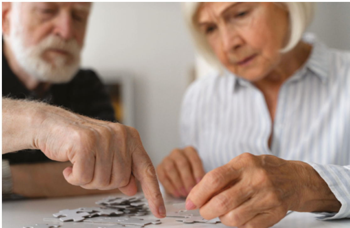
Nos casos de pacientes com estresse crônico e depressão, o risco pode ser potencializado em até quatro vezes