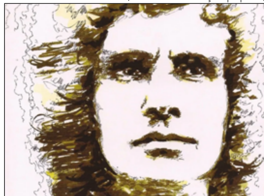
Álbum de 1971 consagrou reinado de cantor