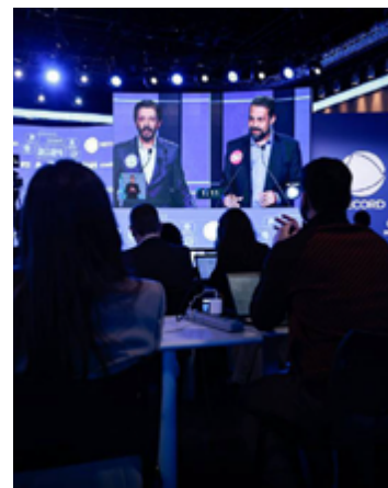
Ricardo Nunes e Guilherme Boulos: campanha com agressões e ataques

Nunes também citou reportagem do jornal Folha de S. Paulo que mostrou que Boulos foi acusado de envolvimento no episódio conhecido como a desocupação do Pinheirinho, em 2012, quando foi preso em flagrante e solto sob fiança de R$ 700. Ele ficou seis anos sem ser encontrado pela Justiça, e o processo prescreveu.