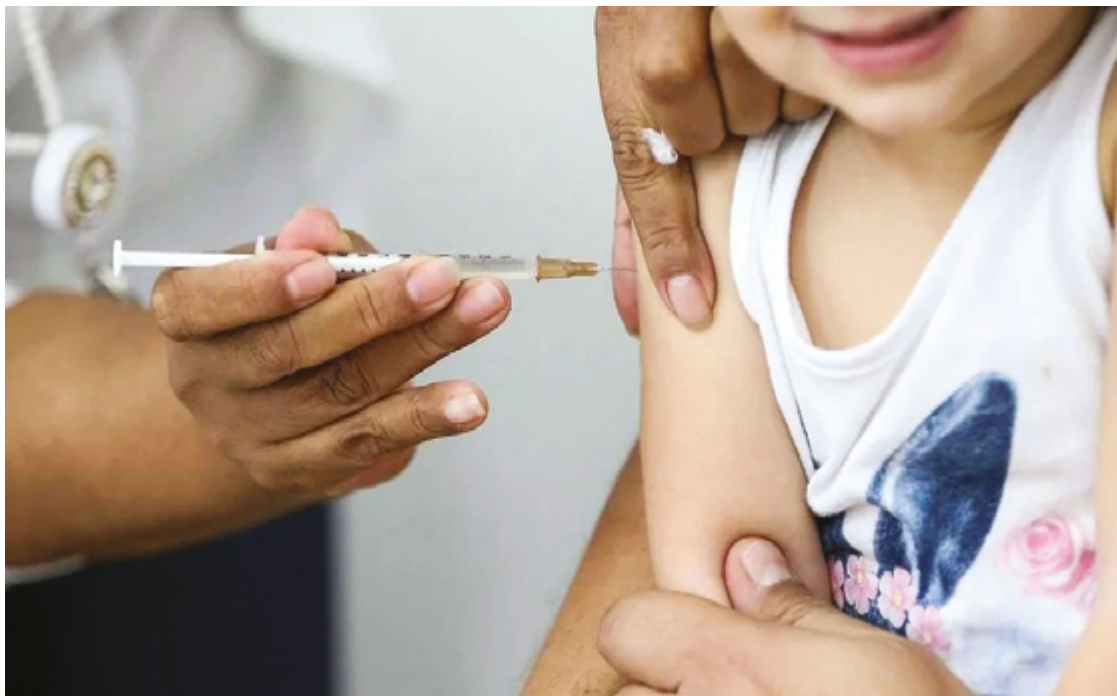
Casos em ambientes escolares fechados exigem prevenção, principalmente entre crianças, que estão entre os mais vulneráveis

"O maior problema não é a mudança de temperatura em si, mas a tendência de as pessoas se aglomerarem em locais pouco ventilados. Isso facilita a transmissão da gripe, especialmente entre crianças, que têm contato próximo nas salas