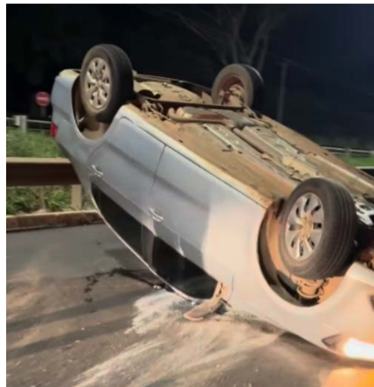
Acidente provocou grande movimentação no trecho da rodovia dos Romeiros

Conforme a Polícia Militar, a colisão ocorreu entre dois carros de passeio. Acidente aconteceu por volta das 3h30. Não existe confirmação sobre número de feridos