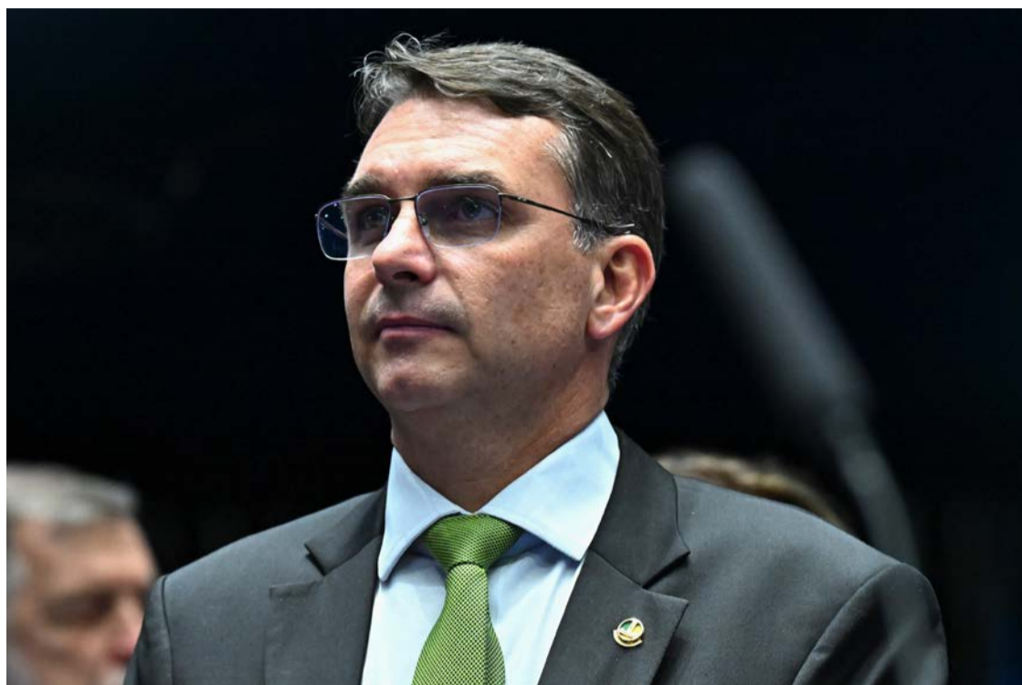
Flávio Bolsonaro, pré-candidato do PL à Presidência, já admite não contar com Michelle

Valdemar afirma que a situação é "difícil". "Vamos ter que trabalhar muito, precisamos da Michelle. Vamos à luta, não podemos perder ninguém, ainda mais a Michelle", diz o presidente do PL à reportagem, quando questionado sobre a ausência da ex-primeira-dama na