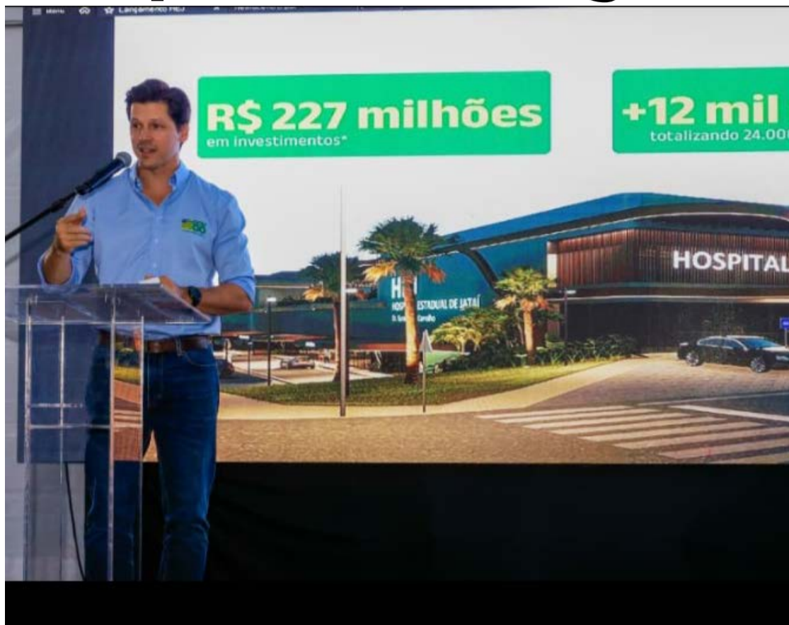
Ampliação do Hospital Estadual de Jataí elevará capacidade da unidade: atendimento de alta complexidade para 28 municípios da Região Sudoeste

Já em 2027 será iniciada a construção do novo bloco hospitalar, com entrega prevista para 2030. "Vamos ter vários hospitais de excelência e Jataí estará entre aqueles que terão o melhor desempenho e estrutura para receber as pessoas que precisarem dos ser-