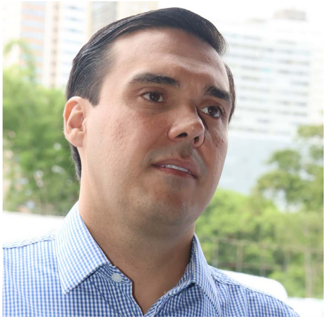
Presidente da AGM alerta sobre a importância das pautas em debate em Brasília

"Estamos em um dos momentos mais decisivos do ano, antes que as atividades do Congresso desacelerem para o recesso. É fundamental que os gestores goianos compa-