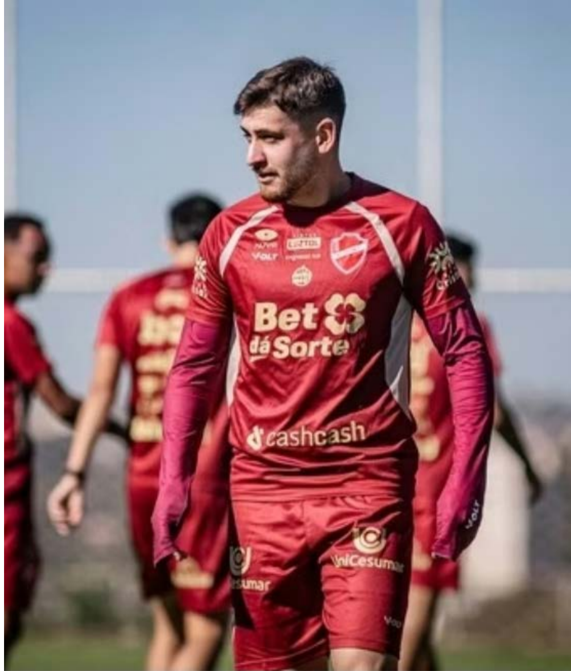
Elenco do Vila Nova durante preparação para o confronto diante do São Bernardo, pela Série B