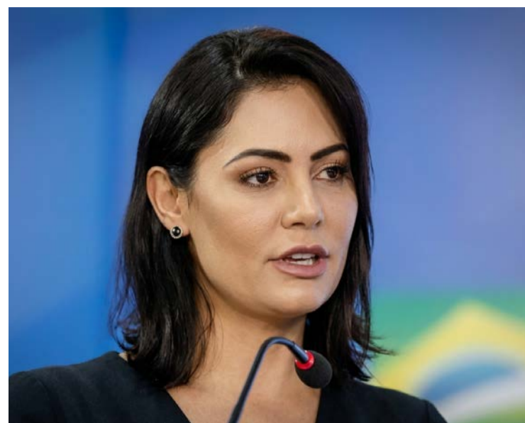
Michelle Bolsonaro elogia projeto de Lula sem citá-lo

Ex-primeira-dama classifica iniciativa como um "sonho realizado" que fortalece a comunidade