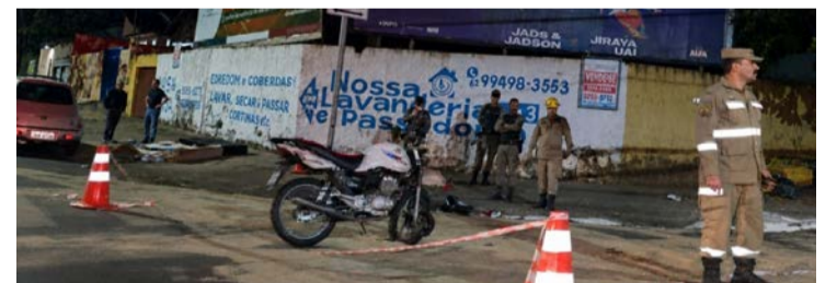
Local do acidente horas depois do ocorrido: avenida é limpa após colisão fatal