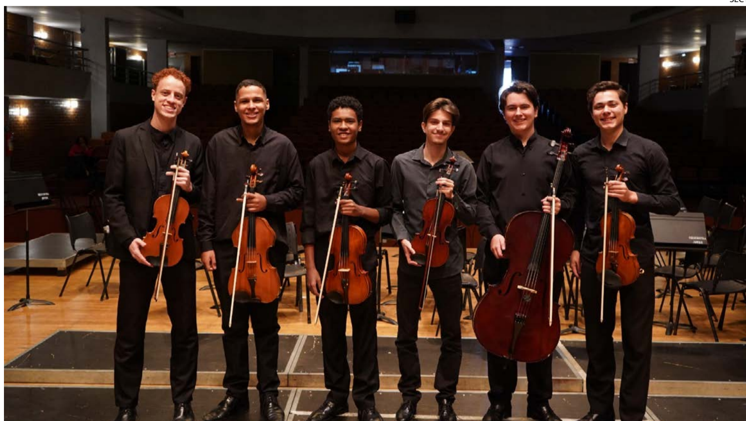
Seis músicos da Orquestra Sinfônica Jovem de Goiás são os únicos brasileiros a representar País em festival suíço

Estudantes do Basileu França são convidados para programação do Verbier Festival, realizado entre 16 julho e 2 de agosto. Evento é considerado um dos mais importantes da música clássica no mundo