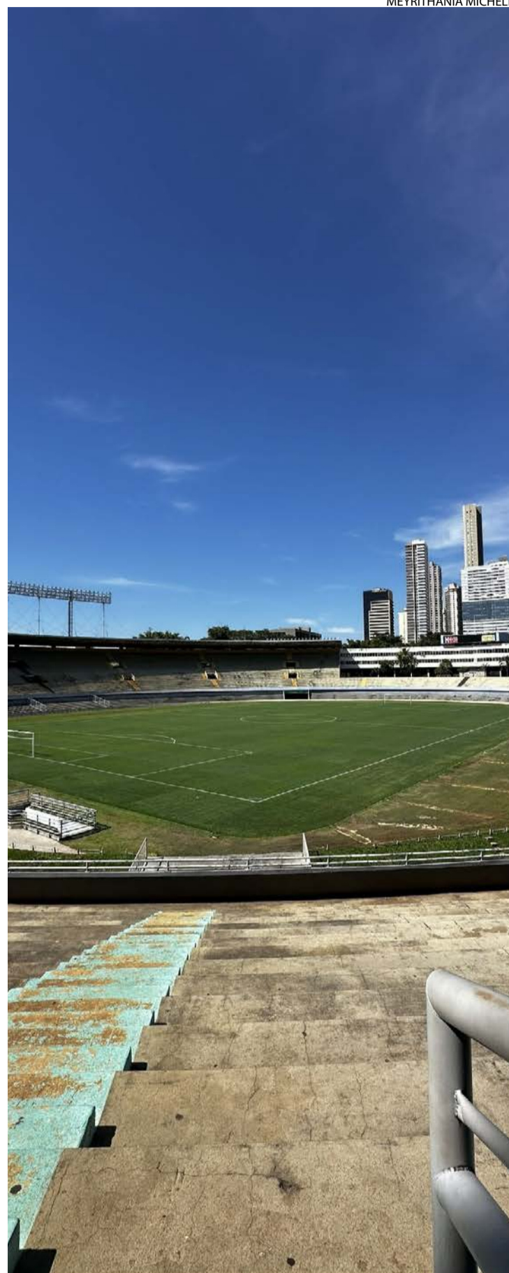
Reforma envolve reconfiguração completa do espaço

Com as intervenções, o Serra Dourada avança para deixar de ser apenas um estádio e assumir o papel de um complexo completo, alinhado às novas demandas do público.