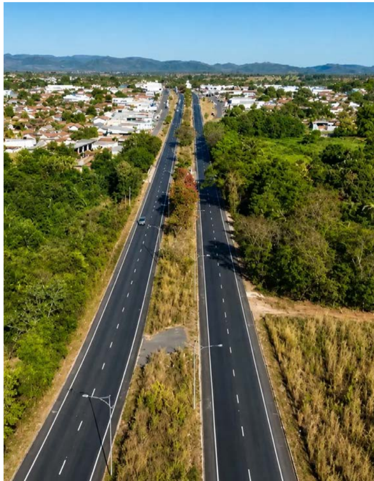
Trechos das rodovias GO-070 e GO-118 somam 326,13 quilômetros e coincidem com as federais BR-070 e BR-010

A operação teve como objetivo preparar a população e as instituições para atuação coordenada em uma situação hipotética de rom-