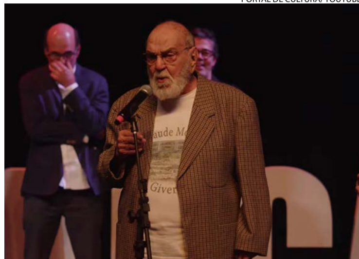
Artista relembra episódio da juventude em evento