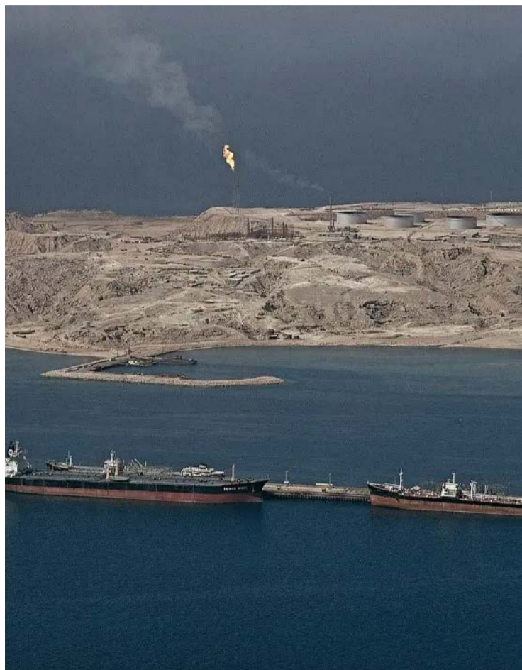
Cerca de 20% do transporte mundial de petróleo passa pelo estreito

Anúncio de liberação para navegação "segura" faz cair preço do petróleo em cerca de 11%