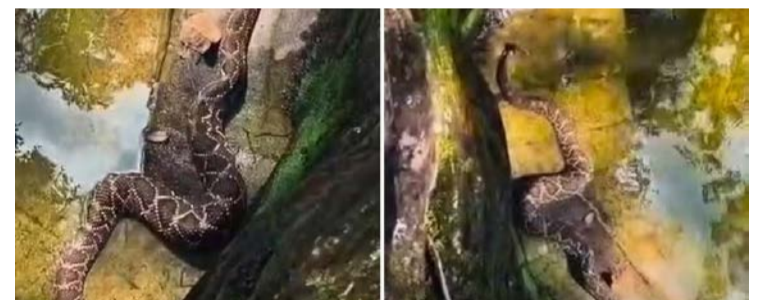
Registro chamou a atenção por mostrar a cobra em trilha por onde passam turistas