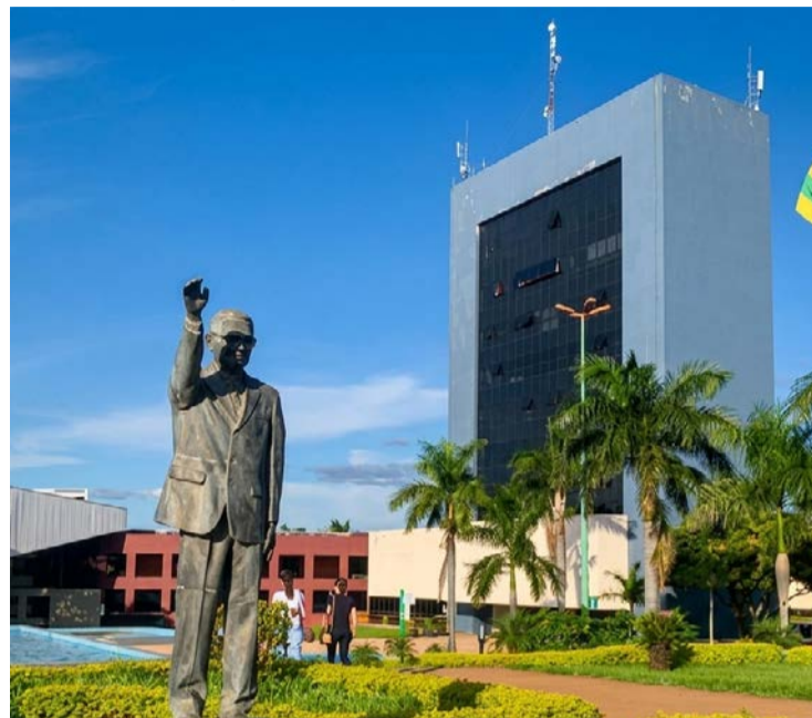
Entrada da Prefeitura de Goiânia: reajuste salarial para conselheiros tutelares

Com a aprovação, remuneração mensal dos conselheiros passa a ser fixada em R$ 7,3 mil