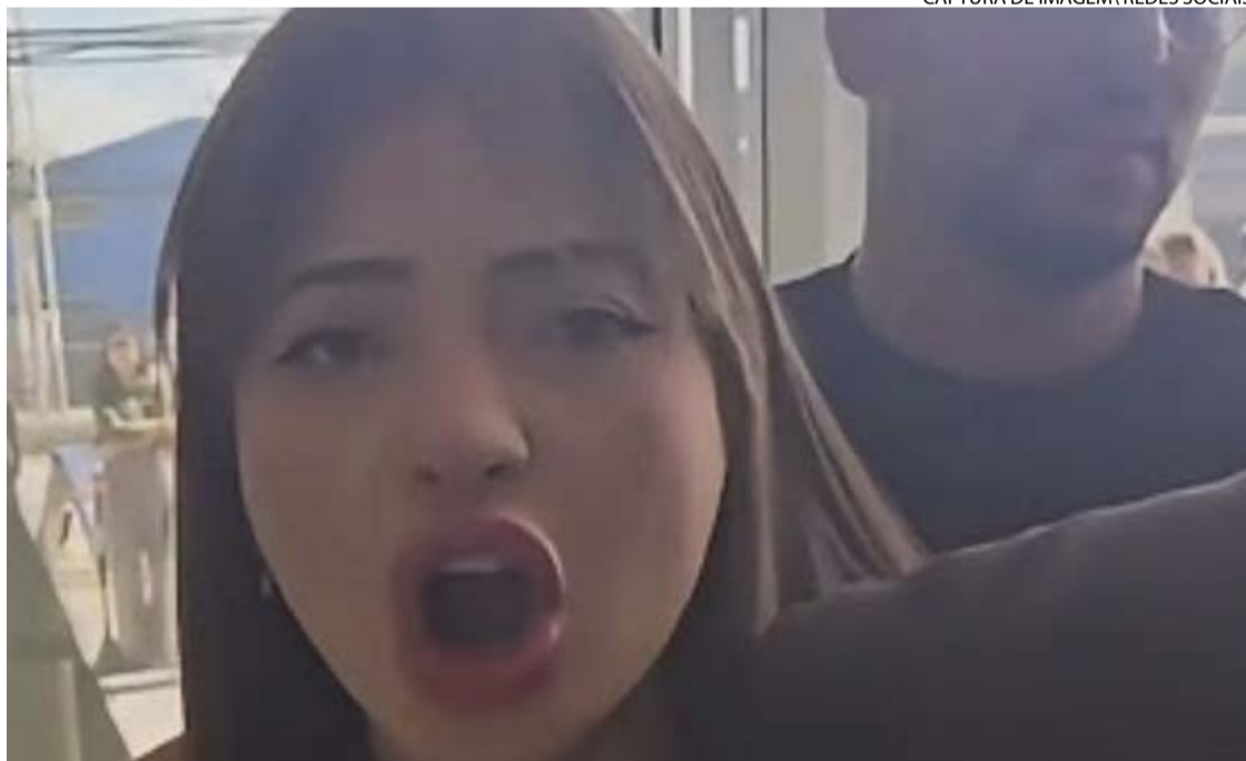
Caso aconteceu em um salão de beleza em São Paulo: violência parecia 'meme'