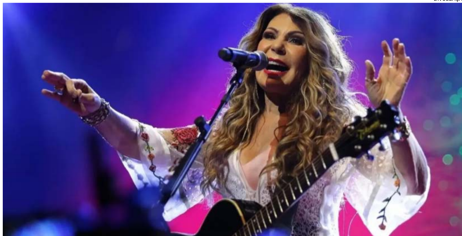
Elba Ramalho: artista paraibana traz para evento goianiense musicalidade que encanta Brasil há décadas

Cantora Elba Ramalho sobe amanhã ao palco do evento, às 21h. Na área gastronômica, projeto Mesa ao Vivo concentra atividades de sábado (9) e domingo (10), com aulas-show e degustações