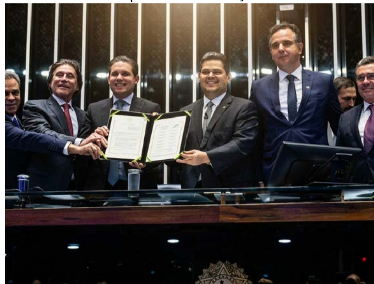
Autoridades durante promulgação de PEC sobre tribunais de contas

Medida também impede que sejam criados novos tribunais: marco para a fiscalização das contas