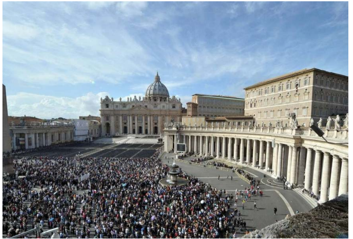
Relatório foi produzido a partir de testemunhos: narrativas de cicatrizes profundas de fiéis comoveram parte do Vaticano

O homem relata ainda a experiência de seu marido, que teria enfrentado resistência familiar baseada em interpretações religiosas.