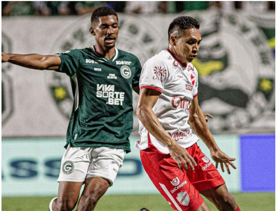
Clássico entre Goiás e Vila marcado para sábado (9), na Serrinha ganha contornos decisivos para o Verdão na Série B