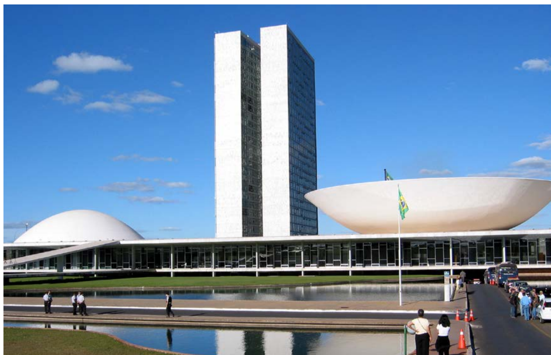
Congresso Nacional em Brasília: Lula veta emendas e parlamentares evitam crise

Congressistas apontam que, para uma eventual reação, pesa mais a postura do presidente do Senado, Davi Alcolumbre (União Brasil-AP). Ele, que preside o Congresso, também está em reaproximação com