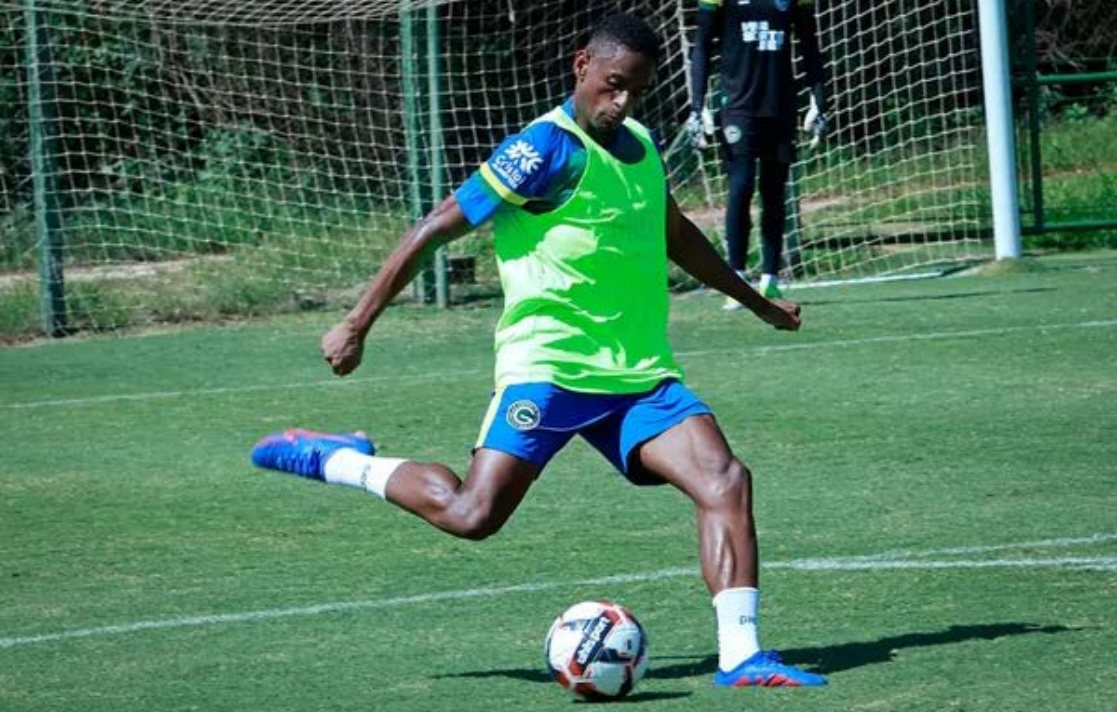
Jajá esteve em negociação com o Remo, do Pará, mas a transferência não avançou

Ao longo da semana, todos os atletas participaram de atividades na academia