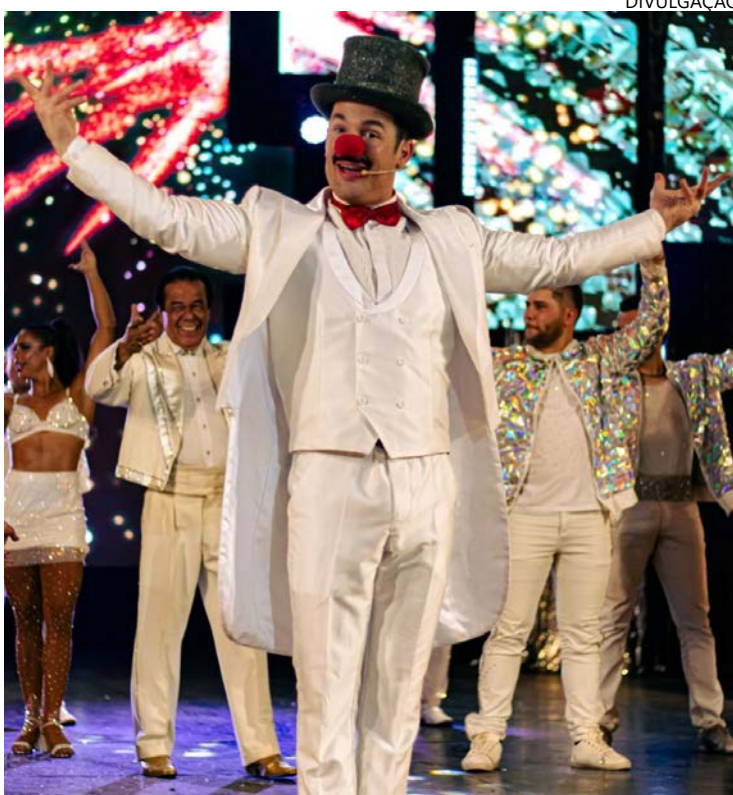
Expressividade corporal de Diego Hypólito em cena

A proposta vai além do circo tradicional ao combinar acrobacias, palhaçaria, dança, música ao vivo e tecnologia audiovisual. Em cena, a irreverência de Dedé Santana se encontra com a força e a expressividade corporal de Diego Hypólito, conduzindo o público por uma narrativa lúdica que celebra a superação humana e o poder do imaginário, com inspiração nos grandes musicais