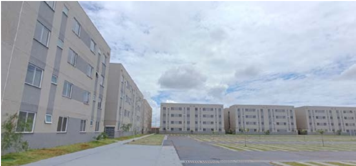
Iniciativa segue o modelo das Casas a Custo Zero