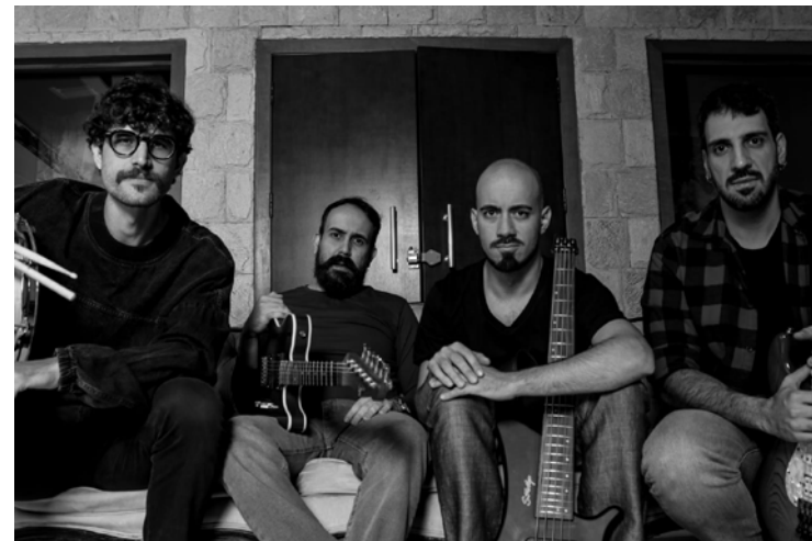
Instrumentistas expressam força criativa de gêneros