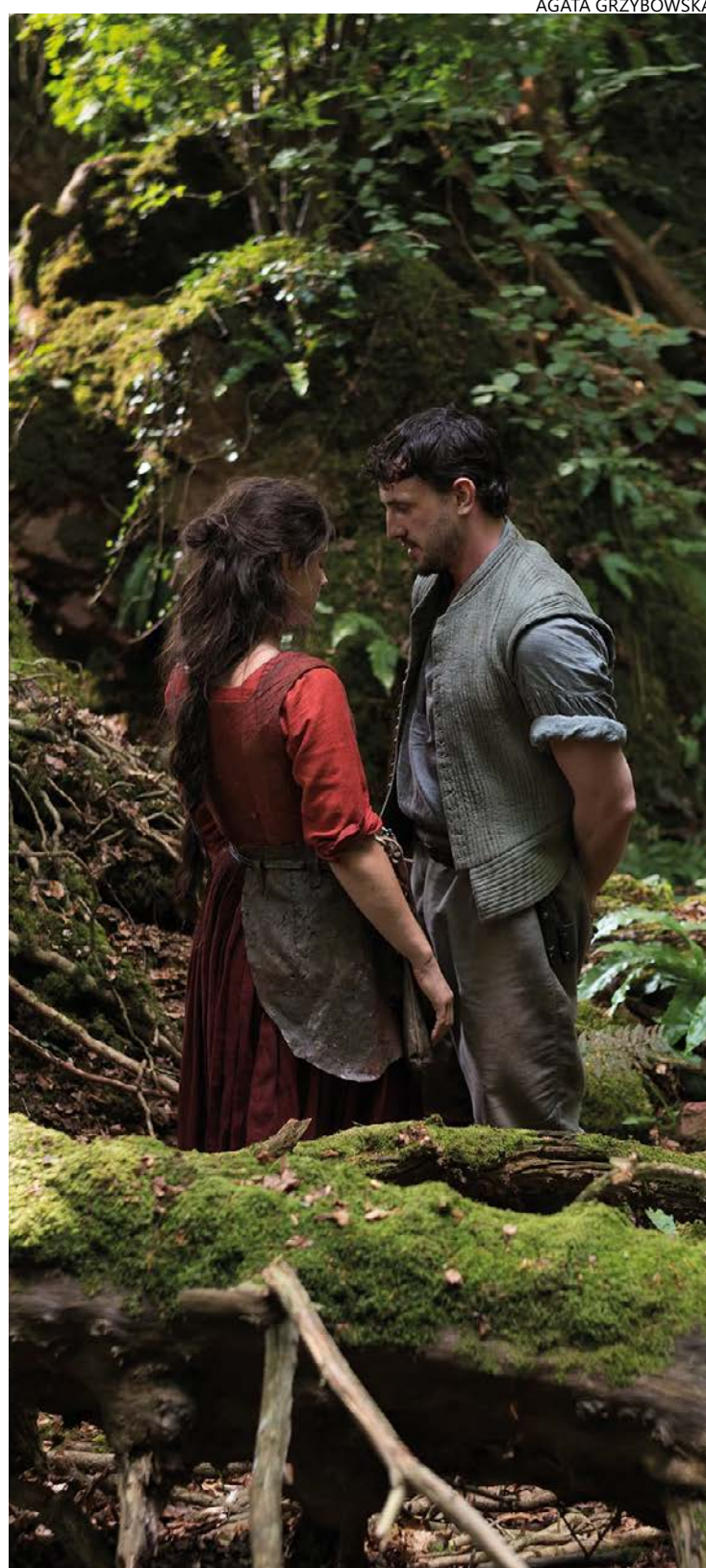
William Shakespeare, em crise com a amada mulher, deu ao mundo nada menos do que o clássico "Hamlet"

As coisas seguem assim, sem grandes lances, e o filme avança para se tornar até desinteressante. Mas Shakespeare ressurgue para salvar a situação, como sempre. Sua angústia com a profissão e a vida o projeta no célebre "ser ou não ser", remetendo, no caso, a tudo que um homem deve renunciar para poder seguir seu caminho.