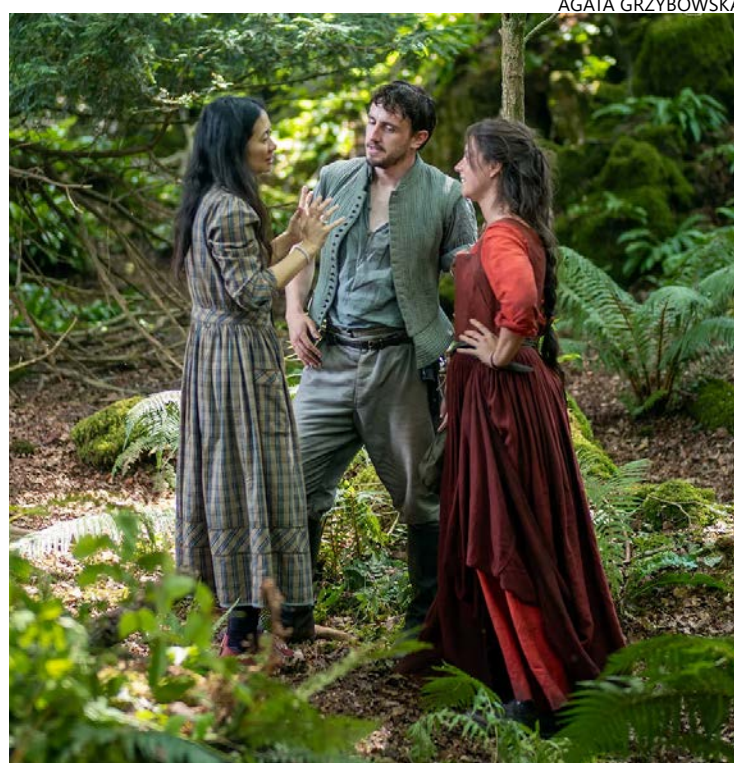
Cineasta (à esquerda) orienta atores no set de filmagem

"Hamnet", então, faz chorar ao mesmo tempo em que transfere para si o prestígio de Shakespeare. E Shakespeare é uma garantia —já deu o Oscar a "Shakespeare Apaixonado", para não ir longe. Como a atriz do filme é muito boa e Paul Mescal não destoa, o círculo dos grandes prêmios nos Estados Unidos se fecha. E Chloé Zhao, que ganhou seu primeiro Oscar com "Nomadland", há cinco anos, pode muito bem emplacar outro. (Folhapress)