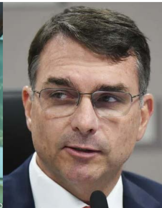
Senador Flávio Bolsonaro (PL)

jor Vitor Hugo, e do prefeito de Jataí, Geneilton Assis e de prefeitos.