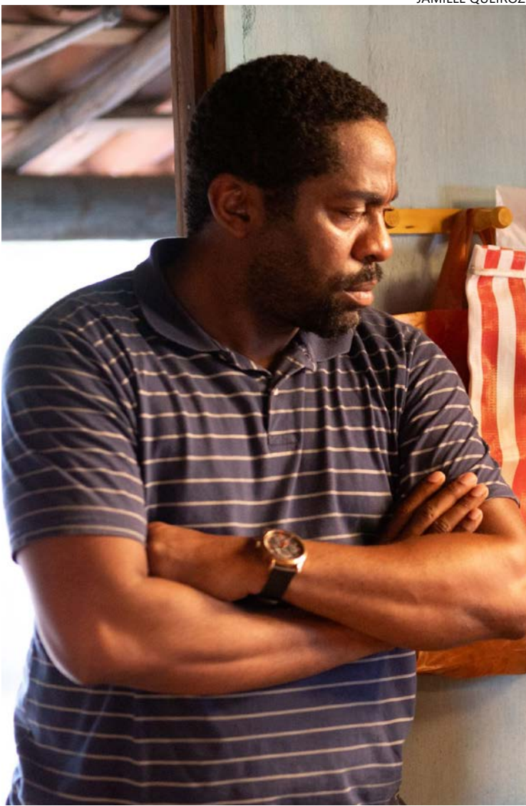
Lázaro Ramos estrela em longa-metragem brasileiro