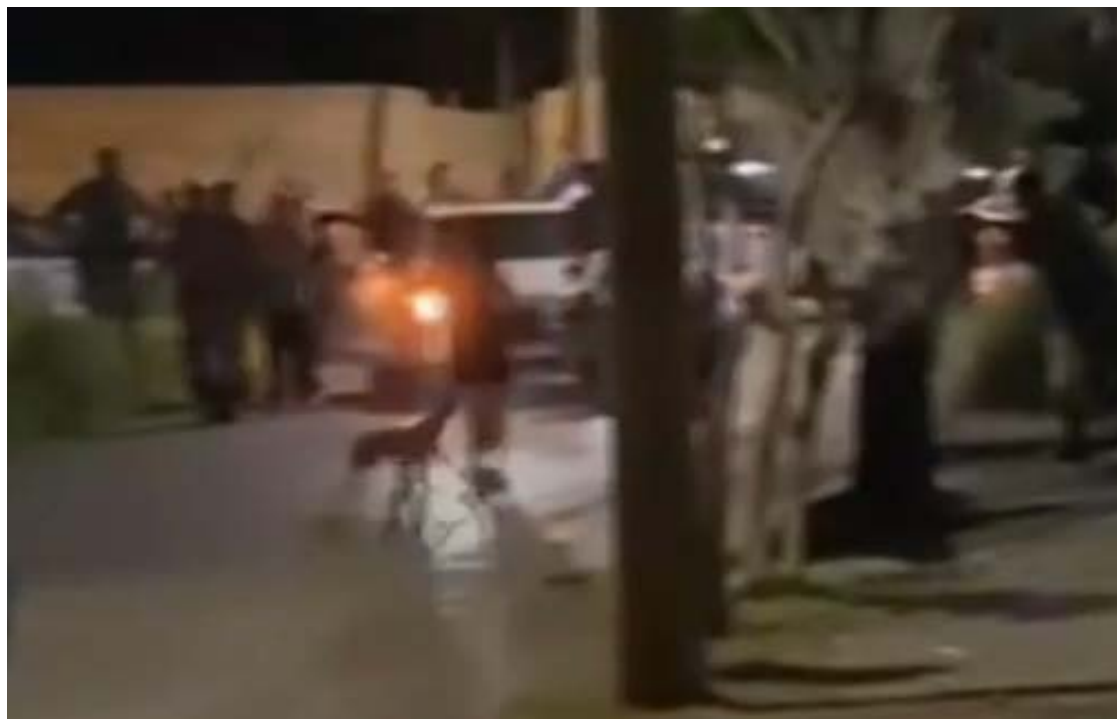
Cadelinha Mel identifica o agressor e parte para cima: vira-lata costuma ser mais leal aos donos, como, de fato, ocorreu em Senador Canedo

É justamente nessas raças que se observa, mui-