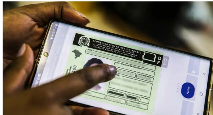
Medida beneficia motoristas sem infrações registradas nos últimos 12 meses

Publicação de medida provisória alterou as regras para a renovação automática da CNH