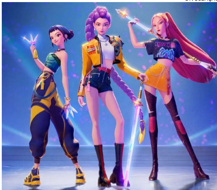
Peça musical leva aos palcos filme da Netflix

madadas, canções, humor e momentos de emoção, o espetáculo aposta em uma linguagem dinâmica e acessível às crianças, dialogando com o universo do K-pop que conquistou jovens e famílias nos últimos anos. A montagem teatral busca transportar para o palco a estética vibrante e a energia