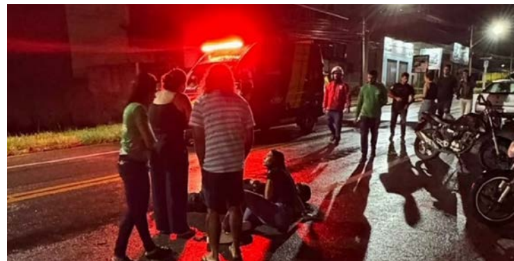
Carro em sentido contrário colidiu com uma motocicleta