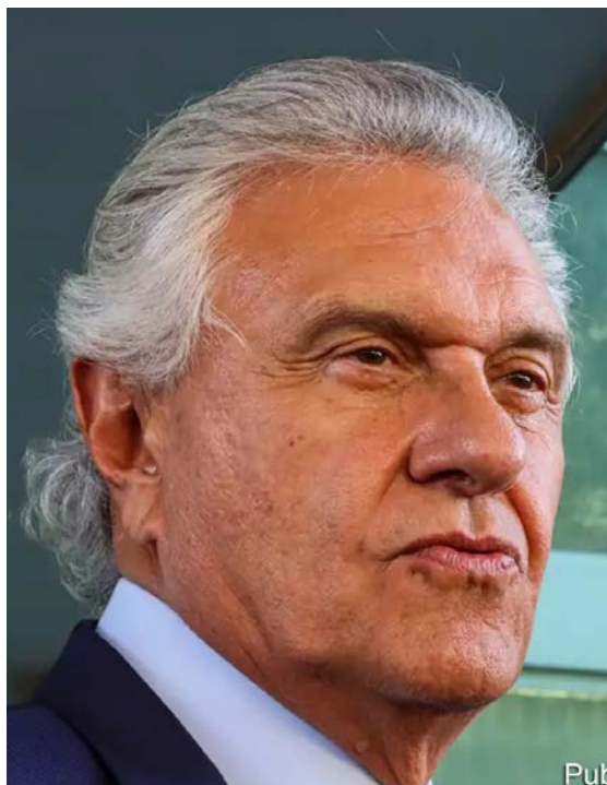
Governador Ronaldo Caiado (UB)