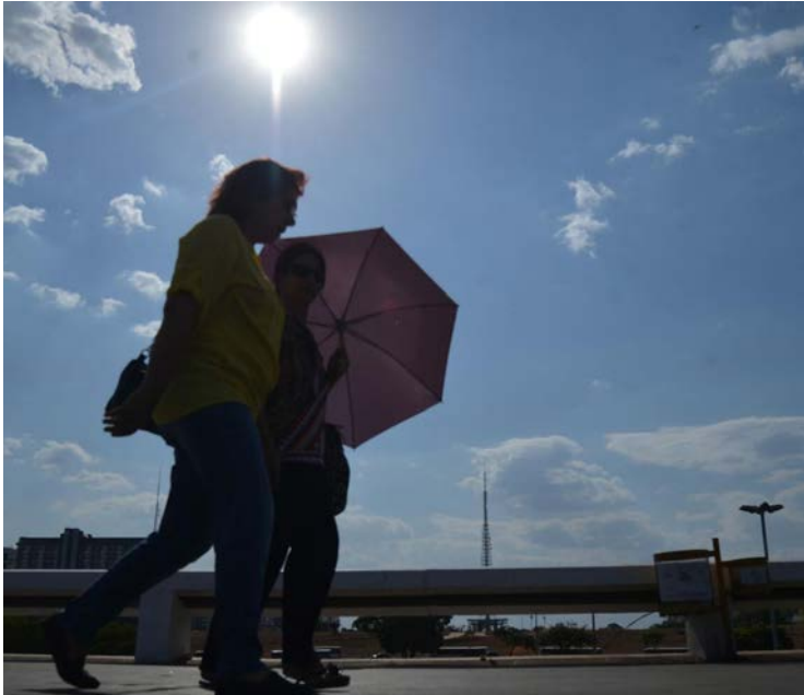
2025 foi o terceiro ano mais quente da história, segundo pesquisadores