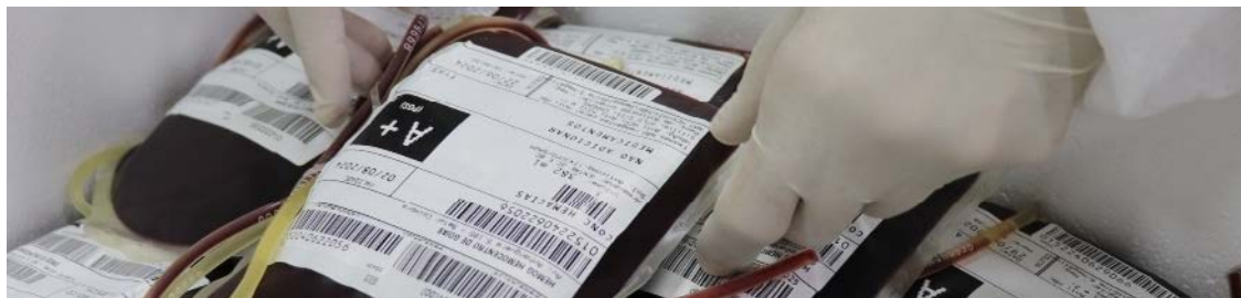
Bolsas de concentrado de hemácias preparadas pela Rede Hemo de Goiás para distribuição