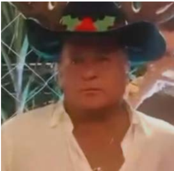
Cantor usou um chapéu temático de rena

O momento descontraído, registrado em vídeo, mostra a leveza e o bom humor entre os familiares durante as festividades de fim de ano.