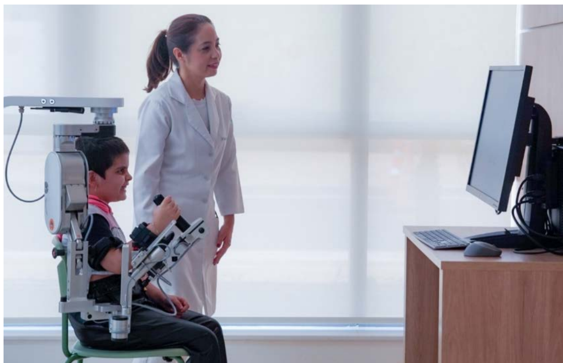
Tratamento oncológico pediátrico de alta complexidade utiliza diversas tecnologias

Entre os equipamentos utilizados estão o Lokomat e o Andago, voltados ao treino da marcha com segurança e suporte de peso, além do Armeo Power, Armeo Spring e do C-Mill, que auxiliam na recuperação dos membros superiores, do equilíbrio e da coordenação. A tecnologia permite exercícios personalizados, com