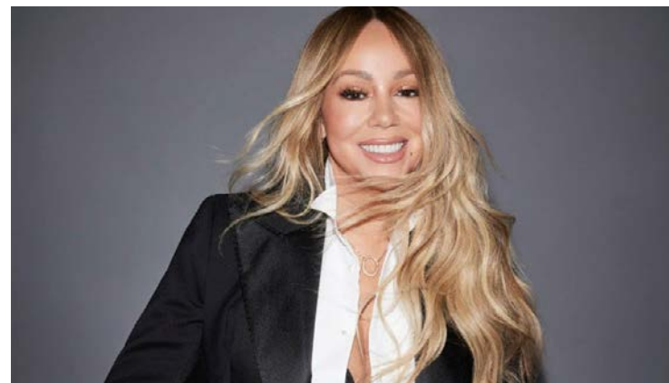
Mariah Carey ganhou a ação e pode receber US$ 92 milhões

Compositores acusaram cantora de fazer clássico natalino a partir de cópia de canção