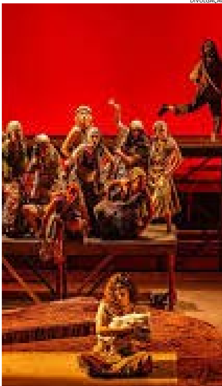
Espírito de renovação está presente em "Morte e Vida", com 25 atores e quatro músicos em cena

Os grupos de teatro, de uma maneira geral, são muito fechados, muito autôfagos.