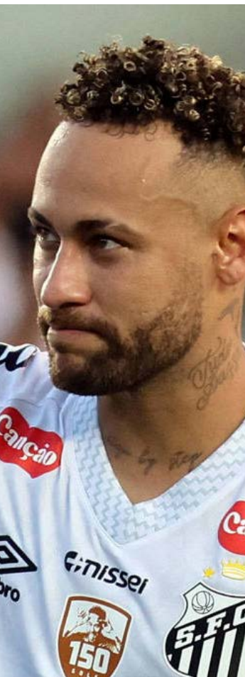
Neymar espera participar da Copa do Mundo de 2026

O camisa 10 santista, que tem como objetivo disputar a Copa do Mundo de 2026, ainda não foi convocado pelo técnico italiano Carlo Ancelotti que assumiu a seleção em junho.