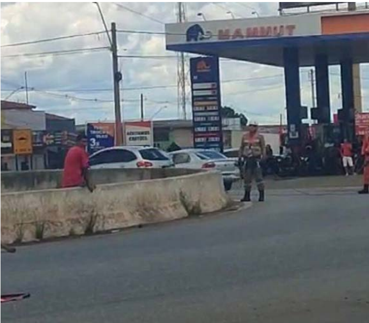
Após a abordagem, vítima foi encaminhada para uma unidade de saúde

A presença de equipes especializadas permitiu a estabilização da situação. Após o resgate, o homem recebeu os primeiros atendimentos psicológico e médico no local, conforme protocolo padrão para este tipo de ocorrência.