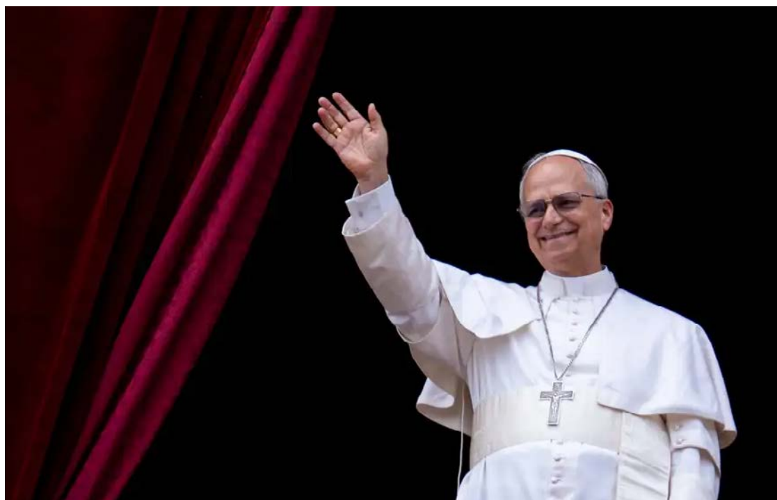
Papa ressaltou a importância de superar divisões ideológicas e partidárias, promovendo inclusão

Durante a homilia natalina, Leão 14 ampliou sua reflexão para os conflitos ao redor do mundo.