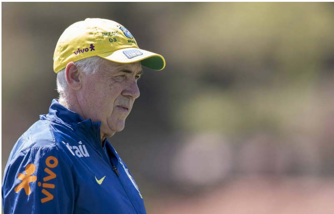
Carlo Ancelotti: influente em quatro línguas e agora aprende o português

"O fato de ele dominar diferentes idiomas é, ao mesmo tempo, um facilitador e um ônus, porque causa a mistura e a utilização, na maioria dos ca-