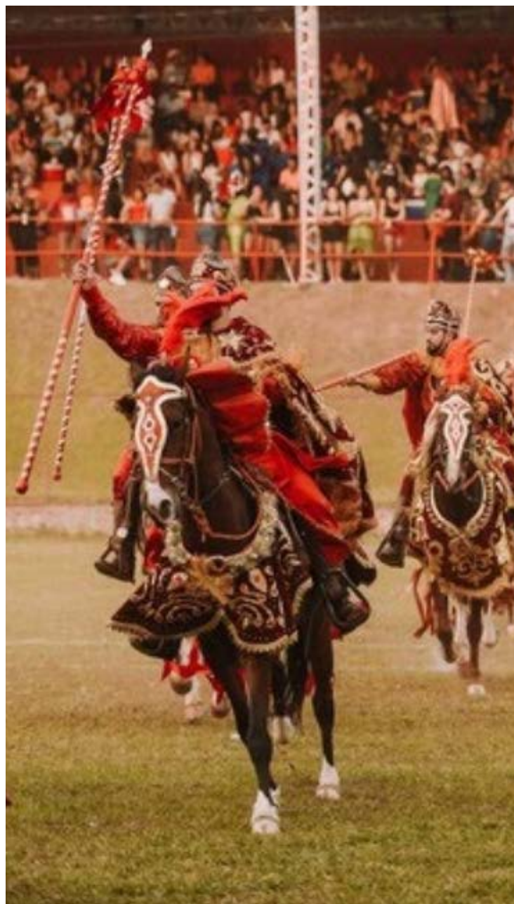
Cavalcadas na cidade de Goiás: apoio institucional tornou evento mais presente nos municípios

Com toda certeza, 2025 foi o ano das cavalcadas - manifestação cultural goiana que acontece em vários municípios. Pirenópolis, Hidrolina, Palmeiras de Goiás e Corumbá de Goiás sediaram três dias de celebrações. Segundo o Governo de Goiás, o investimento para as Cavalcadas no ano que está se encerrando chegou a R$ 4 milhões.