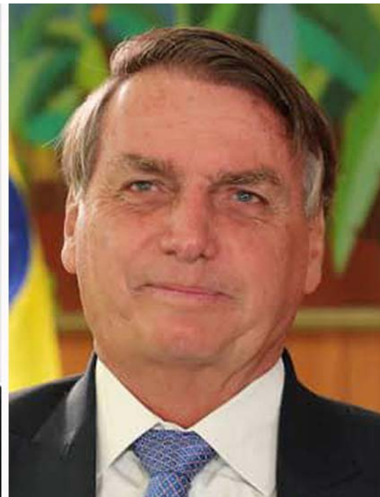
Lula e Bolsonaro seguem polarizando a política no Brasil

tos sobre o conceito de direita e esquerda podem ajudar a explicar a incoerência. Na academia, um dos critérios mais adotados para a distinção é a opinião sobre o grau de intervenção do Estado na economia, ele seria maior quanto mais à esquerda, e menor quanto mais à direita.