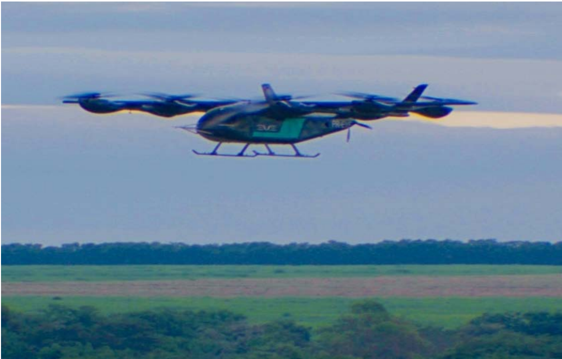
Protótipo do eVTOL da Eve, subsidiária da Embraer, durante testes em Gavião Peixoto (SP): empresa planeja colocar a aeronave em operação comercial em 2027

turo, a Eve trabalha em conjunto com a Anac, a FAA e a agência europeia EASA para criar regras inéditas para esse tipo de aeronave. A certificação, considerada o maior desafio técnico e regulatório, é tratada como prioridade máxima e vista