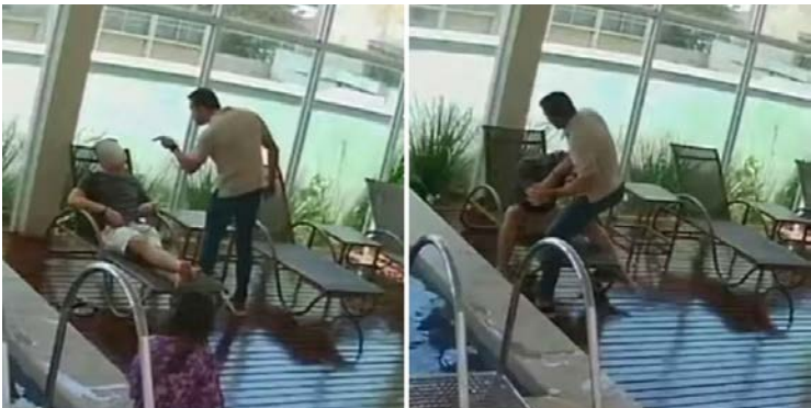
Agressão foi registrada por câmera de segurança