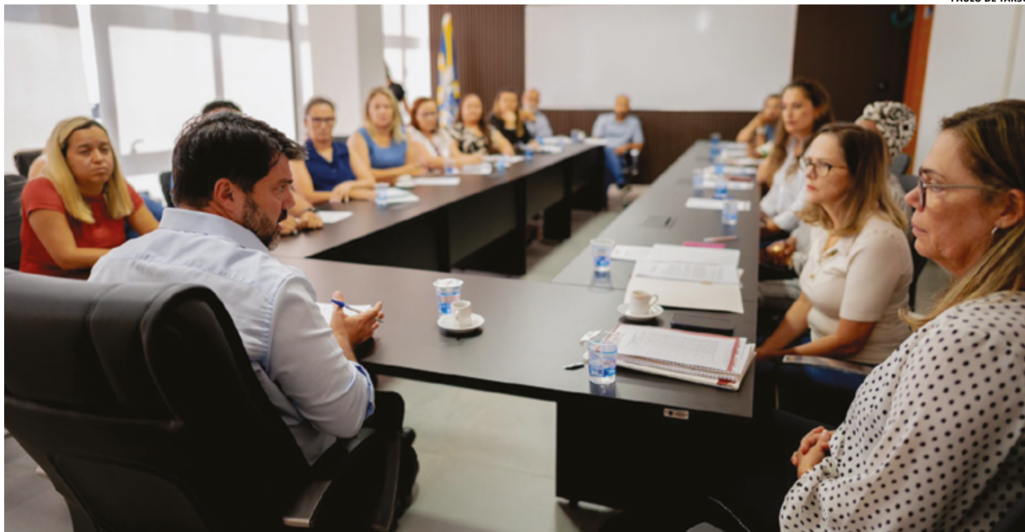
PAULO DE TARSO