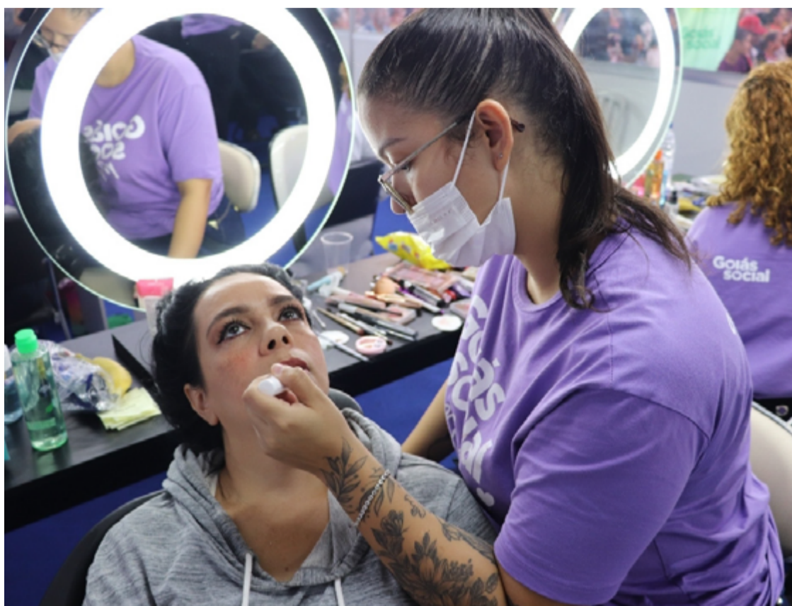
Capital terá cursos de serviços de beleza: maquiagem artística e penteados criativos

As aulas começam com a formação de turmas, que ocorre a cada 30 inscritos. Em Goiânia, serão realizados cursos de costura criativa: roupas e adereços de Carnaval e serviços de beleza: maquiagem artística e penteados criativos. As cidades participantes oferecem cursos variados, como confecção de fantasias infantis (Goianésia, Alexânia, Uruana, entre outras), customização e reciclagem de roupas carnavalescas (Cidade de Goiás e Catalão) e serviços de beleza (maquiagem e penteados em quase todos os municípios).