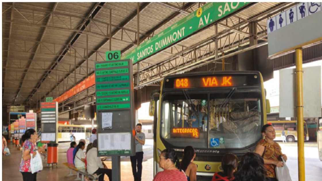
Motoristas do transporte coletivo expressam incômodo cada vez maior por falta de negociação

Em dezembro de 2024, o Tribunal Regional do Trabalho (TRT) interveio, suspendendo uma greve planejada pela categoria e determinando um reajuste de 3,34% a partir daquele mês. No entanto, Rodrigues res-