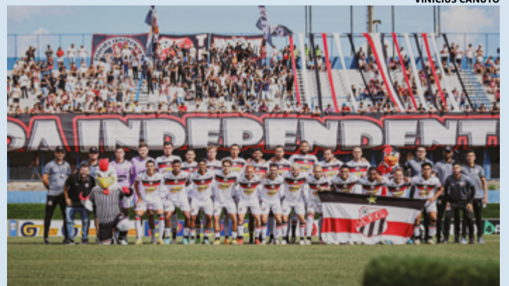
Galo da Comarca terá seu terceiro jogo em casa no Campeonato Goiano hoje à noite