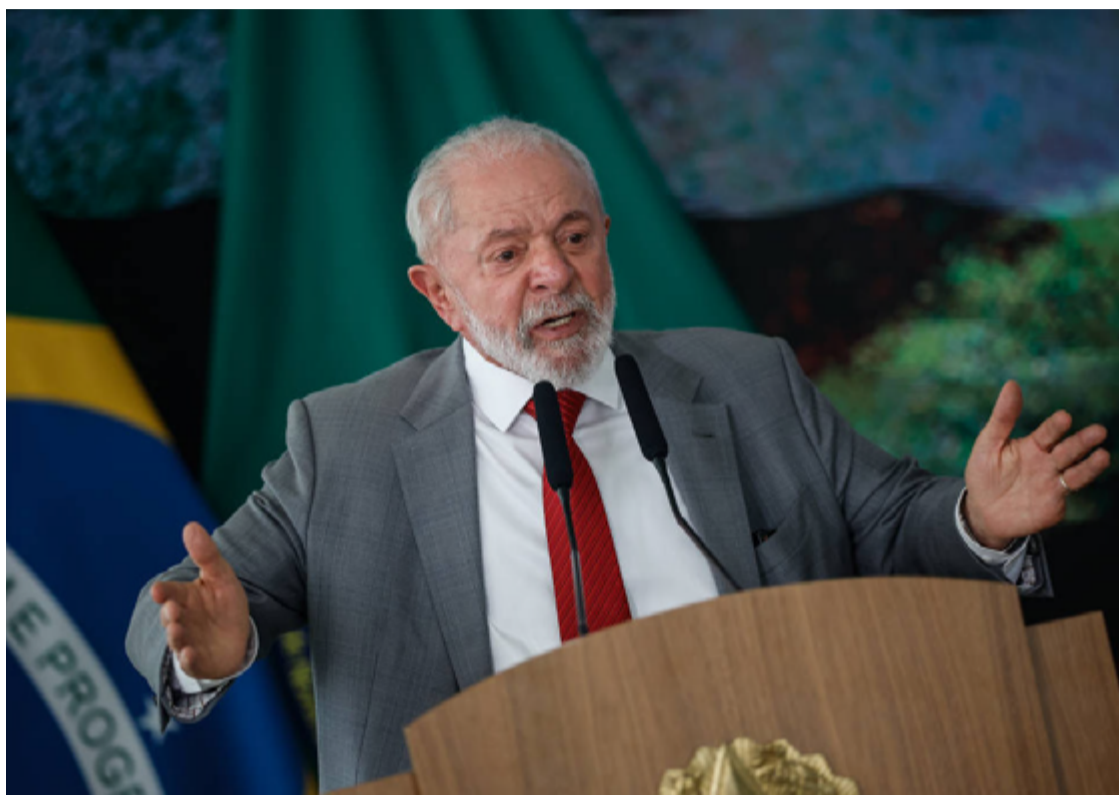
Lula da Silva: preocupação com os rumos do governo e o cenário eleitoral de 2026

"O governo precisa fazer disputa política diuturnamente, assim como [Jair] Bolsonaro fez todos os dias de seu governo, e por isso quase foi reeleito. Se a cada vez que apresentar uma proposta e