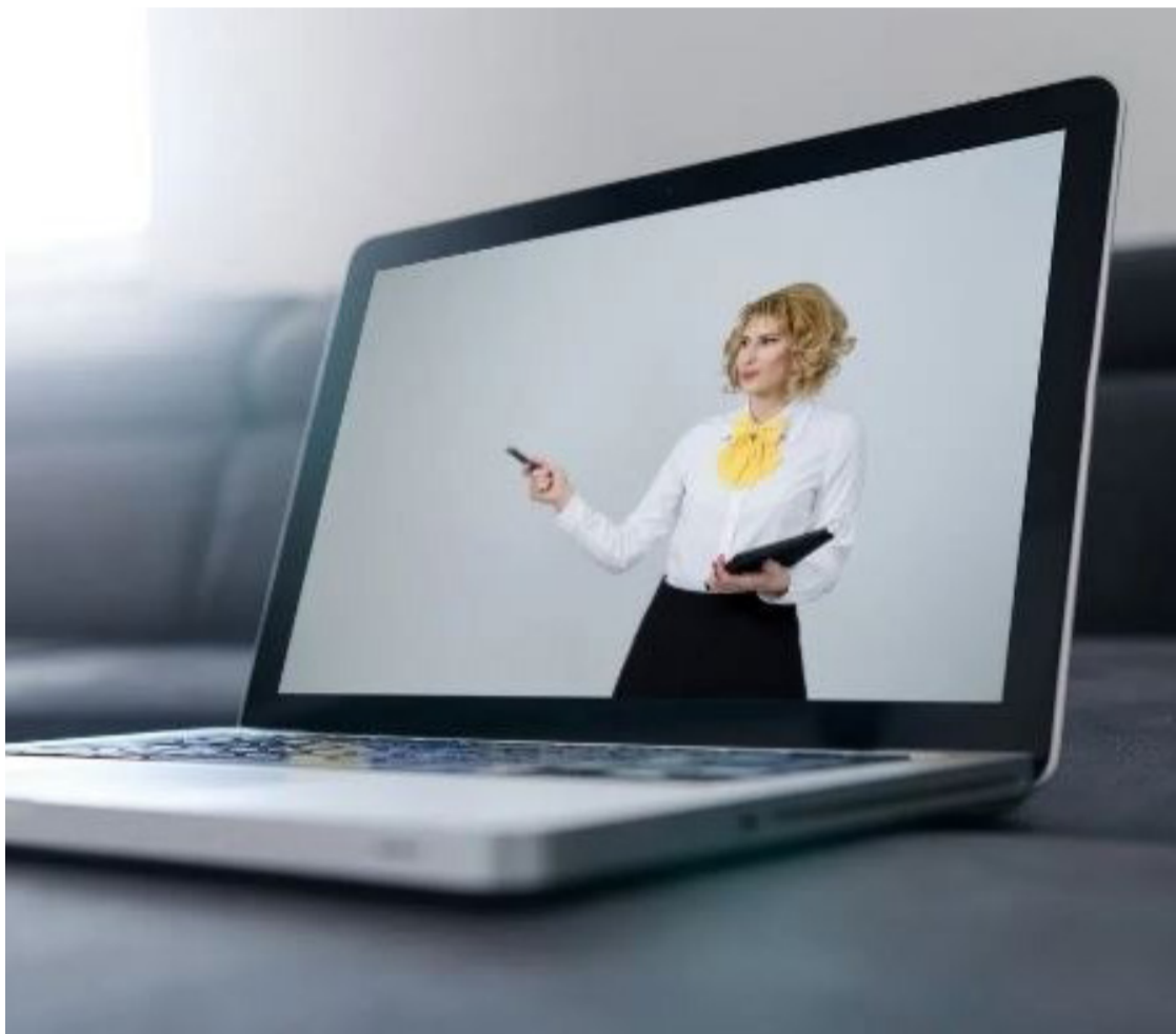
Novos tempos: tecnologia nem sempre produz interação respeitosa

Na era digital, em que escritórios se movem para a nuvem e reuniões ocorrem na tela, assunto ganhou nuances além do aperto de mãos