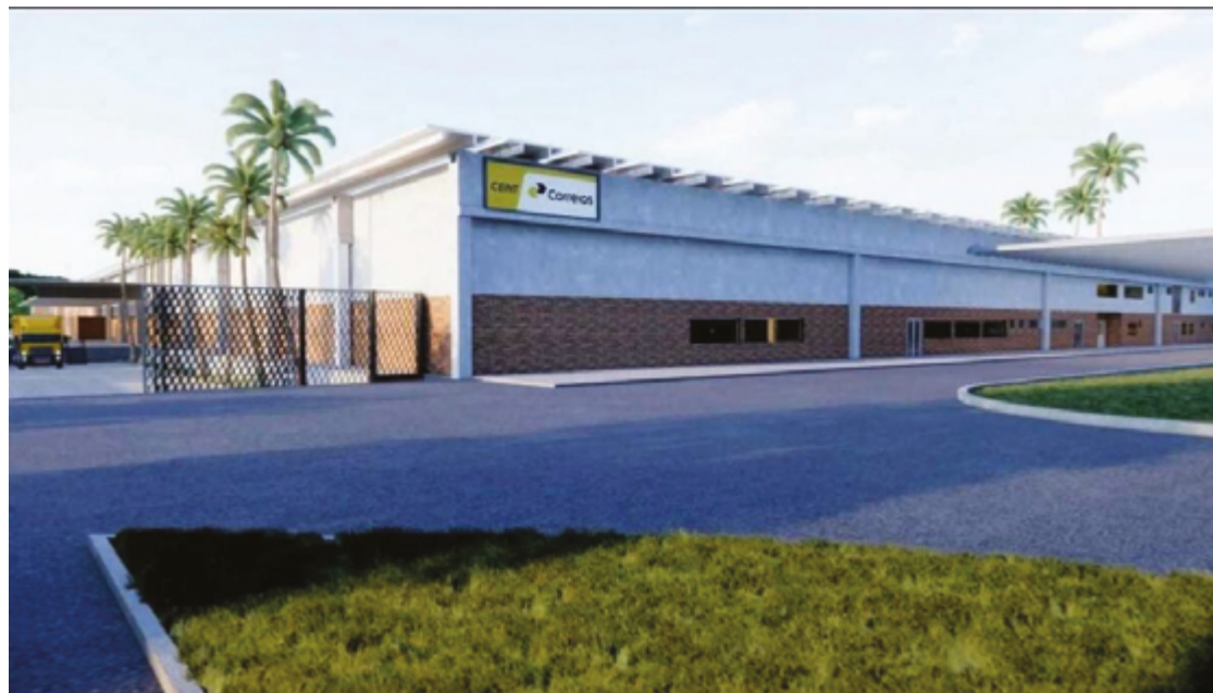
Maquete eletrônica do Centro de Distribuição Internacional dos Correios, que seria instalado em Anápolis

A decisão de fechar a unidade do Daia foi baseada em uma