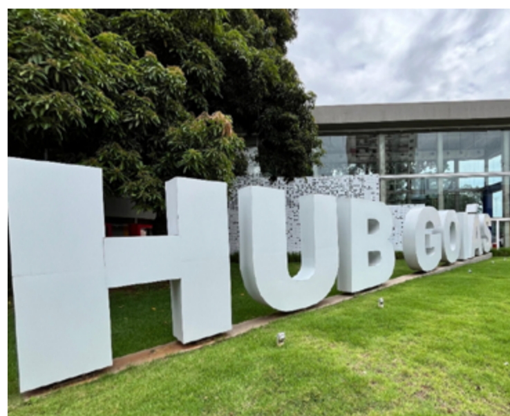
Hub Goiás, no setor Universitário: edital aberto para startups e empresas de todo país