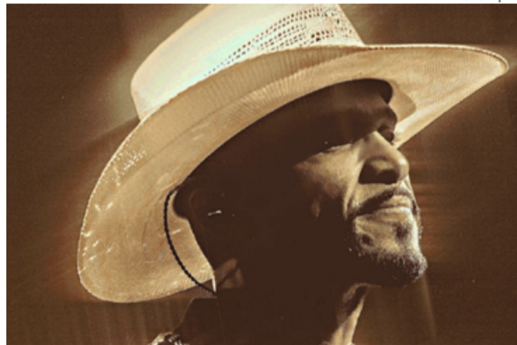
Atento: cantor diz que sempre se interessou pelos 'modões'