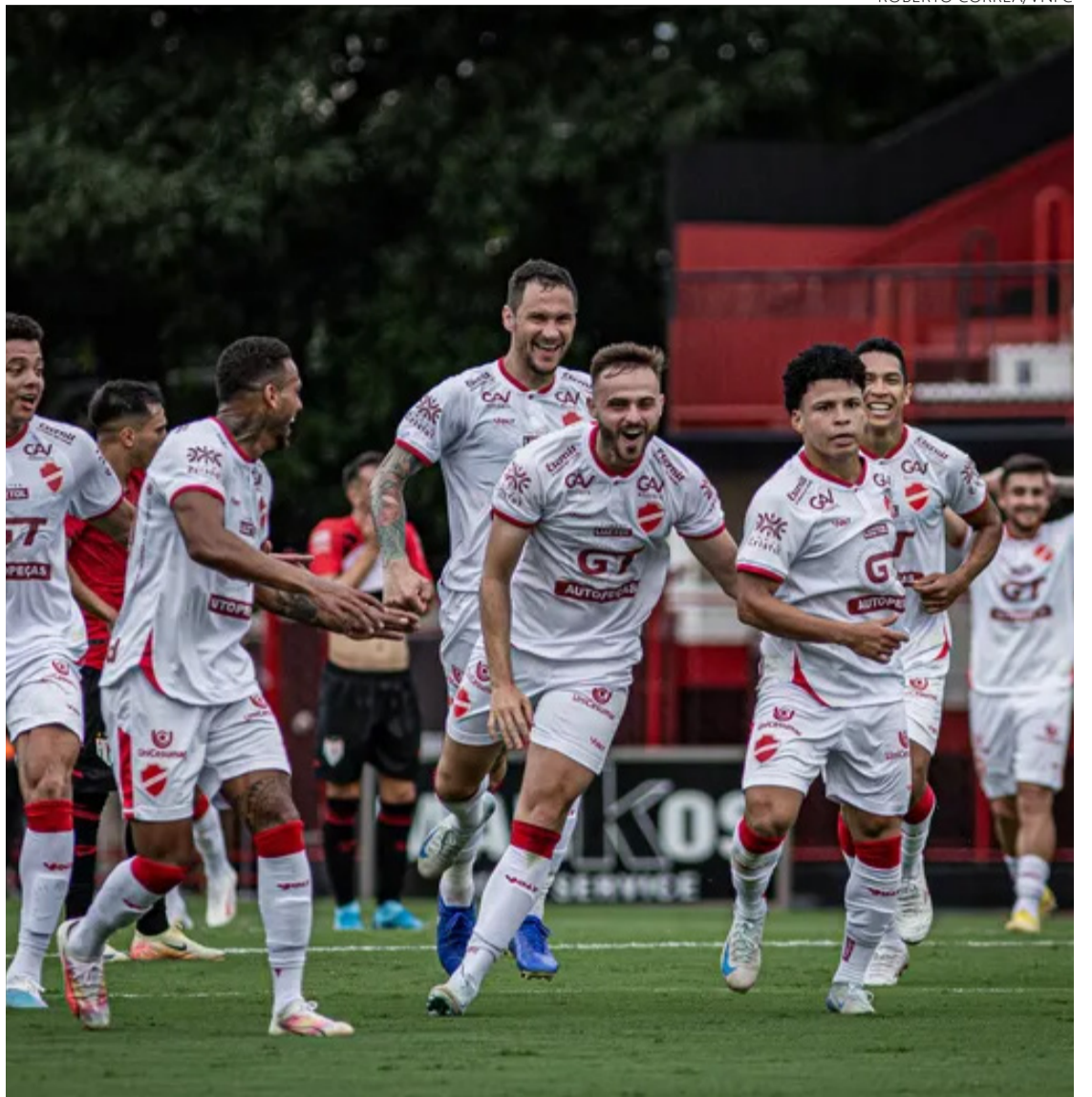
Jogadores do Vila Nova comemoram gol na vitória de 3 x 1 sobre o Atlético-GO no Accioly