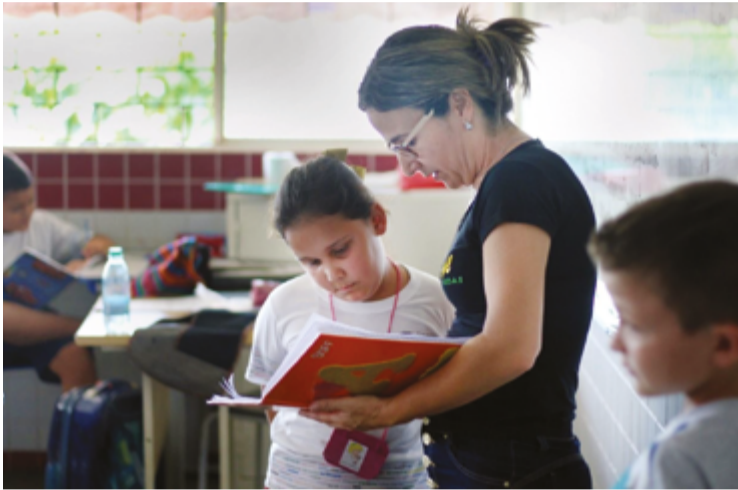
Professores da rede municipal de ensino terão reajuste a partir do próximo mês e ainda negociam retroativo

Valor é de 6,27%, a partir do próximo mês. Prefeito diz que depois discutirá retroativo ao mês de janeiro para a categoria