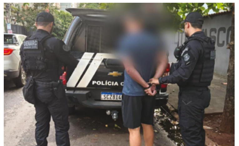
Mandados foram cumpridos também em Goiânia e no Distrito Federal em megaoperação da PCGO

Em nota, a Goinfra afirmou que as suspeitas foram levantadas pelo próprio governo estadual, por meio de sistema de controle, e diz que a gestão estadual "tem como premissa tolerância zero com qualquer eventual desvio de conduta no trato com dinheiro público."