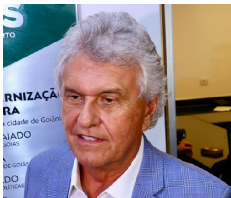
Ronaldo Caiado, governador de Goiás, entregará também 224 chromebooks para estudantes

O governador também visitará as obras do Projeto Mercado, uma iniciativa do Goiás Social em parceria com a Secretaria de Estado de Indústria, Comércio e Serviços (SIC). O projeto, com aporte de R$ 250 milhões provenientes do Fundo de Proteção Social do Estado (Protege), visa impulsionar a economia do Entorno do Distrito Federal. Águas Lindas será a primeira de cinco cidades a receber o empreendimento, com inauguração prevista para março.