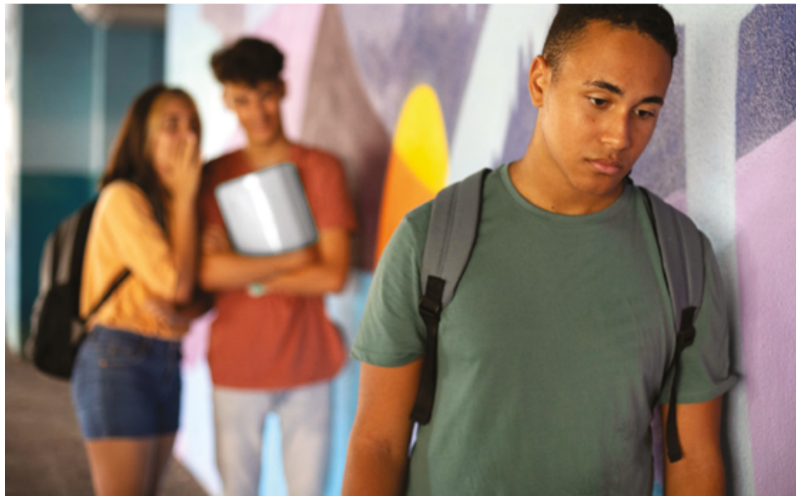
Casos de bullying nas escolas são cada vez mais recorrentes, e ele deixa marcas para a vida

As principais motivações para provocações nas escolas, segundo a PeNSE, estão ligadas à aparência física. Cerca de 16,5% dos casos envolvem o cor-