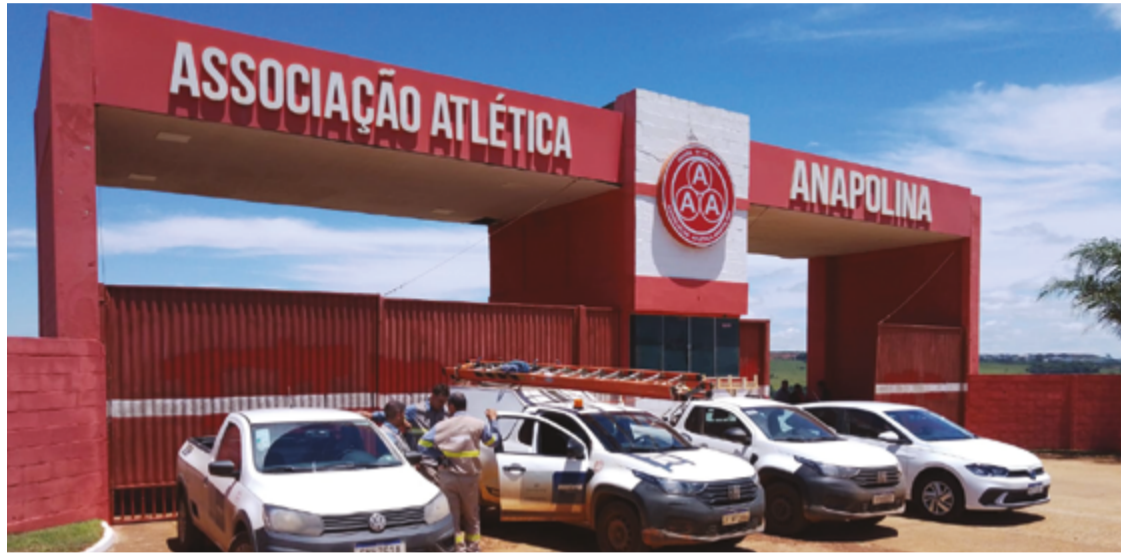
Equatorial esteve no CT Leandro Ribeiro acompanhada pelas Polícias Civil e Científica

"Quando há esse tipo de prática, a pessoa é obrigada a pagar o valor que deixou de ser cobrado na fatura", explicou a Equatorial Goiás. A empresa esclareceu que, ao ser constatado o furto, o cliente deve arcar com a dívida, mas a questão não segue como um processo criminal diretamente com a concessionária. "O processo é judicial, e a justiça vai determinar em quantas vezes e de que forma o valor deverá ser pago", detalhou a empresa. Em relação à suspensão da energia, "não há impedimento para o cliente regularizar sua situação", disse a Equatorial.