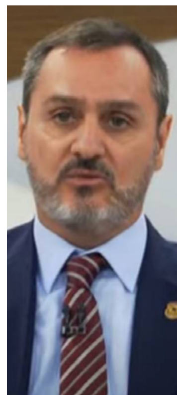
Andrei Rodrigues: investigação da PF sobre suposta trama golpista

No final de 2024, a PF concluiu a investigação sobre suposta trama golpista no governo Bolsonaro e indiciou o ex-presidente e outras 39 pessoas.