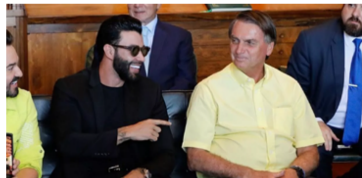
Gustavo Lima e Jair Bolsonaro: desencontros políticos