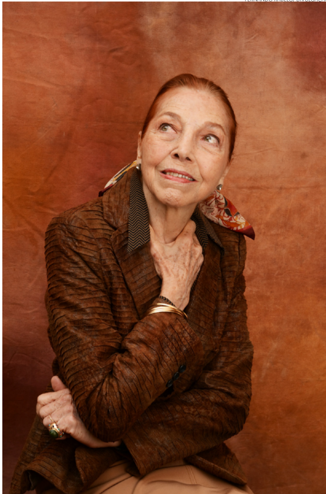
Respeitadíssima: autora se tornou referência em literatura infantojuvenil